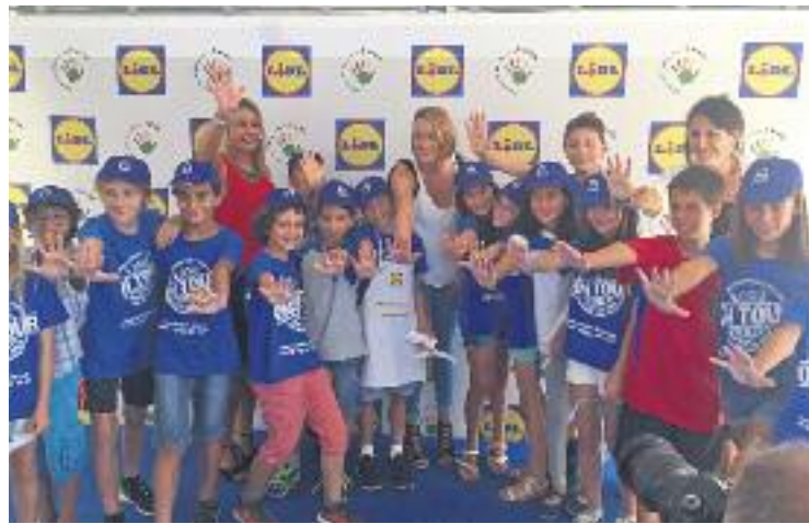
Un moment de l'acte publicitari a Barcelona.

La badalonina, que ha pogut gaudir d'uns dies a la ciutat amb la seva família, està aprofitant aquests dies per complir amb els seus patrocinadors, però malgrat que ha abaixat la intensitat de les seves càrregues de treball, encara passa estones a la piscina. "Con-