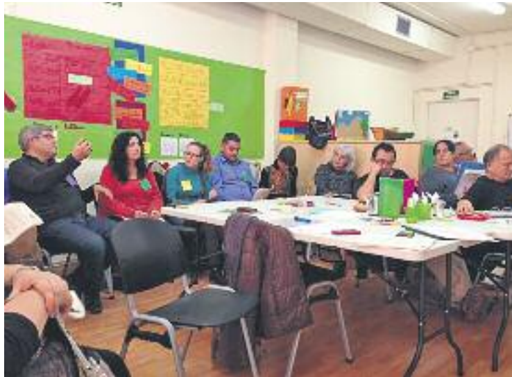
Les jornades es van celebrar per primer cop l'any passat.

Segons López, una de les causes de l'escassa oferta cultural a Llefià és la manca d'equipaments al barri. "Tenim entitats de cultura popular, dansa, música o pintura, però