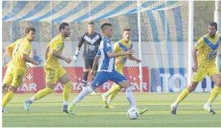
Els escapulats continuen invictes a la lliga.

Els escapulats van aprofitar la inèrcia positiva del final del primer temps i al minut 6 de la represa Agudo li va pispar la cartera a Llu-