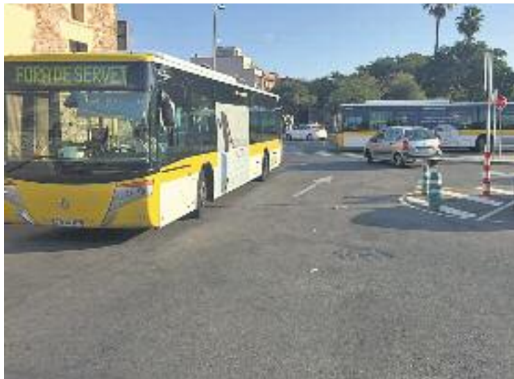
La comarca es veu afectada per la vaga de Nitbus.

D'altra banda, avui, el 21 i el 23 de setembre les aturades seran a partir de la mitjanit i afectaran el servei de Nitbus. De fet, les aturades nocturnes són les que afecten directament el Barcelonès Nord, ja que durant aquesta franja horària el servei ofert per Mohn és l'única alternativa de transport públic que connecta la comarca amb el Baix Llobregat, inclòs l'aeroport del Prat.