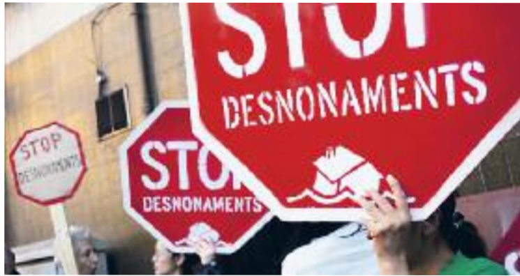
Després de l'estiu, la ciutat s'enfronta a l'emergència habitacional.

Així doncs, després d'una treva durant l'agost -els jutjats fan vacances- a la tardor la ciutat tornarà a topar de ple amb la situació d'emergència habitacional. I és que els casos dels quals informa la PAH podrien no ser els únics previstos a Santa Coloma, ja que la plataforma només té constància dels avisos de desnonaments quan