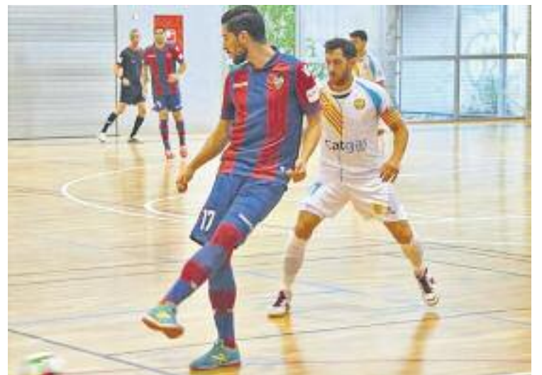
Un moment del partit contra el Levante a Teià.

L'equip ha continuat entrenant durant la setmana i demà passat repetirà amistós contra un Primera, el Penyíscola. El matx contra els castellonencs es jugarà a Montmeló.