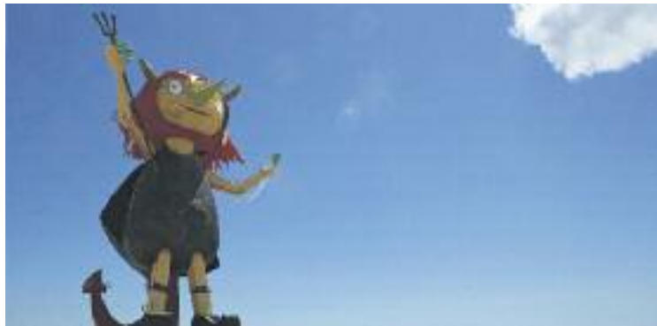
Les Festes del Dimoni podrien experimentar canvis el 2017.

Per fer-ho, iniciaran un procés que començarà dissabte a la Masia de Can Banyadó amb l'acte Reinventem les festes . Durant tot el dia s'analitzarà el model actual de festes i es coneixeran experiències d'altres ciutats. Tot plegat, organitzat en tres eixos. Per començar, s'abordarà la innovació, a través de l'experiència d'Igualada i Mataró. D'altra banda, es comptarà amb representants de la