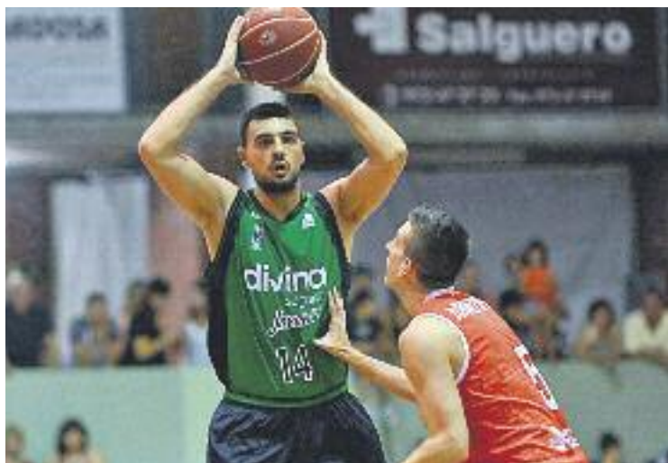
Un moment del darrer partit contra el Manresa.

Abans de viatjar cap a la Vall d'Aran l'equip va aconseguir la primera victòria de la pretemporada.