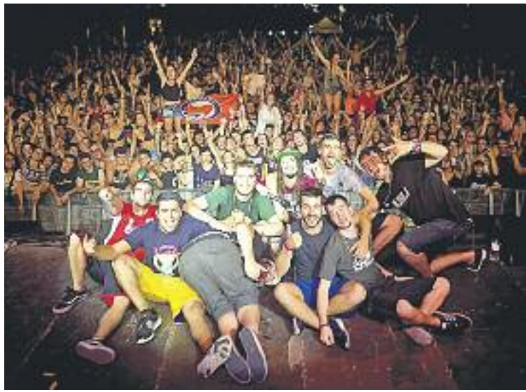
El grup Auxili actuarà dissabte a la zona poliesportiva.

D'altra banda, a les vuit del vespre començarà el correfoc, en