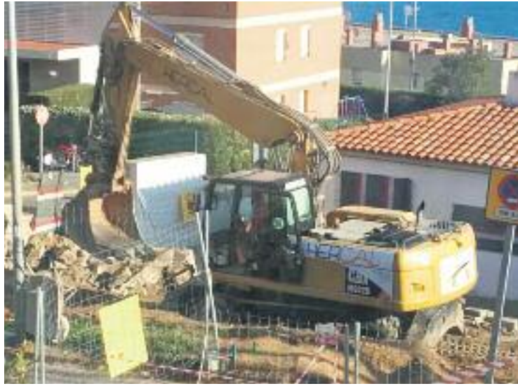
Les obres han durat set mesos.

Totes aquestes obres han tingut un cost final de 598.297 euros, mentre que se n'han destinat