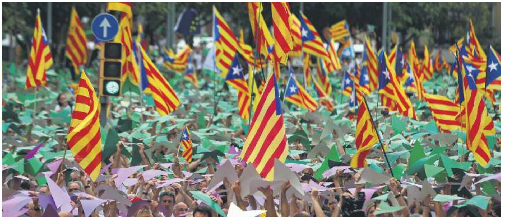
L'ANC i Òmnium esperen repetir l'èxit de la manifestació de l'any passat.