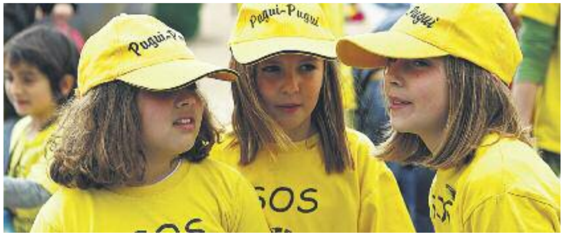
Les mobilitzacions tornen a protagonitzar l'inici del curs escolar.

Les reclamacions, però, no s'acaben aquí. La Fampas de Badalona anuncia que aquest any estudiarà en profunditat les places per a alumnes amb necessitats educatives especials que ofereix la Generalitat. "Ja sabem que no són su-