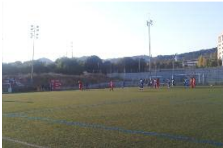
El Bada ha encarrilat l'eliminàtoria.

Els penedesencs insistien, però la pólvora era badalonina i quan el rellotge marcava el minut 30 Canelada va duplicar la renda de l'equip. La diana del lateral esquerre va ser l'última acció perillosa per part dels dos equips abans del descans.