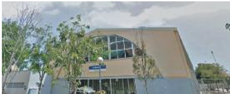
El 2014 es va detectar legionel·la a les dutxes del pavelló de Bufalà.

Un incompliment que s'hauria produït el 2014, durant el mandat del PP, quan la Secretaria de Salut Pública del Departament de Salut va detectar legionel·la a l'equipament esportiu. La Generalitat considera que l'Ajuntament va cometre dues infraccions greus, ja que posteriorment -i malgrat els requeriments- les instal·lacions van continuar obertes i funcionant amb normalitat. En aquest sentit, la Generalitat considera que el consistori va cometre irregularitats per manca de