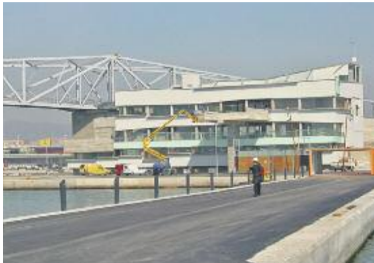
Les obres de construcció de l'establiment ja han començat.

Tot i que el port se situa al terme municipal adrianenc, l'adjudicació de la infraestructura es va dur a terme des de l'Ajuntament de Barcelona fa més de deu anys. Això sí, les llicències d'activitat són competència de Sant Adrià. "El projecte del Café del