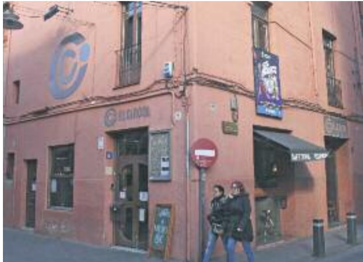
L'entitat comença el primer curs com a propietària de la seva seu.

Aleshores, la junta ja va assegurar que no tindria problemes per tornar-lo i que el pagament no comprometria la viabilitat econòmica de l'entitat.