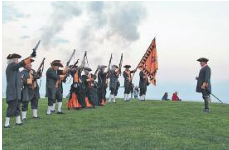
Montgat 1705 recrea l'arribada del general Moragues al poble.

Dissabte a dos quarts de nou del vespre, veïns i entitats de Montgat recrearan aquest episodi històric a la base del Turó de Montgat i a la platja de les Barques, per recordar l'arribada de les forces aliades i també del general Moragues. L'acte Montgat 1705 també inclourà la projecció d'un