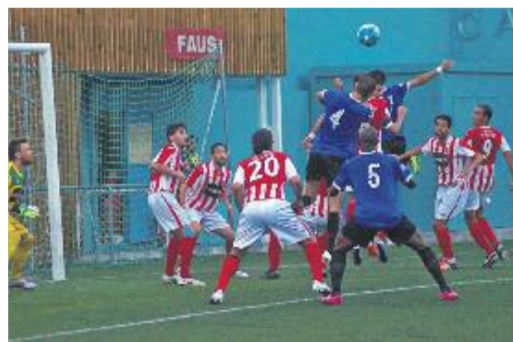
L'equip va donar una bona imatge malgrat la derrota.

L'Hermes tindrà la segona oportunitat per començar a sumar demà passat a les 6 de la tarda, quan l'equip visitarà el municipal del CE Farners.