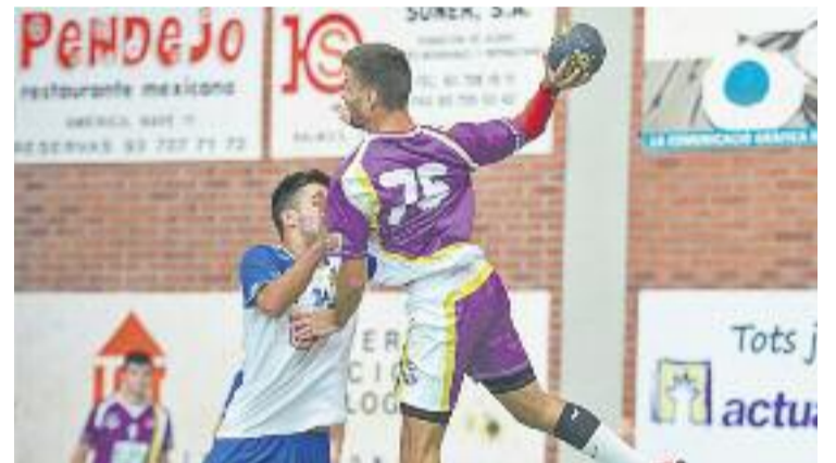
Els liles han començat la temporada guanyant una copa.