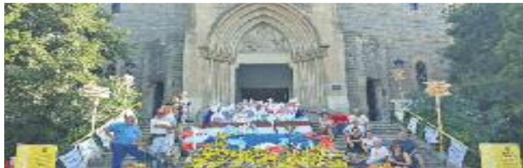
GAS va protagonitzar una acció reivindicativa davant l'Església Major.

Les jornades seran una oportunitat per difondre la misèria que milions de persones viuen quan arriben -les que ho aconseguen- a Europa fugint de la guerra. La difusió, precisament, és la principal aposta de GAS. "Durant