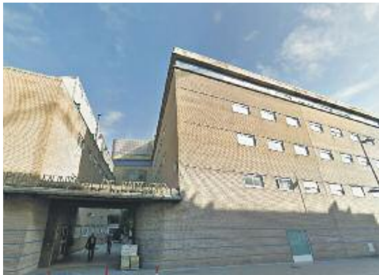
La Favbdn analitza les llistes a centres d'atenció primària i hospitals.

En els últims mesos, les associacions de veïns integrants de la federació han intensificat la recollida d'informació als barris i a finals de mes la Favbdn co-