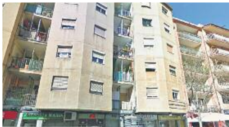
La baralla va tenir lloc en un pis del carrer d'Irlanda.

Precisament, a causa d'aquestes ferides, l'home va haver de ser traslladat a un hospital on s'hi va estar fins dilluns. Un cop va rebre l'altra mèdica, els Mossos van procedir a la seva detenció, per la presumpta implicació en la baralla que va acabar amb dos morts. Ara, la policia està investigant la possible relació del detingut amb