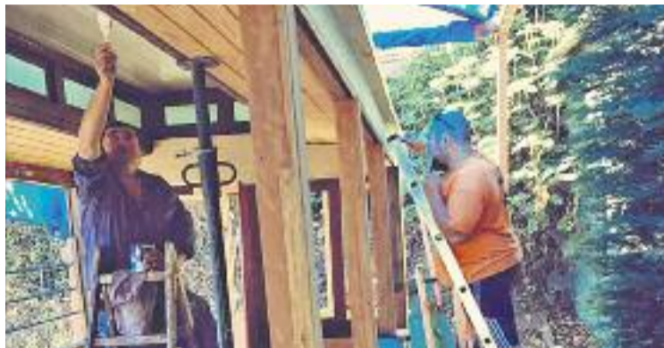
Diversos voluntaris han treballat per restaurar el vagó.

Des del 2011 es donava per fet que durant aquesta Festa Major el tramvia quedaria exposat al costat de l'Avinguda Isaac Albéniz, a dalt del doble revolt, però l'Ajuntament justifica el canvi de plans per diverses raons. En primer lloc, les tasques de restauració no estan acabades, mentre que tampoc s'ha executat cap obra que garanteixi la protecció del vagó un