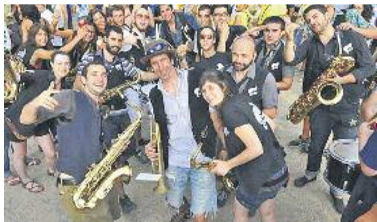
La Banda Patilla animarà la Descorxada.

De cara a diumenge, els actes institucionals de la Diada a la Creu de Terme seran els protagonistes del programa de Festa Major. D'altra banda, el parc del doctor Barraquer acollirà el concurs de paelles a partir de les onze del matí.