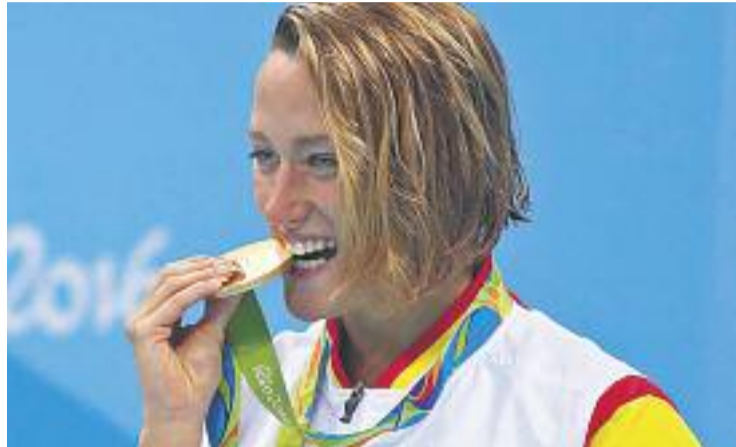
Belmonte, després de guanyar l'or als Jocs de Rio.

monte "per la seva llarga i exitosa trajectòria", de la mateixa manera que reconeix la tasca del preparador francès "pel seu paper rellevant en la consecució dels èxits de la nedadora".