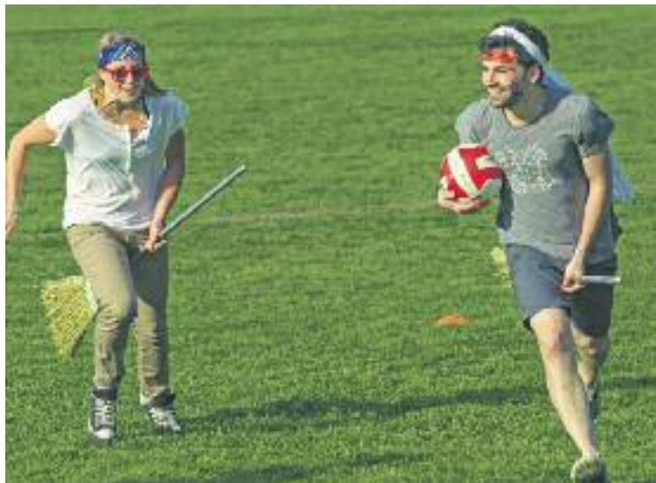
Les activitats tindran lloc des d'avui fins al diumenge.

D'una banda, el Correbans començarà a les 21 h i el seguirà un dels concerts més esperats, amb el grup Eskarnia , acom-