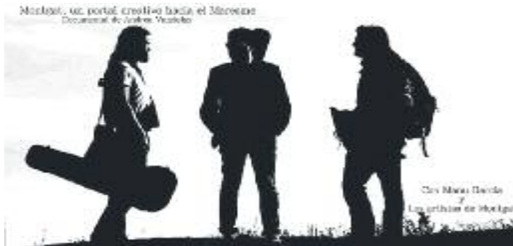
Vandelay va rebre el suport de Manu Garcia en tot moment.

El documental pretén mostrar els artistes de Montgat des de dins. En aquest sentit, la cinta enregistra el procés creatiu del projecte Montgat encanta, Montgat