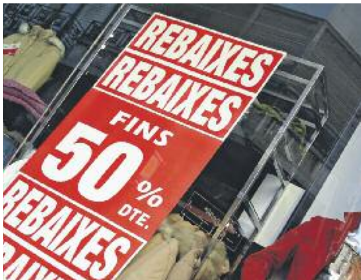
Els descomptes van arribar a la seva fi abans-d'ahir.