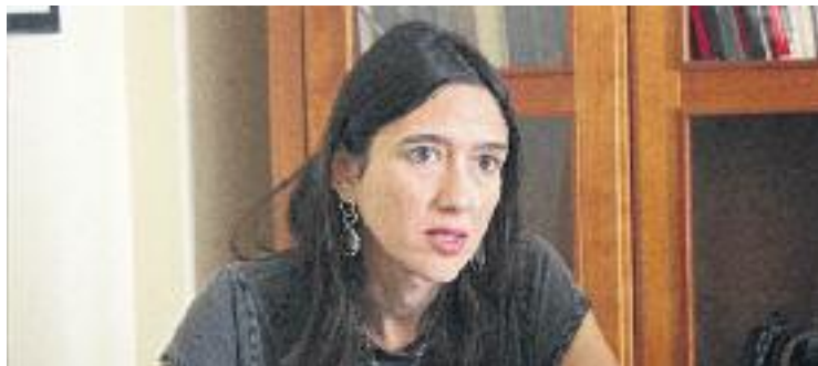
Parlon, en una imatge d'arxiu.

En aquest sentit, diversos mitjans asseguren que Parlon té decidit presentar la seva candidatura