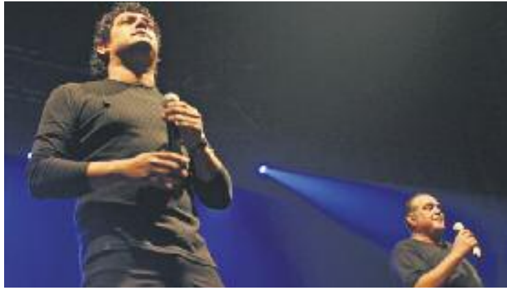
Los Chichos tocaran aquesta nit, acompanyats per Los Chochos.

Un dels fonaments d'aquesta edició de la Festa és la música. Aquest fet queda palès per l'elevat nombre de grups que figuren al cartell d'aquest any. Per una banda, aquesta nit, a les 23 h,