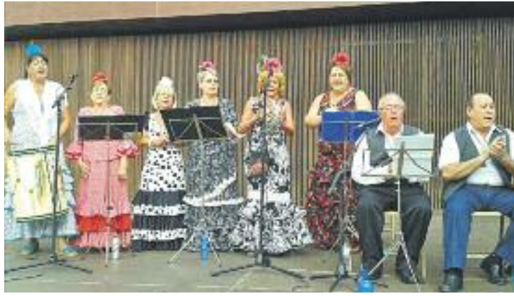
El Festival de Jotas repeteix edició dins del repertori tradicional.

A banda d'això, la Festa girarà entorn dels mateixos pilars que l'han sostingut els darrers anys, apostant per un ampli ventall d'activitats adreçades a totes les edats. Les més importants, són les conegudes Festa del Mar i Festa del Riu, el 10 i l'11