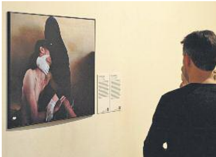
La foto guanyadora d'Aranda al World Press Photo l'any 2012.

Aranda va iniciar la seva carrera com a fotoperiodista a El Periódico i a El País , quan tenia 19