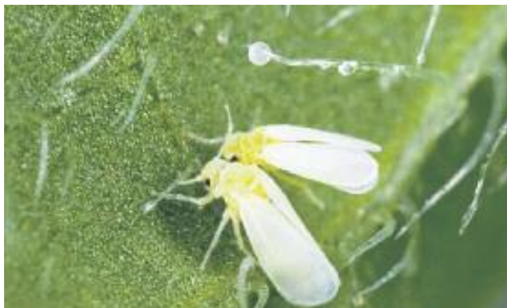
Es recomana enterrar les plantes que ja estan afectades.

L'Ajuntament assegura que ha gestionat l'alerta des que van rebre el primer avís per part dels veïns. En aquest sentit, es va enviar una mostra de l'insecte al Departament d'Agricultura, Ramaderia, Pesca i Alimentació, per a confirmar de quin insecte es tractava. Un cop analitzada la mostra,