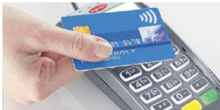
El pagament 'contactless' està augmentant cada dia més.

El pagament sense contacte de la targeta amb el datàfon o TPV, el famós contactless , també ha experimentat un increment del seu ús, segons l'informe. Gairebé la meitat de les botigues ofereixen aquesta tecnologia, una pujada de 21 punts percentuals respecte de l'any 2013.