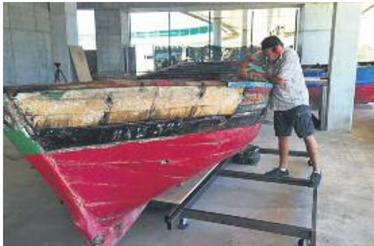
Les barques seran restaurades durant un mes.

Els treballs de rehabilitació inclouen la retirada de les estructures exteriors de ferro, així com de tots els claus i cargols, i l'eli-