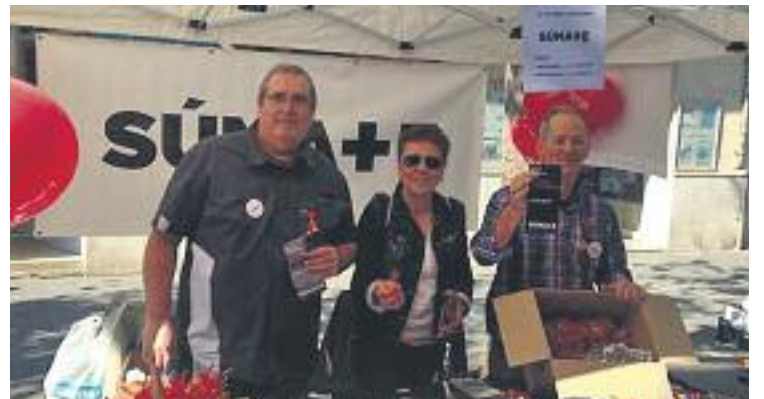
Les entitats sobiranistes de la comarca aposten per ser presents als barris i propagar el discurs independentista de forma molt propera.