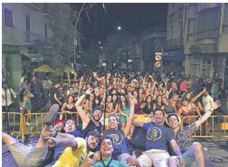
Els Caipirinhas Rumberus tancaran el Festival Polisons.

Però a la Rambleta no només s'hi farà música, sinó també diverses activitats dedicades als joves. En aquest sentit, el dia 9 a la Rambleta s'hi farà una gimcana, a la qual els joves que ho vulguin s'hi podran inscriure el mateix dia.