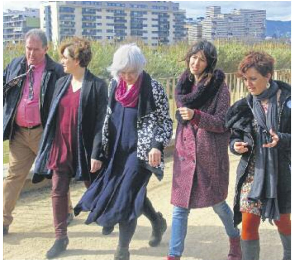
Badalona i la Generalitat ja s'han reunit en el marc de la comissió mixta (esquerra), mentre només falten uns serrells per a l'adhesió al Consorci del Besòs (dreta).