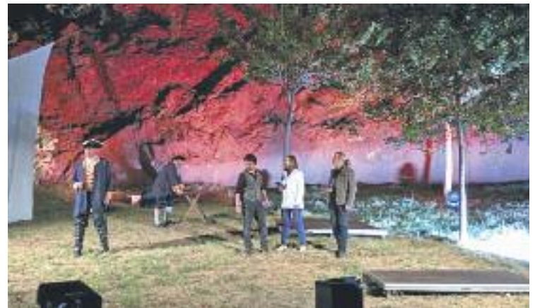
Teatralització del desembarcament.

A banda de l'aspecte més purament històric, la festa ofereix una fira comercial ambientada en aquella època i concerts de música en directe.