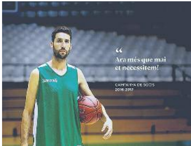
El club torna a fer una crida a l'afició.

El badaloní afegeix que “el que més recordo, el que més em posa la pell de gallina sou vosaltres, l'Olimpíic animant” i fa la crida a l'afició assegurant que ara més que mai el club i l'equip necessiten l'afició. Per tal d'acompanyar la campanya, el club ha creat l'etiqueta #MíticaPenya per donar-li encara més ressò a través de les xarxes socials. Al lloc web de la