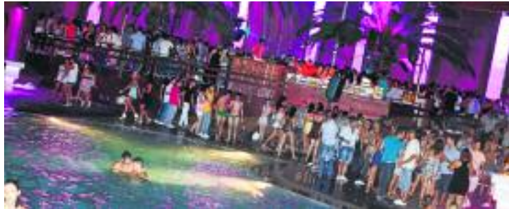
Els terrenys van deixar de funcionar com a zona d'oci el 2014.

Per la seva banda, el Consell Comarcal interpreta l'entrega de claus com una renúncia d'Innovaciones Calem a la concessió dels terrenys i instal·lacions, així com a la possibilitat de desenvolupar-hi les activitats lúdiques i recreatives que li corresponien. La qüestió es va abordar al Ple d'ahir