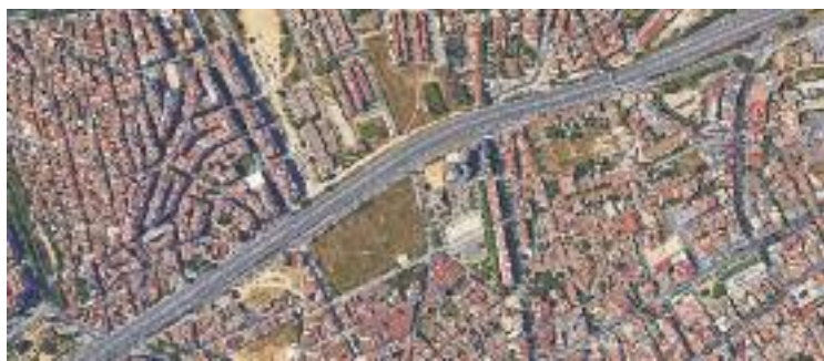
Part del tram de la C-31 al seu pas per Badalona.

La licitació del projecte és una bona notícia per a la ciutat, ja que la reforma d'aquesta autopista és un dels eixos centrals de l'agenda política de Badalona. La futura actuació en aquesta via permetrà reasfaltar tot aquest tram, que comença a Sant Adrià de Besòs i acaba a Montgat. El nou paviment serà de tipus fonoreductor, cosa que permetrà disminuir l'impacte acústic que provoquen els vehicles. Ara bé, per ara no s'hi col·locaran pantalles per absorbir el soroll. També es faran millores