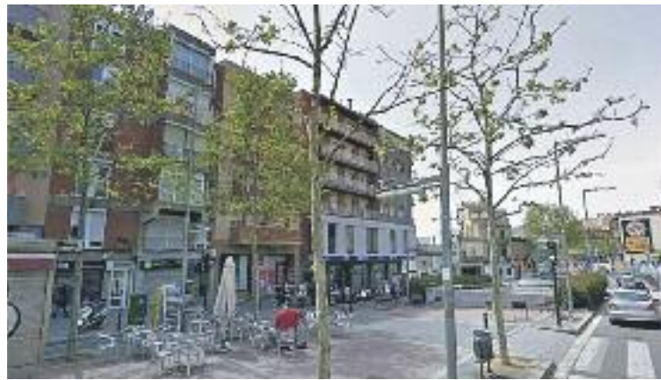
L'Ajuntament vol donar un estímul al comerç.

D'aquesta manera, les entitats esportives i de comerç, expliquen des de l'Ajuntament, seran les primeres que rebran part de les subvencions en moneda local. Aquestes mateixes fonts asseguren que els pagaments estaran "completament