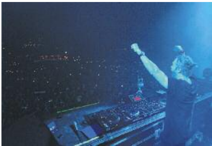
Actuació de David Guetta.

Un èxit que promet reeditar-se l'any que ve, ja que l'organització ja ha venut 3.000 entrades per a la nova edició del festival.