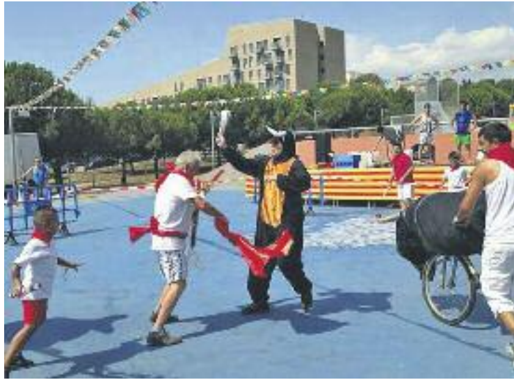
Els tradicionals correbous montgatins.

L'endemà dissabte serà el torn dels jocs tradicionals per als infants, a partir de les 6 de la tarda a la plaça Sant Jaume. A dos quarts de 8 la Cobla de Premià protagonitzarà la tradicional ballada de sardanes al parc del Tramvia. El dia finalitzarà a les 11 amb l'actuació d'una orquestra que farà ballar els montgatins.