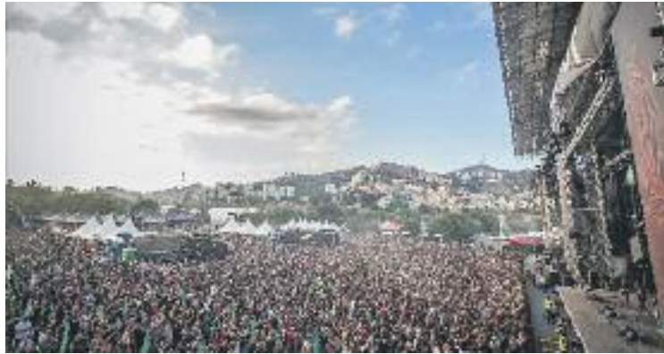
El tercer Rock Fest ha estat tot un èxit.

Alguns dels altres concerts més destacats al llarg dels tres dies de festival van ser els que van pro-