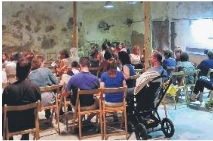
Can Riera ja ha acollit diverses activitats culturals.

D'altra banda, l'Ajuntament no té clar quin serà l'ús definitiu de Can Riera, ni tampoc si la decisió se sotmetrà a un procés participatiu obert als veïns. Les obres de