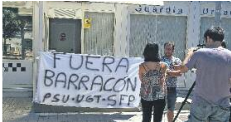
Els sindicats policials han demanat reiteradament la clausura.

Segons les mateixes fonts municipals, el consistori està esperant les conclusions de diversos informes fets per la Guàrdia Urbana, que avaluen el funcionament de la comissaria –instal·lada al barri des del 2012, durant el govern de Xavier Garcia Albiol– i que encara no se sap quan s'enllestiran.