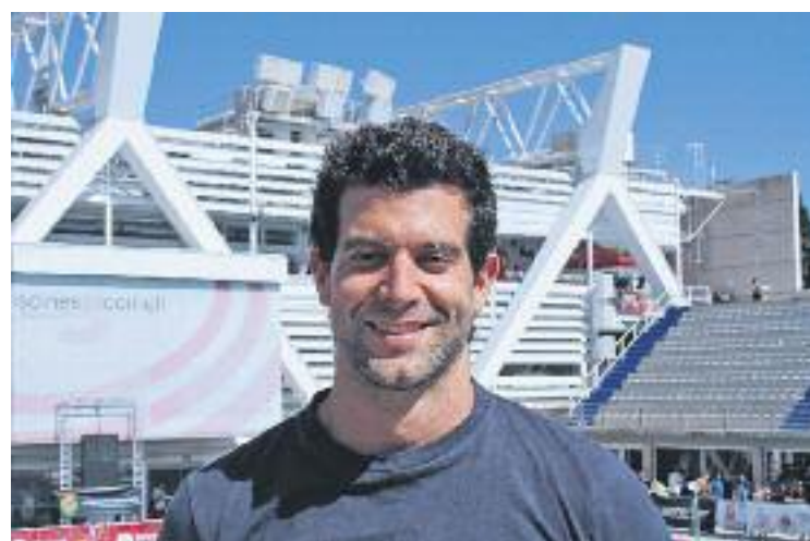
El colomenc es retira amb 28 anys.

Un cop va acabar la competició, Rando, visiblement emocionat, va donar les gràcies i va acomiadar-se dels que durant anys han estat els seus companys d'equip i de la selecció espanyola.