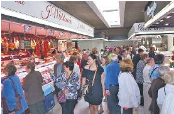
Els adrianencs van descobrir les parades del nou mercat.

També es va obrir el Mercadona de la primera planta, un espai de 1.400 metres quadrats que, segons el consistori, "complementa l'oferta d'aliments frescos del mercat. A més, l'Ajunta-