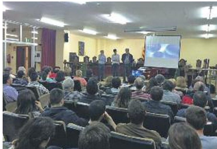
Reunió prèvia al recompte a Sant Adrià.

Pel que fa a l'evolució respecte del 2012, els cinc municipis han incrementat la seva renda per habitant i l'augment mitjà a la comarca és d'un 1,5%.