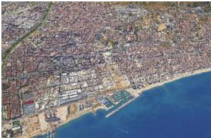
El Barcelonès Nord no és, ni de bon tros, homogeni.

D'altra banda, Tiana i Montgat viuen realitats completament oposades. En el cas de Montgat, la renda anual per habitant és de 18.800 euros. Per la seva banda, Tiana és el quart municipi més ric de Catalunya, ja que cada habitant