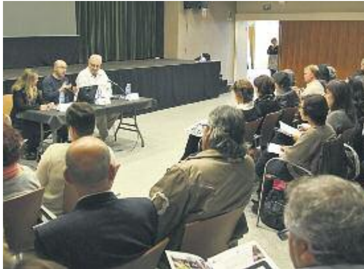
Imatge de les jornades d'ocupació del 2015.

En primer lloc, Arancha Ruiz, llicenciada en dret i màster en direcció d'empreses, abordarà la competitivitat de les empreses en el marc del mercat laboral actual. Concretament, Ruiz oferirà una xerrada focalitzada sobre el talent de les persones, el