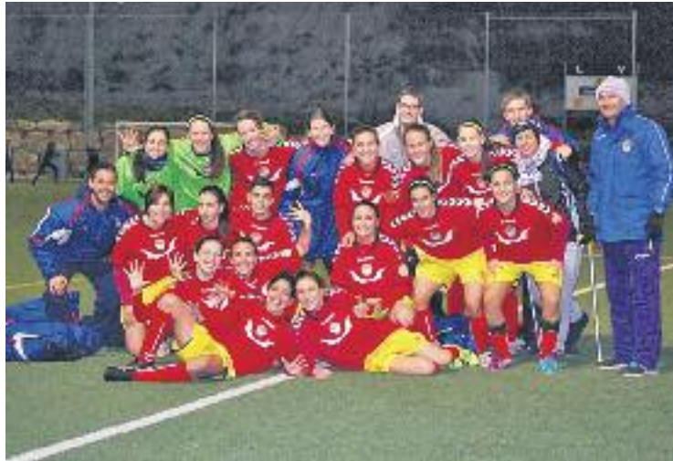
L'equip està preparat per seguir fent història.

L'alegria, però, va durar poc i novament Yosse, al minut 53, va avançar les badalonines. La sentència va arribar gairebé un quart d'hora més tard, gràcies a un gol d'Ana Cayuela, que feia