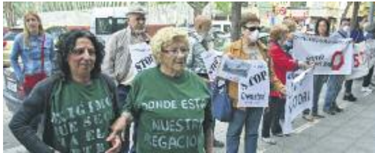
Els veïns esperaven així l'arribada de l'alcalde.