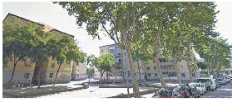
Les entitats denuncien que la fractura digital provoca exclusió social.

En aquest sentit, exposen que la velocitat de connexió dels ordinadors instal·lats a les tres entitats oscil·la entre 1 i 3 Mb. Una situació que consideren greu, ja que per a molts veïns els ordinadors disponibles en aquestes entitats són l'única eina a través de la qual es poden connectar a Internet. "Movistar està perpetuant l'exclusió al