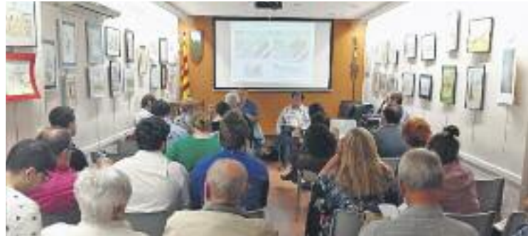
La plataforma va presentar l'informe en roda de premsa.

Ara, el pla ha tornat a escena després que la Plataforma en Defensa de la Serra Marina i Can Zam hagi fet públic l'informe de la Ge-