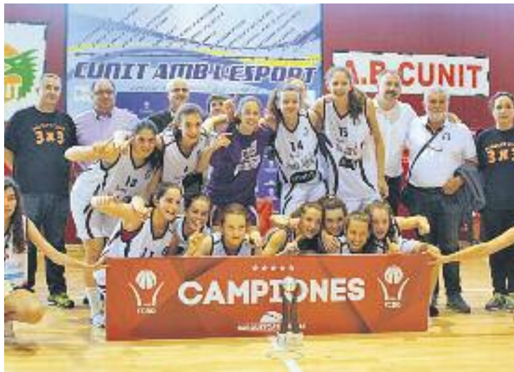
L'Snatt's va afegir un nou títol a les seves vitrines.

A més, l'equip cadet de les adrianenques es va classificar ahir per als quarts de final del campionat estatal de la categoria cadet després de derrotar ahir al migdia el Canoe Madrieny (68-40). L'equip començarà la fase final de la competició,