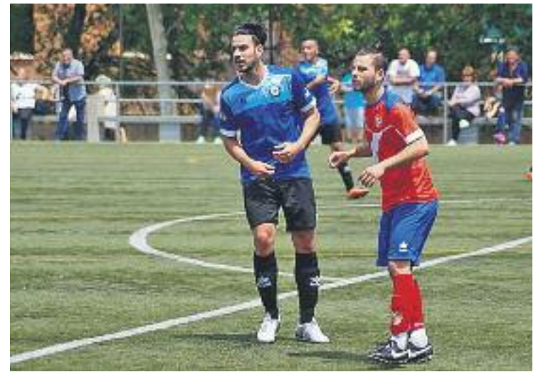
Badalonins i montgatins van empatar a tres.

Per últim, la Grama va sumar una victòria in extremis (la setena de la temporada) contra la Llàntia (1-0). Forzinetti va ser l'autor del gol de l'equip, que l'any que ve serà a Tercera catalana.