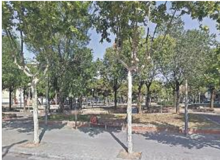
Una imatge d'arxiu de la plaça Roja de Sant Roc.