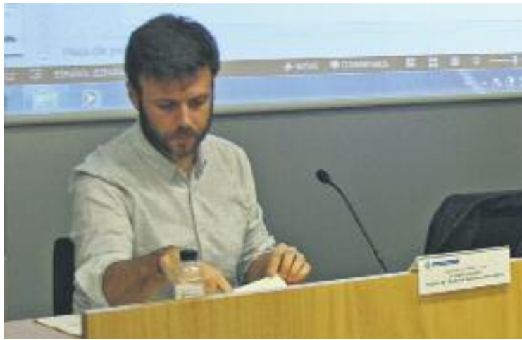
Téllez assegura que el consistori treballa per una millora salarial.

D'altra banda, l'assemblea també va acordar repartir un manifest de denúncia durant la celebració del pregó de les Festes de Maig, demà a la tarda a la plaça de la Vila. A més, els repre-