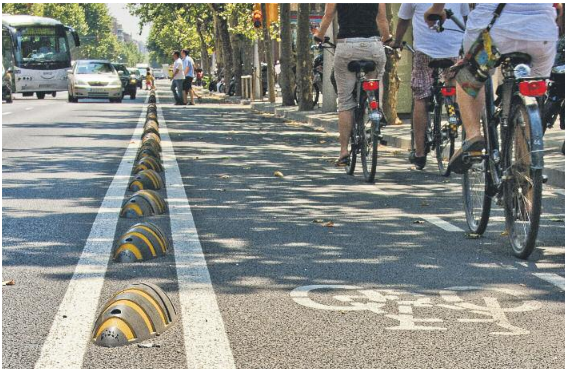
Un dels pilars principals de l'aposta per la mobilitat sostenible és la creació d'una gran xarxa de carrils bici a tota l'àrea metropolitana.