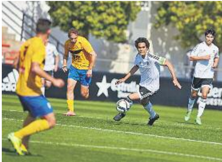
Els escapulats van perdre a l'Antonio Puchades de Paterna.