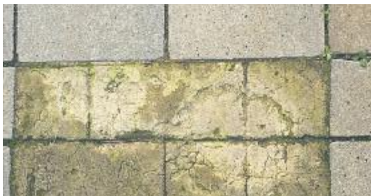
Les llambordes del carrer Església, en el focus de Ciutadans.

En el cas dels nacionalistes, les crítiques en qüestió són les que