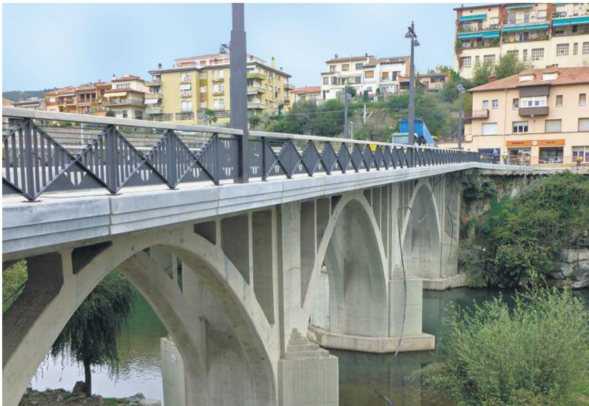
Durant l'anterior mandat, la Diputació va impulsar la reforma del pont de Sant Quirze de Besora, sobre el riu Ter.