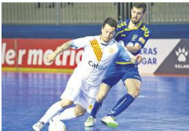
Els colomencs no van poder cloure la lliga amb una victòria.