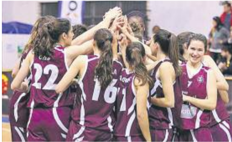
Les liles van quedar-se a les portes de l'ascens.