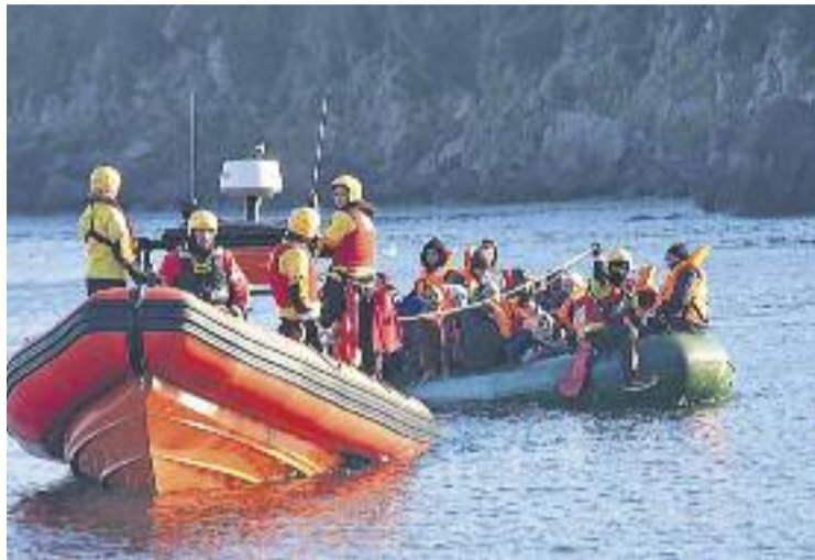
Proactiva ha salvat centenars de vides a les costes del mar Egeu.

En tot aquest temps, Proactiva ha salvat centenars de vides a les costes del mar Egeu. De moment ha treballat bàsicament a l'illa de Lesbos, però ara ampliarà el seu radi d'actuació fent tasques de salvament marítim a les costes de Líbia i Tunísia. "Estem molt agraïts a la gent que s'ha involucrat en el projecte i l'ha fet créixer", explica el coordinador de l'ONG,