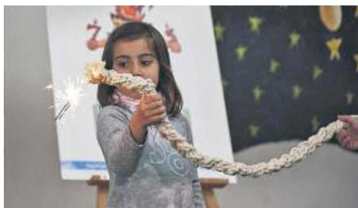
Ja està tot a punt per a la Cremada del Dimoni (esquerra), el pregó de Proactiva (a dalt a la dreta) i perquè els infants es facin seva la festa (a baix a la dreta).