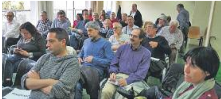
Onze associacions van participar en l'assemblea.

Una de les principals conclusions de la jornada és la voluntat de garantir l'aplicació de la llei d'emergència habitacional 24/2015, aprovada pel Parlament i que té com a objectius frenar els desnonaments i evitar casos de pobresa energètica. La FAVGRAM ha pres la decisió després que el govern espanyol en funcions del PP hagi presentat un recurs al Tribunal Constitucional per impugnar els articles de la normativa referents a la previsió de mesures de "segona oportunitat" per a les famílies endeutades, així com a la