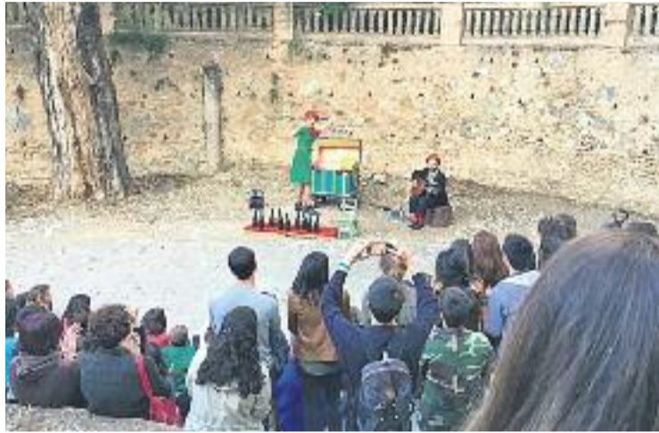
Unes 600 persones van perdre part en l'esdeveniment.

De fet, Molas reconeix que hi havia la possibilitat que el canvi de data provoqués una davallada de l'afluència de públic,