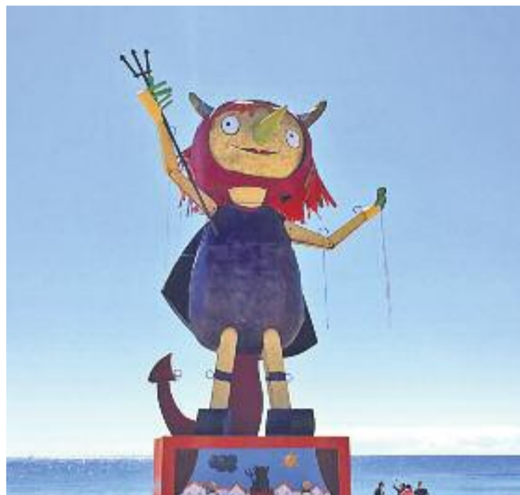
La Dimonieta Rebel fa dies que ja és a la platja.