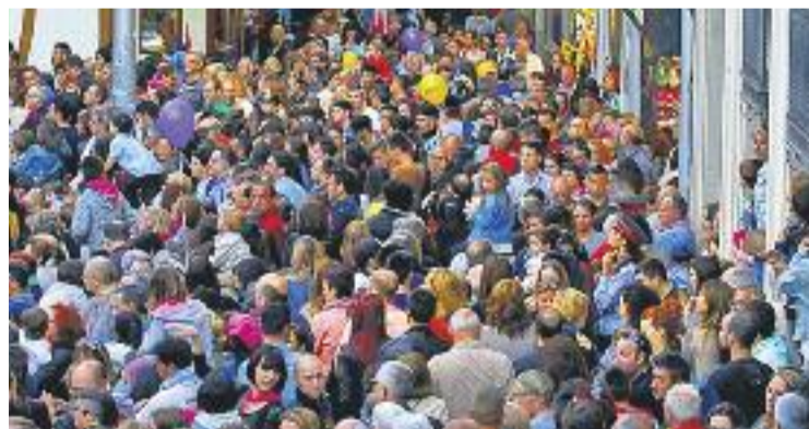
L'acte aplega un bon nombre de visitants cada any.

Des de dos quarts de nou del vespre i fins a la mitjanit, més de 150 botigues, bars i restaurants del centre obriran les seves portes als ciutadans perquè gaudeixin d'actuacions en viu, degustacions i comprin allò que necessitin. La nit "més reeixida" del comerç badaloní, segons assegura Cinto Gubern, president de Badacentre, s'emmarca en el programa de les Festes de Maig.