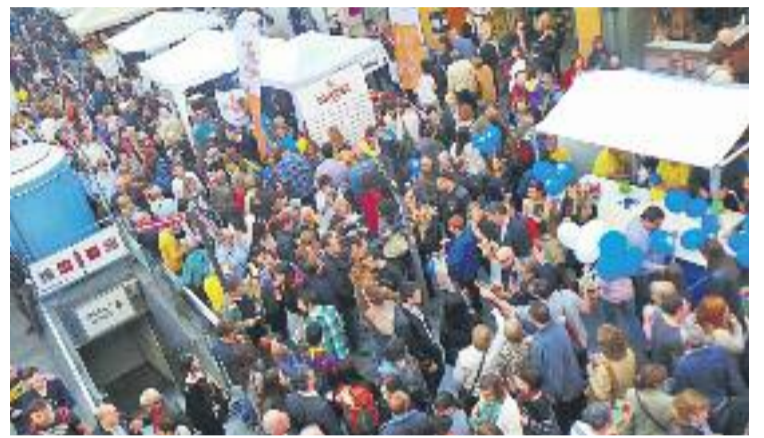
Sant Jordi tornarà a omplir de roses i llibres els carrers i les places d'arreu del país.