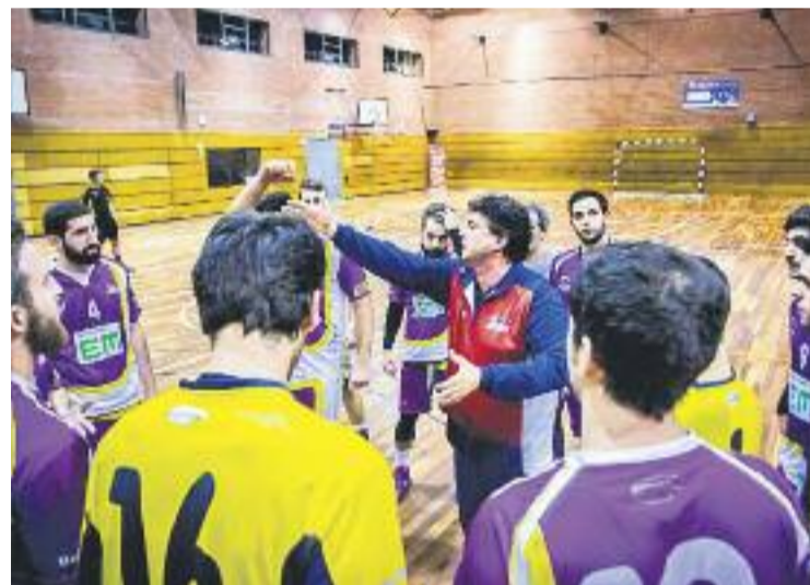
L'equip repetirà a la mateixa categoria el curs que ve.