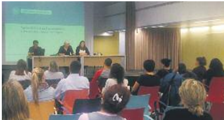
El govern va presentar el nou sistema al Centre Cívic de la Salut.