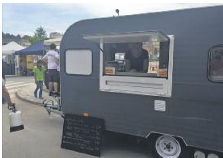
El food truck del Tresmacarrons participarà en la jornada.

concret, participaran quatre "joies" de la gastronomia, com són La Miqueleta del Tresmacarrons –impulsada pels cuiners Miquel Aldana i Núria Orra d'aquest restaurant del Masnou, recentment condecorat amb una Estrella Michelin–, Corazón de Agave –de cuina mexicana–, La Petite Roulotte –d'inspiració vintage– i Pepa Croqueta, que centra les seves creacions en aquest menjar tradicional.