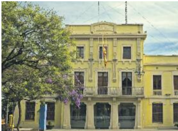
Volen estudiar com millorar la productivitat a l'Ajuntament.

Després de recollir les dades facilitades per la plantilla municipal, la IRH plantejarà una proposta de canvi d'horaris al consistori. De fet, el principal objectiu de la IRH és avançar els horaris dels àpats i de l'hora d'a-