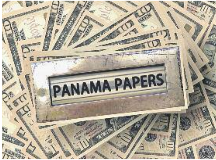
Els Papers de Panamà aporten nova informació sobre el cas Pretòria.

Segons El Confidencial, el procediment de Mora hauria consistit a utilitzar una xarxa d'empreses opaques a les illes de Niue, al sud del Pacífic i de l'illa portuguesa de Madeira. Concretament, els Papers de Panamà revelarien que aquest empresari hauria establert una xarxa de crèdit entre diferents