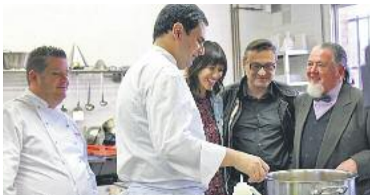
El projecte va ser presentat divendres a l'Escola de Restauració.