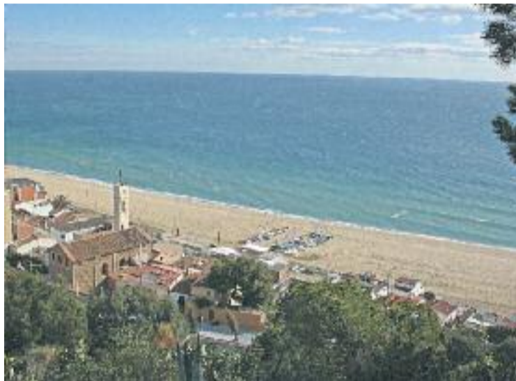
El consistori vol disposar dels màxims metres de platja possibles.

D'altra banda, Funtané posa l'accent en la perllongació del passeig marítim. "Com més extensió de passeig tinguem els municipis costaners, millor connectats estarem", argumenta l'alcaldeessa, que considera que el projecte podria habilitar noves zones per a l'oci i la pràctica esportiva dels veïns.