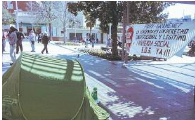
La PAH va acampar dilluns a la plaça de la Vila.

En aquest context, la PAH va convocar dilluns una acampada que va durar menys de mig dia. I és que poc després de plantar la primera tenda, representants de la plataforma van acompanyar la