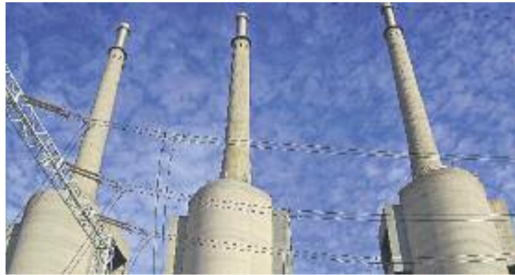
Endesa ha xifrat el manteniment en 400 mil euros anuals.

Les primeres estimacions assenyalaven que el manteniment suposaria una despesa anual de 400.000 euros i això convertia aquest aspecte en un dels princi-