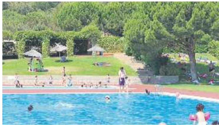
Una imatge d'arxiu de la piscina.