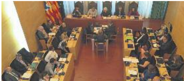
Una imatge del Ple celebrat ahir.

Aquests plans preveuen generar 30 llocs de treball per a un