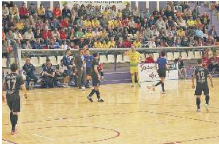
L'equip va sumar un punt a cinc minuts del final.

La segona part, però, va ser força diferent. Els andalusos van prémer l'accelerador i a poc