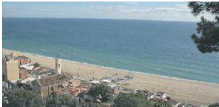
El Barcelonès Nord podria tenir més metres de platja.

El titular d'aquests terrenys és l'Àrea Metropolitana de Barcelona, amb qui Mañas ja ha manifestat la voluntat de reunir-se. Més enllà de la seva recuperació com a platja, el terreny també requerirà un procés de desconta-