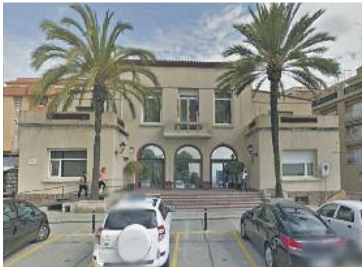
Una imatge d'arxiu de l'Ajuntament.

En un comunicat, l'executiu afegeix que el pressupost de 2014 no estava comptabilitzat. "A més, hi havia manca de regularització de factures i pagaments no efectuats a proveïdors del consistori", recull el text. Uns impagaments que el govern de Funtané xifra en tres milions d'euros i que assegura haver solucionat en només quatre mesos.