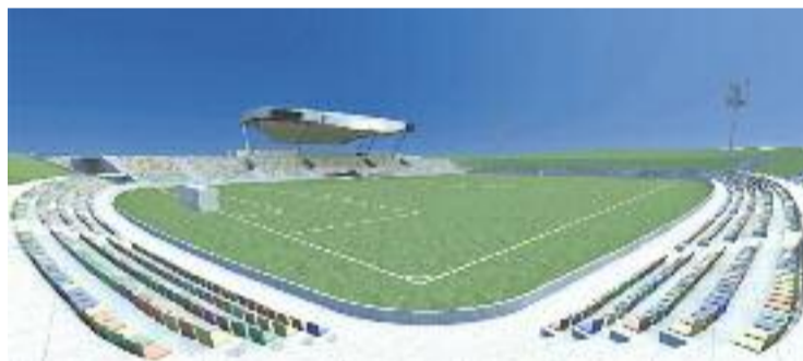
El govern veu "improbable" enllestir el nou estadi abans del 2017.

URBANISME ▶ El futur del nou estadi municipal continua sent motiu de disputa entre l'Ajuntament i el CF Badalona. De fet, sembla que les dues parts es resisteixen a dibuixar un escenari compartit. Durant el Ple extraordinari que va abordar el desenvolupament de la instal·lació celebrat el 6 d'abril, el regidor d'Urbanisme, Oriol Lladó, va avisar que veia "improbable" que l'estadi estigués llest abans del gener de 2017.