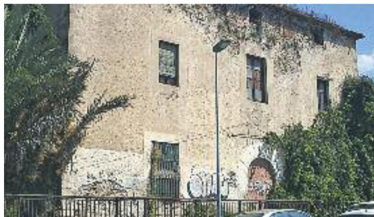
La masia data del segle XV.

Enguany, doncs, el certamen tindrà un vessant reivindicatiu, ja que s'afegirà a la campanya local per salvar la masia de Ca l'Andal perquè sigui rehabilitada i reaprofitada com a equipament.