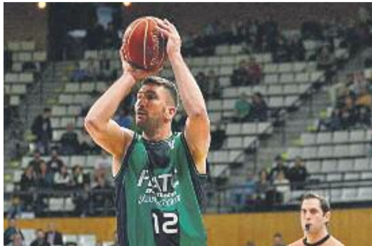
El croat va fer una de les seves millors actuacions amb l'equip.

La igualtat es va mantenir després del descans, però el pivot visitant Brown va carregar-se amb la quarta falta ràpidament i