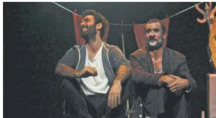
La Companyia LePuant protagonitzarà Tot sol... i núvol .

Totes les funcions es repetiran en el mateix ordre a la tarda. A les vuit del vespre el festival acabarà amb un espectacle d'improvvisació i un col·loqui amb els actors i organitzadors de la iniciativa.