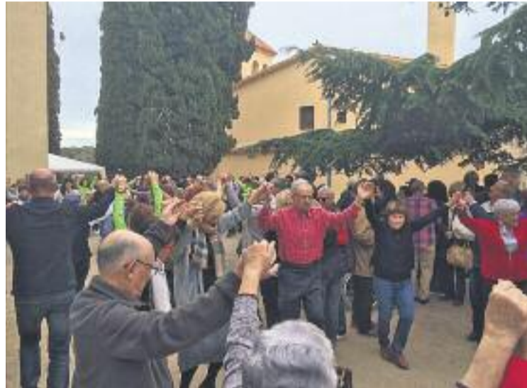
La ballada de sardanes va ser un dels moments més emotius.

A les 10 del matí l'esplanada de l'ermita va començar a rebre els visitants, que es van aplegar dins la petita església per celebrar la tradicional missa. "Moltes persones no hi participen, però en un moment o altre saluden la Mare