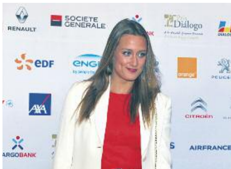
Els de Rio seran els tercers Jocs de la badalonina.

Belmonte competirà en 200 estils, 200 papallona, 400 estils i