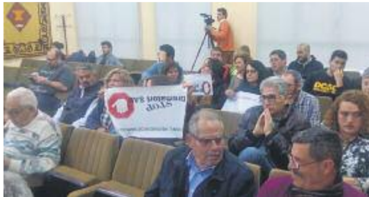
Alguns dels assistents al Ple van mostrar cartells contra el crematori.

El crematori està projectat dins el complex funerari que s'ha d'ubicar en uns terrenys de 10.000 metres quadrats, propietat de l'Ajuntament i el Consell Comarcal. El projecte va ser adjudicat a la unió temporal d'empreses Tanatori del Litoral l'últim trimestre de 2015. Tot i això, l'administració encara ha d'entregar la llicència d'o-