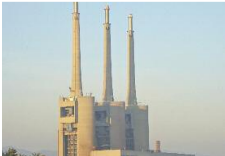
La mort de Fernández va convertir les Xemeneies en símbol obrerista.