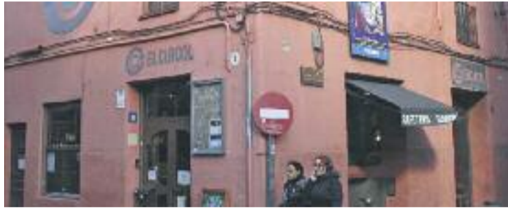
Vértice Ensanche insisteix en l'oferta de cessió d'espai a l'entitat.

En aquest sentit, la junta directiva de l'entitat continua a l'espera que dues entitats bancàries -de les quals prefereixen no re-