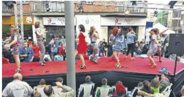
Una imatge de la desfilada de primavera de l'any passat.

l'ACI no vol ser simplement un espectacle de moda i complements, ja que estan previstes tot un seguit d'activitats per dinamitzar una jornada que arrencarà cap a les 11 del matí i clourà a les 3 de la tarda.