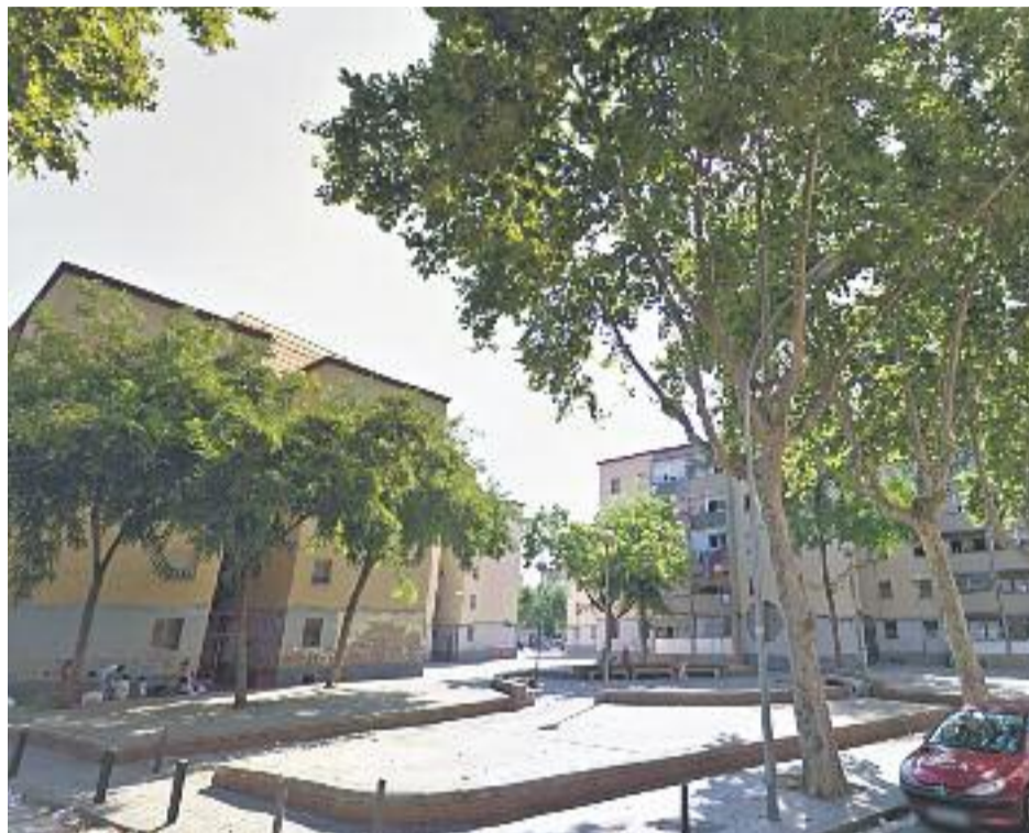
La Mina (esquerra) i Sant Roc (dreta) continuen vivint dies convulsos.