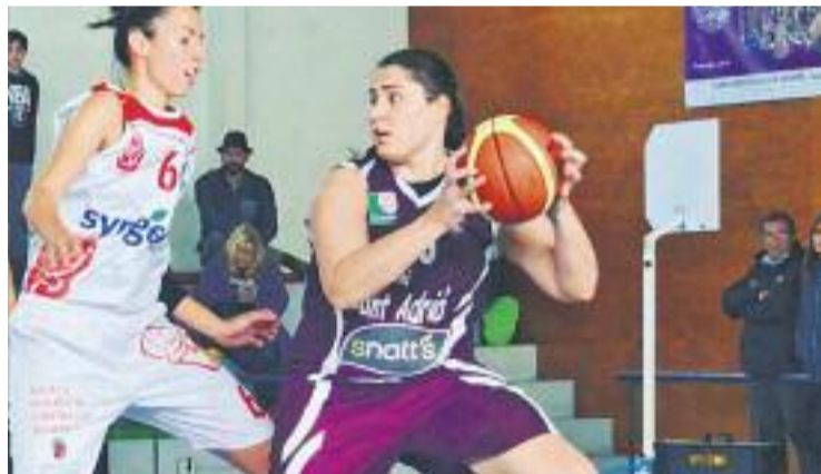
L'equip és a una victòria de garantir-se lluitar per l'ascens.

SANT ADRIÀ ▶ El somni de l'Snatt's Sant Adrià és a tocar. L'equip és a només una victòria de certificar matemàticament la seva presència al play-off d'ascens a la màxima categoria del bàsquet estatal.