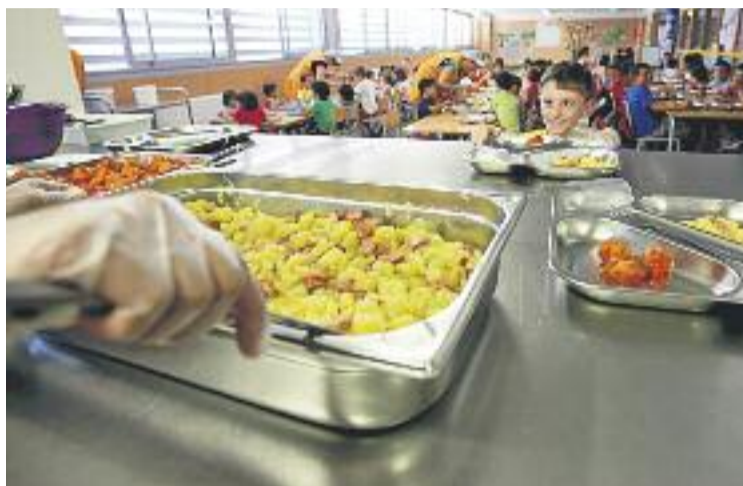
Les famílies poden demanar ajuts per al menjador escolar.

En aquest sentit, les sol·licituds d'ajudes presentades a l'Ajuntament poden ser referents al pagament de les quotes de l'escola bressol, al cost del menjador escolar, al material escolar, així com a sortides escolars, activitats extraescolars o al casal d'estiu. Així doncs, més enllà de cobrir les necessitats econòmiques de les famílies, els ajuts també tenen la vo-