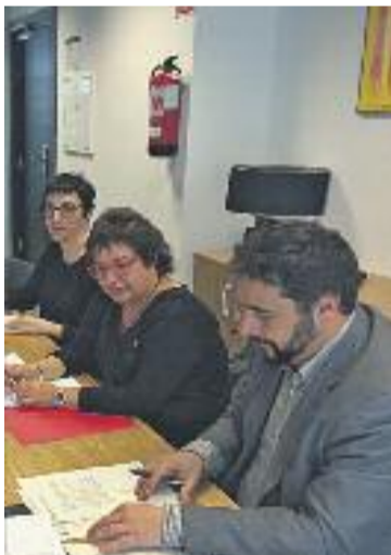
Bassa, al mig, durant la reunió.

De fet, els organitzadors de la recollida asseguren que el volum de roba entregat a Badalona és tan gran que no es podrà ficar tota dins els tres camions. Davant l'allau de roba rebuda, l'Ajuntament ha cedit als Carmelites el pati de l'escola Lola Anglada, però aquest també s'ha quedat petit i els religiosos demanen una nau industrial.