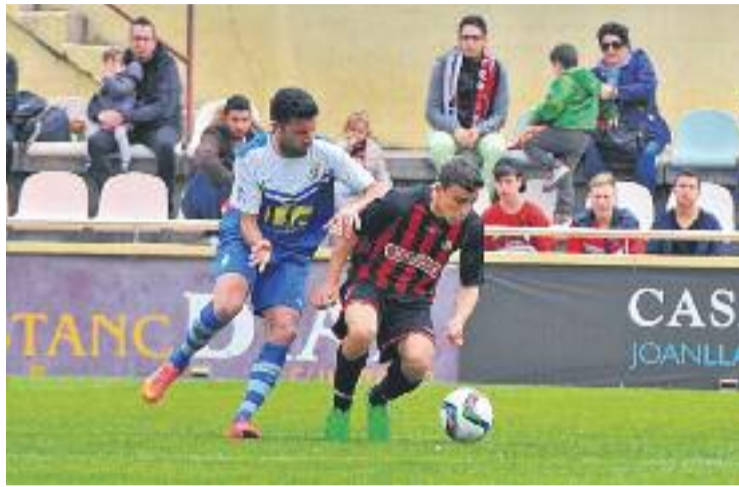
L'equip va donar la cara però va perdre al Baix Camp.

La millor ocasió va arribar al minut 34, quan després d'una recuperació de pilota a camp contrari, Serrano va xutar des de l'interior de l'àrea. La pilota va dibuixar una corba impossible per a Edgar Badia, però el pal va evitar el gol dels escapulats.