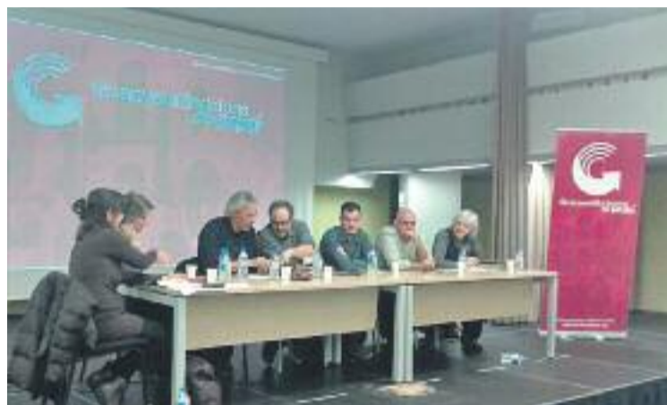
Guanyem va realitzar la proposta en un acte el 18 de març.

rritoris menys representats a l'AMI, ja que a banda de la Diputació de Barcelona, només Montgat i Tiana s'hi han adherit.