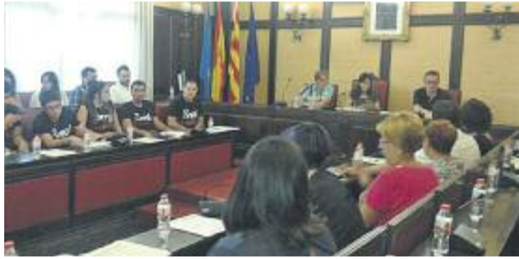
Imatge del Ple de juliol en què es van aprovar els nomenaments.

En aquest sentit, l'executiu de Parlon defensa els nomenaments i assegura que estan emparats per la llei municipal i de règim local de Catalunya, aprovada pel Parlament però que encara no s'ha