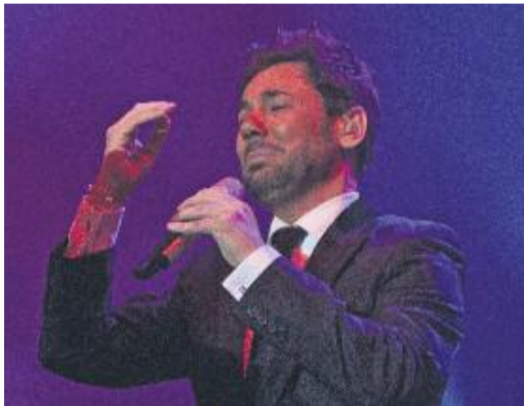
Miguel Poveda en una imatge d'arxiu.

"Es vol que sigui un acte de reconeixement de tota la ciutat de Badalona cap a un dels seus artistes més reconeguts. El protagonisme serà de la gent que ha envoltat i envolta Miguel Pove-