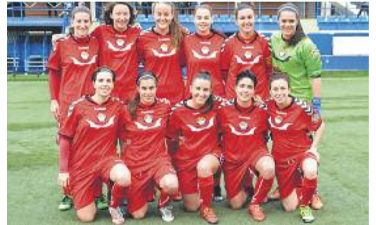
Les gavines són a cinc punts del Barça B.

Aquest cap de setmana la competició s'atura. La lliga es reprendrà d'aquí a nou dies amb la visita del Seagull al camp de la Penya Blanc-i-blava La Roca, mentre que el Sangra rebrà el Levante Las Planas.