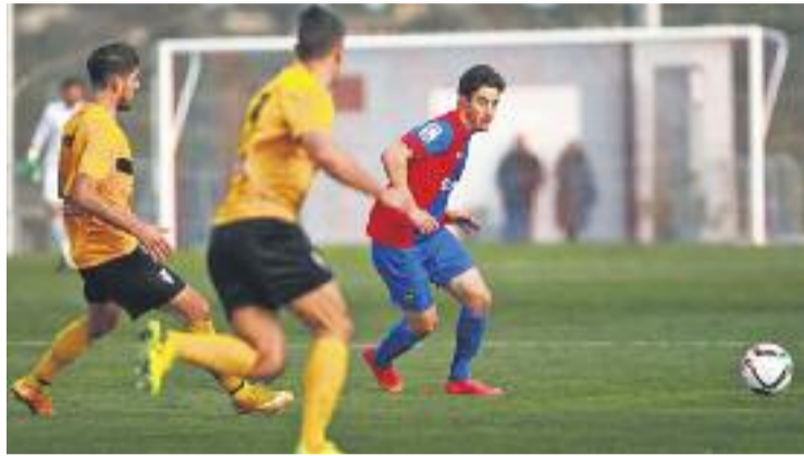
Els escapulats ja són a vuit punts del descens.

El filial granota, dinovè amb 24 punts, va començar el partit dominant, però els homes de Miguel Ángel Villafaina no aconseguen traduir el control en ocasions. El primer avís local va arribar al minut 11 en un córner botat des de l'extrem esquerre que Valiente no va rematar. A poc a poc, els escapulats van anar entrant en el partit, però al minut 27 el Levante va aconseguir inaugurar el marcador. Álvaro Traver va