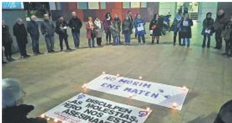
Concentració a la plaça de la Vila de Santa Coloma.

Una visió internacional que també comparteix Badalona. Per exemple, amb l'acte que el Parlament Europeu organitza avui al teatre Principal, que posa el fo-