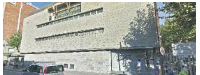
El judici paral·lel s'està instruint a Badalona.