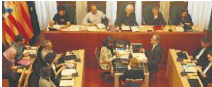
PP i C's van votar en contra del pressupost al Ple.

En la sessió plenària extraordinària de dimarts, PSC i CiU van abstenir-se en l'aprovació inicial dels pressupostos, mentre que PP i Ciutadans hi van votar en contra. La situació de bloqueig, però, tenia una sortida. Concretament, que els comptes fossin aprovats directament per l'executiu, tal com va succeir després del Ple durant la celebració d'una Junta de Govern. Un mecanisme previst per la Llei de Racionalit-