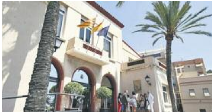
El Ple va ser convocat fora de termini per "problemes informàtics".

Per la seva banda, el govern municipal ha emès un comunicat en què explica que reconeix que el Ple es va convocar fora de termini, segons asseguren, a