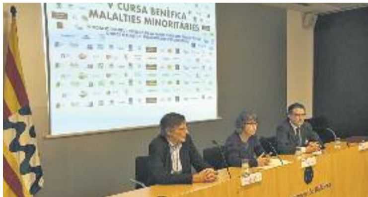
Dia de la presentació de la cursa.

L'ADN d'aquesta prova és cent per cent solidari, ja que els