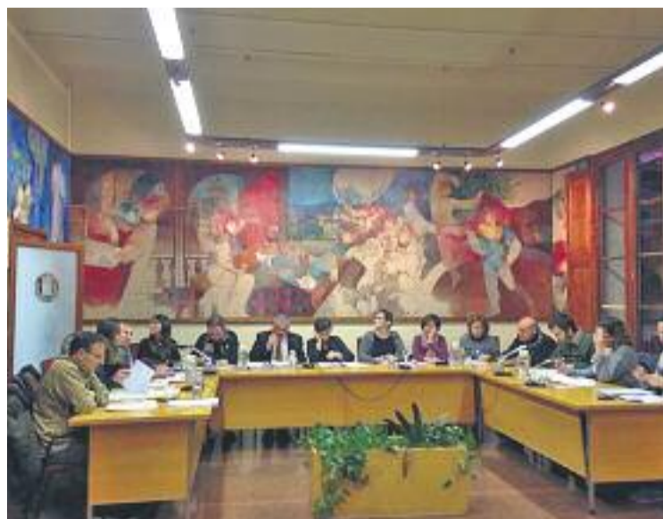
Imatge del Ple celebrat dimarts.