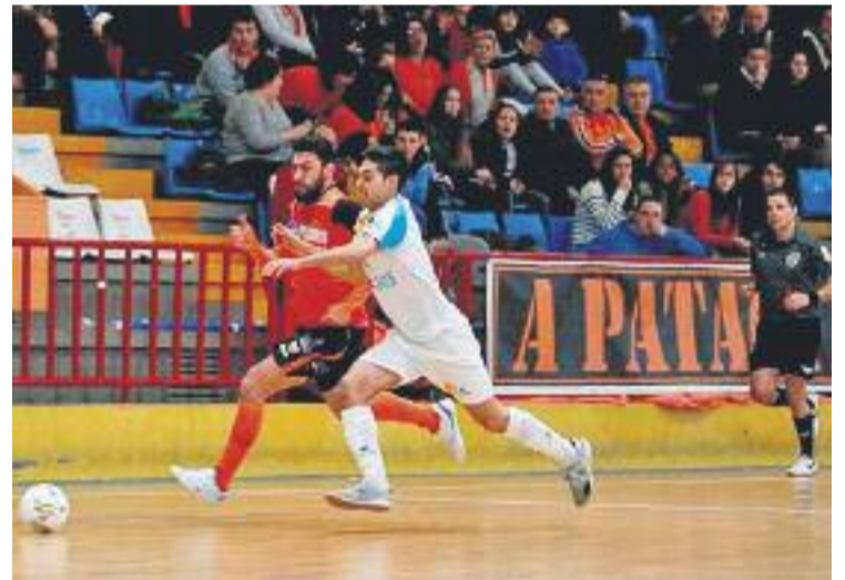
Els colomencs van exhibir-se contra un rival directe.