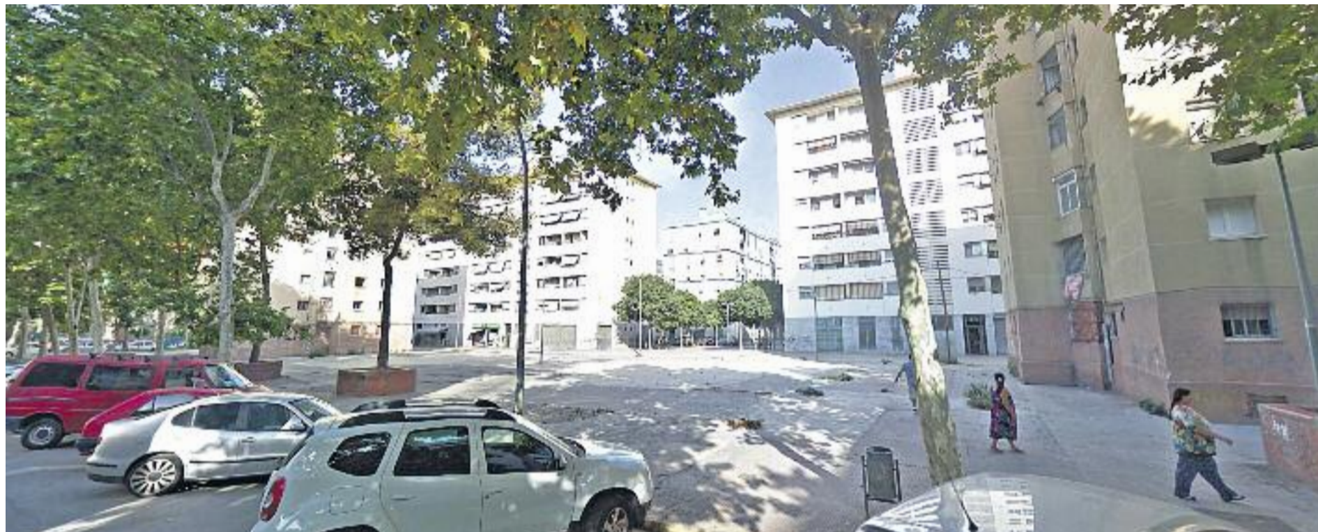
El barri de Sant Roc viu dies convulsos.

» Línia Nord parla amb una de les famílies que ha fugit de Sant Roc pel conflicte de clans a La Mina » Obligats a marxar per les amenaces dels Baltasares, denuncien que la seva situació és molt precària