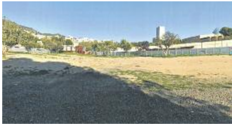
Imatge d'arxiu del parc de Can Zam.