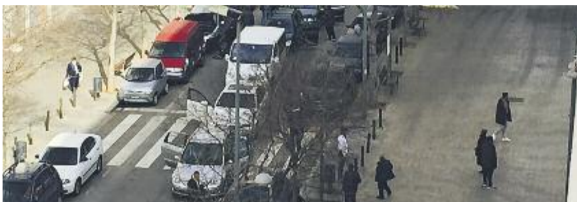
Un veí va captar l'incident protagonitzat per membres del clan dels Baltasares el 6 de febrer.