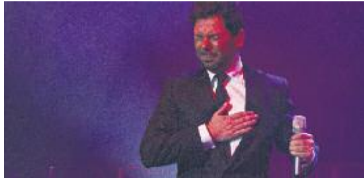
El cantaor Miguel Poveda ja és fill predilecte de la ciutat.

Un nomenament que s'oficialitzarà el pròxim 4 de març en un acte al Teatre Zorrilla i que s'ha produït tot just cinc dies abans de