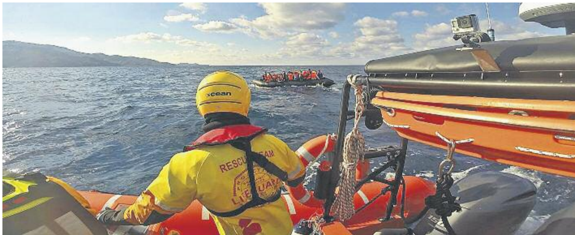
Una acció de rescat d'un equip de socorristes de l'ONG badalonina Proactiva Open Arms.

» Proactiva Open Arms, de Badalona, continua a Lesbos col·laborant amb l'acollida de refugiats » L'ONG fa una crida per rebre donacions que li permetin mantenir l'activitat durant tot aquest any