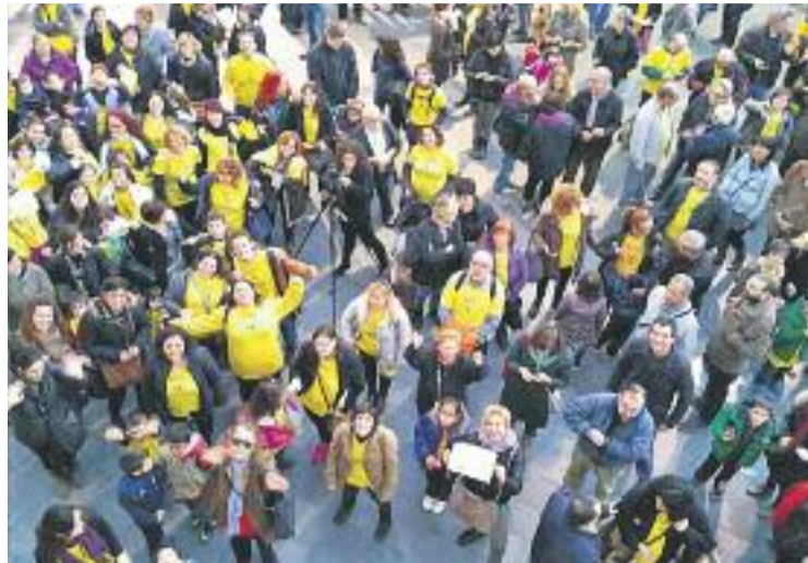
Desenes de persones van celebrar-ho a la plaça de la Vila.

Així doncs, Badalona és el vintè municipi català que es declara com a Vila Groga, després que ho hagin fet, per exemple, Santa Coloma de Gramenet, L'Hospitalet de Llobregat, Terrassa o Cerdanyola del Vallès. "Estem molt contents d'haver