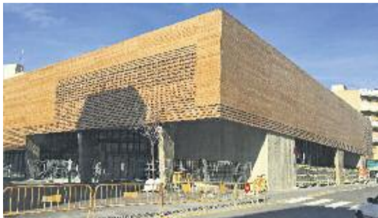
L'obertura del mercat adrianenc està encara a l'espera.

Amb aquesta nova convocatòria, l'Ajuntament vol assegurar-se que el mercat entra en funcionament amb totes les seves