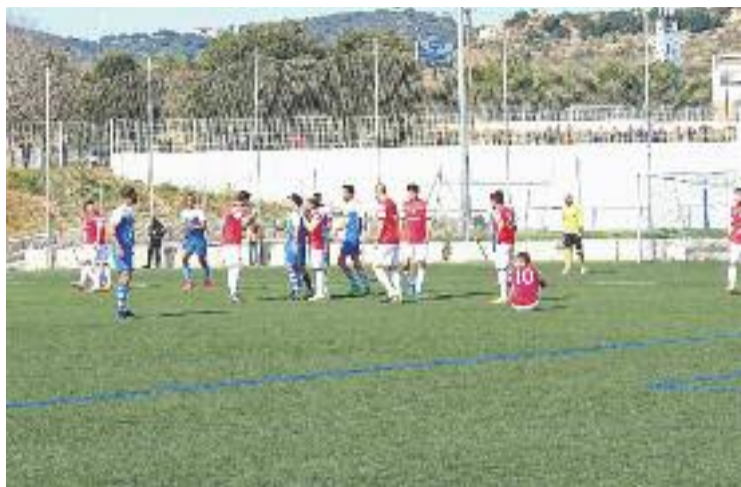
Els escapulats van poder controlar els atacs de l'Hércules.

L'Hércules, un dels conjunts que aspira a l'ascens, va començar dominant territorialment, tot i que la primera rematada del matx la va fer del Badalona, un xut llunyà de Fran Grima que no va inquietar el porter Chema. El veterà lateral Paco Peña va ser un dels homes més incisius del conjunt alacantí amb les seves internades per la banda esquerra. Un cop més, Morales va ser decisiu. El porter escapulat va estirar-se