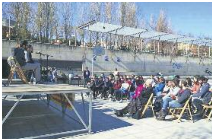
Una cinquantena de persones van assistir a l'acte.

El 28 de maig del 2014 els dos joves, aleshores estudiants de la Universitat Pompeu Fabra, van ser detinguts pels Mossos d'Esquadra després d'una de les manifestacions de rebuig al desallotjament del centre social ocupat del barri de Sants de Barcelona.