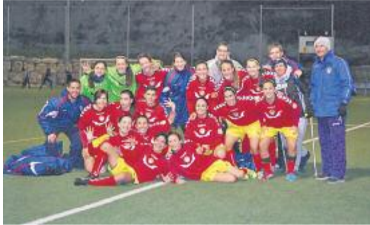
El Seagull va trencar una mala ratxa de dues derrotes seguides.