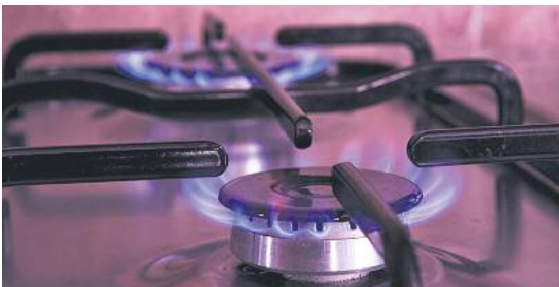
El principal objectiu de la Diputació de Barcelona és la reducció de les despeses en electricitat, aigua i gas dels habitatges en situació de risc.