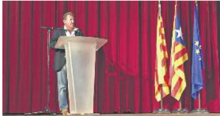
Imatge d'un moment de la mostra de l'any passat.

A la mostra hi poden participar infants, joves i adults vinculats a Montgat i els alumnes de les escoles del poble ho poden fer a través dels seus centres educatius. Hi haurà cinc grups repartits per edats que dividirà els participants entre els de 6 i 8 anys, els de 9 a 11, els de 12 a