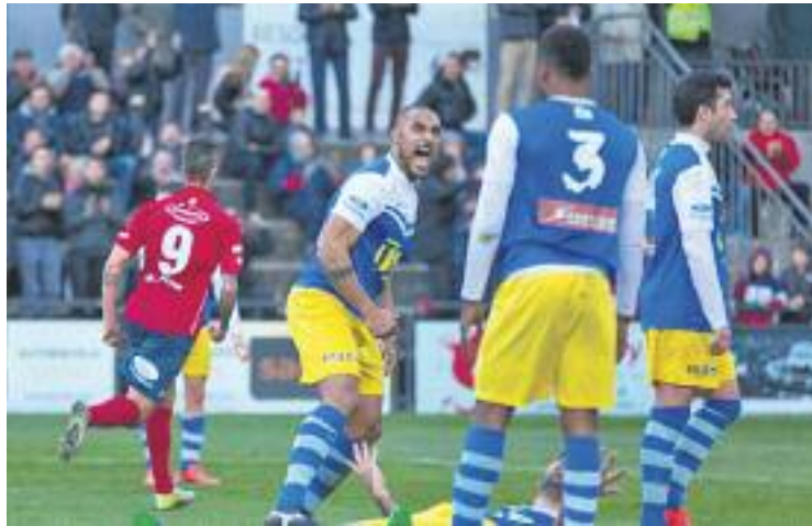
Amantini va reparar-se al Municipal d'Olot.

Els locals, molt més necessitats de punts, van dominar el primer tram del partit. Djaka Traoré i Marcel Serramitja es van mostrar molt incisius per les bandes, però l'home més perillós del conjunt de Rodri era el punta Dieguito, que va posar a prova Morales. El porter escapulat, però, va guanyar-li la partida en l'un contra un. L'ocasió més clara del Badalona durant els primers 45 minuts va ser un xut amb l'interior del peu d'Eugeni.