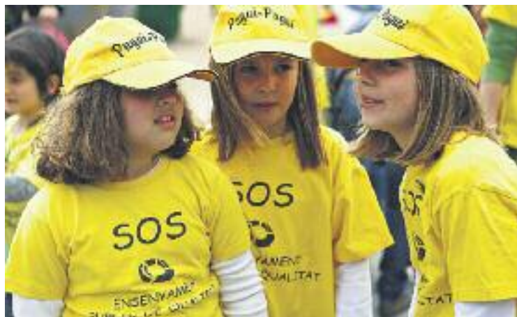
Badalona es Mou demana que Badalona sigui Vila Groga.