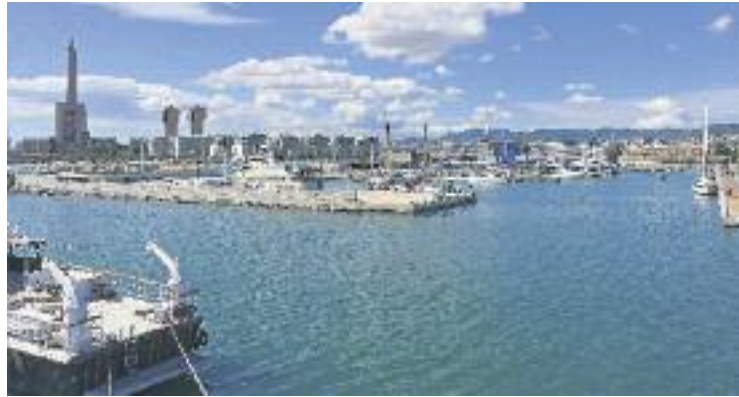
L'Ajuntament preveu que el port esdevingui un actiu econòmic.