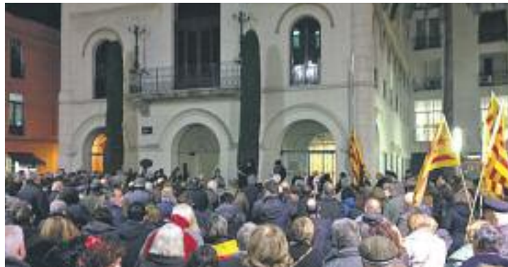
Centenars de persones es van aplegar a Badalona.

"No som aquí per buscar un somni. Nosaltres som el somni". Aquestes paraules, pronunciades per Casals el 29 de juny del 2013 durant el Concert per la Llibertat del Camp Nou, van donar el tret de sortida a un sentit acte d'homenatge, presidit al costat de