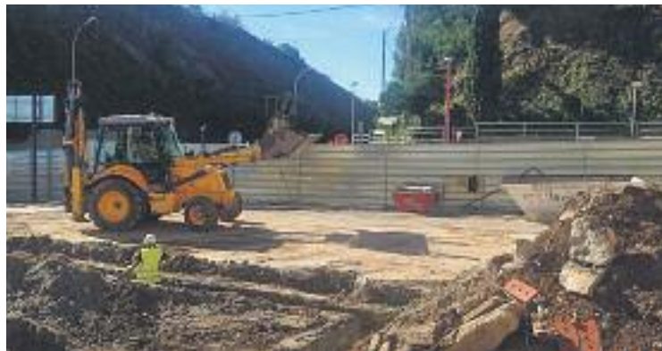
Les excavadores continuen treballant a la plaça.

Un fet que, segons l'Ajuntament, demostra que el projecte de remodelació de l'espai està avançant al ritme previst. De fet, la primera planta de l'aparcament subterrani que inclou el projecte ja s'ha enllestit i pròximament s'iniciaran les obres de la segona. Tot i que l'alcalde, Rosa Funtané, admet que "sempre hi pot haver algun contratemps", el govern municipal confia que aquesta segona fase no topi amb cap