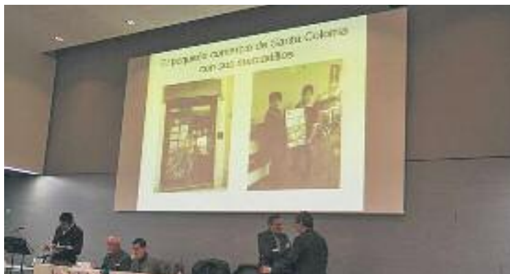
La cerimònia tindrà lloc a la biblioteca de Singuerlín.

Per tal de reconèixer la seva tasca i contribuir a la seva promoció, es van crear els premis I love mercadillo , uns guardons que enguany arriben a la seva sisena edició i que es lliuraran aquesta tarda a les sis a la biblioteca Salvador Cabré de Singuerlín. Els premis, creats per l'Associació de Paradistes de Santa Coloma, repartiran tres premis de 100 euros en vals de compra per bescanviar als mercats de venda no sedentària de Singuerlín, Sagarra i Fondo. Per partici-