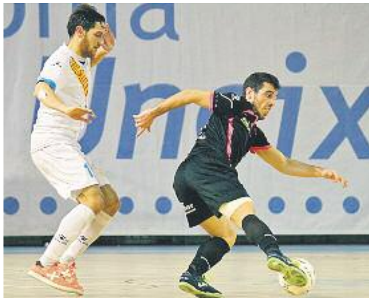
Els colomencs ocupen la vuitena posició amb 24 punts.

En el partit de la primera volta, colomencs i mallorquins van empatar (2-2). Sepe i Corvo van