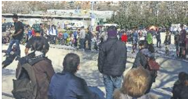
Els patinadors van poder estrenar la instal·lació diumenge.

L' skatepark està ubicat a l'illa compresa entre els carrers de Víctor Hugo, l'avinguda de la Pallaresa i la prolongació del carrer d'Anselm de Riu, té una extensió de 3.000 m 2 , entre la pista de patinatge i la zona enjardinada, i s'ha dissenyat amb la col·laboració del col·lectiu de patinadors de Santa Coloma, a través d'un procés participatiu. A més, l'e-