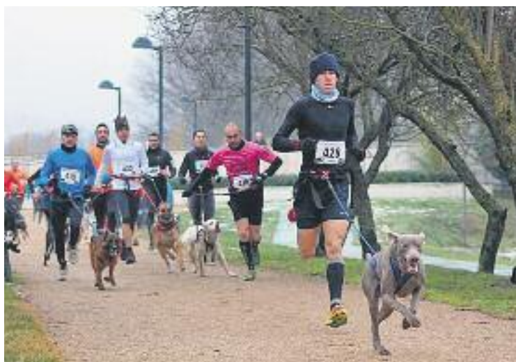
Un total de 69 corredors van participar en la prova.

D'altra banda, Blasco agraeix la col·laboració d'entitats com l'As-