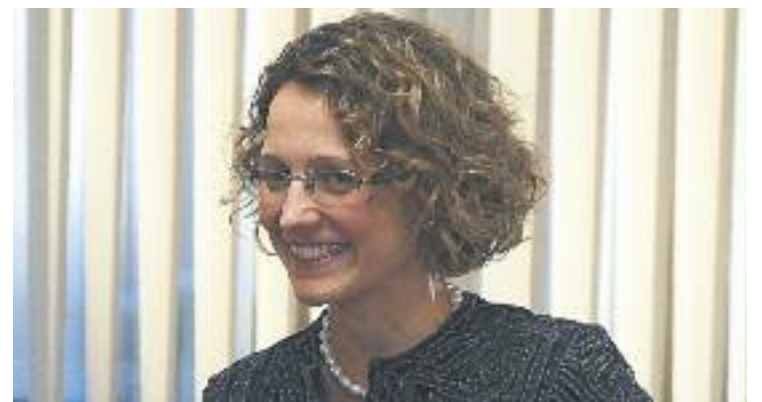
Meritxell Ruiz vol abaixar ràtios als centres d'especial complexitat.

La reducció de ràtios, és a dir, la rebaixa d'alumnes per aula, és una demanda històrica de la comunitat educativa a la comarca, que fins i tot ha comptat amb suport institucional. Per exemple, el Consell Escolar Municipal de Badalona va traslladar la petició al Departament el 19 de novembre.