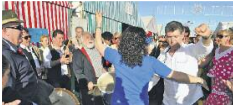
Imatge d'arxiu de la Feria de Abril al Parc del Fòrum.

Sigui com sigui, el consistori badaloní assegura que no ha rebut cap petició formal per part de la FECAC. Fonts municipals també assenyalen que el govern municipal