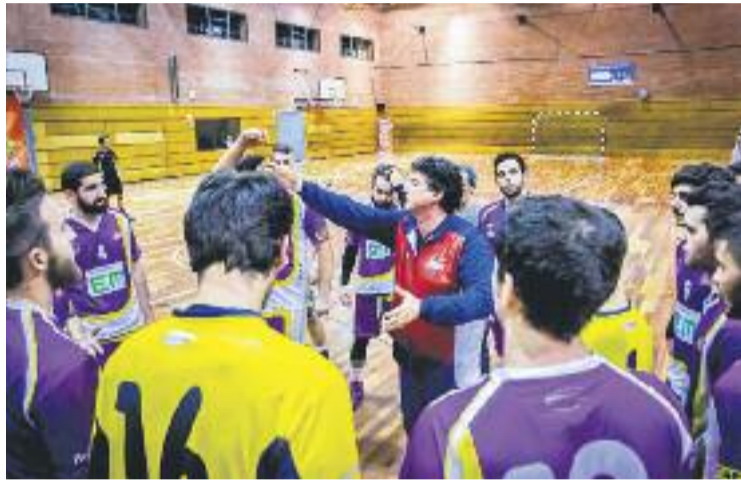
L'equip només ha perdut dos partits a la primera volta.

Els sarrianencs van aconseguir un parcial inicial, però la seva empenta inicial no va intimidar els adrianencs, que van reaccionar ràpidament i a partir del 4-3 no van cedir la iniciativa en tota la primera part. El màxim avantatge que van aconseguir va