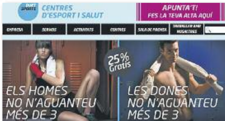
Imatges de la campanya acusada de sexista.

de Santa Coloma i Tiana van demanar la retirada de la campanya. Els dos consistoris van expressar opinions molt semblants en els seus respectius comunicats. Consideraven que la campanya atemptava contra els principis d'igualtat i insistien en el fet que Duet no els havia informat prèviament de les característiques de la campanya, a més de recordar que no estava finançada amb diners públics. "És