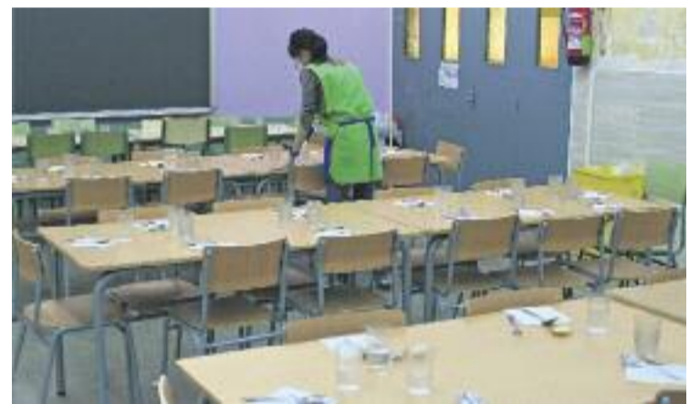
Gran part de les ajudes han anat destinades a l'alimentació infantil.

A més, l'Àrea Metropolitana de Barcelona ha atorgat 162 ajudes destinades a pal·liar les conseqüències de la pobresa energètica i la Fundació Formació i Treball ha ajudat 133 famílies amb la venda de roba i mobles a baix preu.