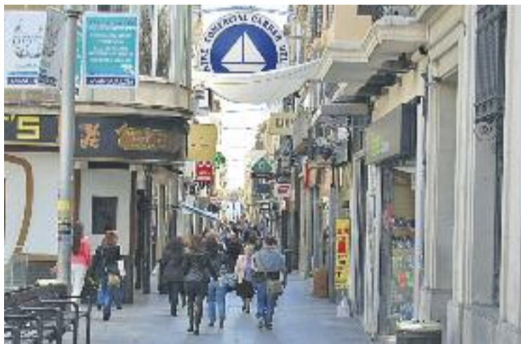
CCB ha sortejat 200 euros en vals entre els seus clients.

Aquest Nadal, fem comerç de proximitat és el nom de la iniciativa que va impulsar CCB per animar el sector, una "motivació perquè el petit comerç tingui una miqueta més de vida", expliquen des de l'associació. La campanya, que va finalitzar abans de Reis, consistia en el sorteig de vals de compra per valor de 200 euros entre els clients de l'eix, que per participar-hi havien