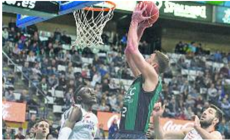
Suton anota contra el Baskonia.

Després del partit, el tècnic va admetre que l'equip té "moltes