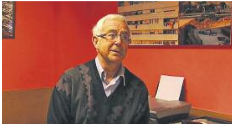
Monferrer en una imatge d'arxiu.

Monferrer és escolapi, pedagog, ha treballat de professor i lidera l'Ar-