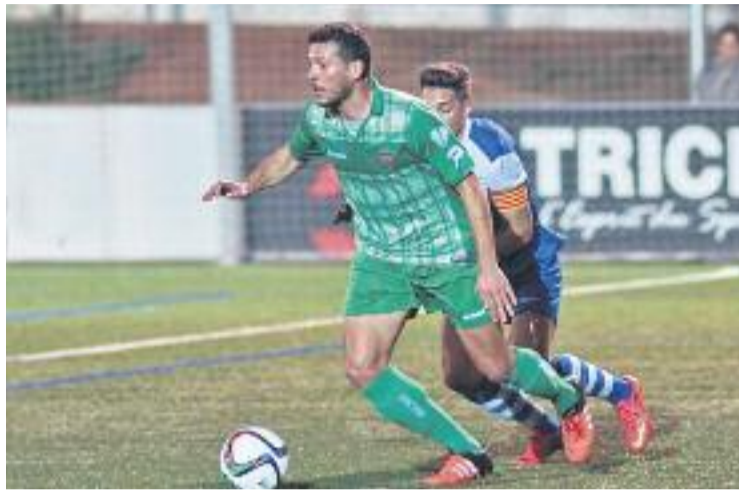
L'equip va mostrar una gran imatge al Baix Llobregat.

Canelada, Morgado i hiperaactiu Eugeni van ser els artífexs de la reacció escapulada. De fet, al mitjapunta tarragoní li van