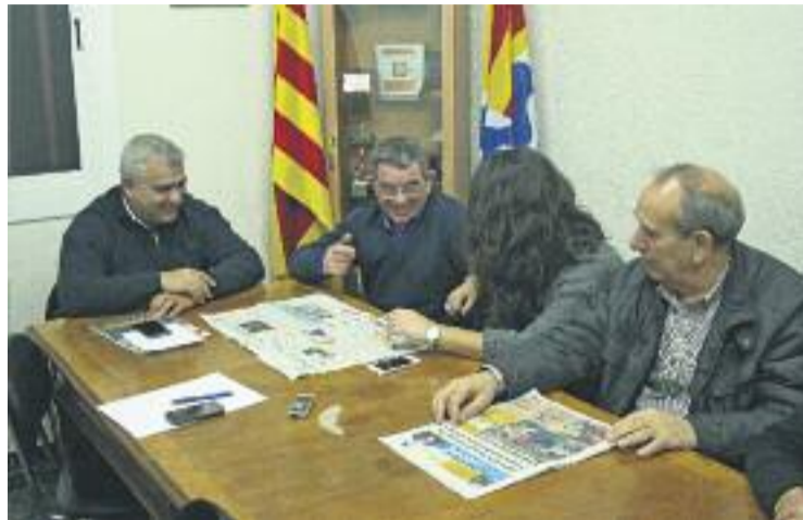
L'Associació de Veïns, conversant amb Línia Nord.

De fet, el president de l'associació afirma que, quan el PP ocupava el govern municipal, el partit ja va intentar "desplaçar l'associació sense èxit".