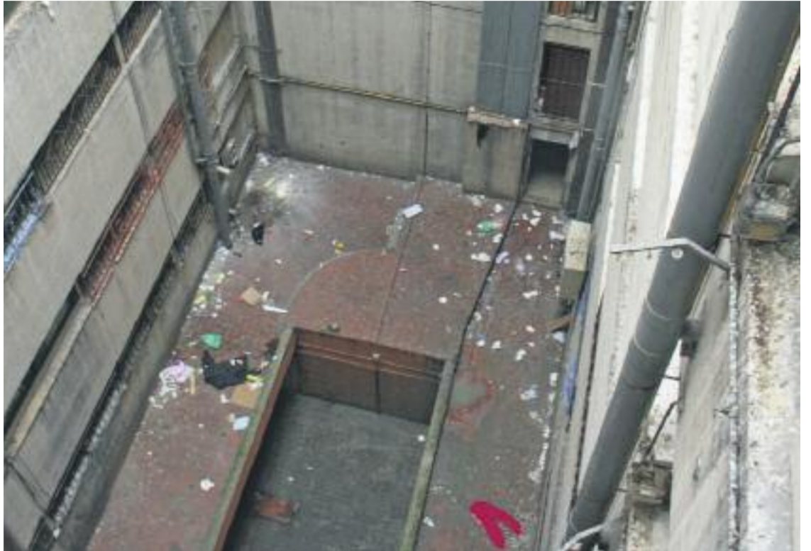
Dues imatges de l'interior del Bloc Venus, molt degradat.