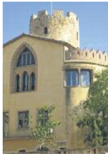
El Museu Torre Balldovina.