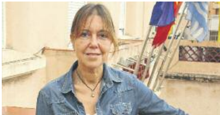
El govern de Funtané també destinarà més diners a l'ensenyament.

D'altra banda, també augmenten un 17% els recursos destinats als programes d'ensenyament i joventut, un 8% els dedicats al foment de l'ocupació i es crea una partida de 16.000 euros per a la promoció turística del municipi. A l'altre cantó de la balança hi ha l'àrea de cultura i fes-