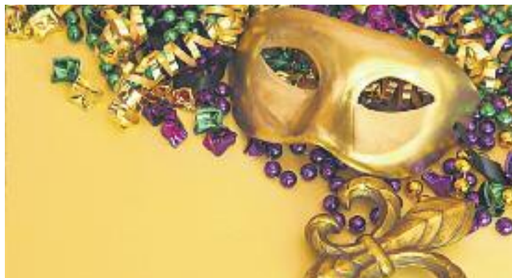
La Salut celebrarà Carnestoltes dissabte 6 de febrer.

L'esdeveniment també comptarà amb un animador i un escenari per on desfilaran els participants del concurs.