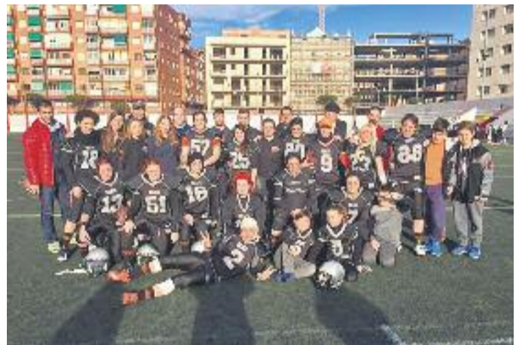
El sènior femení debutarà a primera divisió contra Pioners.