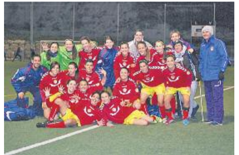
Les gavines van superar l'AEM en un gran partit.

Romero no va ser l'únic debutant, ja que la japonesa Shiho va disputar els seus primers minuts amb l'equip. Franch va avançar les blanc-i-blaves i Andrea va aconseguir el gol de l'empat.