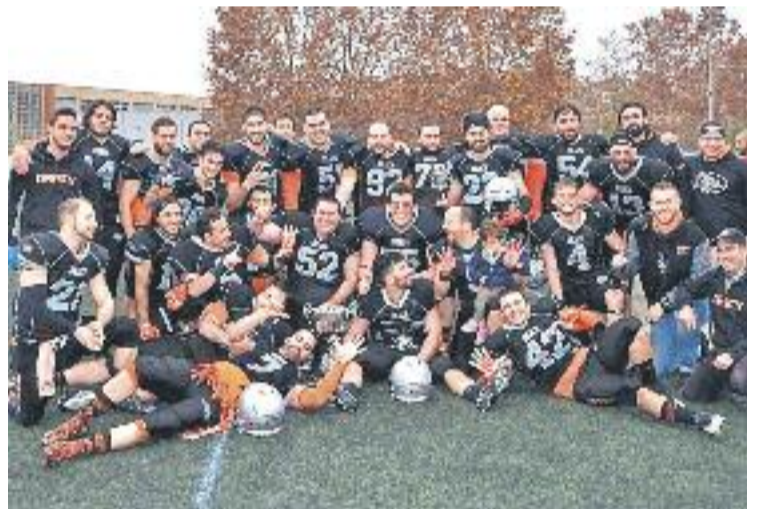
L'equip, eufòric després del partit.

BADALONA ▶ Els Dracs es van exhibir a la 25a edició de la Copa Catalana sènior de futbol americà. Els badalonins van esclafar els Hospitalet Pioners (51-0) i es van coronar com a millor equip del país per setè cop.