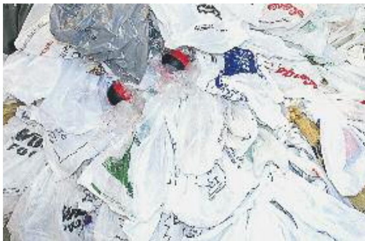
Les bosses de plàstic tarden uns 150 anys a desaparèixer.

De moment, la federació badalonina està treballant en la