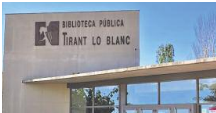
La Biblioteca Tirant lo Blanc acollirà l'audiència.

Avui els assistents a l'audiència podran escoltar les explicacions dels responsables municipals sobre els pressupostos i també els podran fer preguntes. De fet, l'Ajuntament no tanca la porta a tenir en compte alguna de les aportacions per incloure-la a