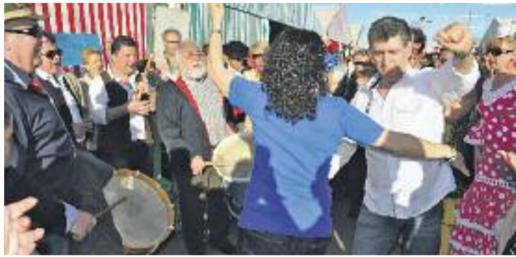
Imatge de la Feria de Abril celebrada l'any passat.

Concretament, Callau defensa que el consistori barceloní hauria d'haver assignat directament a la Federació d'Entitats Andalusos de Catalunya (FECAC) la gestió de la fira en comptes d'obrir un concurs públic, tal com ha fet. "La federació és qui ho hauria d'organitzar perquè aglutina totes les entitats", argumenta. "A partir d'aquí, podrien exigir-li allò que volguessin", afegeix en relació al fet que l'Ajuntament de Barcelona hagi justificat el concurs per motius de "transparència".