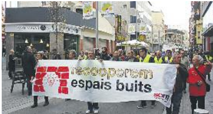
Una cercavila va donar el tret de sortida a la campanya dissabte.

SOM proposa que la recuperació d'aquests espais s'aconsegueixi a través de l'enduriment de sancions als bancs o fons d'inversió que mantenen pisos buits a la ciutat, o bé de cessions a entitats veïnals. Mentre el pla no sigui una realitat, la formació demana al consistori que habiliti aquests es-