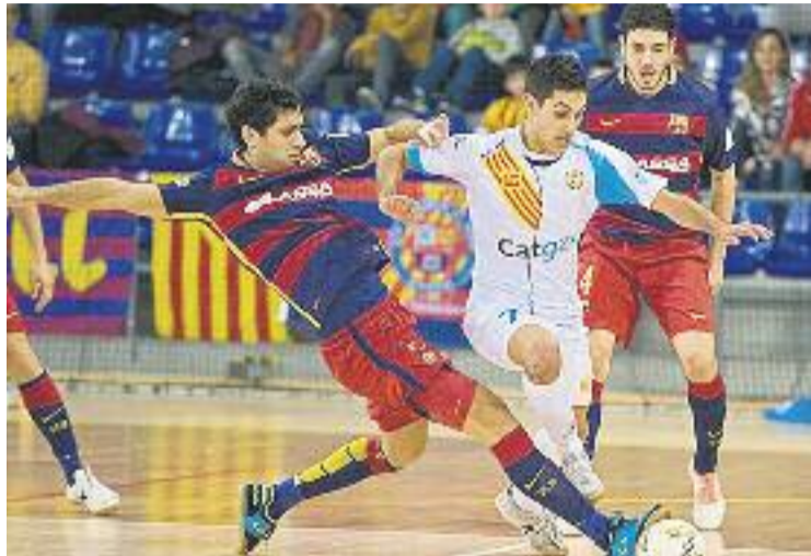
Els colomencs no van poder puntuar al Palau Blaugrana.