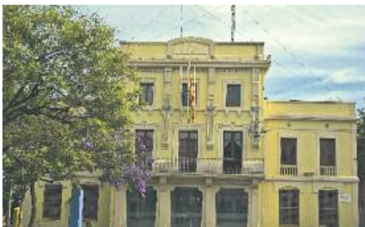
Convergència i Junts es van abstenir.

El pressupost per al 2016 és de 9,1 milions d'euros, la qual cosa suposa un increment superior al 7% respecte al de l'any passat. En total, l'Ajuntament tindrà enguany 650.000 euros més a la seva disposició. "Aquests pressupostos demostren un canvi de cicle econòmic", defensa l'alcalde, Ester Pujol, que destaca la possibilitat de començar a fer inversions amb recursos propis.