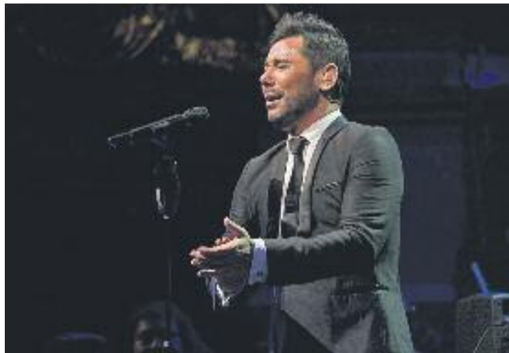
Poveda aterrarà el 5 de març al Teatre Zorrilla.

Un dels objectius de Badalona Cultura, gestora dels teatres del municipi, és aconseguir enganxar públic de totes les edats. El millor exemple d'aquesta voluntat és el fet que un espectacle infantil obrirà el foc de la nova temporada. Concretament serà Patatu , diumenge 24 de gener al Zorrilla.