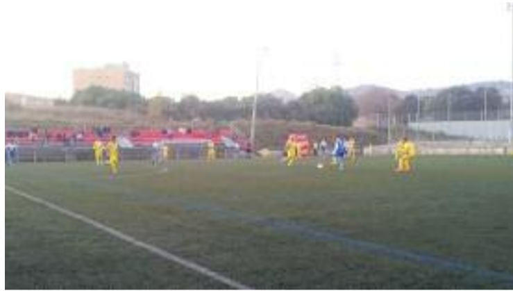
Els escapulats no van aconseguir veure porteria a Montigalà.