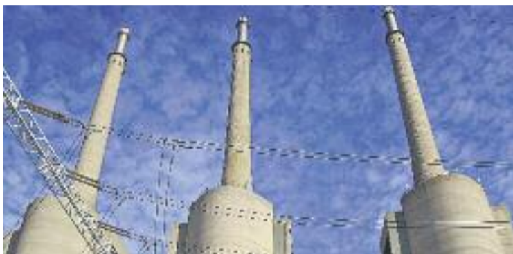
Els terrenys de l'antiga central tèrmica pertanyen, en part, a Badalona.

Ara, la incorporació de Badalona al Consorci està pendent del vistiplau de la resta de municipis que en formen part (Barcelona, San-