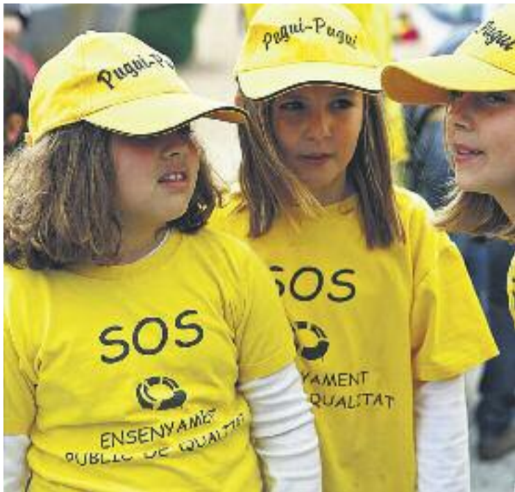
Les samarretes de la Marea Groga es van popularitzar a Badalona.