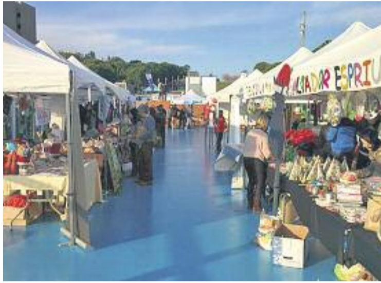
Unes 5.000 persones, segons l'Ajuntament, van participar en la fira.

Tot i que enguany la fira ha registrat una participació més baixa d'artesans, l'afluència de visitants s'ha mantingut. Fins i tot, l'Ajuntament apunta que diumenge es podria haver superat l'assistència de l'edició de l'any passat. El motiu, segons el consistori, és l'àmplia oferta d'activitats que es van organitzar.