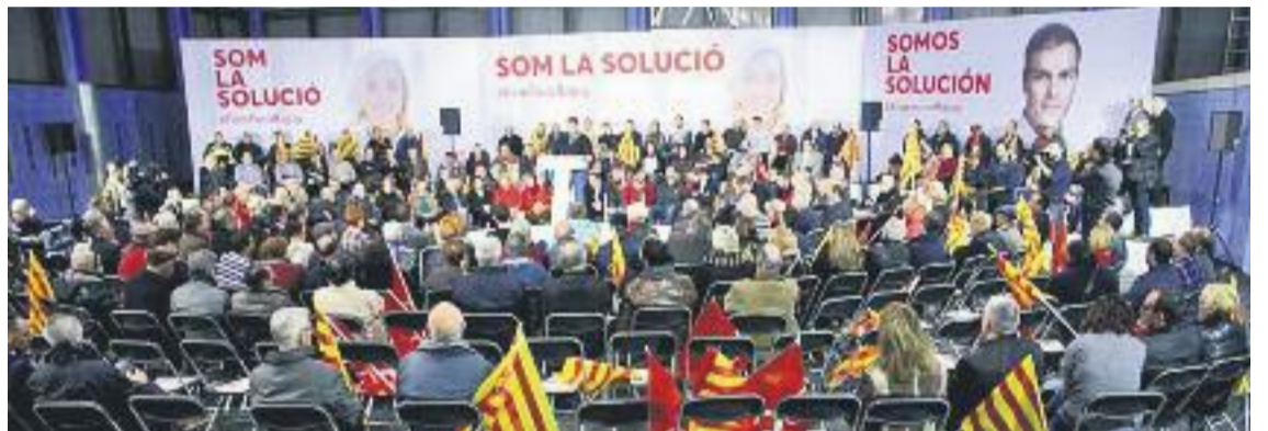
Homs (esquerra) ha visitat Badalona, Podem va tenir un bany de masses a Llefià (a dalt a la dreta) i els socialistes han conviscut amb cadires buides (a baix a la dreta).