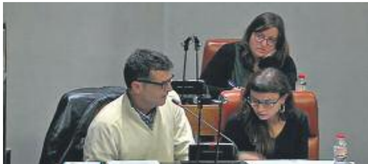
Imatge d'arxiu del grup de la CUP a la Diputació.

La CUP denuncia que el càrrec de Parlon "no està dotat de cap atribució de govern". En aquest sentit, l'alcaldeessa argumenta que la seva vicepresidència serveix per "aportar l'experiència dels governs municipals de Santa Coloma" i per "esmenar les línies d'intervenció del govern". "Sempre ha existit una vicepresidència per al