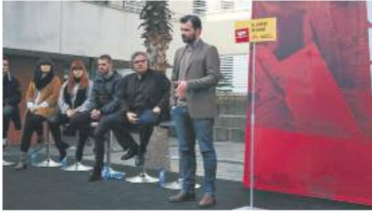
Intervenció de Rufián (ERC) en l'acte de diumenge a Sant Adrià.

DESEMBARCAMENT DEL PSOE Per la seva banda, el PSOE vol fer ressorgir la tradicional etiqueta de feu socialista de la comarca. Per fer-ho, han comptat amb l'ajuda de la presidenta de la Junta d'Andalusia, Susana Díaz, dilluns a Santa Coloma, mentre que avui Carme Chacón i l'exlehendakari, Patxi López, seran presents a Bada-