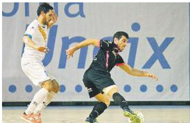
Els colomencs són a la setena posició amb 21 punts.

El Santiago va tornar a la pista amb l'empenta amb la qual va acabar el primer temps i va aconseguir avançar-se al marcador per primer cop en el partit gràcies a Hugo, però Corvo tornava a igualar el resultat al minut 24.