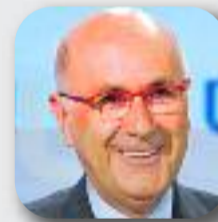
JOSEP A. DURAN I LLEIDA Unió Democràtica

"El 20 de desembre és el nostre gran moment pel canvi i ho hem de fer junts"