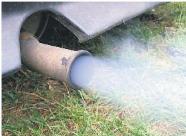
La pol·lució provoca cada any 3.500 morts a l'àrea de Barcelona.

L'objectiu del consell és reduir la contaminació atmosfèrica a través d'una política comuna a l'àrea de Barcelona, elaborant polítiques conjuntes i fent propostes concretes per reduir les emissions contaminants i promoure sistemes de transport més sostenibles. L'alcalde de Tiana, Ester Pujol, va ser present a l'acte de constitució de l'organisme, celebrat la setmana passada, presidit per l'alcalde de Barcelona, Ada Colau i que va comptar amb la presència de