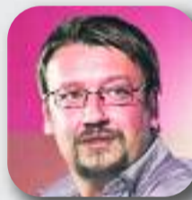
XAVIER DOMÈNECH En Comú Podem

"El 20 de desembre és el nostre gran moment pel canvi i ho hem de fer junts"