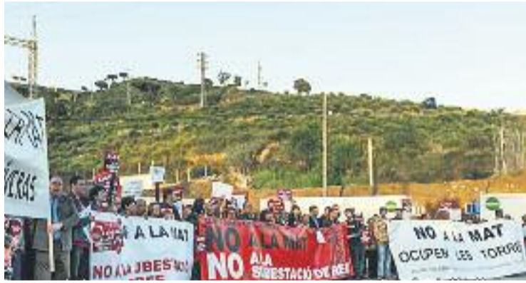
Imatge d'arxiu d'una mobilització contra la MAT.

"La MAT suposaria un greu impacte al sòl, eliminaria vegetació,