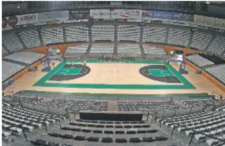
Una imatge d'arxiu del Pavelló Olímpic.

La comissió està formada, entre altres, per la conselleria d'Interior i representants de cossos policials, serveis sanitaris i protecció