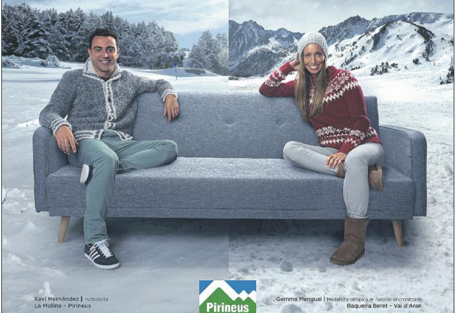
Xavi Hernández | Futbolista La Molina - Pirineus