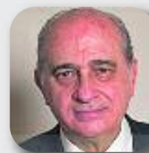
JORGE FERNÁNDEZ DÍAZ Partit Popular (PP)

"El PP va tard però no es quedarà fora de joc i serà a la reforma constitucional"