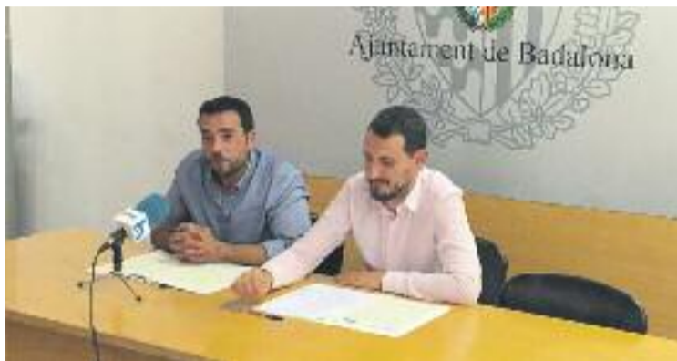
Pastor durant la presentació de les al·legacions a les ordenances.

"Amb l'aprovació dels pressupostos veurem si el PSC aposta fort per la política progressista", assegurava Sabater en aquesta entrevista. "Crec que el PSC ens ajudarà a tirar endavant un projecte sòlidament d'esquerres i a favor de la ciutadania", afegia.