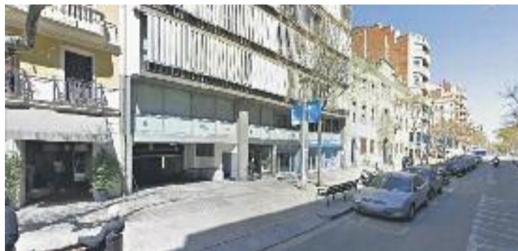
La seu de Finques Marhuenda, a Barcelona.

TRIBUNALS ▶ Els Mossos d'Esquadra van detenir dimecres passat a Sant Adrià el propietari de Finques Marhuenda, acusat d'estafar prop d'un milió d'euros a unes quaranta comunitats de veïns del municipi i també de Barcelona.