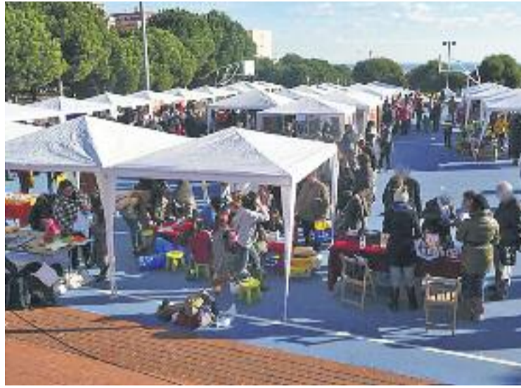
30 entitats i 50 artesans participaran en la fira.

D'altra banda, els visitants també tindran a la seva disposició diverses ofertes gastronòmiques, com diversos food trucks que s'instal·laran al parc,