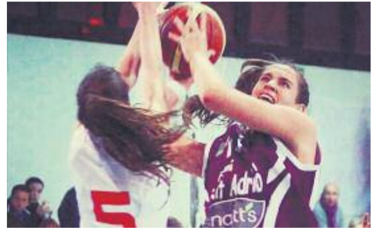
El Segle XXI no va ser rival per a les liles.

Demà passat les adrianenques buscaran el novè triomf del curs a Madrid, on s'enfrontaran al Plenilunio Distrito Olímpico.