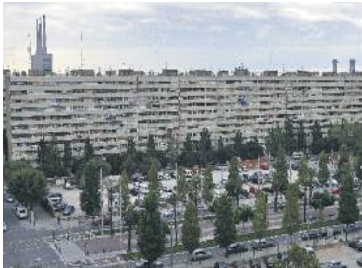
Els veïns denuncien que l'estat del Bloc Venus és deplorable.