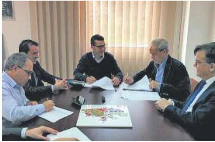
El contracte d'adjudicació es va firmar a l'abril.

Les primeres accions de les obres, que el consistori preveu que finalitzin l'octubre de 2016, han estat els moviments de terra i el tancament del perímetre de la parcel·la municipal de la plaça de la Mare. La concessió administrativa de construcció i explotació del mercat es va adjudicar a l'empresa Merkamontgat, SL, que va signar el contracte amb l'anterior govern municipal el passat 27 d'abril. Així doncs, les obres del nou