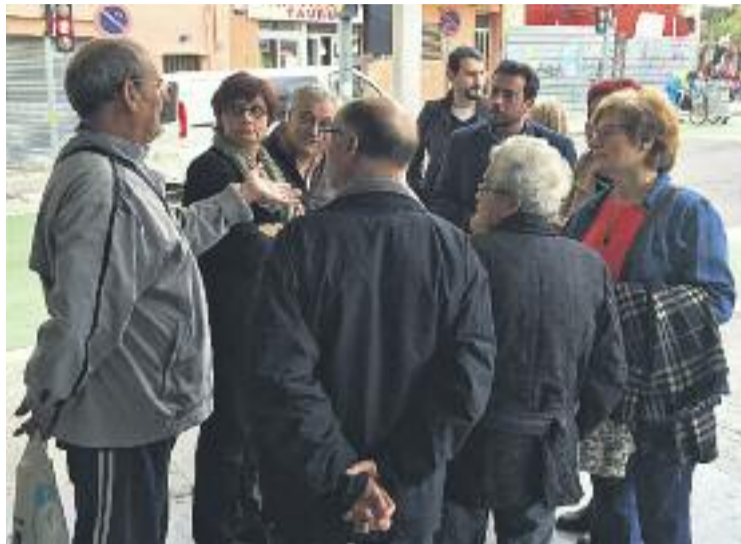
Imatge de la reunió entre Pastor i els veïns.

En aquest sentit, el consistori afirma que estarà al costat dels veïns, però vol escoltar els arguments de l'ICS favorables a la centralització del servei de