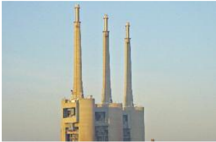
Les Tres Xemeneies de Sant Adrià, un dels elements destacats.

D'altra banda, Sant Adrià de Besòs també té representació en el Mapa del patrimoni industrial, en el seu cas a través de