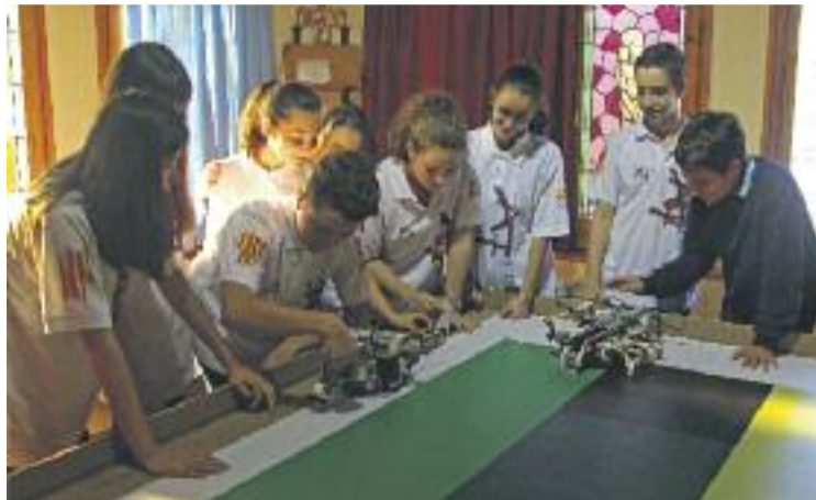
L'equip d'alumnes amb els prototips de robots.

Amb aquest punt de partida, l'equip de Natzaret Area 7 ha ideat un robot que, a través de diferents sensors, pot preveure les erupcions volcàniques. "Vam veure que abans d'una erupció els aqüífers puguen de temperatura i la topografia s'altera", expliquen.