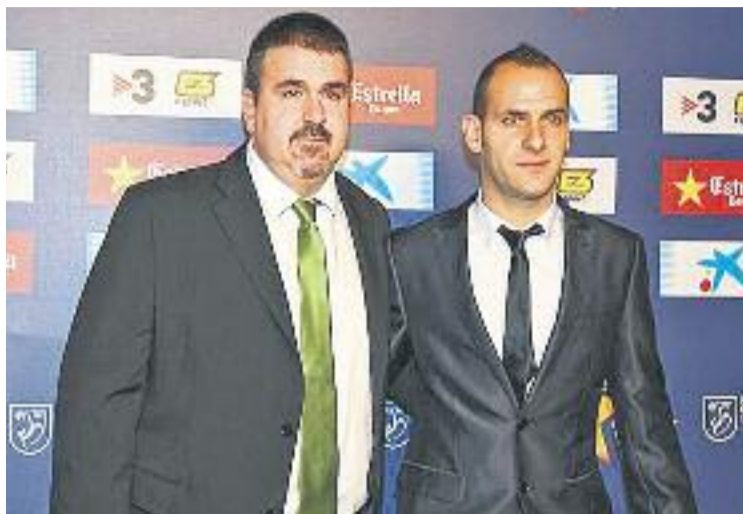
El tècnic i el futbolista durant la gala de l'any passat.

La bona notícia dels premis ve acompanyada de la victòria que els colomencs van aconseguir divendres passat al pavelló Esperanza Lag contra l'Elx (1-5).