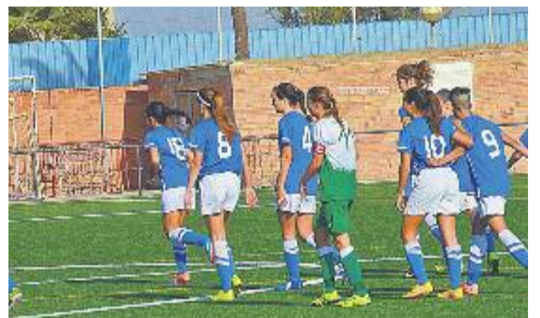
El Sangra va esclafar el Cerdanyola.

BARCELONÈS NORD ▶ El Sant Gabriel necessitava una victòria contundent per treure's de sobre l'angoixa de les primeres jornades i aquesta va arribar diumenge passat contra el Cerdanyola (5-0). No va ser el partit més brillant que es recorda de les jugadores de Loren Rubio, però van aprofitar la fragilitat defensiva de les vallesanes per golejar. El vent que bufava al José Luis Ruiz Casado va perjudicar el joc dels dos equips, però les adrienesques es van adaptar millor a