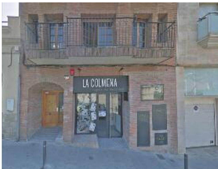
Una imatge de la seu de La Colmena.

D'altra banda, les lectures dramatitzades de textos procedents dels tallers de Freijo tin-