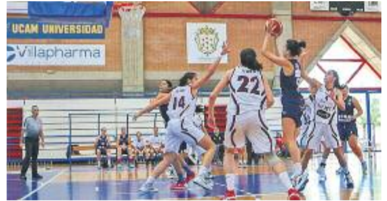
Les liles continuen al capdavant de la classificació.

SANT ADRIÀ ▶ L'Snatt's Sant Adrià continua sent una piconadora. Les adrianenques van aconseguir la cinquena victòria de la temporada diumenge passat a Alcantarilla contra l'UCAM Jairis (62-72).