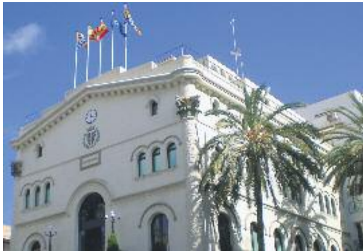
L'OCM vol un Ajuntament més transparent.

El primer pas per aconseguir aquest empoderament ciutadà, segons argumenta l'OCM, és aconseguir un alt grau de transparència de l'administració local. "Demanem a l'Ajuntament que