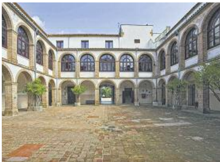
Una imatge d'arxiu de la Conreria.

Juntament amb l'antic seminari de La Conreria, els altres dos punts que exerciran de centre d'acollida inicial a Catalunya seran la Casa Bloc de Sant Andreu, a Barcelona, i l'edifici de les Germanetes dels pobres, a Manresa. Així doncs, els refugiats es repartiran entre aquests tres emplaçaments mentre la Generalitat de Catalunya decideix quina és la millor ubicació per al seu establiment definitiu.