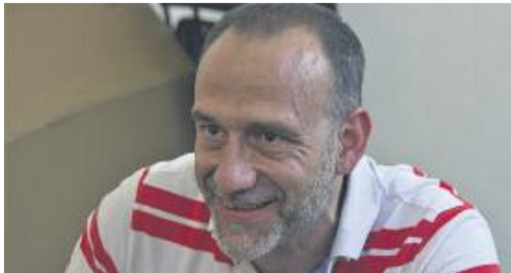
Marginedas oferirà una conferència sobre Síria.

Les Jornades de Pau i Cooperació d'enguany han ofert desenes d'activitats com conferències,