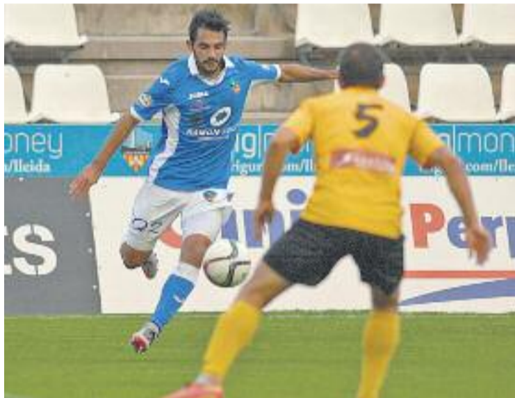
El Badalona va tornar de Lleida amb les mans buides.