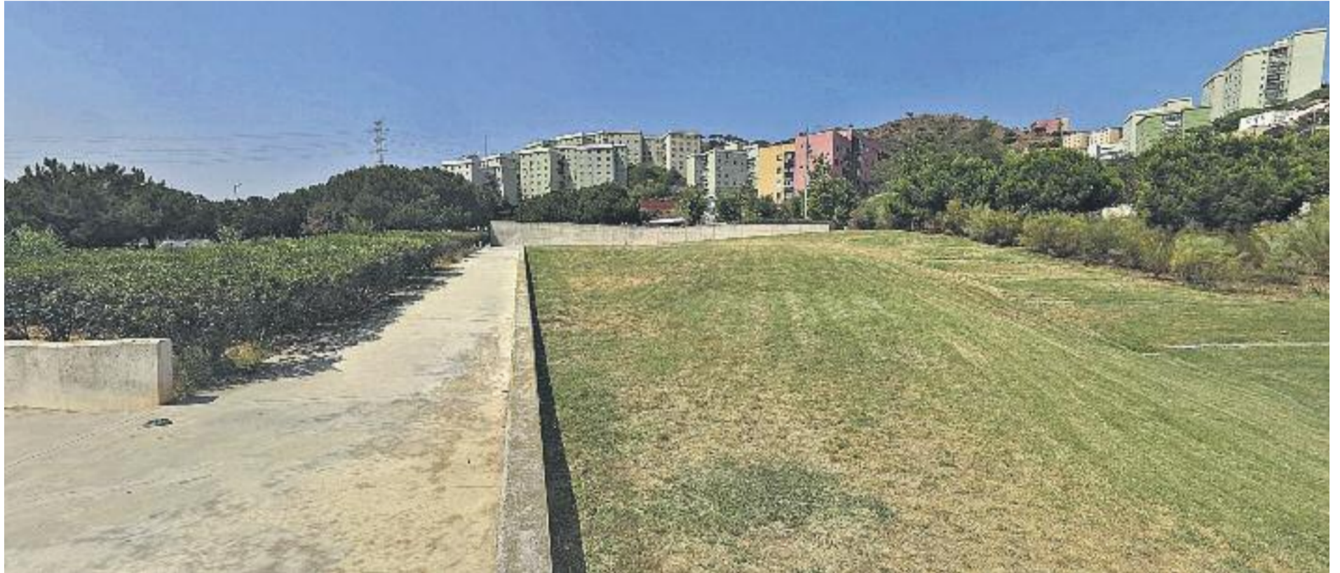
Aspecte actual del Parc de Can Zam.

» La plataforma en defensa de la zona denuncia falta de transparència de l'Ajuntament de Santa Coloma » Els veïns mantenen, després de 40 anys, la demanda de convertir l'espai en un gran pulmó verd