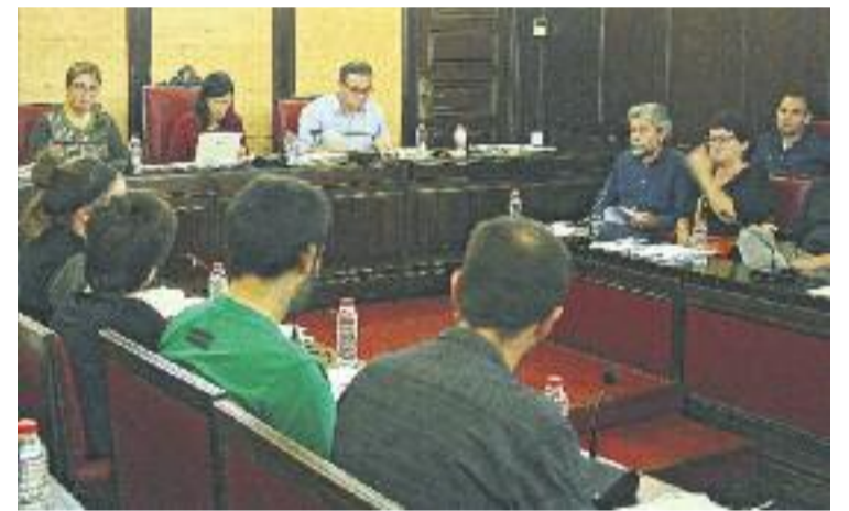
La Diputació va ratificar la declaració del Ple Municipal.

A més, el Ple va reiterar que considera innecessari el projecte de la MAT i va comptar amb les intervencions de representants de la Plataforma en Defensa de la Serra de Marina i Can Zam i de la Federació d'Associació de Veïns de Santa Coloma.