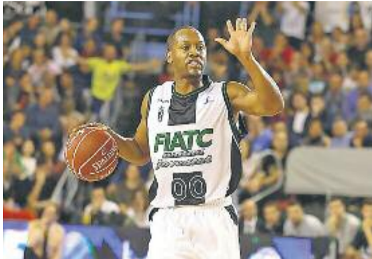
El base de Louisiana va ser clau a Manresa.

La xerrada de Salva Maldonado al descans va funcionar d'allò més bé, ja que els badalonins