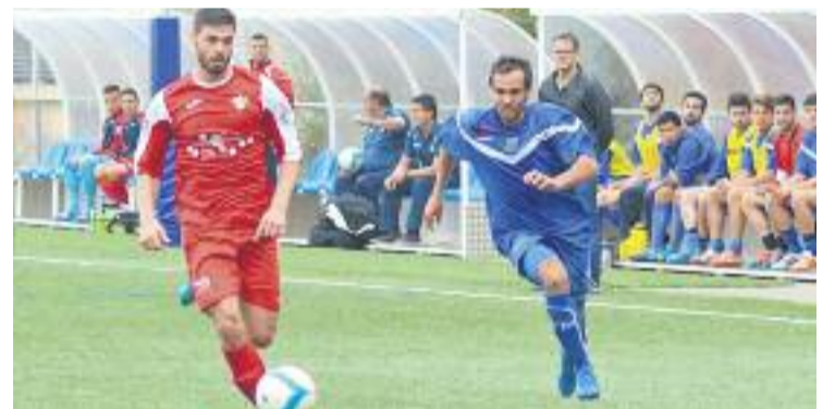
Els barcelonins van aconseguir els tres punts al Municipal.