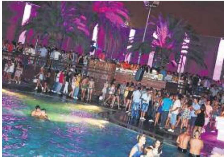
Els terrenys de les piscines van ser concedits per a oci nocturn.