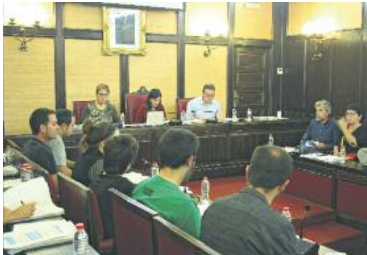
Imatge de la sessió plenària celebrada dilluns.

Pel que fa al principal grup de l'oposició, Som Gramenet, aquest es va abstenir en l'aprovació dels comptes. El regidor Aitor Blanc va aprofitar la seva intervenció per demanar la realització d'una