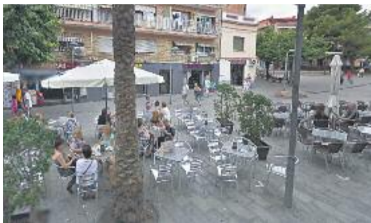
Una de les trobades del juliol es va fer a la plaça del Relotge.

Fins ara les trobades han estat informals i s'hi ha parlat de diversos temes, tot i que la voluntat de l'associació és que més endavant es puguin anar establint temes concrets per tractar cada dia i fins i tot "portar algun ponent que ens pugui il·lustrar sobre alguna qüestió en concret", afegeix Castellví.