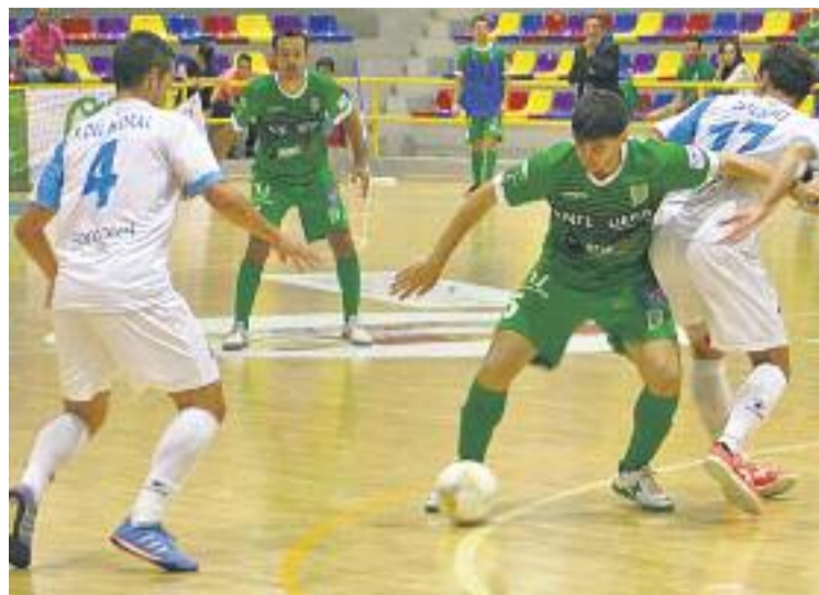
Andalusos i colomencs van empatar a sis gols.

Al minut tres de la represa, Corvo va aprofitar una assistència de Rafa López per situar el Catgas a un gol, però aleshores l'equip va tornar a desconnectar. Tete i novament da Silva van situar un perillós 5-2 quan només faltaven 11 minuts per al final del partit.