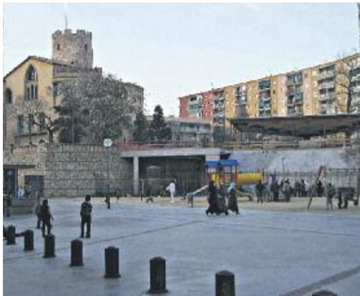
El Museu Torre Balldovina dinamitza les jornades.

Les restes arqueològiques del Molí d'en Ribé representen un dels pocs vestigis del patrimoni preindustrial a la ciutat. Concretament, es tracta de les restes d'un molí fariner baixmedieval mogut per aigua, situat al costat mateix del Museu. Les excava-