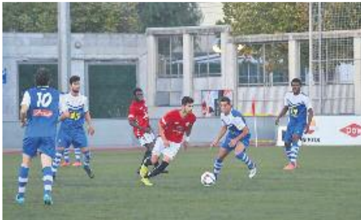
Els pobletans van aconseguir una victòria important.