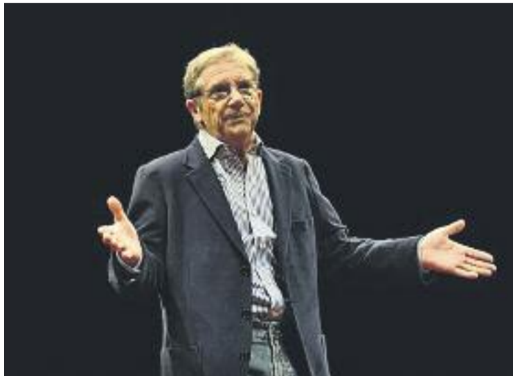
Joan Pera en una imatge d'arxiu.