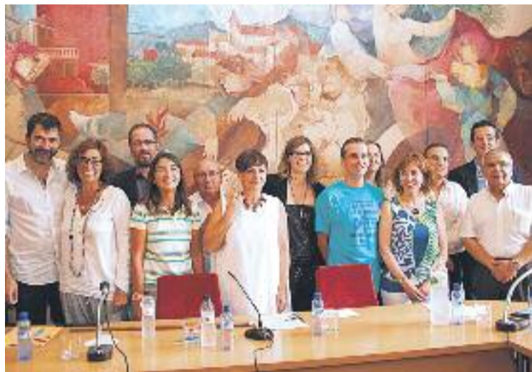
Una imatge d'arxiu dels regidors i regidores del Ple.