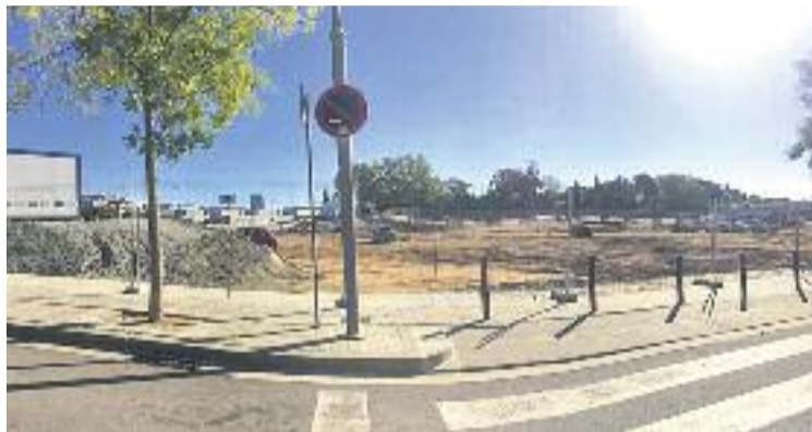
Solar de l'antic camp del Centenari.