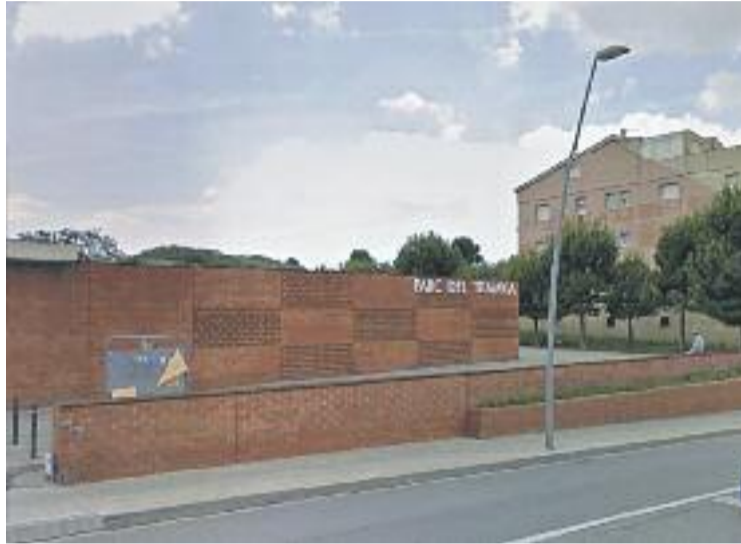
Una imatge d'arxiu del Parc del Tramvia.

El parc ocupa una extensió d'1,5 hectàrees, amb una zona de