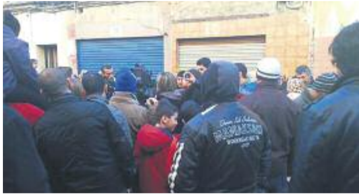
Protestes pel tancament del centre islàmic de la Salut al gener.

Aquesta és la sisena detenció en el marc d'operacions contra el terrorisme jihadista que es fa a Badalona el 2015. Les quatre primeres es van produir l'1 d'abril a Llefia, quan la Guàrdia Civil va detenir dos bessons i el pare i la mare d'aquests, abans que els dos menors viatgessin a Síria per enrolar-se a les files del grup jihadista Harakat Sham al Islam. D'altra banda, la cinquena va tenir lloc el 4 de juliol. En