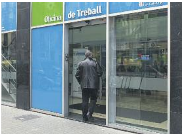
A Santa Coloma és on més ha pujat l'atur.

Valoració agredolça de les dades d'atur registrat el setembre al Barcelonès Nord. Segons les estadístiques publicades per la Generalitat de Catalunya, Badalona, Montgat i Tiana han vist com disminuïa el nombre de ciutadans inscrits a les llistes de l'atur. Per altra banda, Santa Coloma i Sant Adrià han vist com el seu nombre de persones sense feina ha augmentat.