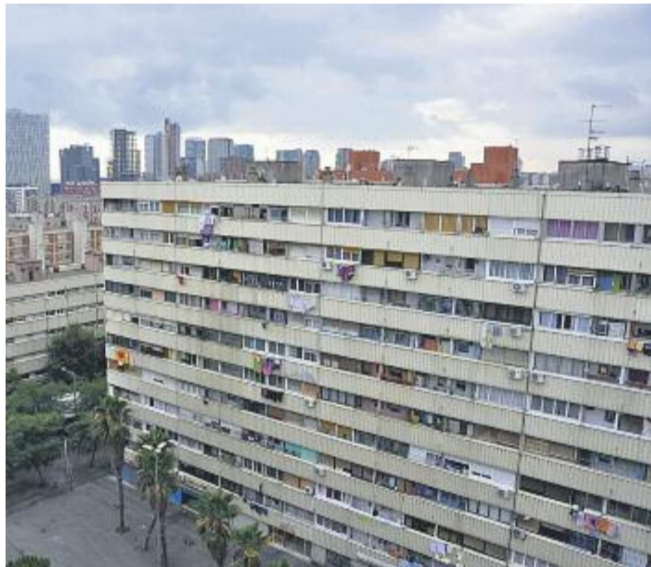
Dues imatges d'arxiu del barri de la Mina.