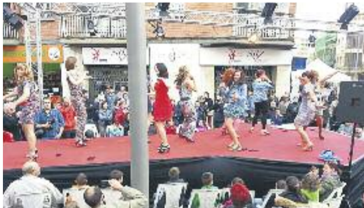
Un moment de la desfilada de l'abril passat.

Aquesta desfilada de moda forma part del programa que fa cada any aquesta associació, que consisteix en dues passarel·les que se celebren a la primavera —la passada va ser a l'abril— i ara a la tardor. "L'objectiu és fer visible el comerç local", expliquen des de l'Ací i asseguren que, de moment, hi ha més de 40 botigues inscrites per participar. És probable que