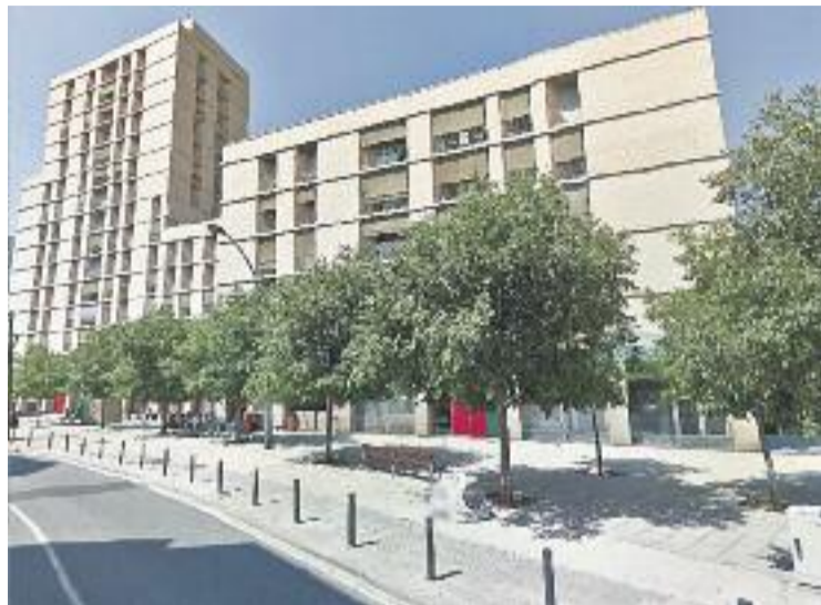
SOM Gramenet va votar en contra del refinançament.

SOM Gramenet, principal força de l'oposició, va votar en contra de les condicions de refinançament en la reunió del Consell d'Administració celebrada di-