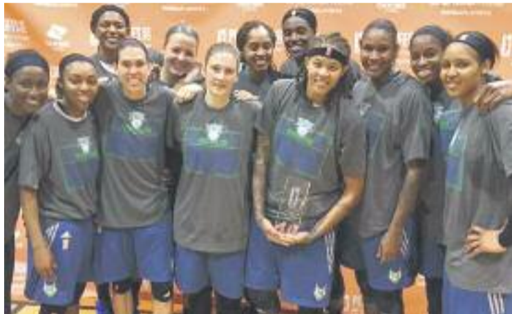
L'equip amb el trofeu de campió de la conferència oest.

Cruz i les seves companyes s'enfrontaran contra Indiana Fever en una eliminatòria al millor de cinc partits que començarà la matinada d'aquest diumenge.