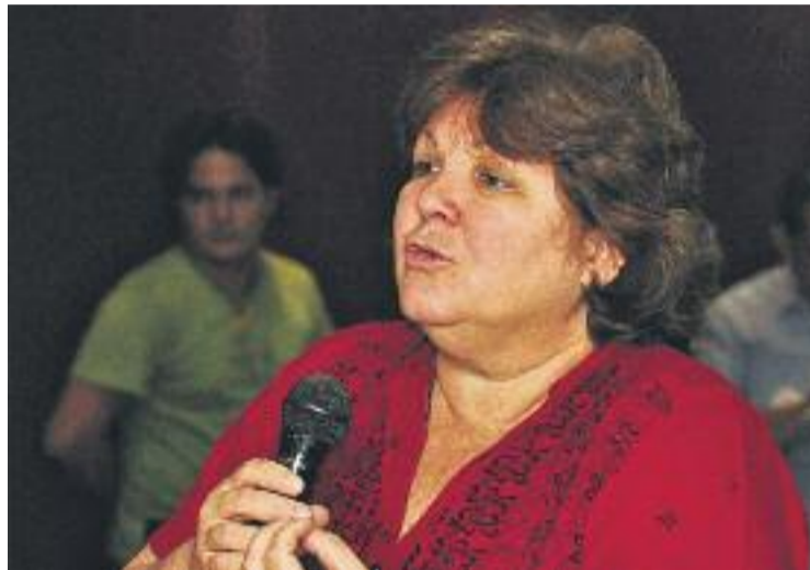
Aleida Guevara, en una imatge d'arxiu.

Enguany, a més, les jornades s'han adaptat al context polític i social actual, molt marcat per la crisi humanitària patida pels refugiats sirians que es veuen obligats a marxar del seu país a causa de la guerra. És per això que la iniciativa es presenta amb el lema de "Santa Coloma, Ciutat de Pau, Ciutat refugi". "La greu crisi humanitària dels refugiats de Síria i la lentitud dels governs europeus ha portat a la ciutadania a exigir en clau europea, però també local, respostes immediates", argumenta l'alcaldessa, Núria Parlon, en un comunicat difós per l'Ajuntament. La batllessa afirma que aquest context ha portat Santa Coloma a implicar-se, juntament amb altres governs locals, per exigir respostes, i també a col·laborar amb les entitats socials per sensibilitzar la ciutadania envers la crisi patida pels refugiats.