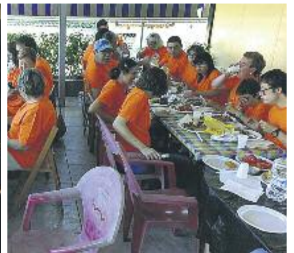
Imatges d'activitats organitzades per Aspamoti en el marc del seu 25è aniversari.

cessitat de ser un referent per a les famílies. "Han de saber que estem disposats a acollir persones amb qualsevol tipus de discapacitat", afirma.