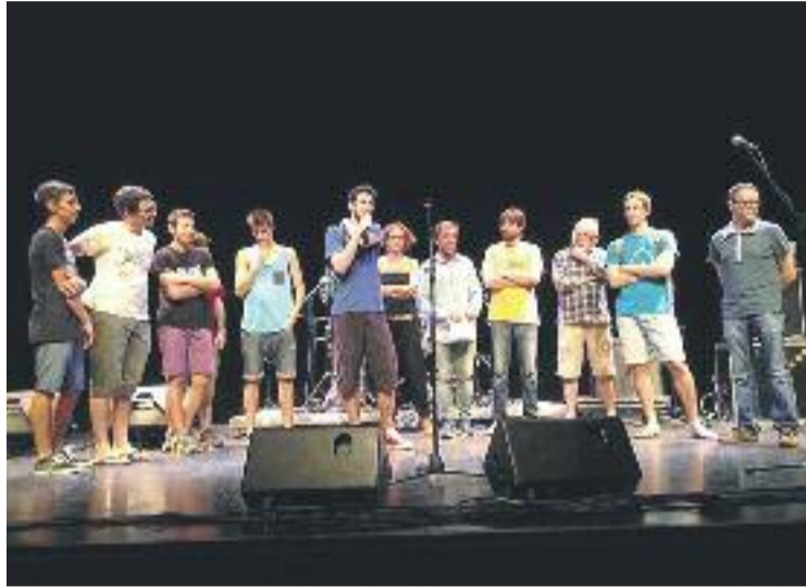
'Un gos robant' va ser el grup guanyador de l'any passat.

La iniciativa divideix els participants en dos grups. El primer integrat per joves de 16 a 20 anys, i el segon per aquells que