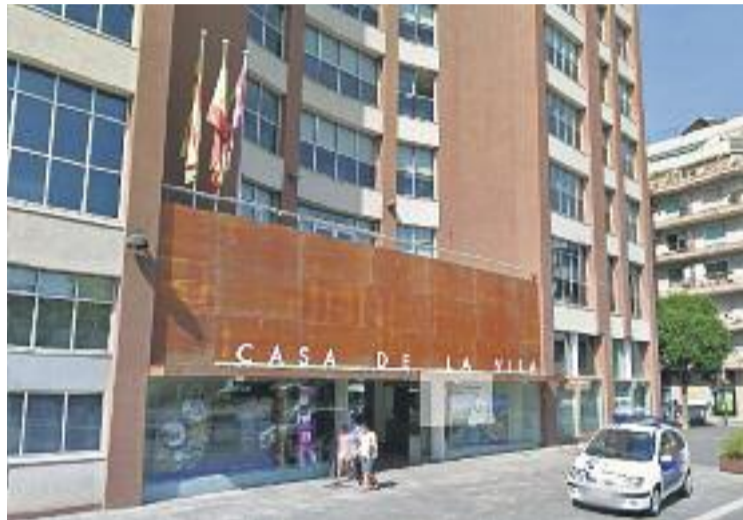
Sant Adrià no formarà part de l'AMI.

Per la seva banda, Sant Adrià en Comú defensa que la voluntat d'adherir-se o no a l'AMI ha de sorgir de la ciutadania, i explica que per això van consultar la decisió a la seva assemblea, que finalment va optar per l'abstenció. "Nosaltres vam proposar celebrar un referèndum popular per prendre la decisió, i mante-