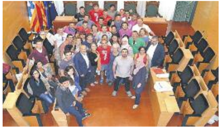
El govern va rebre les entitats a la Sala de Plens.

Més enllà de treballar conjuntament amb entitats internacionals, La Rotllana també realitza demandes concretes a l'Ajuntament. Entre d'altres, l'associació demana suport al seu club de corfbol, ja que asseguren que esports minoritats com aquest ajuden a transmetre valors educatius i cooperatius.