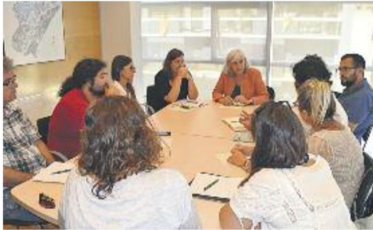
L'Ajuntament va traslladar a ZEM la decisió de la Generalitat.

En aquest sentit, la Plataforma Zona Educativa de Montigalà (ZEM) valora positivament la decisió del govern català, però amb reserves. "Ja fa molts anys que lluitem i ara es produirà un canvi de govern a la