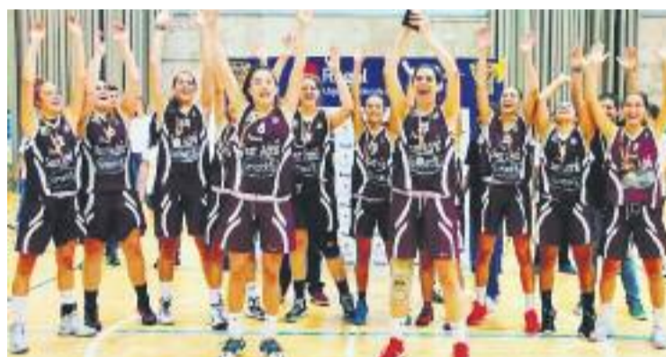
Les adrianenques van aconseguir el seu sisè títol.