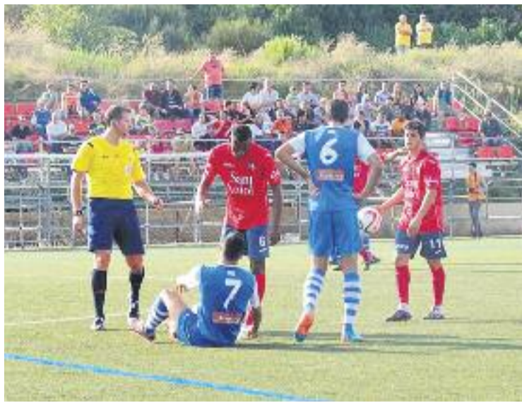
Els davanters escapulats no van veure porteria.

Aquest diumenge a les 6 de la tarda, els badalonins visitaran