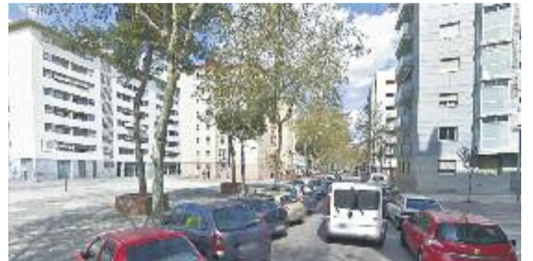
Una imatge d'arxiu de la zona on es van produir els fets.