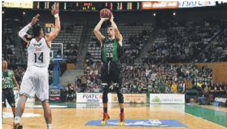
Suárez és un ala-pivot balear de 22 anys.

El Reial Madrid va fer efectiva dilluns la clàusula de rescissió que l'unia a l'entitat badalonina -300.000 euros- i formarà part de l'entitat blanca en els pròxims anys, tot i que la temporada que ve no jugarà a l'equip entrenat per Pablo Laso. Els blancs el cediran a un altre equip de la Lliga Endesa perquè agafi forma. En un primer moment es va parlar que Suárez seguís, en condició de cedit, a la Penya, però finalment no serà així. De moment, Bilbao Basket, la Bruixa d'Or i el