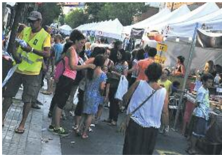
Bufalà Comerç va celebrar la seva primera Summer Shopping.