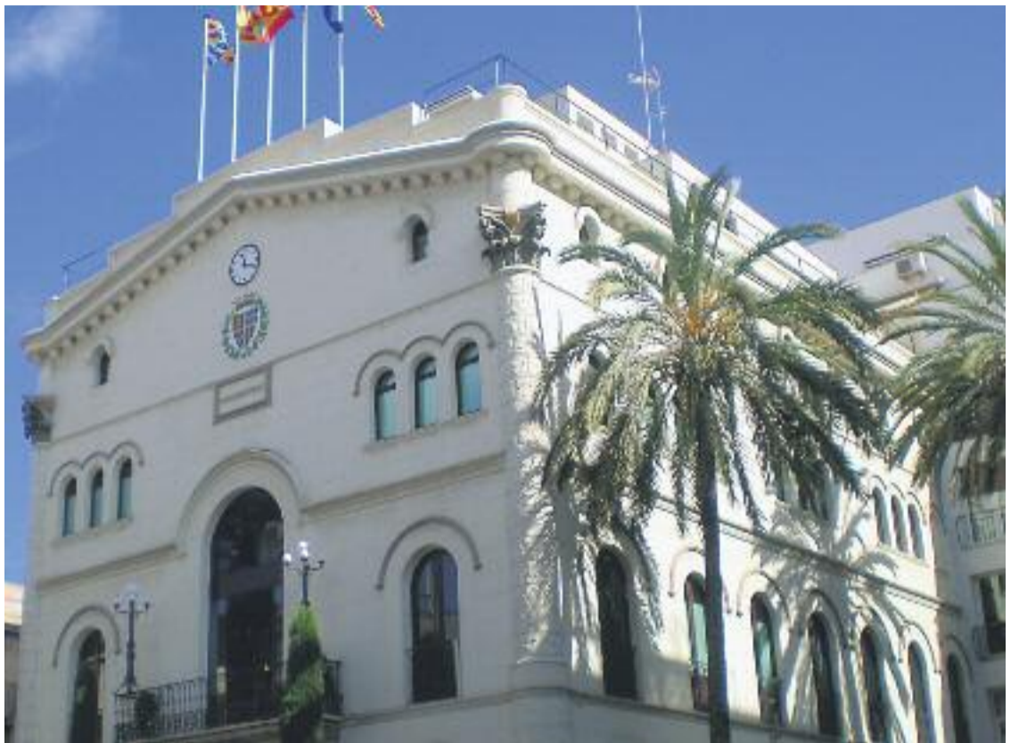
Un moment d'un Ple del mandat passat (esquerra) i una imatge de l'Ajuntament (dreta).