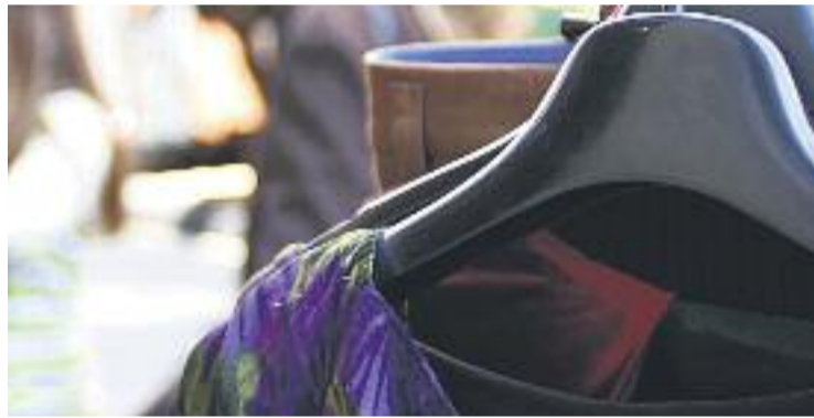
Badalona té tres mercats de marxants.

Amb aquest decret, el Govern vol donar "estabilitat" i "desenvolupar" la professió de marxant, un sector que dona feina actualment a més de 8.000 persones de manera directa, distribuïdes en 5.950 empreses diferents. Només a Catalunya, a més, hi ha 570 mercats de marxants de periodicitat setmanal, tres dels quals estan a Badalona: els encants del Parc de Montigalà, els del Turó d'en Caritg i els de la Salut.