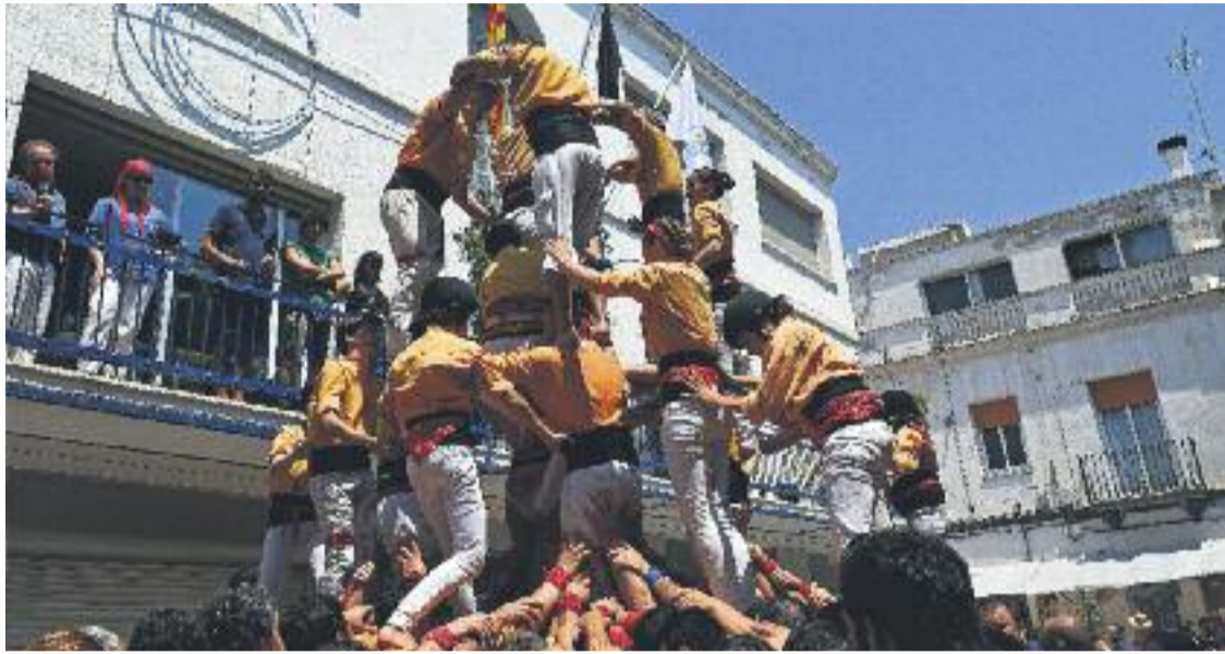
Els badalonins també van aconseguir el cinquè quatre de set amb agulla de la temporada.