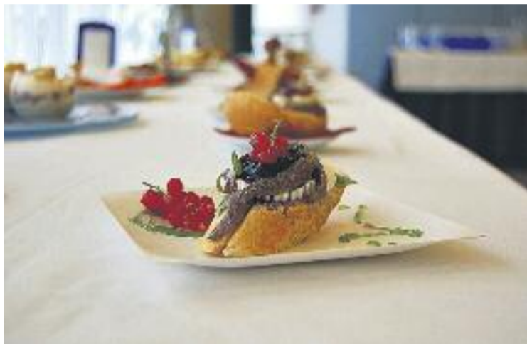
La Ruta de la Tapa va començar el 10 de juliol.

En aquesta ocasió hi participen un total de 34 establiments distribuïts pels diferents barris de la ciutat, cadascun dels quals oferirà una creació especial per a la ruta. Les tapes oscil·len entre la tradició i la modernitat, amb presentacions dignes de l'alta cuina i unes altres fetes amb