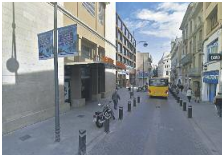
El Teatre Principal va acollir ahir la Nit Literària.