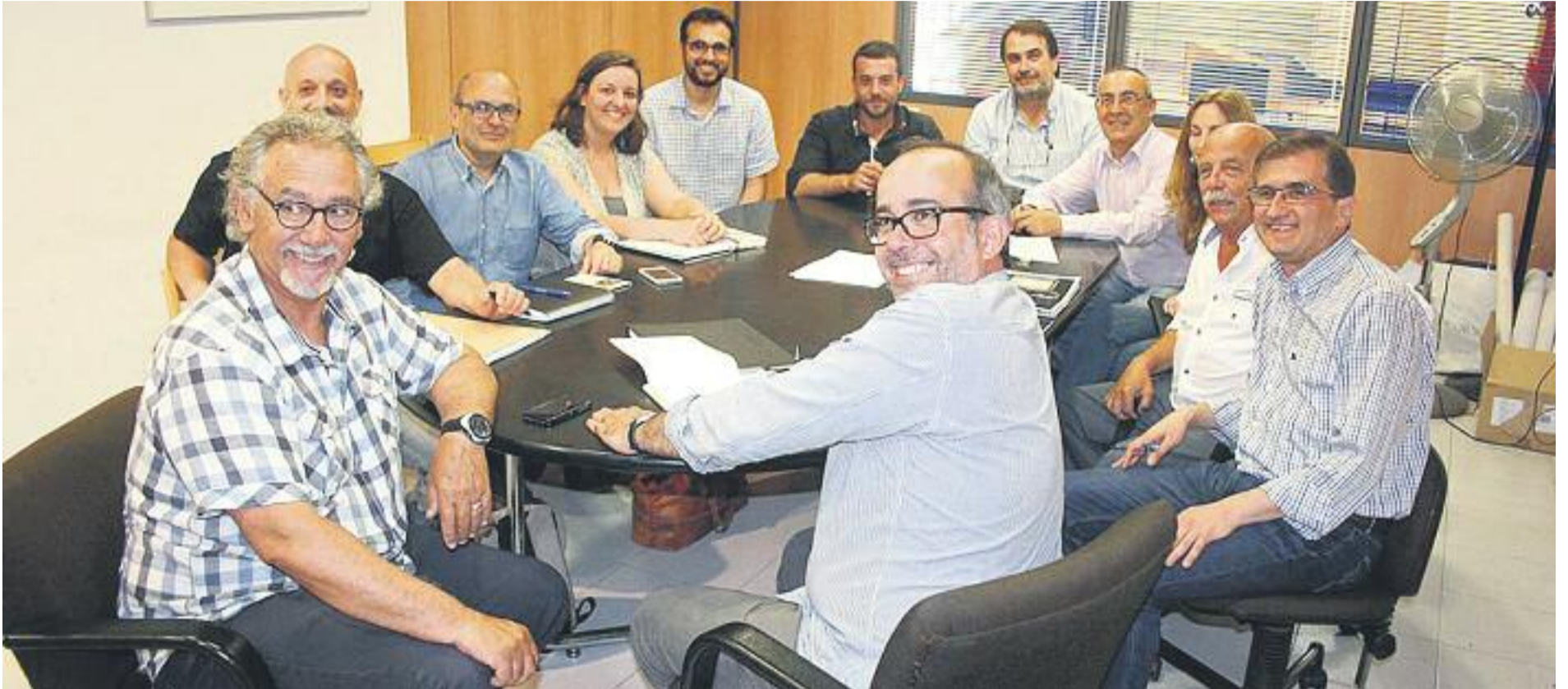
Les bones sensacions de la primera reunió a quatre bandes van anar deixant pas a un clima entorpit que ha acabat amb l'anunci que el PSC es queda a l'oposició.

» Finalment els socialistes no seran al govern, segons assegurin, perquè no els hi han volgut » Guanyem, ERC i Iniciativa diuen que “el moment de formar govern era abans de la investidura”