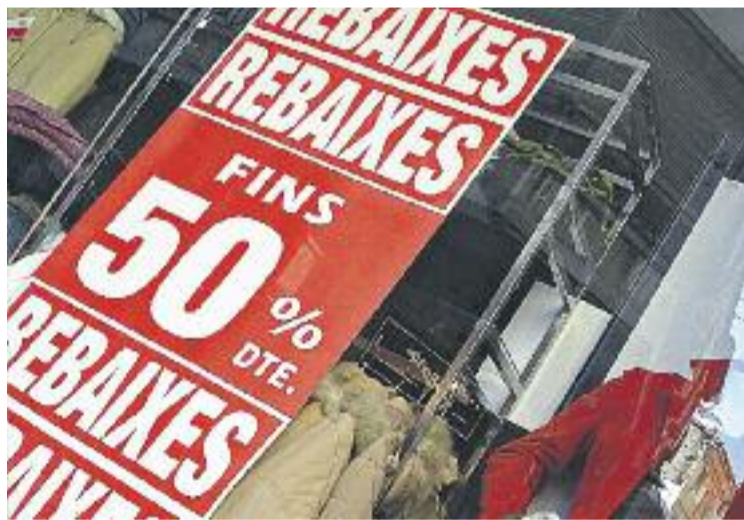
Les rebaixes d'estiu ja han començat i finalitzaran el 31 d'agost.