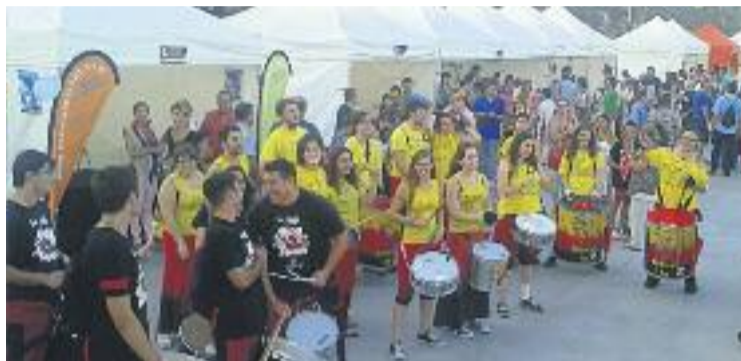
L'acte sol comptar amb actuacions musicals i batucades.

Per tastar les elaboracions caldrà treure un tiquet d'1,75 euros –hi haurà tapes més el-