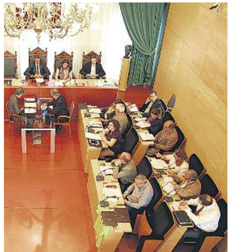
Imatge de la roda de premsa dels pesos pesants del nou govern per exposar el cartipàs (esquerra) i una sessió del Ple del mandat anterior (dreta).