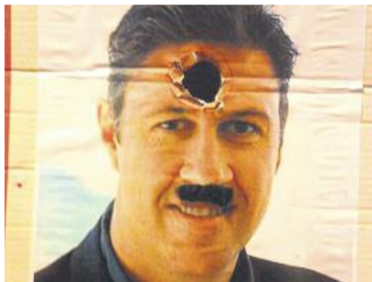
La imatge que va publicar Téllez al seu Twitter.

En una publicació al mur del seu Facebook, Albiol ha assegurat que "a veure si així comencen a tenir clar que per molt radicals que siguin no tenen impunitat". D'altra banda, des del Casal Antoni Sala i Pont, el lloc on es va fer la celebració del carnestoltes, han afirmat en un comunicat que "la foto forma part d'un joc que consisteix a llençar castanyes a la cara dels polítics i altres personatges públics impopulars".