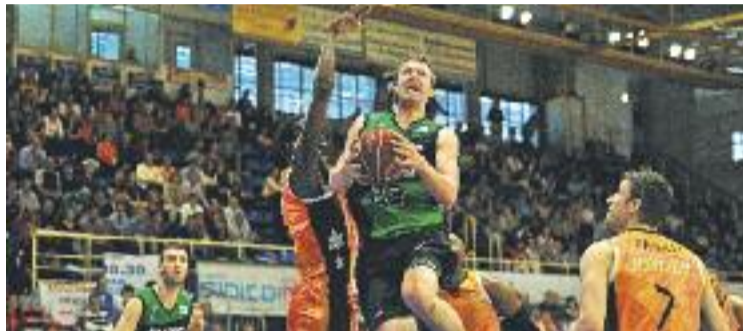
Després d'haver-se classificat, la Penya no jugarà l'Eurocup.

Villacampa també explica al comunicat que s'han intentat trobar "vies alternatives de finançament" amb el patrocinador principal i les institucions, per tal de fer front als "costos derivats d'una competició que no aporta cap retorn econòmic als equips que hi participen".