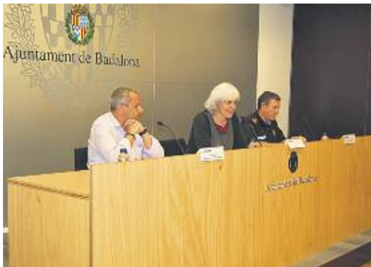
Roda de premsa on es va fer l'anunci.

Aquest va ser un dels principals compromisos dels partits que ara formen el govern de la ciutat. La unitat Omega, tot i que ja existia amb anterioritat a l'etapa Albiol, va ser recuperada i modificada per l'excalde. De fet, el mateix Albiol ja ha sortit a criticar la decisió del govern local, el qual, segons el popular, "demostra el seu enorme desconeixement de la realitat social de Badalona", ja que "aquesta unitat garantia el manteniment de l'ordre en situacions complexes". El president del grup municipal del PP considera que aquesta ha estat "una decisió