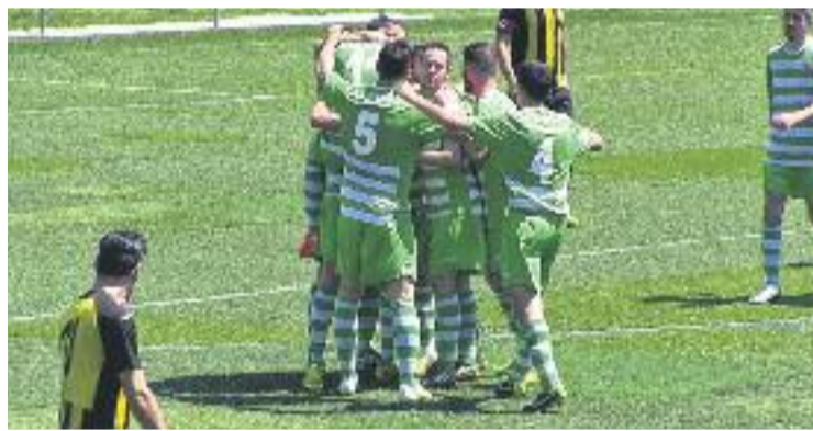
El Cerdanyola és un equip de mitja taula a Tercera.

FUTBOL ▶ El Badalona ja comença a conèixer el seu calendari de partits durant l'estiu. La competició oficial arrencarà amb la primera eliminatòria de la Copa Catalunya Absoluta, que enfrontarà el Badalona amb el Cerdanyola FC el dissabte dia 1 o el diumenge 2 d'agost—encara no se sap la data exacta— al municipal de les Fontentes, a la localitat vallesana.