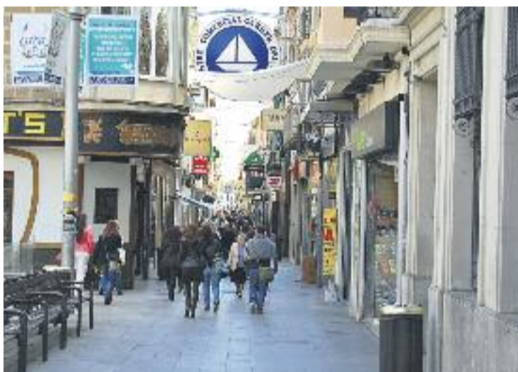
Les vendes a Catalunya augmenten per novè mes consecutiu.

Per altra banda, les dades d'ocupació en el sector del petit comerç també són positives segons l'estudi de l'INE, ja a Catalunya la contractació augmenta un 1,1%, seguint la línia de tot l'Estat –on creix a 12 comunitats autònomes–.