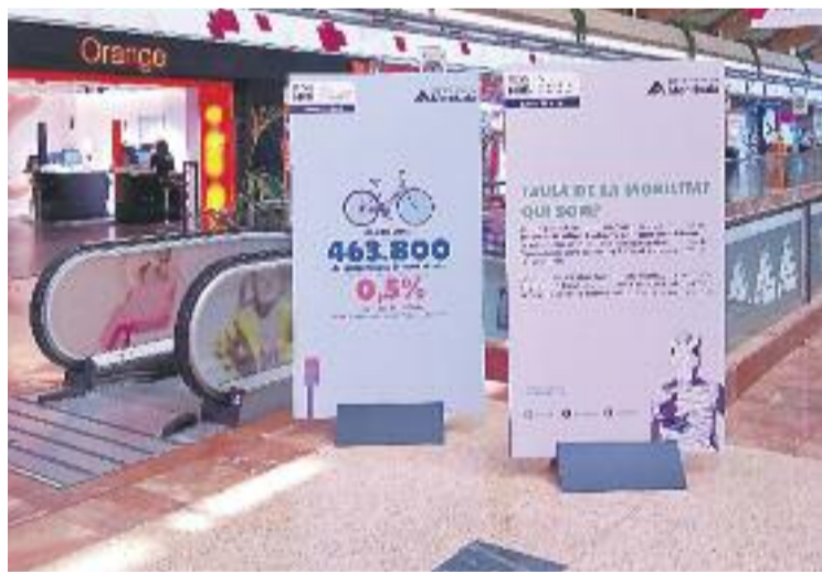
La mostra sobre els beneficis de la mobilitat sostenible.