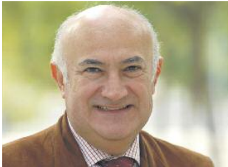
Jurado ha estat absolt del delictes del qual se l'acusava.

Els fets jutjats es remunten al juliol de l'any 2012 quan l'Hermandad Rociera Andaluza Virgen del Rocío que el va acusar d'entrar a la força i sense ordre judicial a la seu de la seva entitat, juntament amb agents de la Policia Local, després que l'entitat deixés de pagar el lloguer del local, que estava llogat