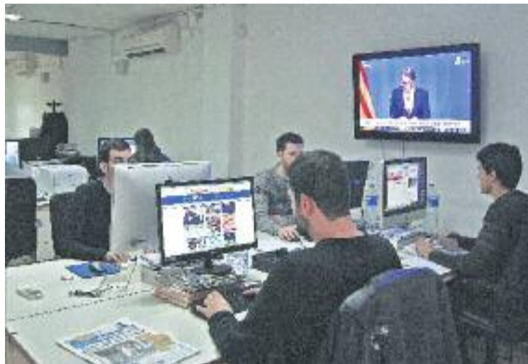
La redacció de la xarxa Línia.

“L'espai mediàtic del Barcelonès Nord no està cobert per una capçalera que englobi tota la zona en una única publicació, i nosaltres volem aspirar a fer-ho,