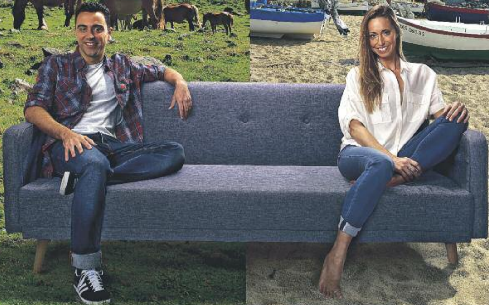
Xavi Hernández | Futbolista Artiga de Lin - Val d'Aran