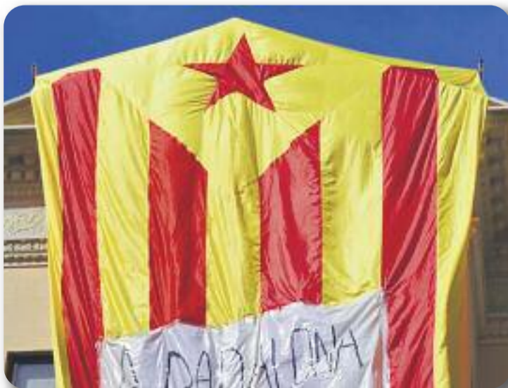
Una estelada gegant va lluir al costat del consistori.