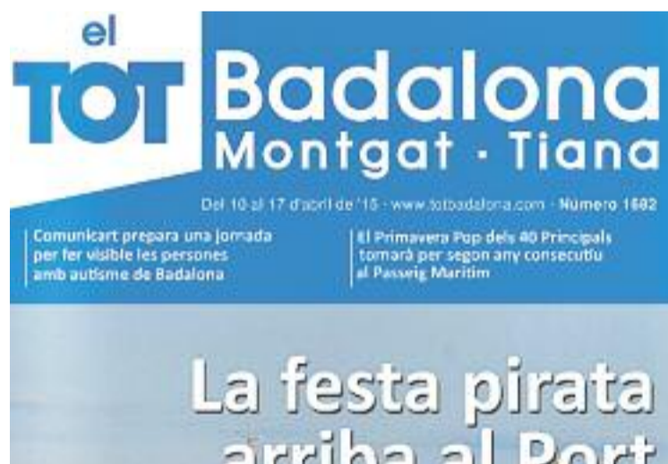
Darrera portada del Tot Badalona.