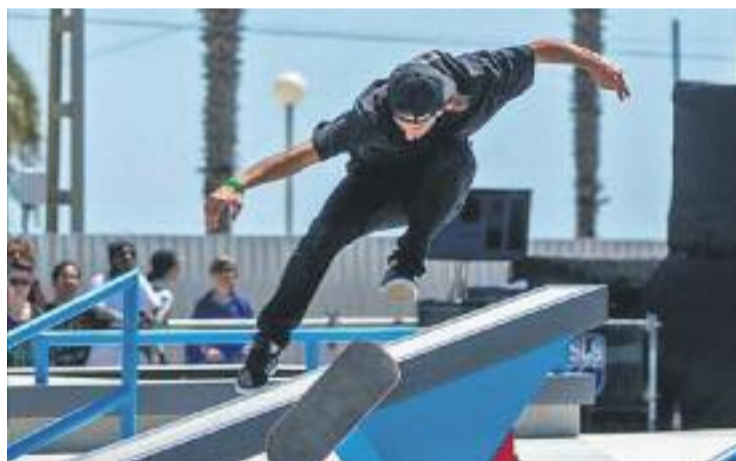
Badalona és una de les destinacions preferides pels skaters.

SKATE ▶ Badalona s'ha convertit en una de les destinacions preferides dels skaters. Després de les competicions internacionals que es van disputar durant el mes de maig, l'idil·li entre els practicants d'aquesta disciplina urbana i la ciutat continua creixent, i ara l'Skate Agora Academy, una de les escoles on s'instrueixen els secrets d'aquesta disciplina, ha anunciat que ha preparat un campus d'es-