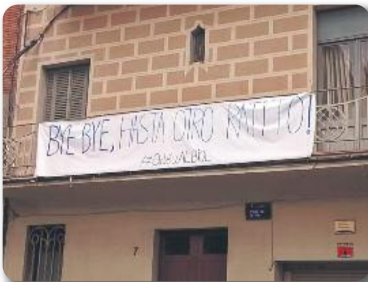
Una de les pancartes que es va poder veure a la plaça.