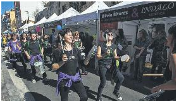
La batucada, com en altres ocasions, obrirà la jornada comercial.

L'esdeveniment arrencarà a les 12 del migdia i comptarà amb espectacles diversos, restauració i, sobretot, comerç. La cita servirà perquè els botiguers del barri mostrin els seus productes i les ofertes en una jornada que comptarà amb tallers