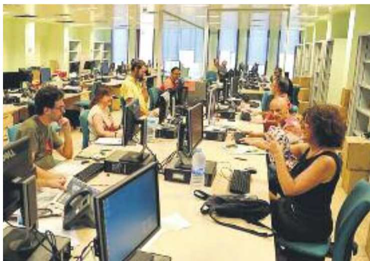
Redacció d'El Punt Avui a Barcelona.

Segons les dades de la primera onada de 2015 de l'Estudi General de Mitjans, El Punt Avui, amb 143.000 lectors (5.000 menys que en l'anterior onada), és la tercera capçalera més llegida a Catalunya, per darrere de La Vanguardia i El Periódico i per davant de l'Ara, el Segre i el Diari de Tarragona.