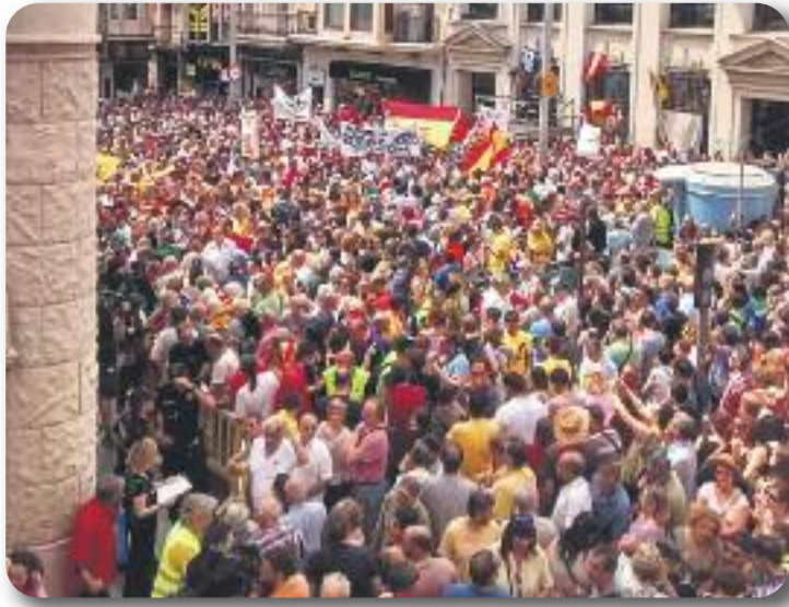
La plaça de la Vila es va omplir de partidaris i detractors.