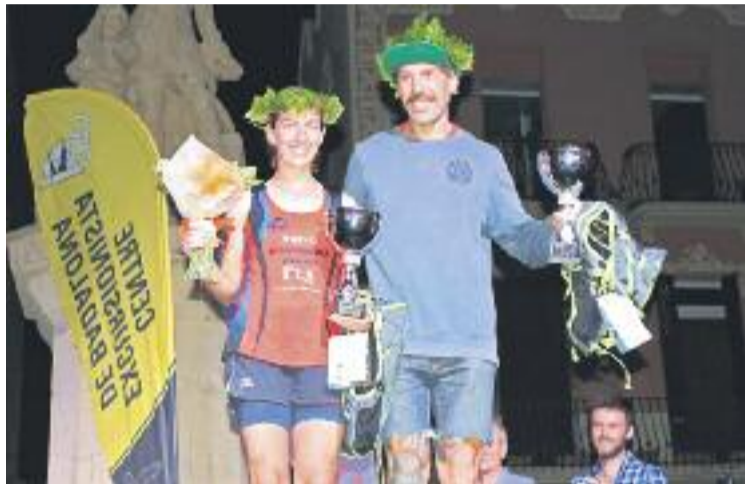
Els dos guanyadors de la prova amb els trofeus.

Magan va completar el recorregut en 1 hora, 12 minuts i 37 segons, un temps que significa una millora de gairebé dos mi-