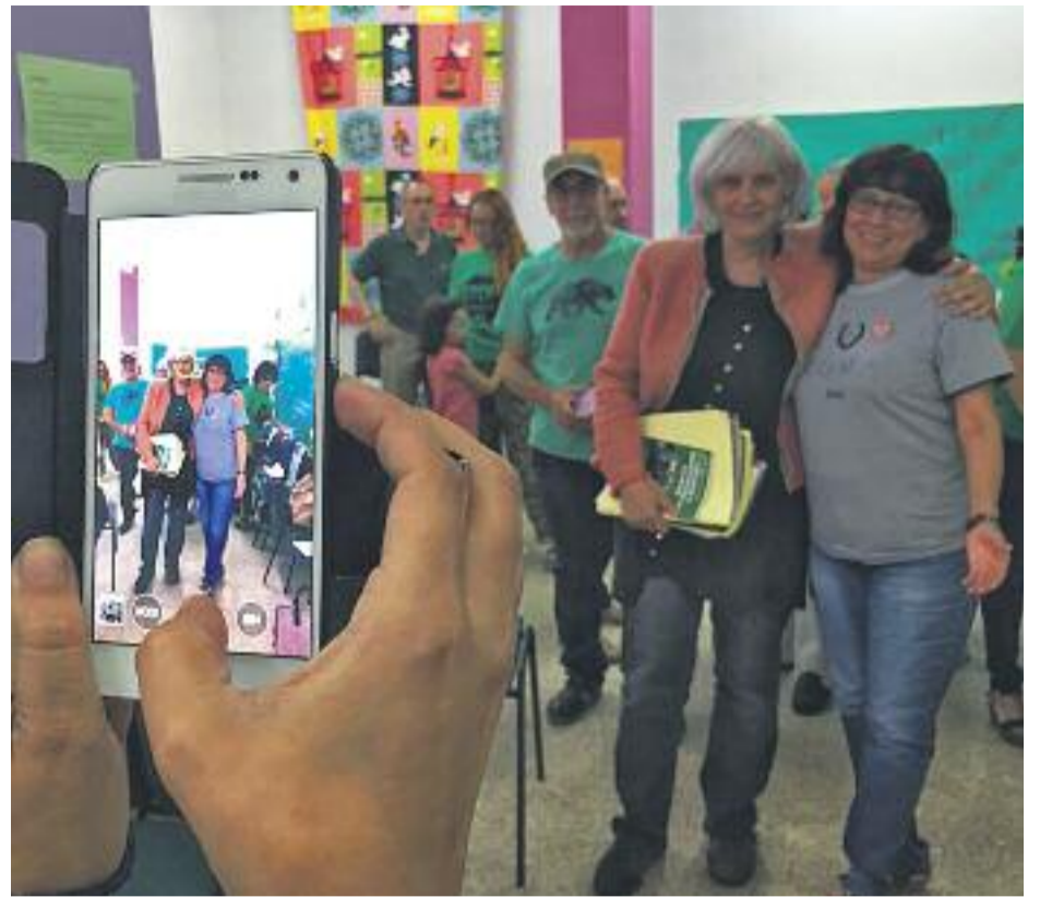
Les primeres reunions del nou govern han estat amb els treballadors municipals "per fer equip" (esquerra) i amb la PAH (dreta).