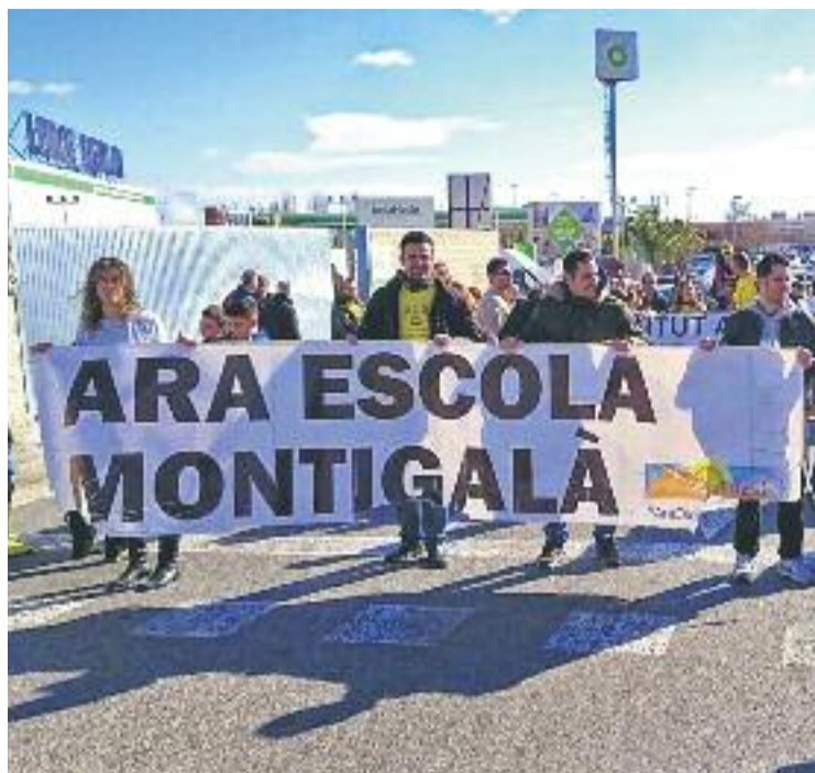
La plataforma, en una protesta del gener on va tallar la B-20.