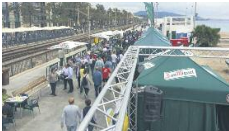
La trobada sempre aplega a un bon nombre de persones.

L'objectiu d'aquesta jornada és promocionar la restauració local, destacant especialment la cuina marinera tradicional, amb plats que tenen els productes del