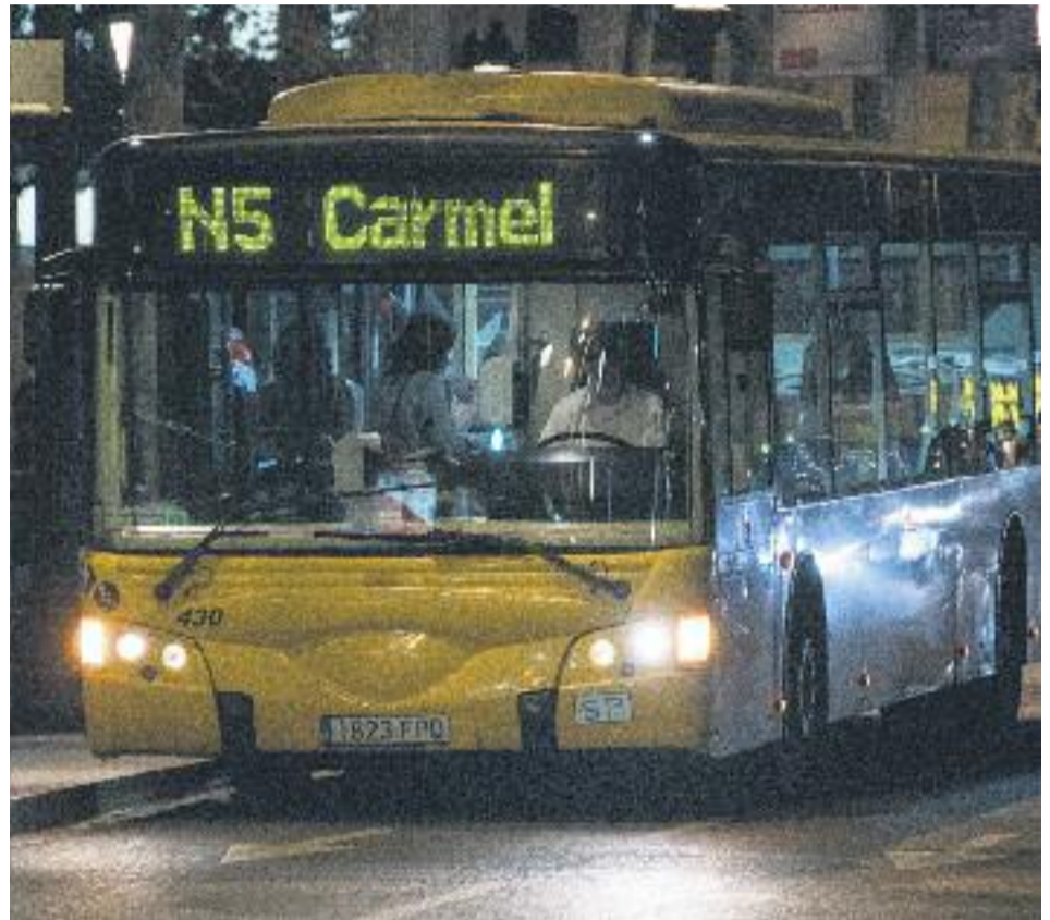
Els treballadors de Tusgsal s'han manifestat per reivindicar la gestió del Nitbus per a la seva empresa, al mateix temps que han rebut el suport de la gent.