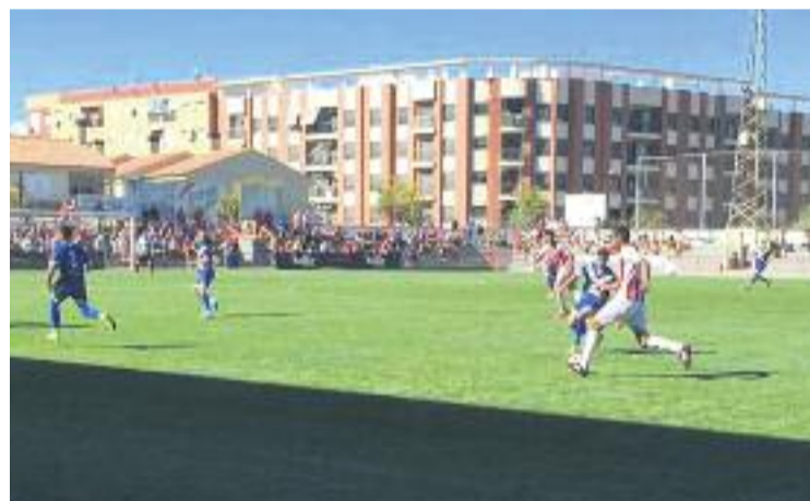
Els escapulats van caure al camp de l'Huracán.

FUTBOL ▶ Una derrota per la mínima contra l'Huracán de València (2-1) va posar el cap de setmana passat el punt final a la temporada del CF Badalona. Els de Torrent s'hi jugaven el play-off i els badalonins garantir la presència a la Copa del Rei, de manera que els entrenadors no van sortir a especular.