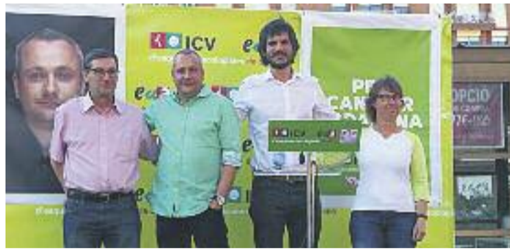
ICV-EUiA considera "xenòfoba" la campanya d'Albiol.

La resposta d'Albiol a la denúncia no es va fer esperar. Segons el batlle badaloní, la denún-