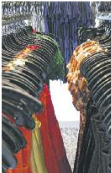
A les botigues al carrer dels dies 8 i 9 van sortir 25 carpes.

Tot i així, la satisfacció a l'associació és evident i expliquen que "repetiran l'experiència".