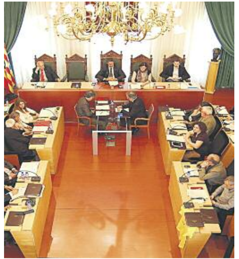
Diumenge els badalonins escolliran qui seran els encarregats de representar-los.