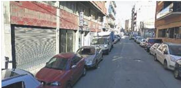
El local on van ocórrer els fets és al carrer Sagrada Família.

L'acusació particular li demana quatre anys de presó, dot-