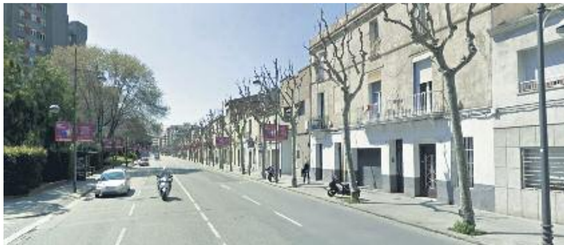
Imatge de l'antiga N-II al seu pas pel carrer Sant Bru.