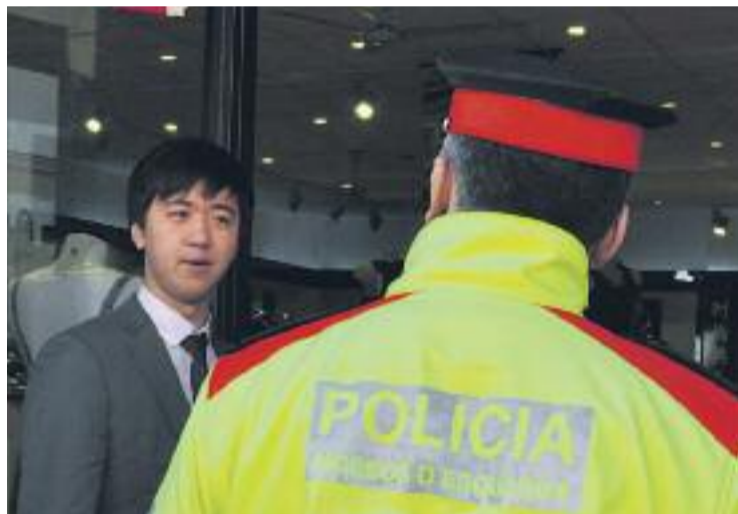
El díptic aporta consells de seguretat pels botiguers xinesos.

Des del primer moment que es va plantejar el projecte tant l'associació xinesa com el Consolat van mostrar-se favorables.