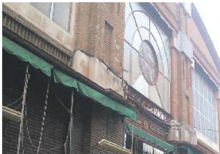
El Ple aprova respectar els elements patrimonials del Maignon.