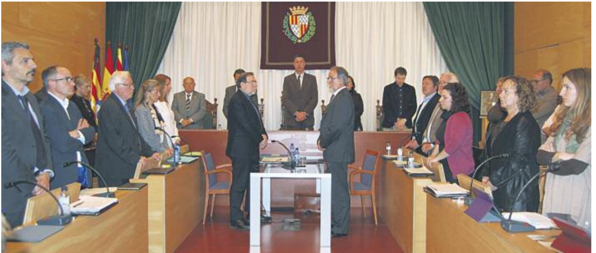
El Ple de l'Ajuntament va celebrar abans-d'ahir un minut de silenci en record a les víctimes de l'accident.