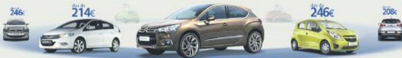
Citroën DS4-1.6 VTI 120 Design 5P 120CV. Preu anual orientatiu amb bonificació.