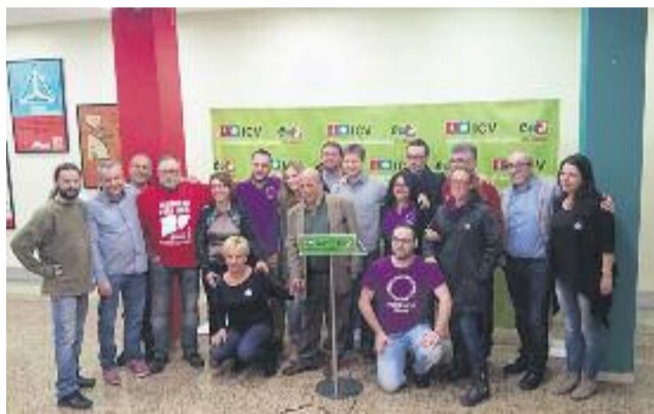
Una imatge de la presentació de l'acord.

Aquest pacte ha estat fortament criticat pel consell ciutadà del partit, que decidirà en els pròxims dies si dona suport a la candidatura Guanyem Badalona. "Desautoritzem la usurpació del nom i la marca Podem Badalona i ens reservem el dret a emprendre accions legals contra els qui utilitzin inapropiada-ment el nom de Podem", avisen amb un to contundent.