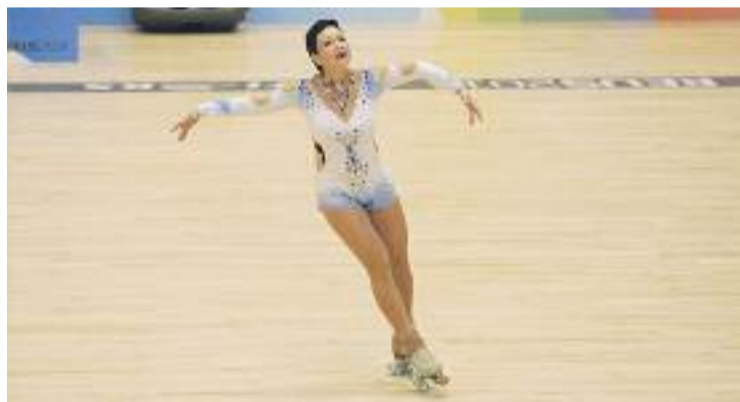
Mlinaric ha superat el càncer en dues ocasions.

PATINATGE ▶ El Palau Olímpic de Badalona acollirà aquest dissabte el Roller Land Badalona, un espectacle de patinatge artístic a càrrec del patinador italià Pierlucca Tocco, considerat un dels millors patinadors del panorama actual.