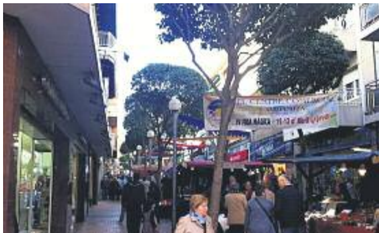
La fira va tenir lloc els dies 13 i 14 de març.

"El mal temps no va deixar que la fira fos com nosaltres volíem", assegura a aquesta publicació Óscar Palma, president de l'associació de comerciants de la Salut, que malgrat això es mostra més aviat satisfet amb la fira, a la qual "va venir bastants visitants, tot i la pluja", rebla.