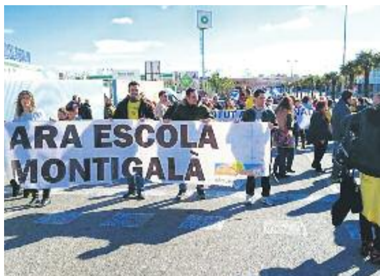
Una imatge de la protesta del passat 31 de gener.

Des del moment que es va conèixer que finalment la Generalitat destinaria 4,5 milions per al Ventura Gassol, la comunitat educativa ja va deixar clar que ho trobava "insuficient" i el passat 31 de gener ho van fer explícit amb una manifestació que va reunir més de mig miler de persones per reclamar "una solució clara", tal com expliquen des de la plataforma ZEM, tant per a l'escola com per a l'institut. La marxa, marcada en tot moment pel seu to festiu, va recórrer els carrers de Montigalà fins a arribar als accessos de la Pota Nord de la