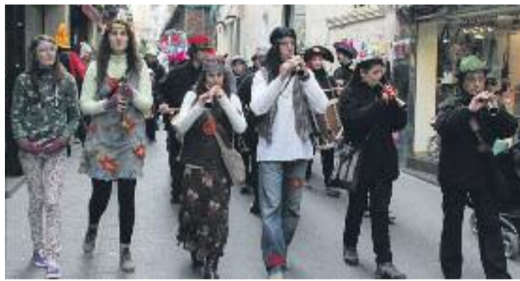
La rua del centre començarà a la plaça Plana.

CELEBRACIÓ ▶ Dijous Gras ja és aquí i la festa de Carnestoltes ja omple els carrers de la ciutat. En aquest sentit, el comerç badaloní ja ha preparat tot un seguit d'actes per celebrar una de les festes més esbojarrades del calendari.