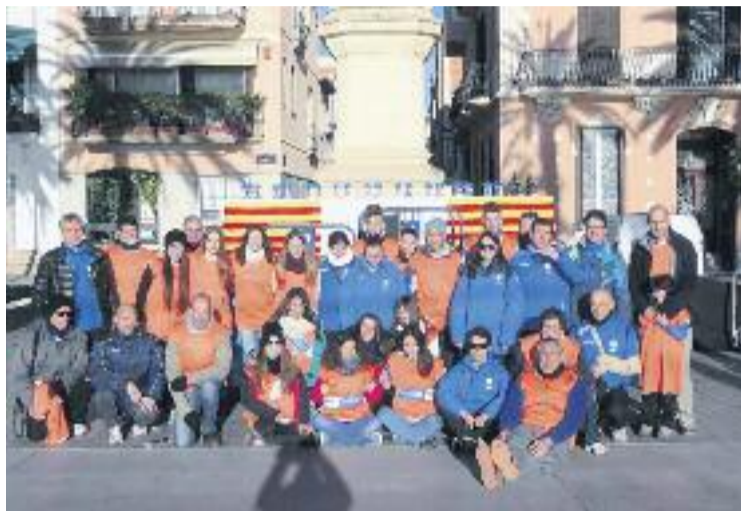
El club organitzador va felicitar els voluntaris de la cursa.