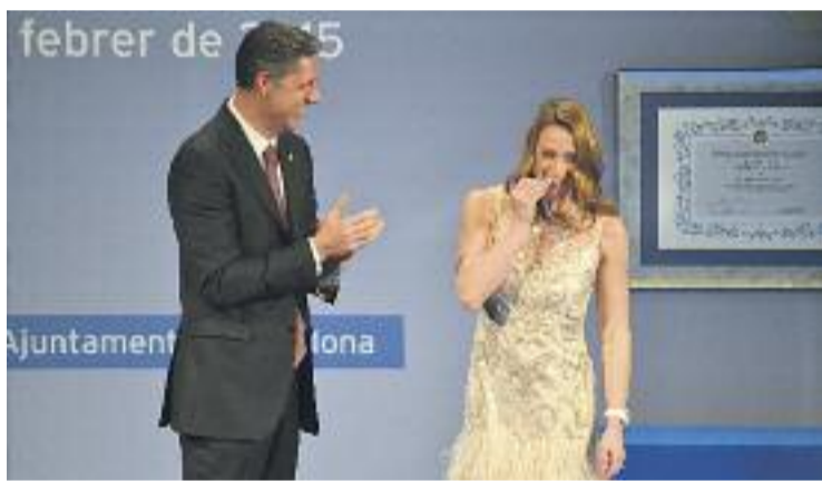
La cerimònia del nomenament va tenir lloc el 2 de febrer.

Per altra banda, la nedadora va recollir abans-d'ahir el premi a la millor esportista de l'any 2014 a la 67a Gran Gala de Mundo Deportivo, on també va ser premiat el pilot de motos cerverí Marc Márquez.