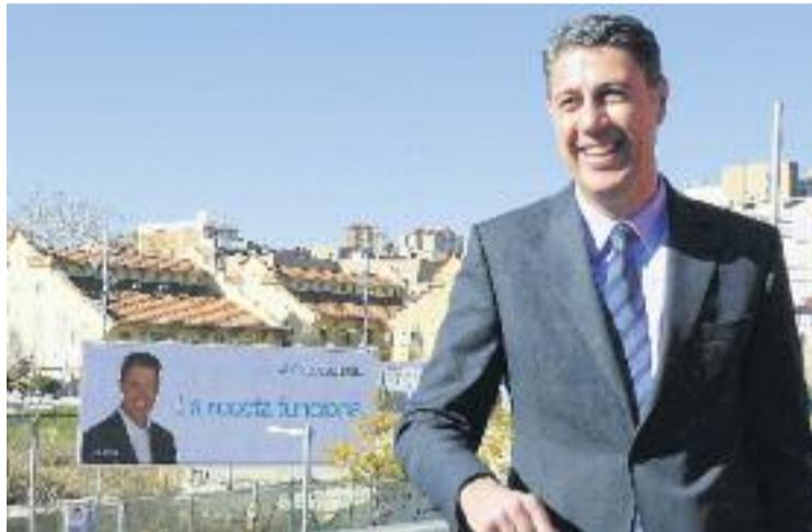
L'alcalde Albiol, amb el cartell del nou lema al fons.

Amb l'elecció d'aquest eslògan, el batlle badaloní deixa clares quines són les seves intencions a mesura que s'acosten les eleccions: insistir en les mateixes qüestions que el van dur a guanyar les eleccions del 2011, com ara la inseguretat, l'incivisme i la immigració il·legal. I és que, tal com va explicar en una roda de premsa que li va servir per treure pit, La recepta funciona és el lema que expressa millor "el sen-