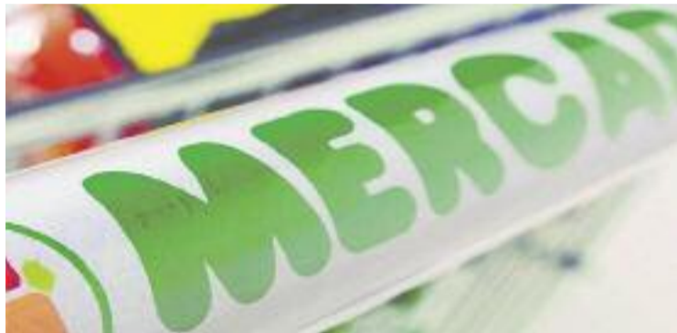
Amb aquest nou centre, Mercadona en tindria 6 a la ciutat.

Arran de l'aprovació inicial del passat mes d'octubre, els botiguers ja van mostrar la seva disconformitat amb un projecte que "perjudica els interessos del