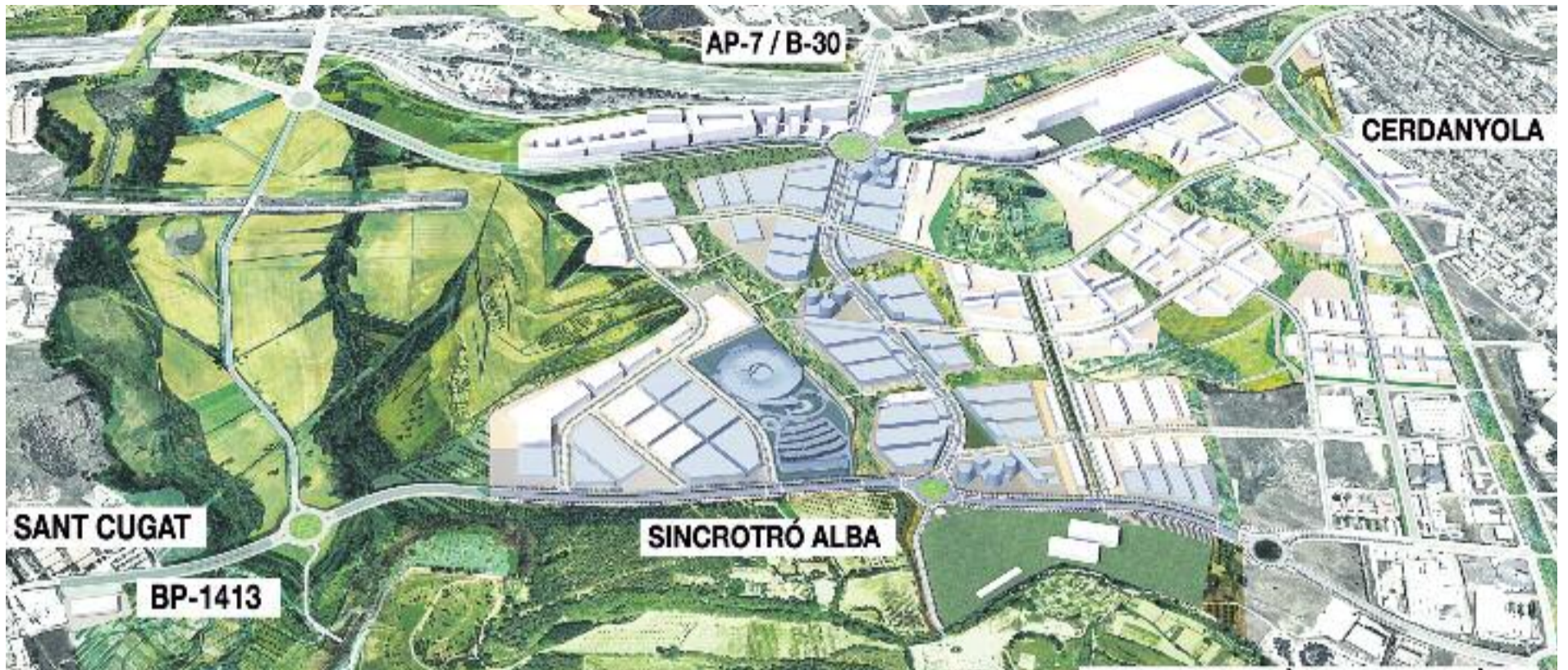
Es preveu construir el centre comercial més gran de Catalunya al costat del Sincrotró Alba, a Cerdanyola.