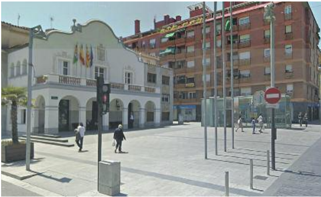
Ajuntament de Cerdanyola.

» Els comptes s'han aprovat amb el vot a favor de PSC i ICV-EUiA, l'abstenció de PP i CiU i el vot en contra de Compromís i ERC