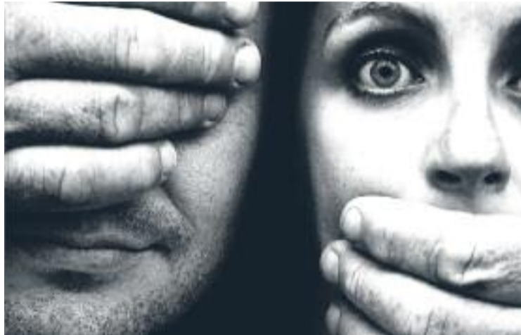
El 70 per cent de les dones han patit algun tipus de violència.

per diferents serveis que intervenen en l'atenció a les dones en situació de violència masclista al municipi de Ripollet.