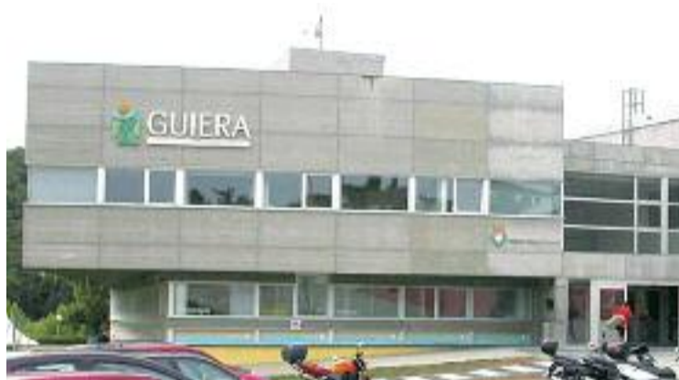
PEM Guiera de Cerdanyola.

L'origen de tot plegat cal buscar-lo 12 anys enrere. L'any 2001, la FCH va invertir set milions d'euros en la construcció del Parc