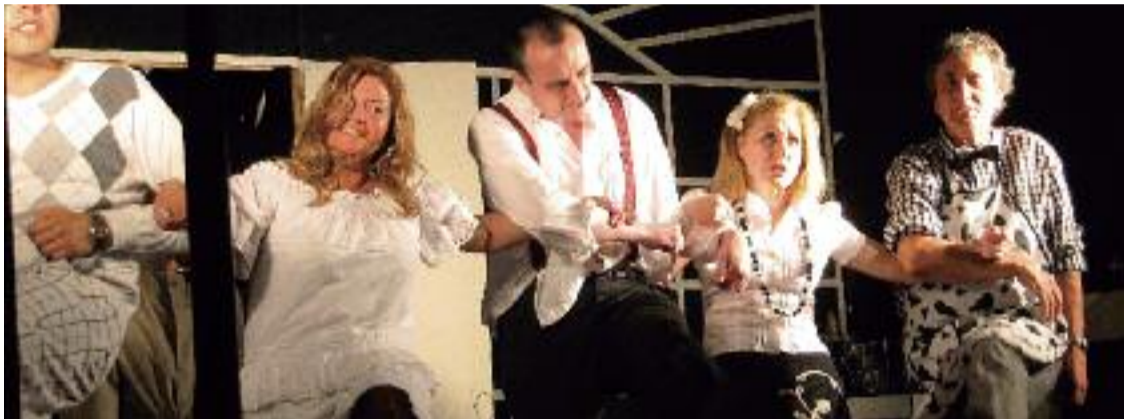
Tres entitats sense ànim de lucre reparteixen aliments de forma gratuïta a 390 famílies.