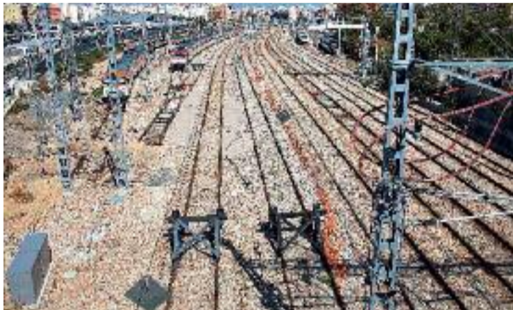
El corredor del mediterrani haurà d'estar enllestit l'any 2030.

El ple del Parlament Europeu va donar el vistiplau al programa Connectar Europa que, amb un pressupost de 29.300 milions d'euros per als 7 anys vinents, dedicarà 23.200 milions a millorar les connexions de transport, 5.120 milions a xarxes energètiques i mil milions més a les telecomunicacions. Amb aquesta aprovació, l'Eurocambra ha confirmat definitivament la inclusió en la llista de projectes prioritaris el Corredor Ferroviari Me-