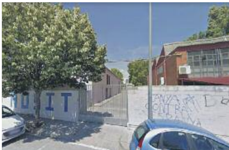
L'institut Palau Ausit en una imatge d'arxiu.

El funcionament de l'aplicació mòbil B-resol és molt senzill. Els usuaris poden alertar de situacions de perill de manera immediata des de qualsevol lloc i moment, tant si són víctimes com observadors. A més, els centres educatius disposen d'una pàgina web de control des de la qual fan el seguiment de les incidències.