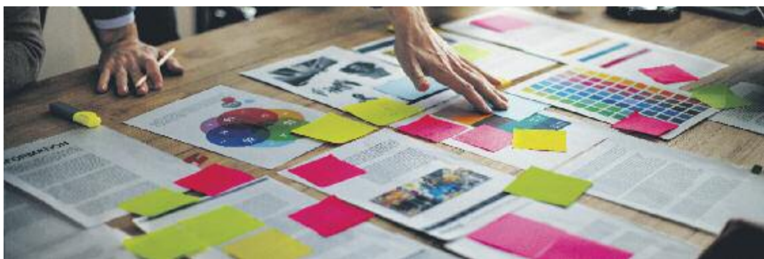
La capacitat d'innovació és una de les grans característiques del Vallès Occidental.

més, el Barcelonès es referma en la primera posició d'aquest rànquing, ja que disposa dels millors sistemes d'innovació comarcals amb molta diferència. La comarca presenta unes condicions molt avantatjoses en bona part dels indicadors analitzats, que en conjunt proporcionen aquest posicionament per sobre de la resta de comarques. De fet, la diferència amb la segona comarca millor valorada, el Vallès Occidental, és de 10,8 punts en l'índex. L'àmbit on destaca clarament és en les externalitats territorials, i això és degut a una concentració de recursos, infraestructures, serveis i capital humà.