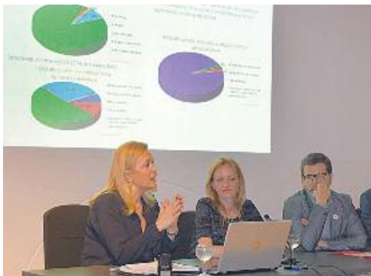
L'estudi es va presentar a principis de maig.

Pel que fa a l'oferta, es registren bons resultats a nivell d'establiments alimentaris, en la relació qualitat-preu dels productes i en la sensació de proximi-