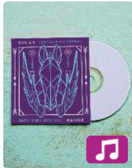
Justicia universal Dorian

Torna el rock electrònic de Dorian. La banda, activa des del 2004, llança el nou disc Justicia universal (Intromúsica Records, 2018), el seu cinquè treball discogràfic, gestat en un llarg procés de dotze mesos. L'energia i el so característic de Dorian aniran de gira per l'Estat espanyol i viatjaran a capitals de l'Amèrica Llatina i els Estats Units.