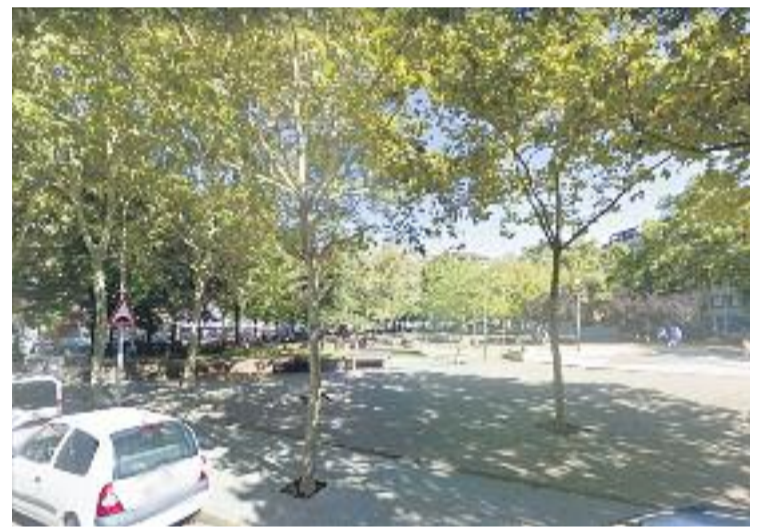
Una imatge d'arxiu de la plaça de la Unitat.

Des de l'Ajuntament s'està planificant una primera sessió informativa per parlar amb els veïns sobre els primers avenços d'aquests treballs i, també, per resoldre els seus dubtes.