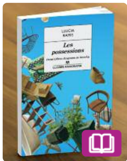
Les possessions Lucía Ramis

Les possessions indaga sobre el passat d'una família -la seva- i d'un país, i reflexiona sobre les relacions amoroses, la construcció de la pròpia identitat i el sentiment de pertinença en un lloc concret, conscient que res dura per sempre.