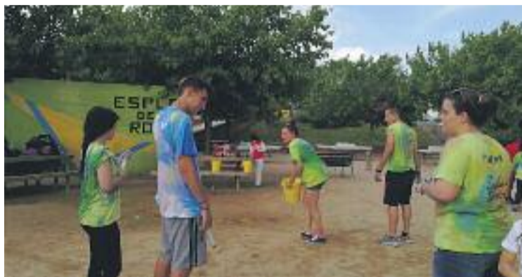
Els veïns van participar en tots els actes.

Dissabte 5 de maig va començar amb propostes esportives, com la tercera edició del Duatló infantil o el Trofeu Roser de Maig de patinatge artístic. Els veïns també van poder gaudir durant el matí de diferents acti-