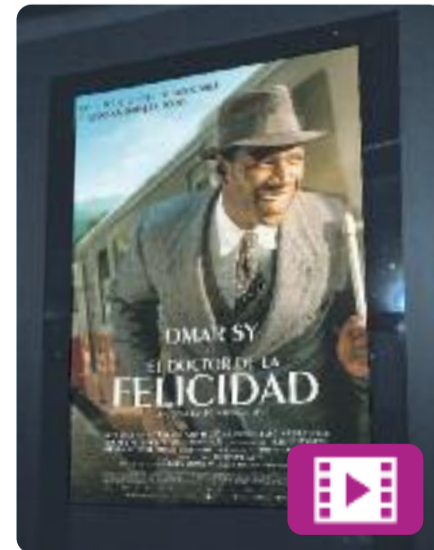
El doctor de la felicidad Lorraine Levy

Omar Sy és Knock, un estafador que arriba al petit poble de Saint-Maurice convertit en metge per intentar convèncer els veïns que una persona sana és algú que ignora que, en realitat, està malalta. Això fa que vulgui convèncer tothom que necessiten la seva ajuda per curar-se. Tot canvia quan una noia es creua en la seva vida.