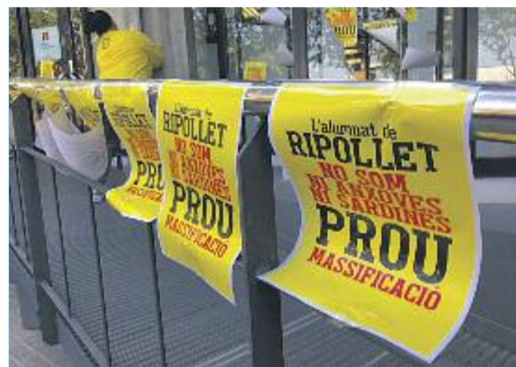
Els manifestants van repartir aquests cartells.

De cara al curs vinent, la Generalitat preveu portar a terme la instal·lació d'un mòdul a l'institut Can Mas per tal de fer front a l'augment de la demanda, després de rebutjar la idea de tirar endavant els projectes d'instituts de les escoles El Martinet i Els Pinetons.