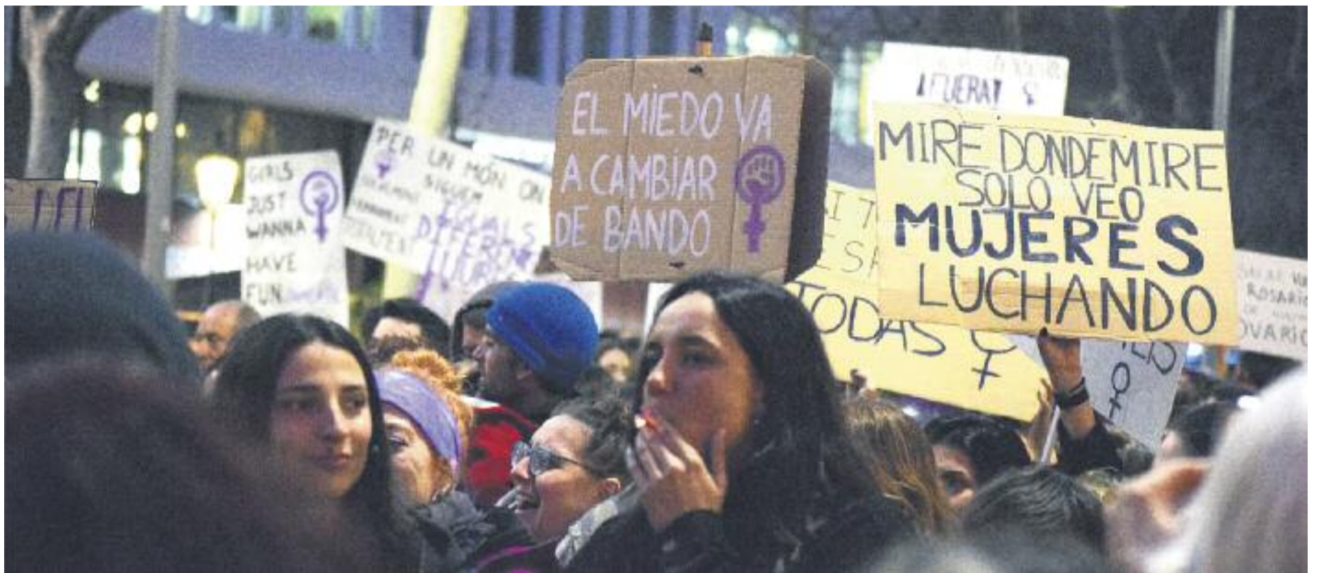
El feminisme es planteja cap on ha de focalitzar el seu missatge després de la polèmica sentència de la Manada.