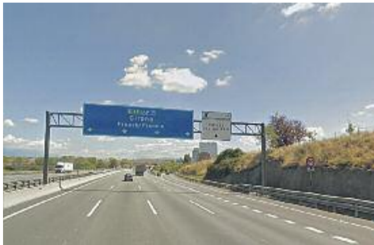
El radar controlarà la velocitat d'un tram de l'AP-7.

El radar controlarà la velocitat dels vehicles en un tram de sis quilòmetres de l'AP-7 en sentit Girona entre els municipis de Barberà i Mollet. Aquest tipus d'aparells llegeixen les matrícules dels cotxes que circulen per aquest recorregut per comprovar que no superin la velocitat màxima permesa a la zona, que en aquest cas està li-