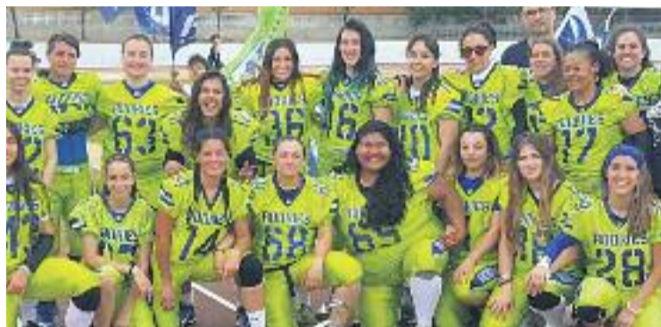
La plantilla rookie que ha guanyat el títol.

Les Rookies es van veure sorpreses en un dels primers drives del partit per una cursa imparable de la quarterback barceloni-