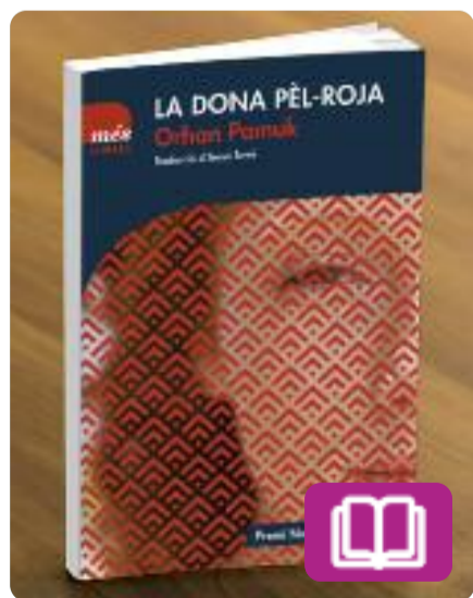
La dona pèl-roja Orhan Pamuk

Una dona pèl-roja i una mort accidental. Aquests dos elements capgiren la vida d'un mestre i el seu aprenent en la Istanbul posterior al cop d'estat de 1980.