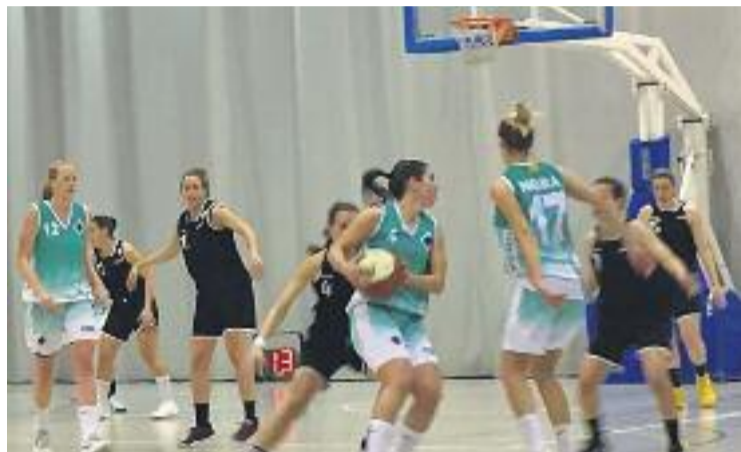
L'equip aspira de nou a pujar a la Lliga Femenina 2.

L'únic que falta saber, doncs, és l'ordre en el qual aquests quatre equips s'enfrontaran. La Final a Quatre es jugarà a Viladecans