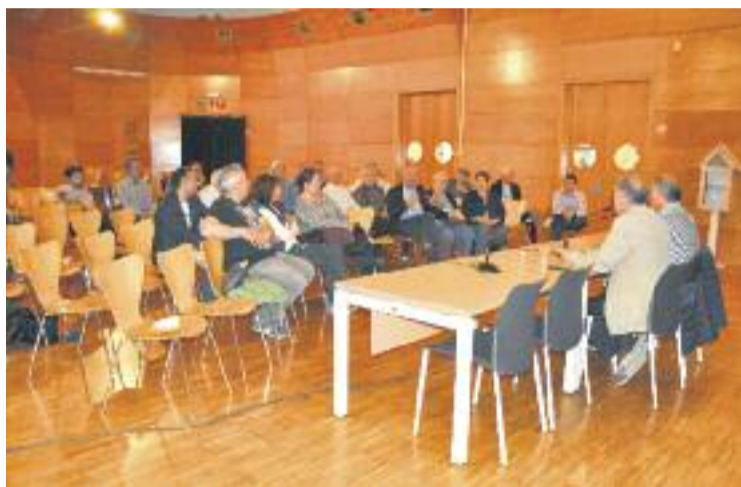
L'assemblea es va celebrar dijous 19 d'abril.

Aquest va ser el tema central que es va tractar durant l'assemblea La mobilitat a Ripollet que va organitzar dijous 19 d'abril el PSC. L'acte va comptar amb la ponència del vicepresident de l'AMB, Antonio Poveda, que va explicar l'acord en què estan treballant amb la Generalitat per esdevenir els titulars del servei de l'actual zona 2, encara que la gestió es realitzaria indirectament des dels operadors privats com ara Autocares Font. "Crec que en els pròxims mesos podrem fer aquest traspàs", va afir-