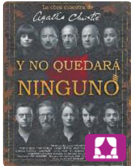
Y no quedará ninguno Ricard Reguant

L'adaptació de 10 negritos d'Agatha Christie torna al Teatre Apolo de Barcelona amb l'objectiu de convidar el públic a trobar l'assassí entre els personatges de l'obra.