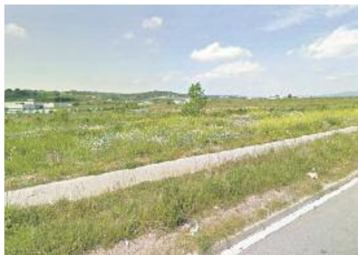
Una de les zones verdes del municipi.

Les observacions que fan els participants s'hauran de penjar a la plataforma de ciència ciutadana Natusfera, una xarxa social naturalista que es considera com una de les plataformes més potents de biodiversitat.