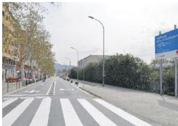
El carrer de Sant Jaume de Ripollet.

El carrer de Sant Jaume és una de les àrees amb més densitat de tràfic a Ripollet a causa de la connexió que té amb la C-58. La problemàtica del soroll i el fet que l'escola El Martinet estigui situada en aquest mateix carrer eren temes que els veïns de Can Mas havien tractat en les diferents assemblees del barri.