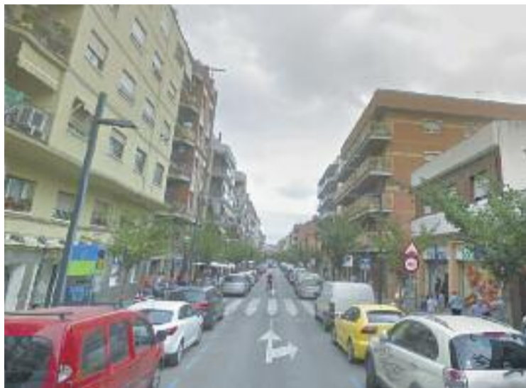
Imatge d'arxiu d'un dels carrers comercials de Ripollet.

Els organitzadors ja van engegar una campanya participativa la tercera setmana d'abril amb motiu de Sant Jordi. En aquest cas, es va convocar un concurs de fotografia a través de la xarxa social Instagram.