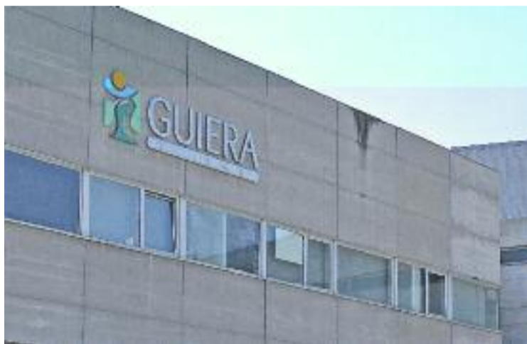
Imatge d'arxiu del Parc Esportiu Municipal Guiera.