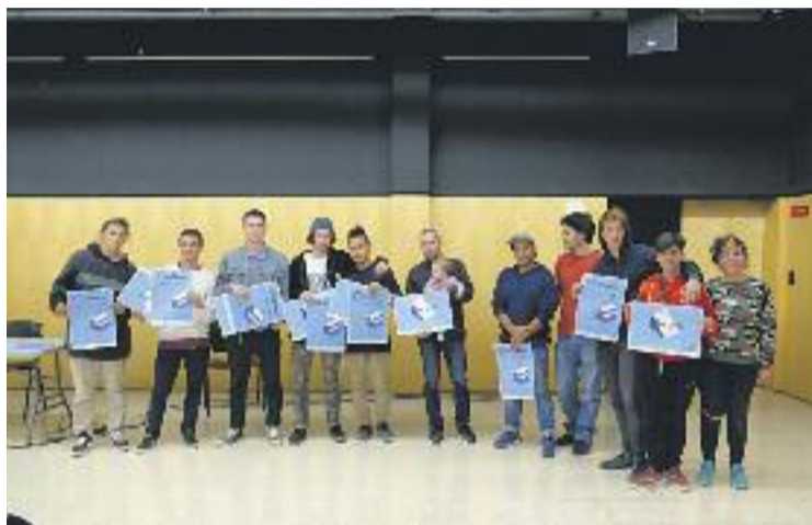
Els usuaris del parc han participat en el procés participatiu.

Durant la sessió, es va determinar la ubicació de l' skatepark , que continuarà al Parc Central del Vallès però en una situació més propera al mirador,