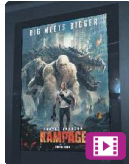
Rampage Brad Peyton

A Rampage , Dwayne Johnson encarna un primatòleg molt actiu en la lluita contra els furtius que té una gran relació amb George, un goril·la albi.