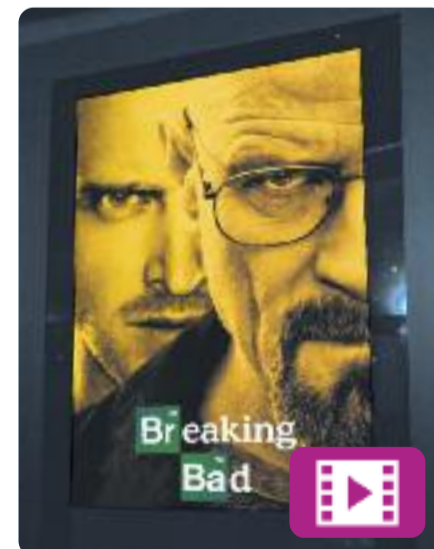
Breaking Bad Vince Gilligan

Aquest mes es compleixen 10 anys de l'estrena de Breaking Bad , una de les millors sèries del que portem de segle.