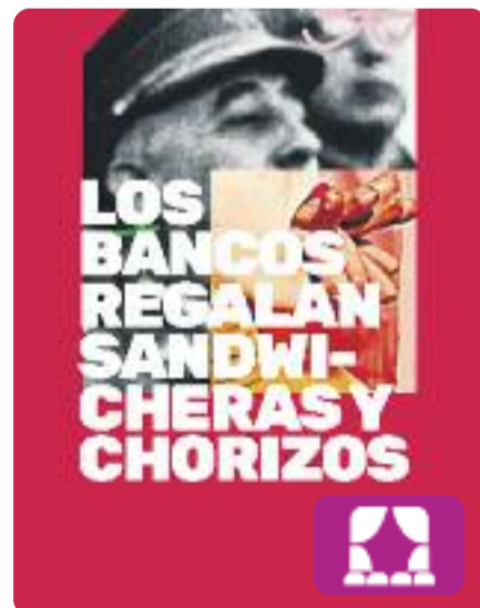
Los bancos regalan sandwicheras y chorizos

Què coneixen els joves del franquisme i de la transició? La companyia 'José y sus hermanas' representa al Teatre Tantarantana de Barcelona aquesta obra política que convida a reflexionar sobre els quaranta anys de postdictadura .