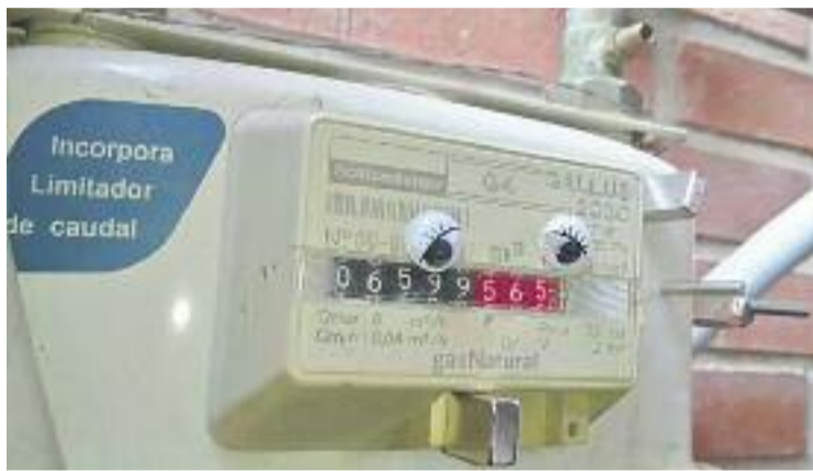
El litigi va començar amb una factura de 17.800 euros.

TRIBUNALS ▶ Una factura de gas impagada de 17.800 euros ha acabat sent la condemna de l'empresa subministradora. Segons informa el diari El Mundo , un jutjat de l'Audiència de Barcelona ha condemnat Gas Natural a pagar 38.001 euros a la propietària d'un pis de Barberà que no va poder llogar-lo pel litigi que va mantenir amb l'empresa a causa de la polèmica factura, pel qual va tenir durant un any el subministrament tallat.