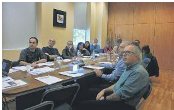
Un moment del primer dia de formació.

Les sessions, quatre de tres hores cadascuna, van començar el passat 24 de gener i s'allargaran fins a aquest mes de febrer.