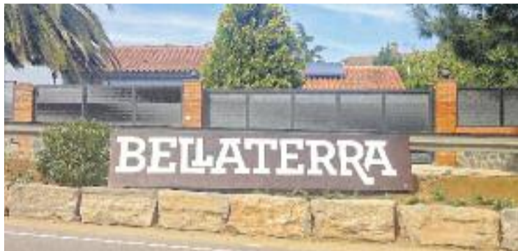
Torna la negociació entre Cerdanyola i Bellaterra.