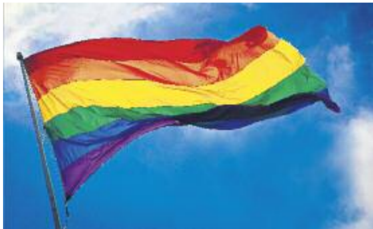
Ripollet torna a ser pioner en drets LGTBI.

El 7 de febrer hi ha organitzada una trobada amb treballadors municipals i, posteriorment, a les sis de la tarda hi ha convocada una Trobada Ciutadana amb l'objectiu de conèixer quina és la realitat de les perso-