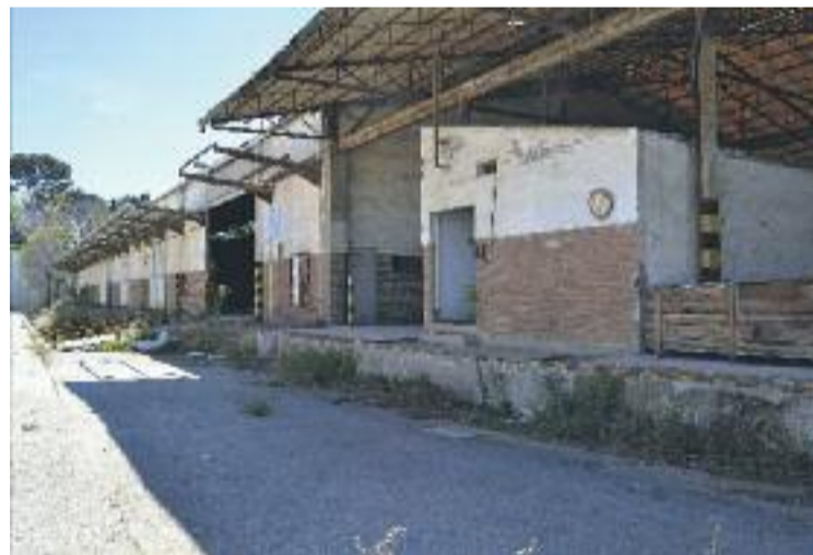
Antiga fàbrica d'Uralita, ara abandonada.