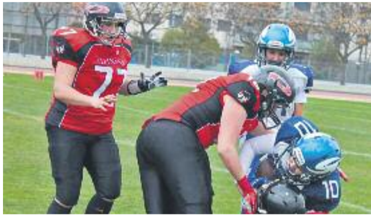
Les barberenques busquen el seu setè campionat aquest curs.

Després de descansar en la primera jornada (a la lliga hi ha cinc equips, de manera que en cada jornada en descansarà un) les de Barberà van demostrar que tenien moltes ganes d'arrencar el curs amb un triomf incontestable el passat dissabte 3. De moment, les Barcelona Búfals lideren la classificació, després d'haver aconseguit guanyar els dos partits que han jugat, però les