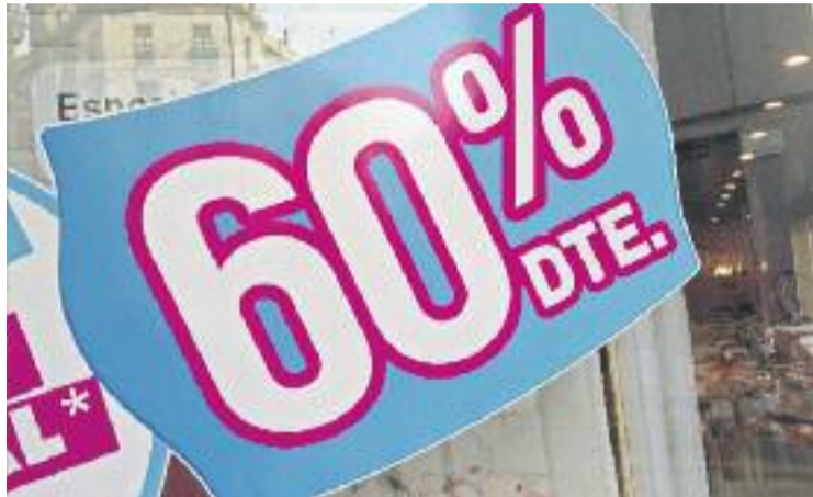
Els comerciants defensen les dates tradicionals de les rebaixes.

Sigui com sigui, les d'enguany estan deixant, com hem