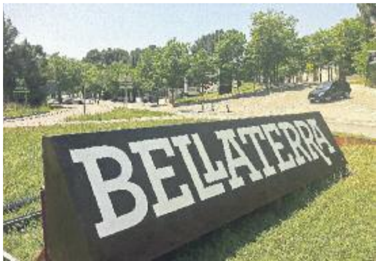
La relació entre Bellaterra i Cerdanyola es tensa.

Benseny explica a Línia Vallès que fa "bastants mesos" que reben "atacs de l'EMD", i aquesta ha estat la gota que ha fet vessar el got. La regidora, que fa poc més d'un mes que ostenta el càrrec, afirma que l'EMD "va ometre molta informació sobre les relacions entre Bellaterra i