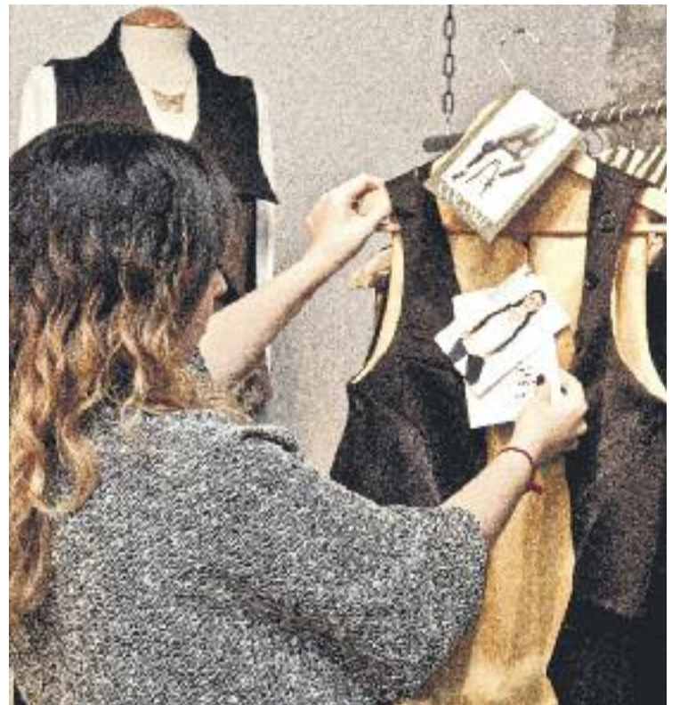
El comerç de proximitat torna a posar tota la carn a la graella per millorar els resultats de Nadal.