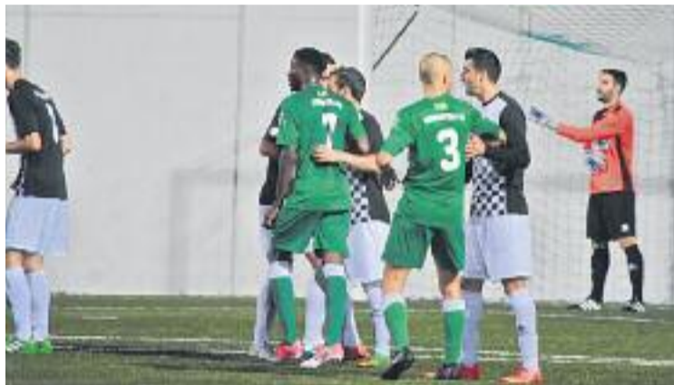
Un moment del partit contra l'Horta d'aquesta temporada.

Però les bones sensacions amb les quals els verd-i-blancs van cloure la temporada passada (van arribar a encadenar nou partits només amb victòries i empats entre el març i l'abril) no han tingut continuïtat en el nou curs. Malgrat que l'entitat ha tingut estabilitat, a la llotja i a la banqueta, sobre la gespa l'equip ha tingut trams encadenant tres triomfs, però en canvi durant el mes d'octubre no va poder sumar de tres en tres. Els cerdanyolencs tancaran el curs a la Bòbi-