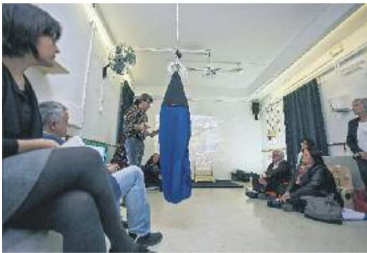
La inclusió arriba fins a les guarderies.