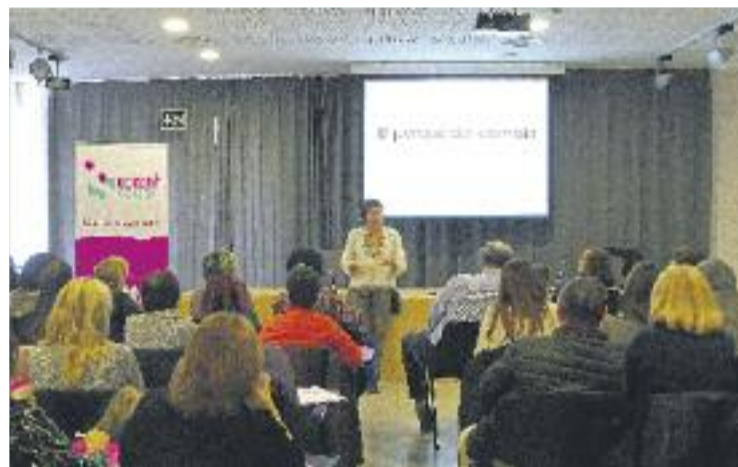
Els treballadors socials han rebut nova formació.

El MAICP situa la persona al centre, fet que "repercuteix en la seva autoestima i en la percepció que té de si mateixa, de manera que la seva qualitat de vida també millora".