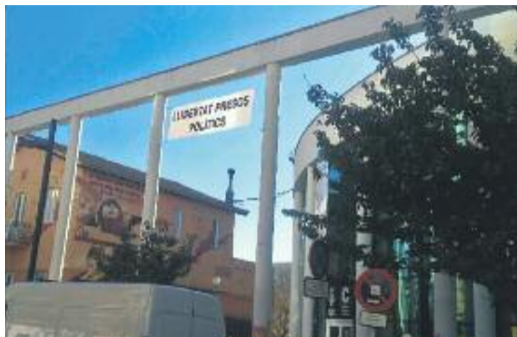
La pancarta que hi havia al Centre Cultural.

Pel que fa a la pancarta, situada al davant del Centre Cultural, la 'Unidad Española' la va retirar sota missatges de "no tenim obstacles, vosaltres poseu i nosaltres traiem" o "tot el que pengeu ho despenjarem, tot el que pinteu ho pintarem i totes les banderes que pengeu les reci-