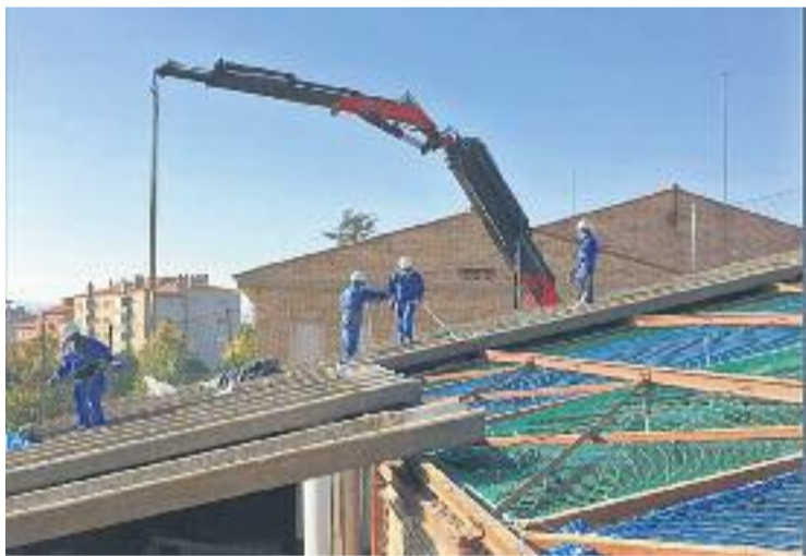
Una imatge de les obres a l'escola Ginesta.