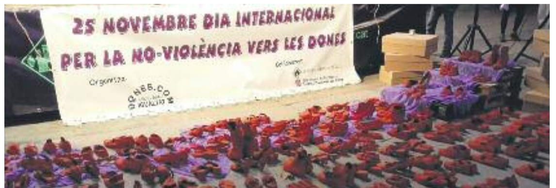
Barberà també va aixecar la veu el 25 de novembre contra la violència masclista.