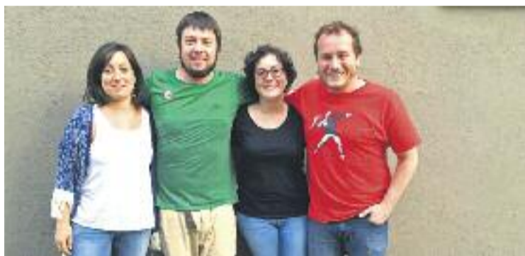
Junts per Barberà continuarà governant el municipi amb PCPB.

Quatre dies després, la CUP va fer un comunicat en el qual asse-