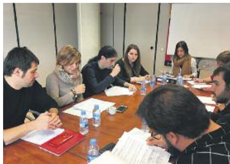
La reunió amb els representants dels tres ajuntaments.

A banda del canvi de presidència, tots tres ajuntaments també van aprovar definitivament el pressupost de l'exercici 2017 i el compte general de l'entitat corresponent al 2016, i van ratificar el conveni col·lectiu extraestatutari per al personal de la Mancomunitat, que fins ara no comptava amb un marc regulador específic de les condicions de treball.