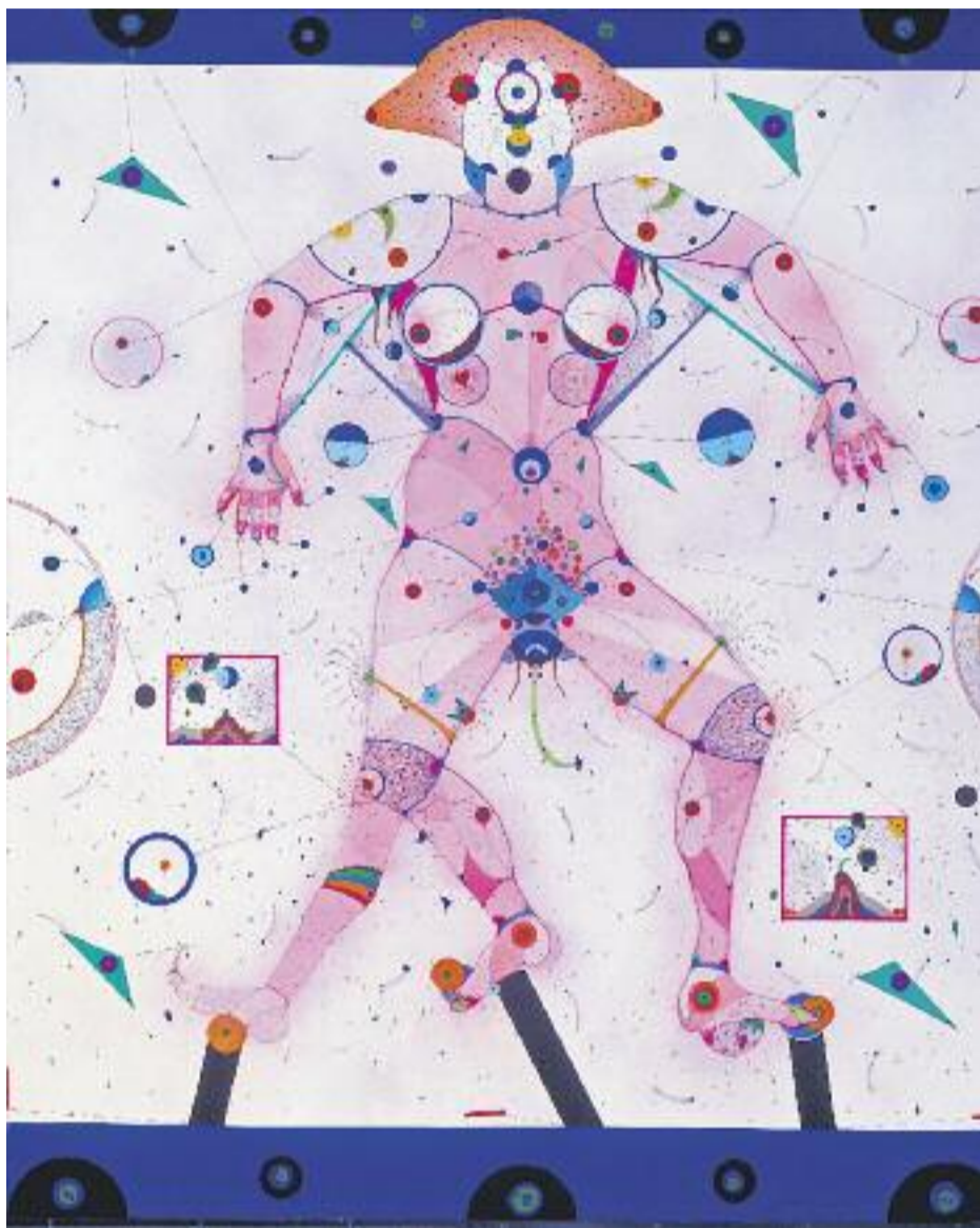
Zush, Kaenia II , 1972. Col·lecció MACBA. Dipòsit de la Generalitat. Antiga Col·lecció Salvador Riera. © Zush/Evru, VEGAP, Barcelona, 2017.

» Diputació i MACBA impulsen una exposició itinerant per la demarcació amb obres del museu » La mostra està curada per David Armengol i visitarà nou municipis en els pròxims dos anys