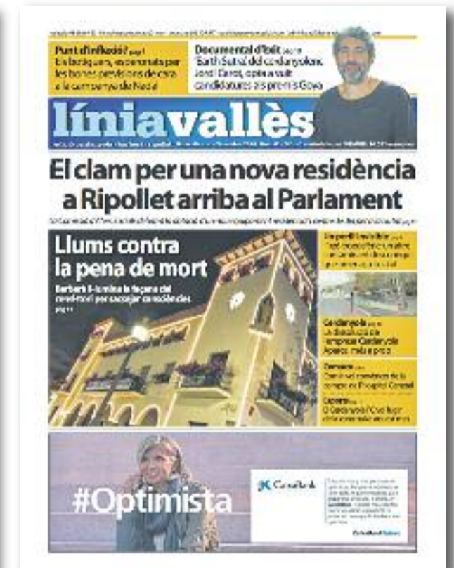
Número 41 · Desembre del 2016