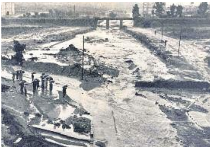
Les riuades van afectar bona part de la comarca.

El fet que la llera del riu estigués plena d'habitatges, fàbriques i molins, va agreujar les conseqüències de l'aiguat. Hi va haver dotze víctimes mortals, però molts ciutadans també es van veure afectats per la pèrdua de les seves llars, els seus horts o les seves indústries, total-