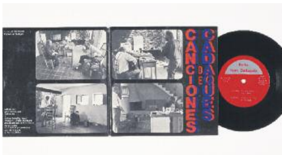
R. Hamilton, D. Roth i L. Chispas, Canciones Cadaqués , 1976. Col·lecció MACBA. Fundació MACBA. Donació Lanfranco Bombelli © Richard Hamilton, VEGAP, Barcelona, 2017 / © Dieter Roth, 2017

► La Diputació de Barcelona i el Museu d'Art Contemporani de Barcelona (MACBA) treballen de manera conjunta per fer itinerant l'exposició Entusiasme. El repte i l'obstinació en la Col·lecció MACBA i portar-la, d'aquesta manera, a diversos municipis de la demarcació de Barcelona fins a l'any 2019.