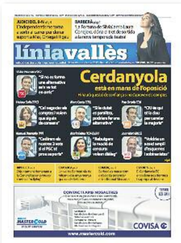
Número 43 · Febrer del 2017