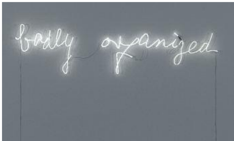
Peter Friedl, Untitled (Badly Organized) , 2003. Col·lecció MACBA. Fundació MACBA. Donació de l'artista. © Peter Friedl, 2017.