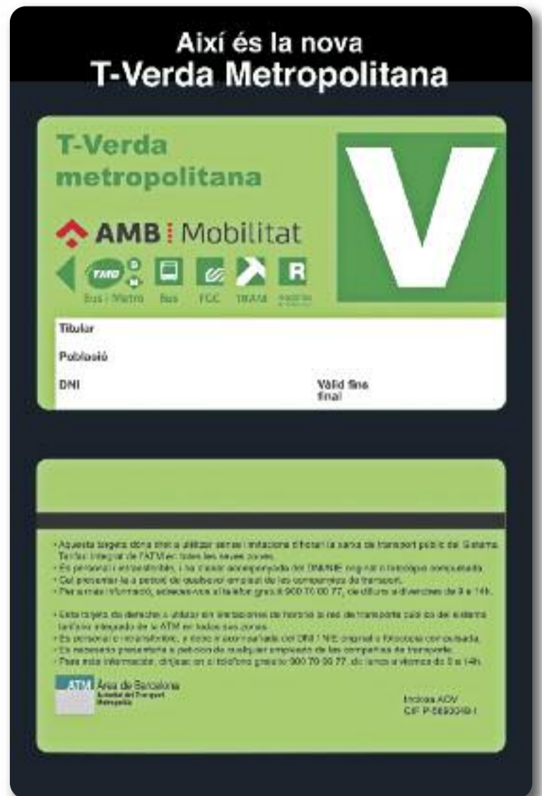
La T-Verda Metropolitana (dreta) permet viatjar gratuïtament en transport públic (esquerra) durant tres anys.