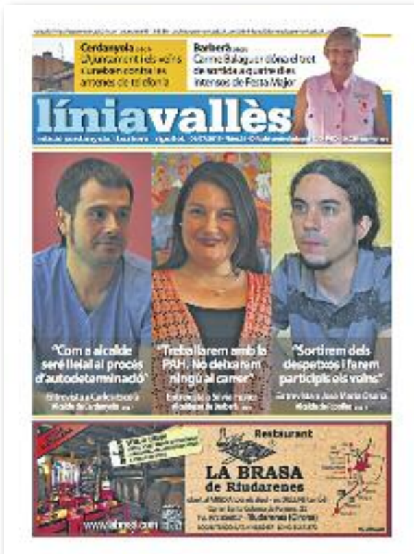
Número 26 · Juliol del 2015