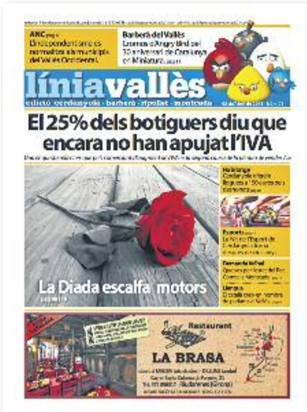
Número 1 · Abril del 2013