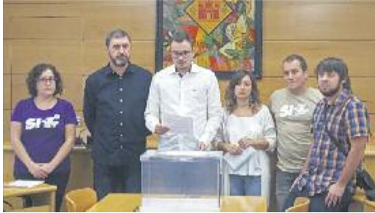
El mes passat Junts i ERC van demanar la dimissió de l'alcaldeessa.