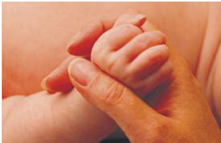
És la població de l'estudi amb la taxa de natalitat més baixa.

Pel que fa a l'habitatge, els preus són molt alts, segons assegura el mateix Ajuntament. Els lloguers mitjans se situen entorn dels 644 euros i el preu mitjà per