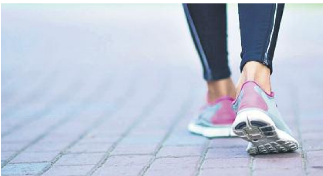
L'AMB aposta pels desplaçaments en transport públic, però també a peu i en bici.