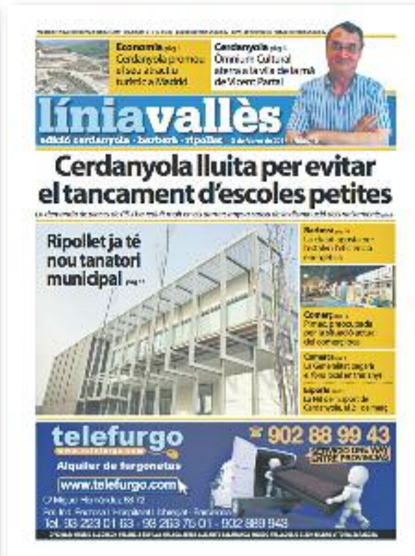
Número 10 · Febrer del 2014