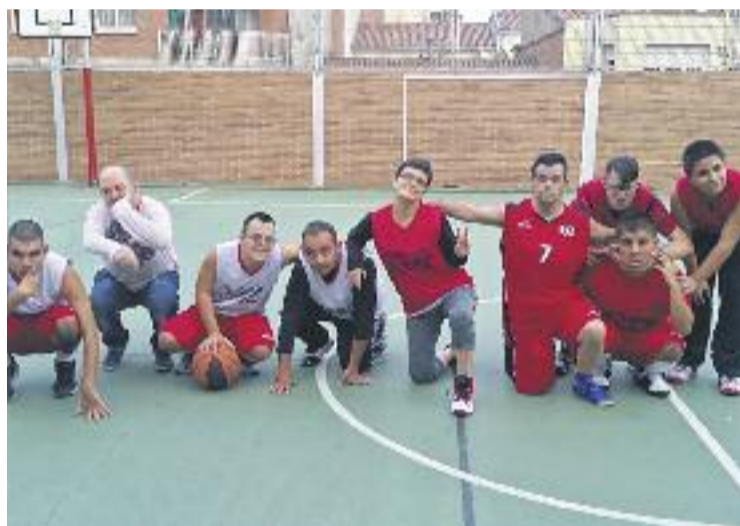
L'entitat utilitza el lleure per integrar els joves amb discapacitats.

L'entitat va néixer el 1995 amb l'objectiu d'oferir un espai de lleure per a joves i infants amb discapacitat psíquica, uns recursos que la ciutat no tenia. Aspadi organitza actualment activitats de tennis taula, manualitats, bàsquet i natació, a més d'un espai els dissabtes.