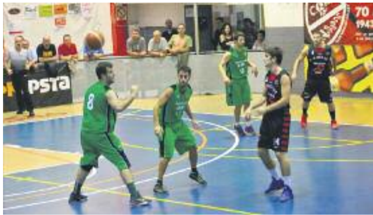
El Cerdanyola ja ha jugat a Mollet.