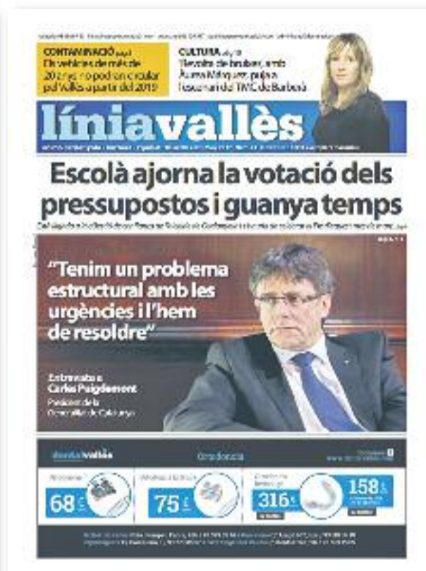
Número 44 · Març del 2017