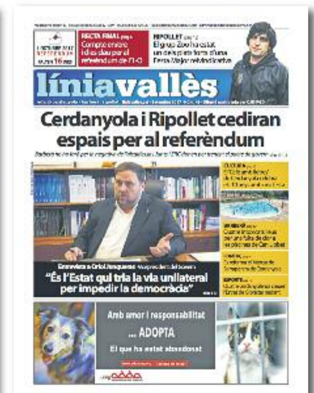
Número 49 · Setembre del 2017