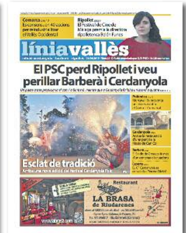
Número 25 · Juny del 2015