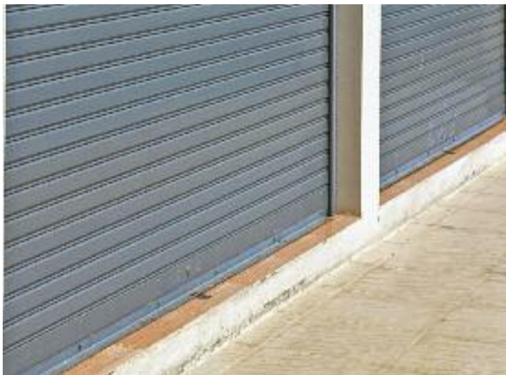
El petit comerç es va bolcar amb l'aturada del dia 3.

El seguiment de la convocatòria va ser igualment alt tant a Barberà com a Ripollet, un fet que es va produir arreu del país. De fet, segons la patronal RETAILcat, el 90% de les petites botigues catalanes van secundar l'aturada de país decretada dimarts dia 3 d'octubre. En més del 80% dels tancaments, la direcció del negoci ho ha fet assumint el cost.