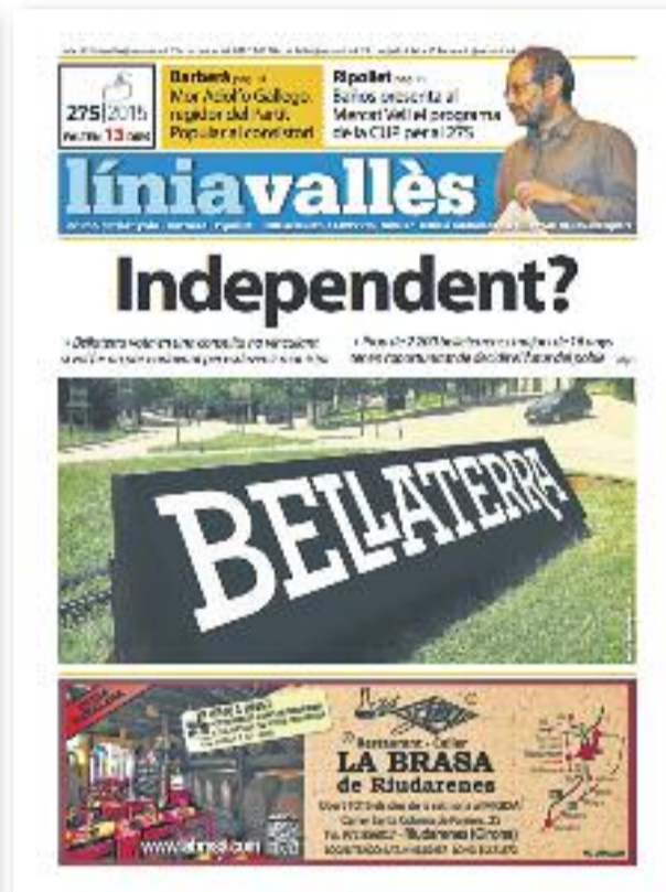
Número 27 · Setembre del 2015