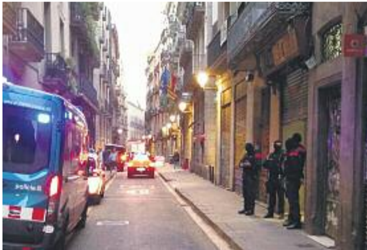
Els Mossos van fer dotze escorcolls arreu del país.