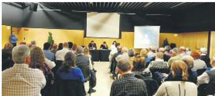
Acte dels pressupostos participatius, l'any passat.

La dotació d'enguany per als pressupostos participatius és de