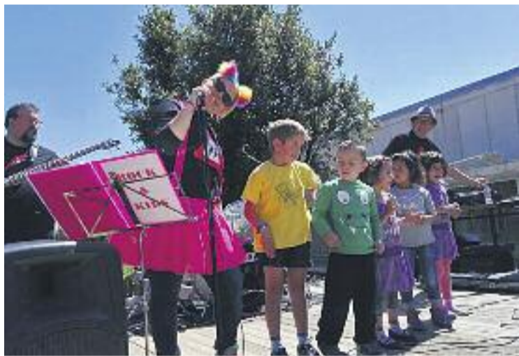
El barri es va omplir de gom a gom durant tres dies.