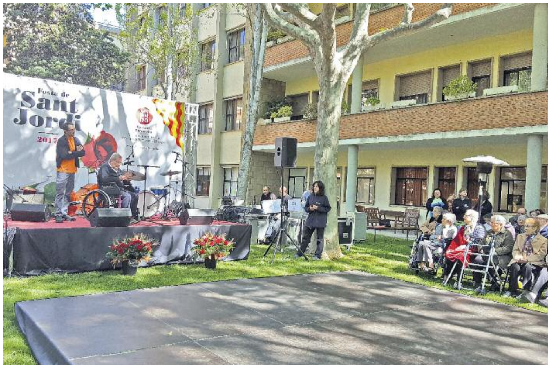
Celebració de la Diada de Sant Jordi 2017 al Respir

» La Diputació ofereix el servei d'acolliment temporal Respir per a persones dependents » Se'n poden beneficiar els més grans de 65 anys o amb discapacitat intel·lectual