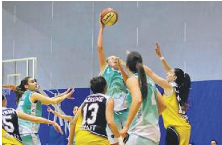
L'equip vol pujar de categoria aquest any.

dues fases amb una primera volta excel·lent (16 victòries i 2 derrotes) i un segon tram de competició igualment notable, voldrà posar la cirereta al pastís amb el premi definitiu. El conjunt verd és l'únic dels quatre equips que repeteix presència a la final per segona temporada consecutiva