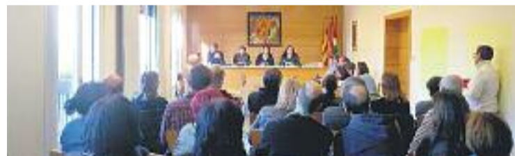
Roda de premsa del govern, a finals d'abril.

Arran d'això, el 12 d'abril el govern va rebre l'expedient amb tota la documentació des del 1984, quan es va inaugurar l'emissora. Amb tot, es va notificar la dissolució de l'associació i el govern ha reajustat la programació amb personal municipal "fins a trobar la fórmula més adient per regularitzar la situació". I és que, segons el consistori, el servei s'ha anat prestant i facturant en concepte de "col·laboració" sense que existeixi "cap conveni, acord o resolució que justifiqui la seva necessitat ni cap contracte que reguli tal prestació, ni, per tant, les condicions sota les quals s'ha de regir".