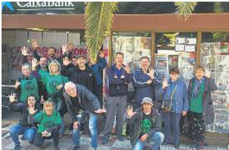
Protesta de la PAH davant l'oficina.