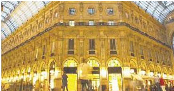
El Quadrilatero della Moda, epicentre mundial del sector.

La data escollida per portar a terme el Retail Tour 2017 tenia a veure amb la celebració d'una fira especialitzada adreçada al món del comerç durant aquells dies a la capital de la Llombardia. D'aquesta manera, els comerciants van poder descobrir de primera mà diferents proveïdors de materials que els són propis en el desenvolupament de la seva activitat comercial.