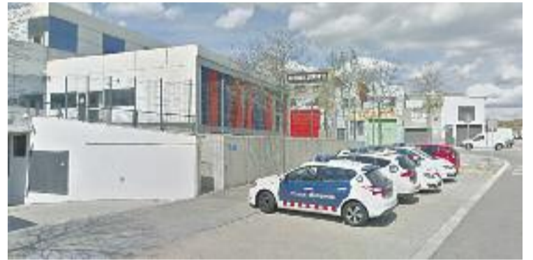
Proposen ubicar la benzinera al costat dels Mossos.

La benzinera havia d'obrir al costat de l'escola El Martinet, la qual cosa rebutjaven els veïns. Davant d'això, es van moure fins perquè es traslladés al costat de la comissaria, una decisió que ja havia superat les reticències dels Mossos i tenia el permís del departament d'Interior per tirar endavant amb la benzinera en aquesta ubicació. Ara caldrà esperar al Ple per veure què passa.