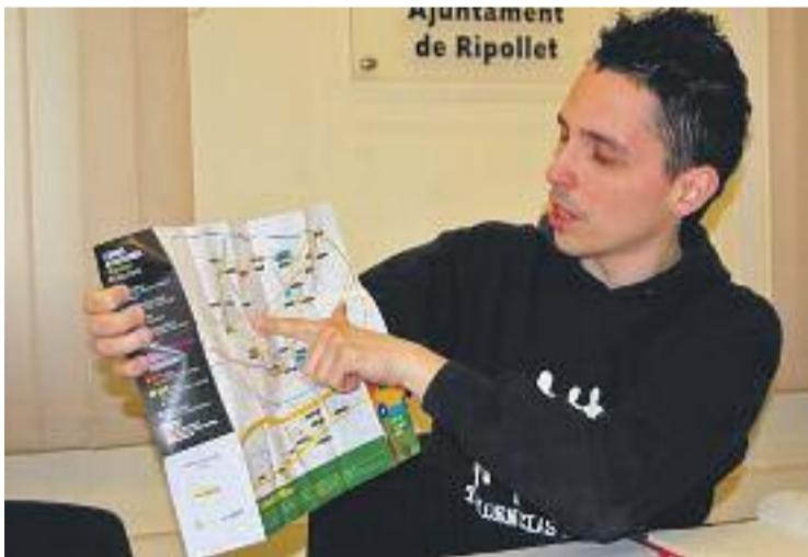
El PMUS inclou propostes ciutadanes i d'entitats.