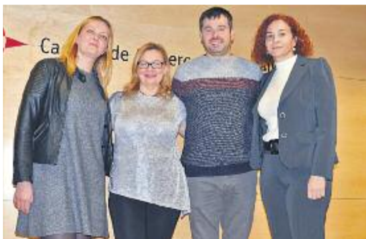
Moment de l'entrega de premis a Dandara.