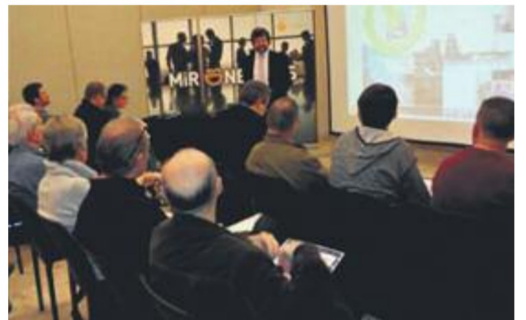
La trobada empresarial va tenir lloc fa unes setmanes.

Segons l'Ajuntament, durant la trobada es va deixar la porta oberta a “continuar treballant en aquesta línia”. “Algunes de les empreses van manifestar la seva voluntat de constituir-se en el nucli inicial d'un possible futur grup de compra”, asseguren des del consistori.