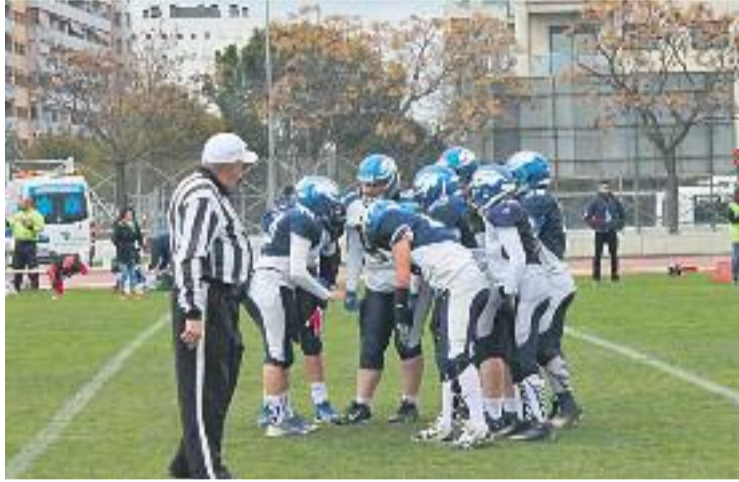
El senyor femení continua en plena forma.

Les millors notícies per al club arriben, un cop més, de part de l'equip femení. Les de Roberto Torrecillas, dominadores de la Lliga i de la Copa en la majoria de les últimes temporades, han aconseguit cinc victòries en els cinc partits que han jugat fins ara. Les barberenques han aconseguit 246 punts a favor i només n'han cedit 14 (8 i 6 en els dos partits que han jugat contra les Terrassa Reds) i tenen tots els números de repetir presència a la final. I és que l'equip no ha fallat mai en la lluita pel títol i només se li va escapar fa dues temporades contra Las Rozas Black Demons. L'equip de Roberto Torrecillas tancarà el mes el dia 26 amb l'objectiu de continuar amb el seu estat de forma imparable rebent la visita de les València Firebats.