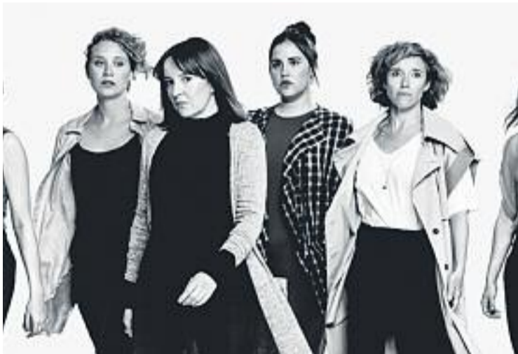
L'obra de La Kompanyia Lliure va arribar a Barberà l'11 de març.