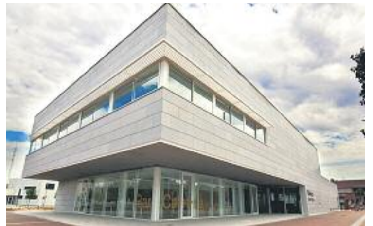
La Biblioteca Esteve Paluzie està especialitzada en microrelat.

Una altra dada proporcionada per l'Ajuntament és el total d'activitats que es van organitzar a càrrec de la mateixa biblioteca o d'altres entitats socials i culturals de la ciutat. Segons el consistori, se'n van celebrar 347 en les quals van participar 5.911 persones.