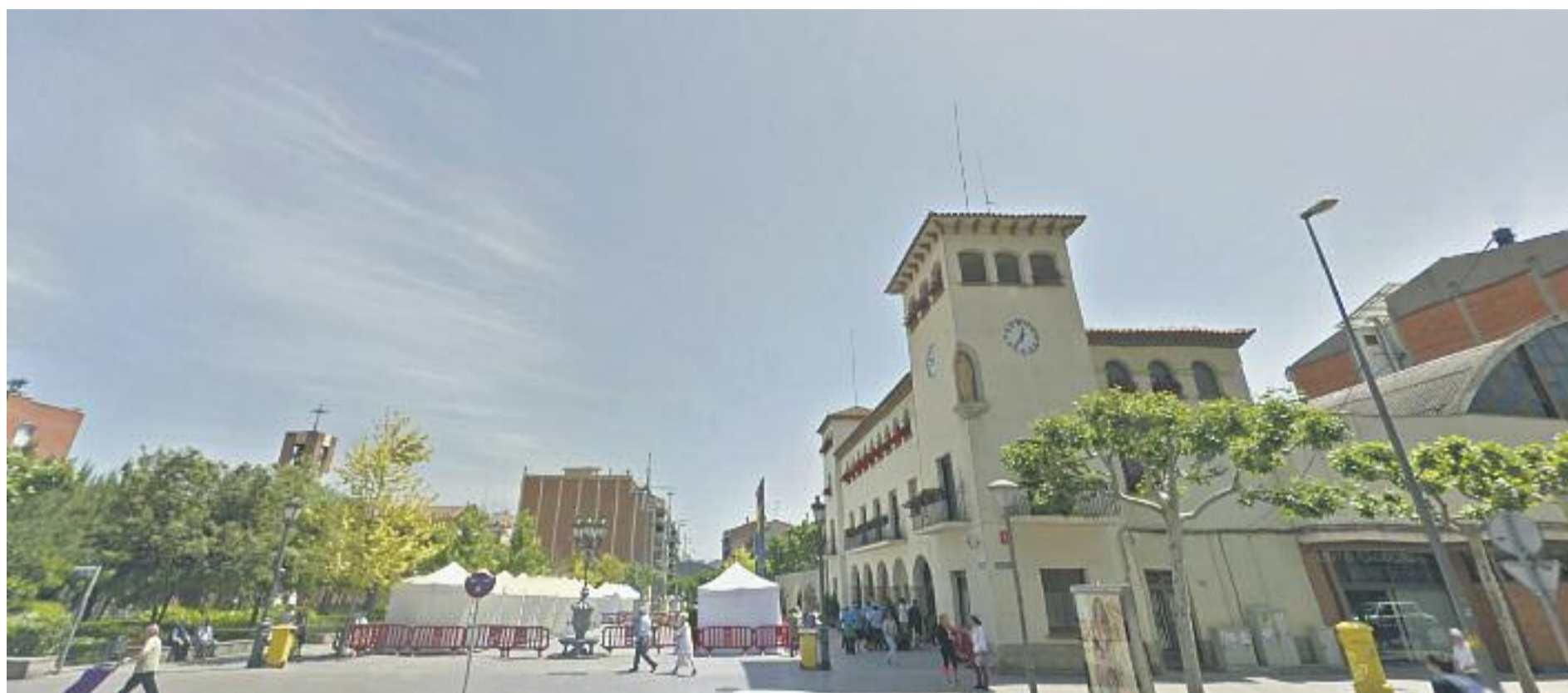
A Barberà, que està en una Zona de Protecció Especial de l'Àmbit Atmosfèric, hi ha un aparell de mesura dels contaminants a la plaça de l'Ajuntament.