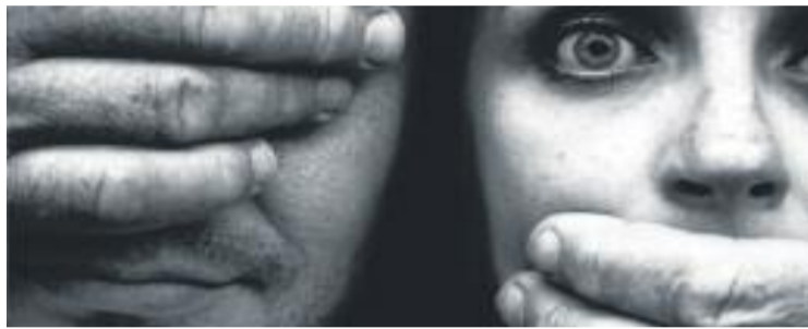
Barberà impulsa diverses iniciatives en l'àmbit de la dona.

Fins ara, ja s'han celebrat diverses reunions de treball i s'han organitzat tres comissions: Activitats, Comunicació i Xarxa i Relacions externes . La comissió pre-