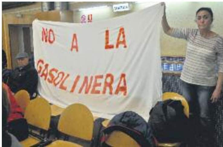
El Ple ha rebutjat la reubicació de la benzinera de Can Mas.

La regidora no adscrita va votar-hi en contra, mentre que la resta de forces es van abstenir. Des de Ciutadans van qüestionar la necessitat de més estacions de servei i el PSC va criticar el govern de Decidim per no haver-se esforçat més a generar un consens ampli i va recordar que està en minoria. Davant d'això, l'alcalde Osuna va advertir els grups de l'oposició so-