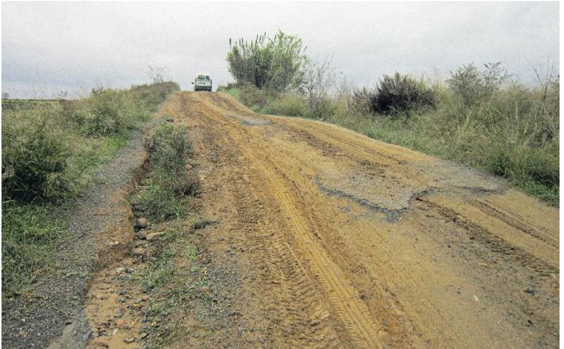
La Diputació treballa perquè tots els camins de la demarcació estiguin en bon estat.

MOBILITAT ▶ La Diputació de Barcelona ha endegat un programa complementari de millora i manteniment de camins que estarà en marxa durant els pròxims tres anys. El principal objectiu d'aquesta iniciativa és donar suport a les necessitats dels diferents municipis de la demarcació en el manteniment d'aquestes vies veïnals. Des de la Diputació informen que les primeres actuacions d'aquest programa s'iniciaran els pròxims mesos, les quals aniran a càrrec dels mateixos municipis.