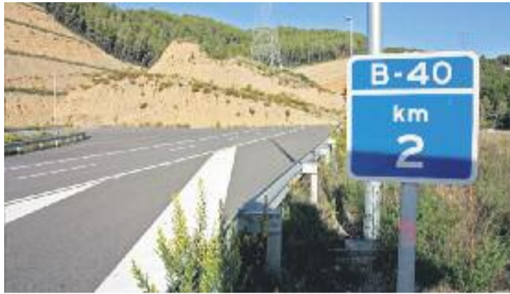
El Pla contempla estudiar millores per a la B-40.

Abans que el Pla de mobilitat es faci realitat, però, hauran de