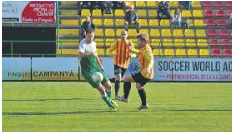
L'equip va començar l'any empatant contra la UE Sant Andreu.

I és que quan girem la primera fulla del calendari i si guem al mes de febrer, els verd-i-blancs visitaran el camp de la Jonquera i jugaran, en tres jornades consecutives, contra els equips que ara mateix ocupen les tres primeres posicions de la lliga: el Peralada, el Vilafranca i l'O-