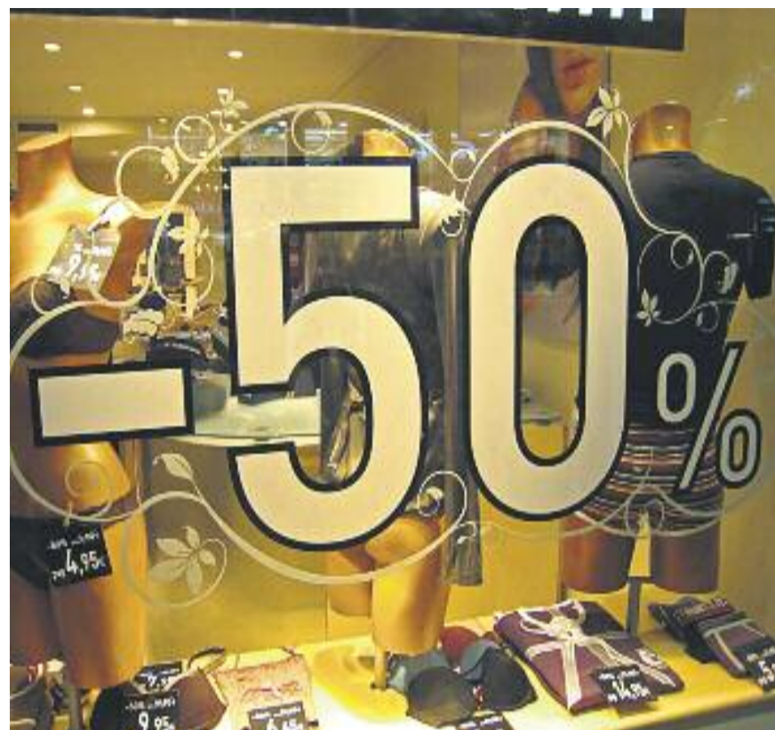
Els comerciants estan fent descomptes entorn del 50%.