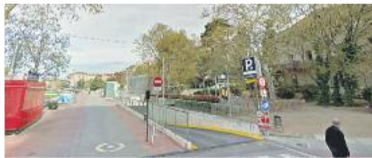
La gestió de l'aparcament ha estat fallida.

El novembre el Ple va aprovar la mesura amb els vots de Compromís, ERC, CiU i ICV-EUiA. PSC, C's i PP es van abstenir.