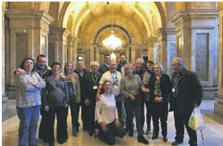
Membres del Club de Jubilats al Parlament.