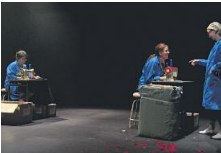
'La dona de l'encarregat', de la Companyia 8.