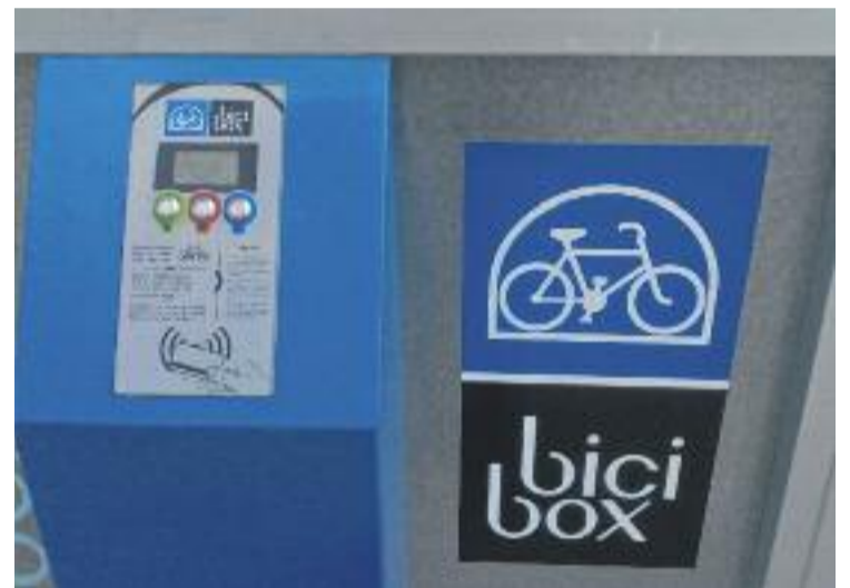
Bicibox és un servei d'aparcament de bicicletes gratuït.

Cada setmana la mitjana de bicicletes estacionades (dies laborables) ha estat de 845 de mitjana. Mensualment, hi ha hagut 20.300 bicicletes estacionades. A la resta de municipis de l'AMB on s'ofereix el servei la tendència també ha estat positiva.