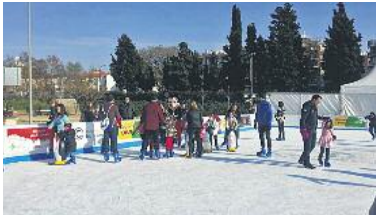
La pista de gel va rebre 35.000 visitants.

En aquest sentit, Olivé reclama una implicació més gran a nivell municipal per dinamitzar el comerç local. La crítica la fa extensiva no només al govern municipal, sinó també als partits del Ple. "La crítica fàcil és anar contra el govern de torn, però la responsabilitat de la situació actual del comerç és cosa de tots els