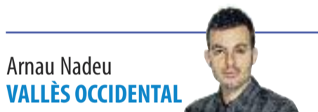
Arnau Nadeu VALLÈS OCCIDENTAL

Guanyar el referèndum. Aquest és l'objectiu que s'ha marcat l'Assemblea Nacional Catalana (ANC) d'ara fins a la consulta d'autodeterminació que el president Puigdemont preveu convocar, com a tard, el setembre d'enguany. El compte enrere ja ha començat i per això l'entitat independentista posarà tota la carn a la graella a partir del 15 de gener per “sumar més voluntats” a les tesis independentistes. Serà aleshores quan començarà la campanya Fem futur , que pretén impulsar una “pluja permanent de raons” a favor d'un estat propi, “anant més enllà dels sentiments i apel·lant al pensament racional”.