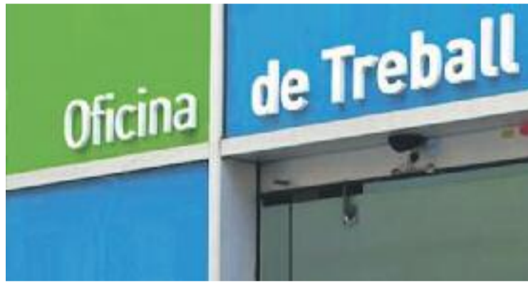
A Barberà hi ha hagut 2.085 aturats el desembre.

Pel que fa a altres municipis de la comarca, a Cerdanyola es registra una taxa d'atur inferior a la catalana (11,26%) i a Ripollet és més elevada, amb una taxa del 15,69%. De tota manera, l'atur respecte del mes de novembre ha baixat en totes dues lo-