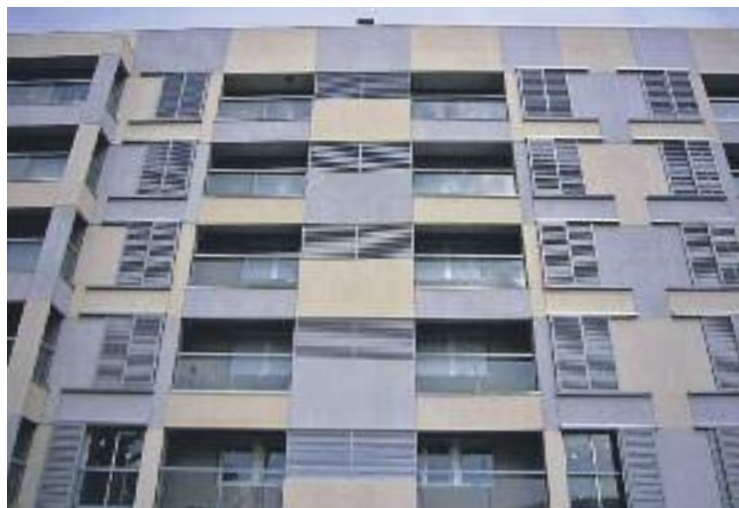
Al desembre es decidirà si la mesura s'aprova definitivament.