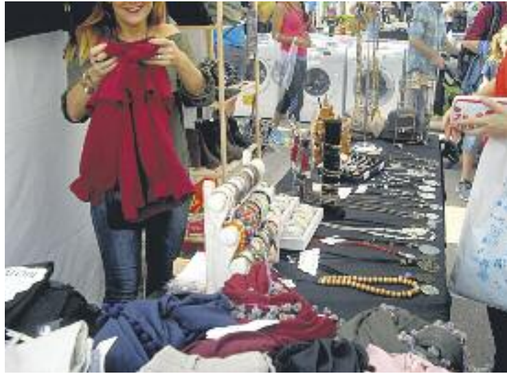
A la fira hi van participar prop de 30 botigues.

Olivé assegura que han de determinar encara per què hi va anar poca gent a la mostra, tot i que enumera alguna de les possibles conseqüències. "No hi va haver servei de bar, com en passades ocasions", recorda, un espai que "hagués ajudat a fer que la gent s'hi quedés més estona". En aquesta línia, tampoc