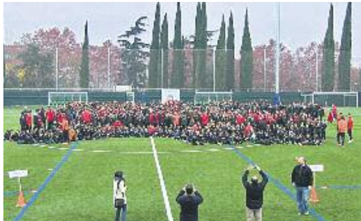
Una imatge de la presentació de l'any passat.

Quarta derrota consecutiva. Els cerdanyolencs continuen en el