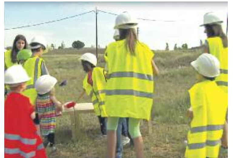
Fotograma d'un vídeo reivindicatiu de l'institut.