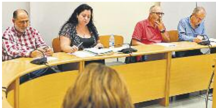
La votació va tenir lloc dijous 6 d'octubre.

Originàriament hi havia dues propostes més: un bicibox a la Renfe i la instal·lació d'un mirall en un encreuament entre els carrers de Verge de Montserrat i l'avinguda de la Generalitat. La primera no va passar la fase prèvia i la segona va ser assumida directament al pressupost ordinari.