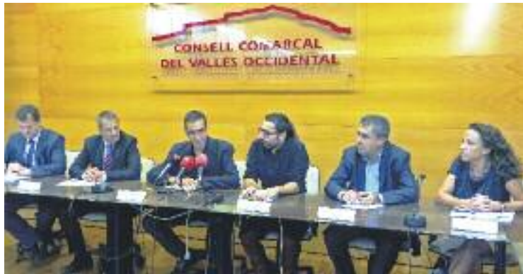
Els alcaldes i alcaldesses reunits el 21 de setembre.