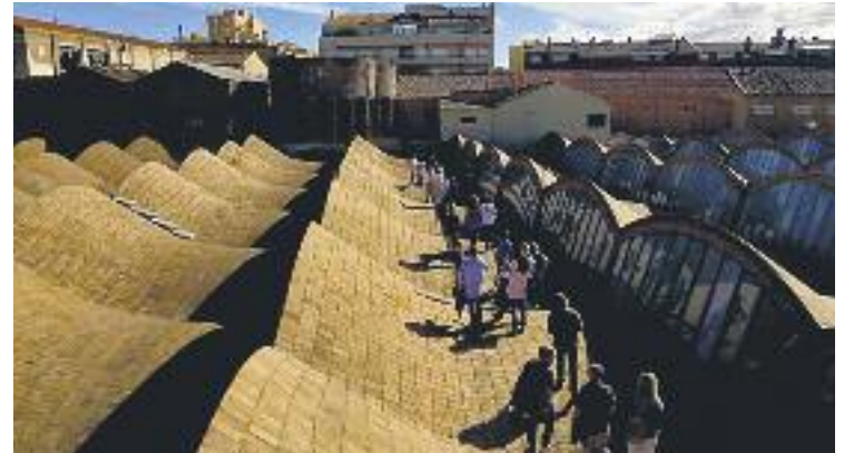
El Museu de la Ciència és un dels més visitats a Catalunya.

ECONOMIA ▶ Més de 133 milions d'euros. Aquest és l'impacte econòmic que va tenir el sector turístic al Vallès Occidental l'any passat. Són dades que es desprenen del darrer informe anual que ha publicat recentment el Consorci de Turisme.