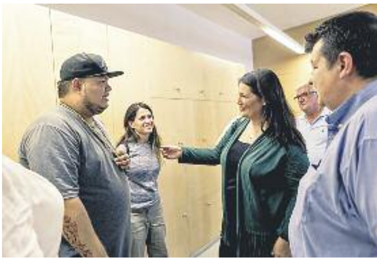
Jeihhco va oferir la xerrada dimarts 4 d'octubre.