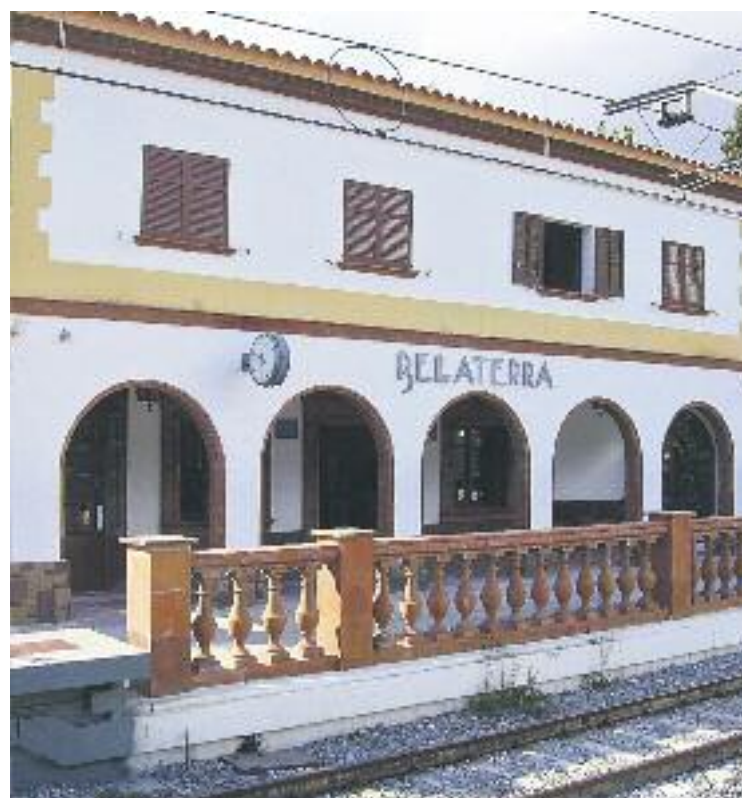
Els bellaterrencs van votar el setembre passat i la gran majoria –un 94%– van expressar que volen ser un municipi independent.