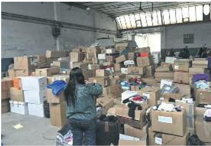
La solidaritat de la gent ha sobrepassat les expectatives.

dien absorbir més material. "En lloc de quatre camions, en podem enviar vuit", assegura. La capacitat dels camps amb els quals treballen és molt limitada. Idoniament especialment, tot i ser el que més ajuda necessita, no compta amb una bona infraestructura i té molts pocs recursos, cosa que fa que només s'hi destinin un o dos d'aquests camions. La resta es repartiran entre els camps que tenen més organització, com és el cas d'Atenes i Tesalònica.