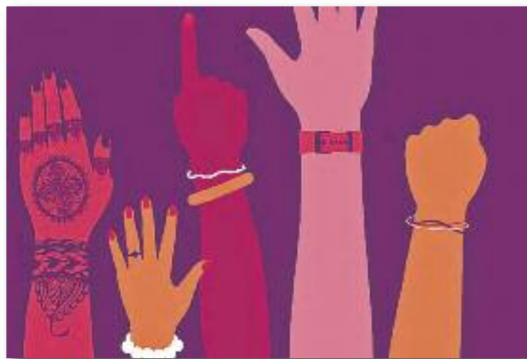
Detall del cartell de la campanya.