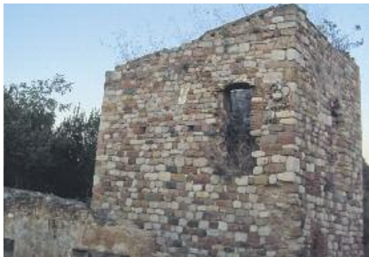
La torre és un Bé Cultural d'Interès Nacional dels segles XI-XII.

Pel que fa al projecte de consolidació de la torre i d'un mur exterior del mas, es preveuen les actuacions d'urgència imprescindibles per aturar la degradació de les restes mentre no es produeixi la seva restauració. El cost total dels estudis, dirigits pel Servei de Patrimoni