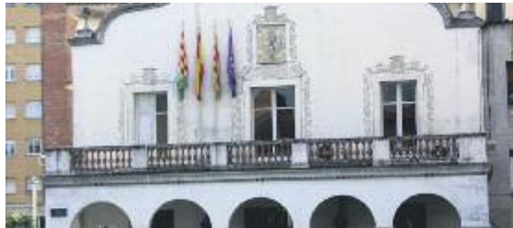
Cerdanyola tindrà, a partir d'ara, un govern ampli.

Malgrat que cap dels partits implicats en l'acord n'ha volgut avançar més detalls, sí que han explicat que "el consens s'ha fonamentat en el diàleg i la voluntat d'arribar a pactes per assolir