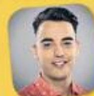
La tribu de Catalunya Ràdio Amb Xavi Rosiñol De dilluns a divendres, de 16 a 19 h