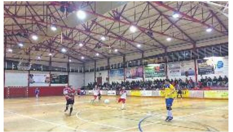
El Ripollet viu un mal moment de resultats.