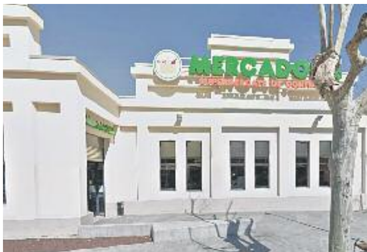
El supermercat està a les antigues instal·lacions de Mafinsa.

Els fets haurien tingut lloc en la legislatura 2011-2015, sota el govern del PSC en coalició amb ICV-EUiA. En el moment de l'aprovació inicial del projecte, el maig del 2012, el regidor d'ERC va