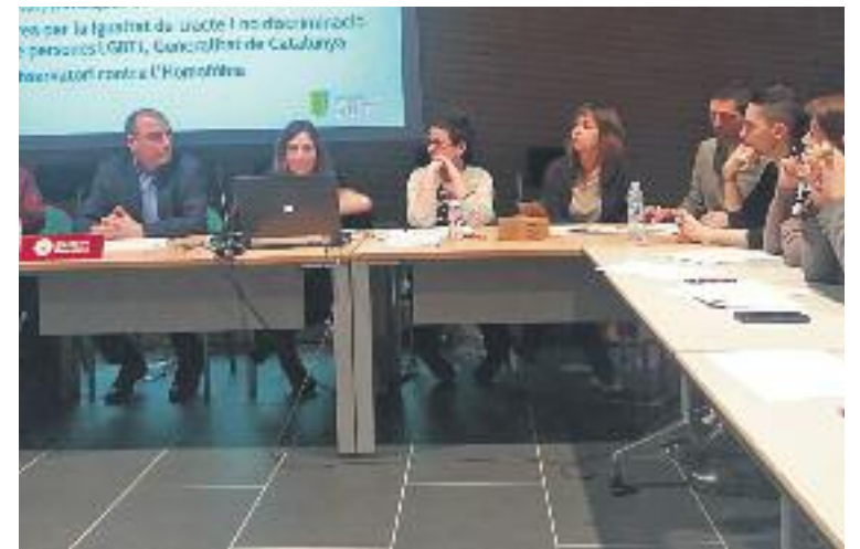
Reunió en la qual es van triar els municipis que faran el Pla.