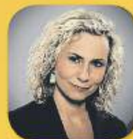
El matí de Catalunya Ràdio Amb Mònica Terribas De dilluns a divendres, de 6 a 12 h