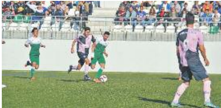
Els verds van cedir dos punts a l'últim moment.

El partit va entrar en una fase d'anades i tornades amb arribades a les dues porteries. Les ocasions més clares d'aquesta fase del partit van ser per als visitants,