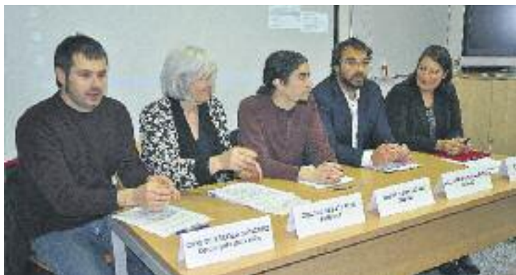
El moment de la signatura del conveni.

Els representants dels cinc ajuntaments, que van signar el conveni de col·laboració divendres passat, asseguren que “l'acord parteix del convenciment