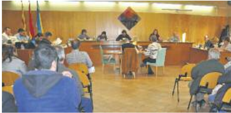
El pla es va aprovar amb l'abstenció de PP, PSC i CiU.

Segons les dades d'aquest document, els ripolletencs realitzen 127.900 desplaçaments al dia, és a dir, 3,6 per habitant, i quan es mouen internament pel municipi ho fan majoritàriament (un 85%) a peu o en bici. Per desplaçar-se a l'exterior, sis de cada deu viatges els fan en vehicle motoritzat. Amb