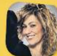
Les mil i una nits de Maria de la Pau Janer Amb Maria de la Pau Janer De dilluns a divendres, de 22 a 23 h