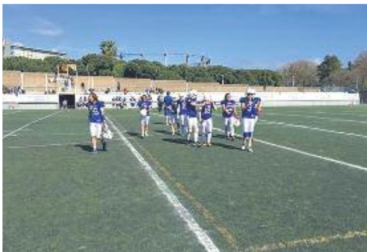
El sènior femení va perdre a Barcelona.