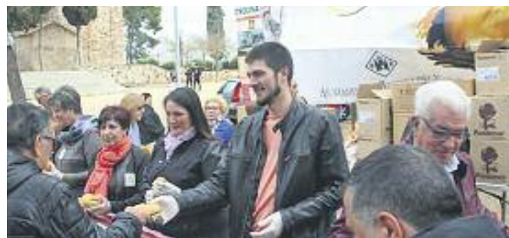
Repartiment dels panets beneïts entre els assistents.

L'associació va finalitzar la jornada amb un dels balls que organitza dedicat a totes les persones del barri, que com és habitual va omplir de gom a gom el Centre Cívic. Per acabar, l'entitat va sortejar entre tots els presents una mona de Pasqua.