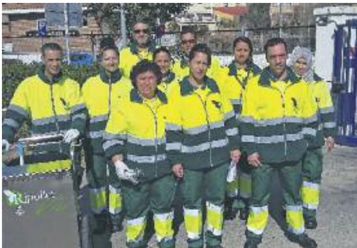
S'han contractat 16 aturats per un termini de quatre mesos.