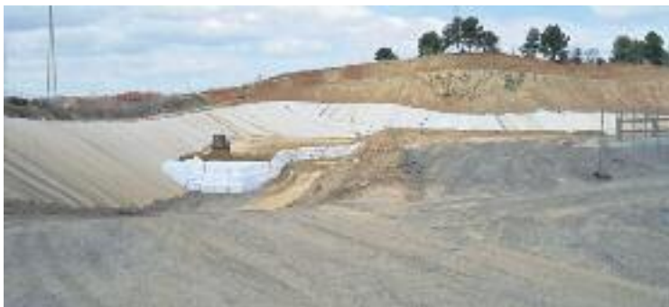
L'abocador Elena es va clausurar l'any 2012.

Ara, amb la confirmació de les fuites de gas, s'haurà de buscar una solució eficaç per garantir la seguretat a la zona.