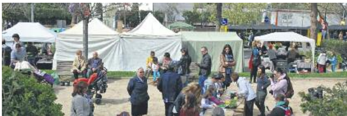
La Fira dels Horts va reunir un bon nombre de visitants al parc de la Xemeneia.