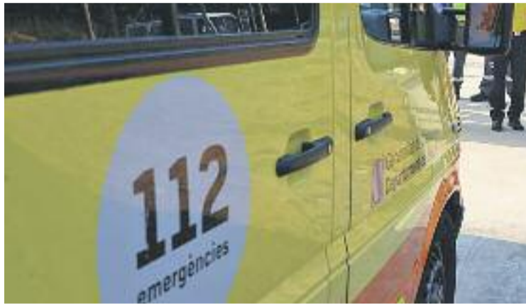
Durant la vaga d'ambulàncies es garantiran els serveis urgents.