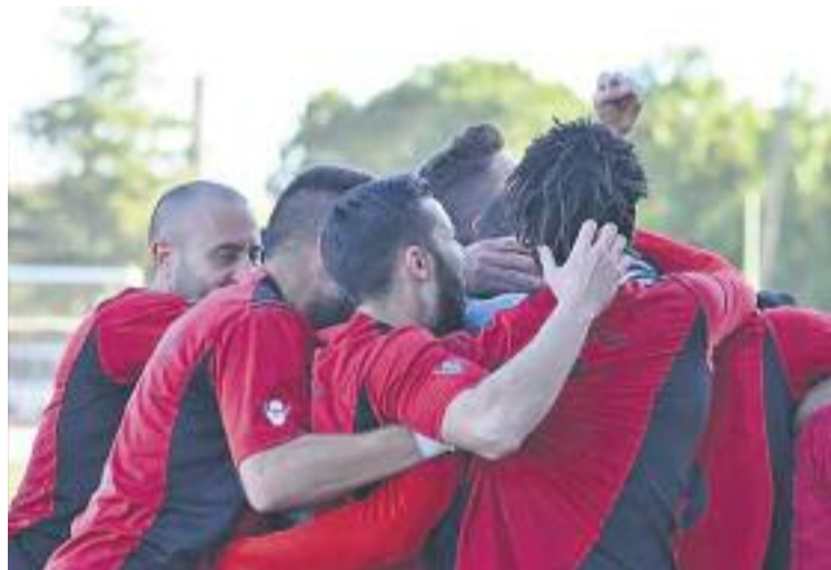
L'equip ha guanyat tres dels darrers quatre partits.