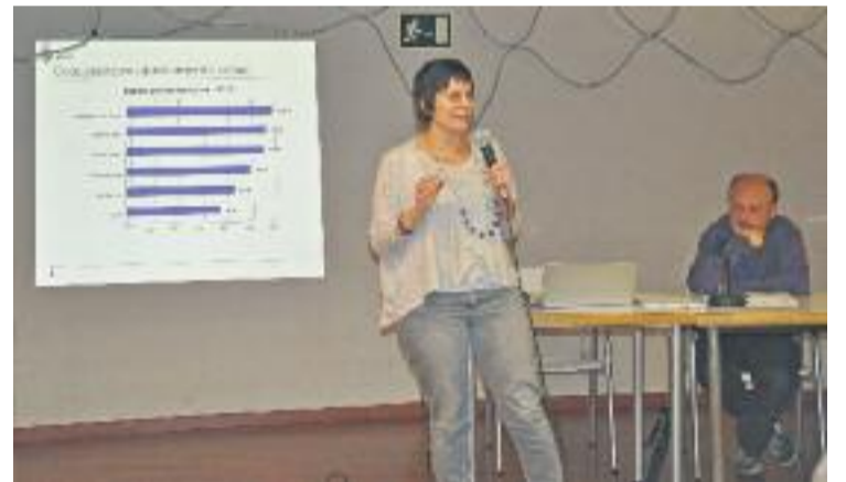
Presentació dels pressupostos a la ciutadania.

Les dues trobades van comptar amb la participació d'una trentena de persones que van fer una desena de propostes que seran estudiades per l'equip de govern per incloure-les als comptes.