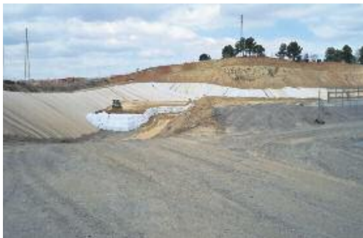
El Consorci ha recorregut la sentència de l'abocador tòxic.

L'estudi que s'ha declarat nul preveia una sèrie de recomanacions per a la remediació de l'abocador que, segons Compromís, volia "evitar la declaració de Can Planas com a sòl contaminat i la seva descontaminació total", perquè això condiciona la distribució dels equipaments a la zona i l'interès d'empreses i particulars per instal·lar-s'hi.