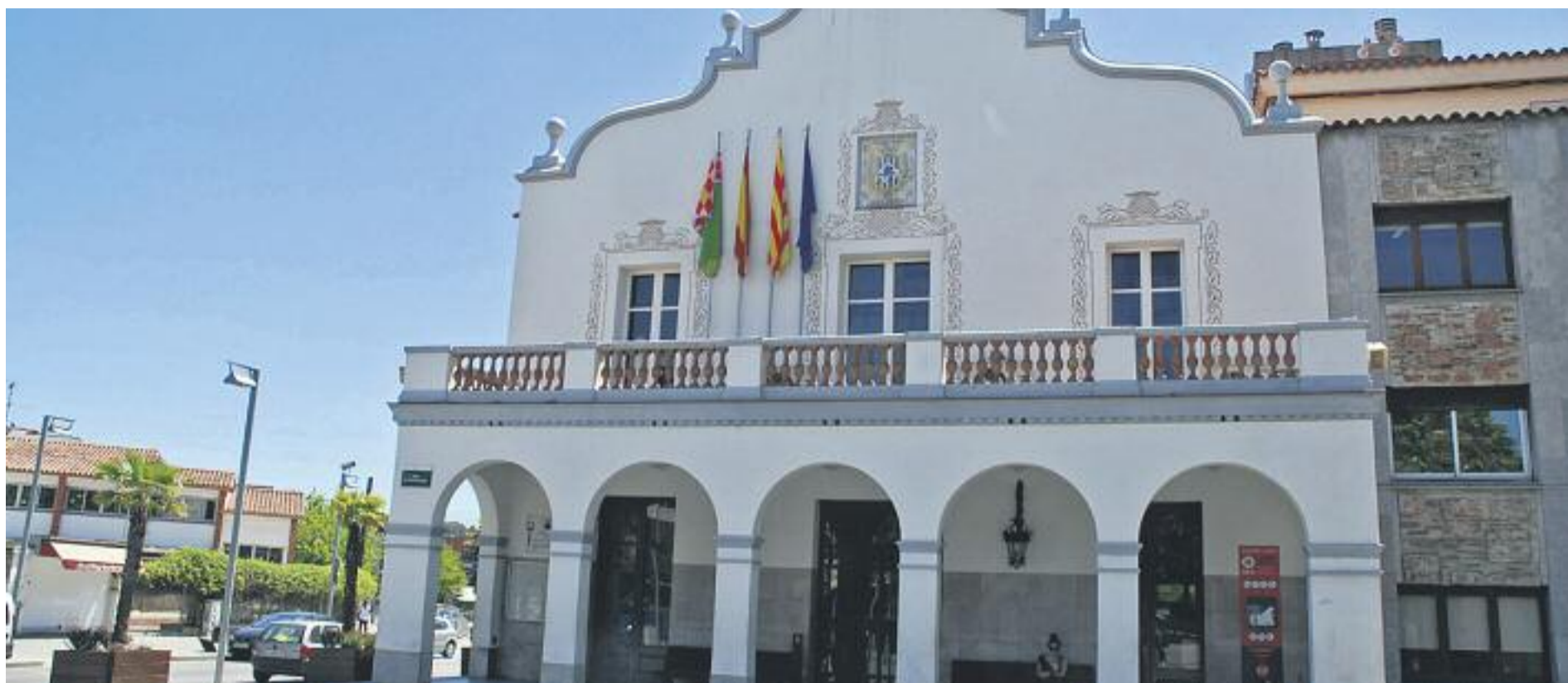
A dia d'avui l'Ajuntament de Cerdanyola està en mans del govern en minoria de Compromís.