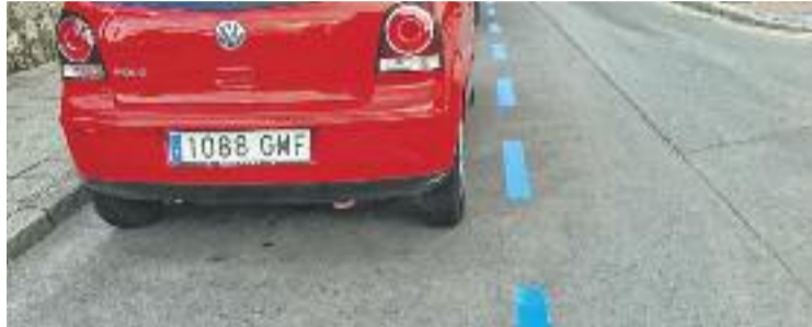
La zona blava està gestionada per l'empresa Cerdanyola Aparca.

Tant ICV-EUiA-MES com CiU s'han mostrat contraris a l'obertura d'aquest expedient. La