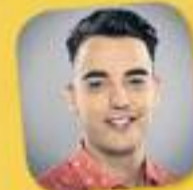
La tribu de Catalunya Ràdio Amb Xavi Rosinol De dilluns a divendres, de 16 a 19 h