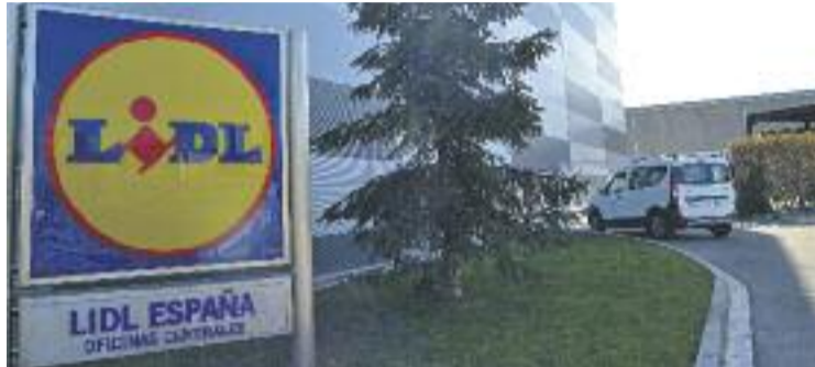
Lidl vol duplicar les oficines que té a la zona.