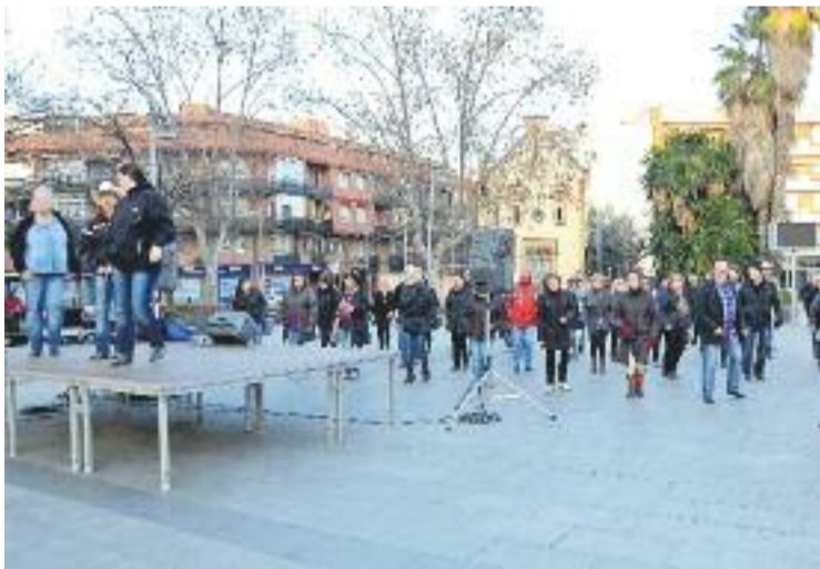
Una de les activitats de la darrera edició.