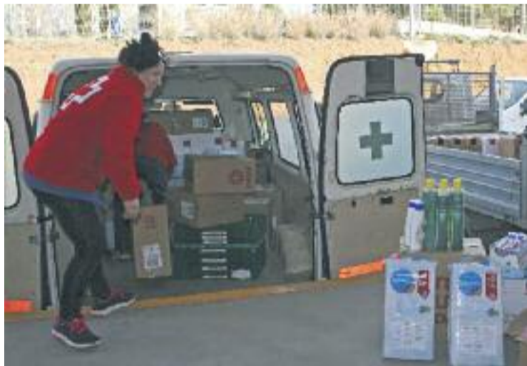
Els lots els reparteixen el Consell Comarcal i els ajuntaments.