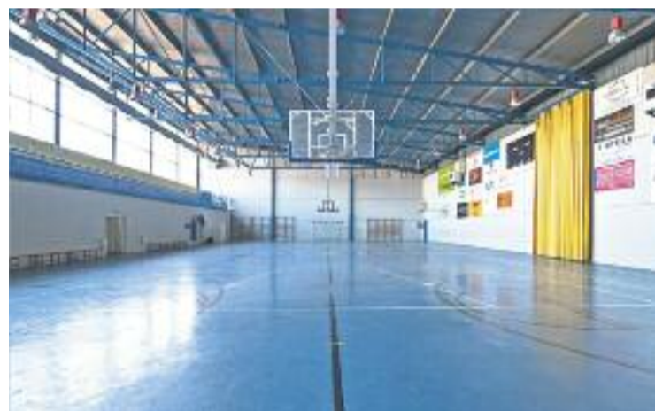
Can Serra serà una olla a pressió a favor de l'equip.

El darrer precedent és favorable als interessos del Barberà, que va aconseguir una contundent victòria a Barcelona a la primera volta (60-83), que a més tindrà el suport de l'afició. Per la seva banda, el CB Cornellà visitarà la pista del Vive Masnou, que ja no s'hi juga res.