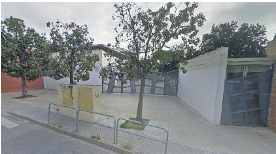
CCOO creu que la mesura adoptada per a l'institut Can Planas "té caràcter definitiu".

» El curs vinent els grups de primer d'ESO que no càpiguen a l'institut Can Planas s'instal·laran a l'Escola Elisa Badia