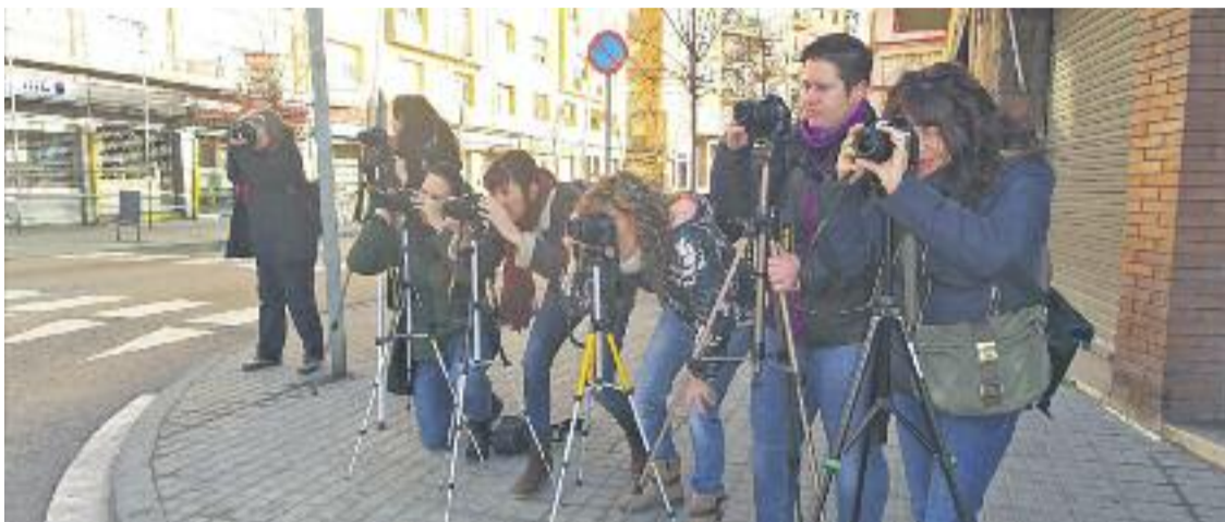
Els membres d'Acció Fotogràfica exposaran les seves fotos als comerços del municipi.

» Els fotògrafs exposaran les seves imatges a les diferents botigues durant tot el mes d'abril per ajudar a incrementar l'afluència de clients