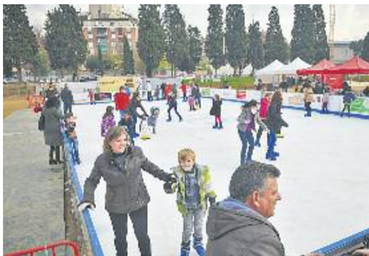
Aquest any han patinat 12.000 persones.