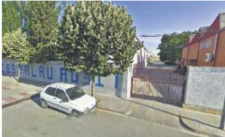
La Generalitat planteja ampliar el Palau Ausit.

La Plataforma d'AMPA de Ripollet també ha reclamat la