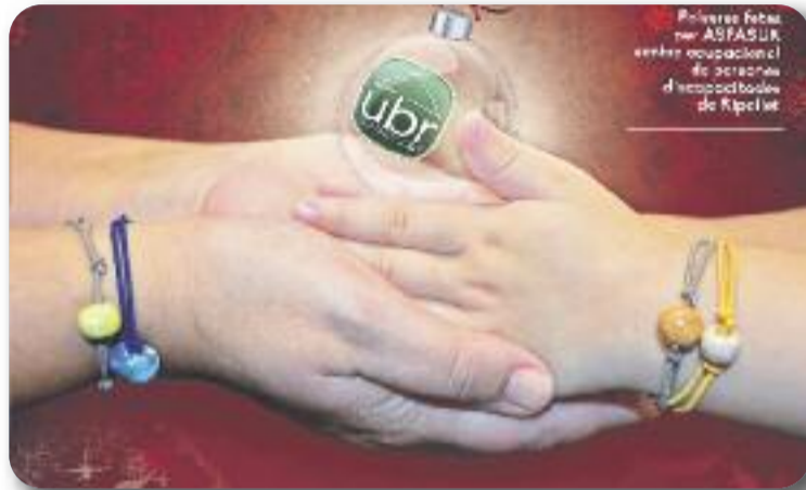
Detall del cartell de la campanya.

Les polseres estan fetes a mà amb un cordill de goma i perles