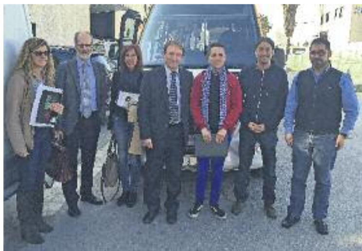
Primera prova de la nova línia B5.