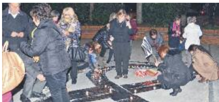
Encesa d'espelmes a Cerdanyola.

Les dades sobre violència masclista de la Generalitat aquest any 2015 indiquen que, durant els nou primers mesos de l'any, hi ha hagut 9.735 denúncies per violència masclista en l'àmbit de la parella i més de 4.000 detinguts, 19 d'ells menors d'edat.