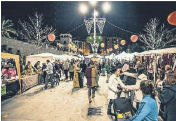
Shopping Nigh de fa uns dies.