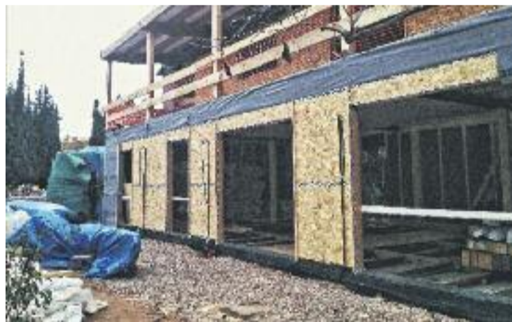
La casa està feta de fusta i cotó reciclat.

La casa, que s'està construint a la zona del parc Cordelles, utilitza materials i tecnologia amb fusta i cotó reciclat que permetran construir un habitatge familiar de 150 metres quadrats amb dues plantes.