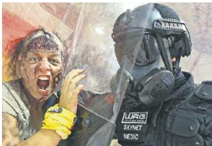
Prop de 2.400 persones van participar en l'activitat.