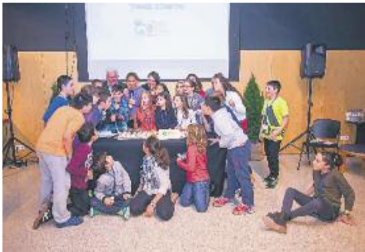
El CMI està format per 12 infants del municipi.