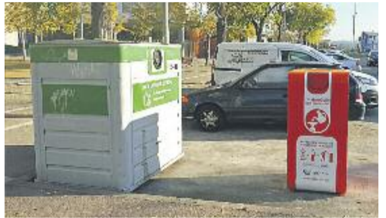
Els primers contenidors es van instal·lar l'any 2009.

L'oli de cuina usat no es pot llençar per l'aigüera, ja que un litre d'aquest oli pot contaminar al voltant d'un milió de litres d'aigua. A més, provoca problemes en el manteniment de les depuradores que tracten les aigües residuals, fa malbé les canonades i perjudica el manteniment de la xarxa de clavegueram.