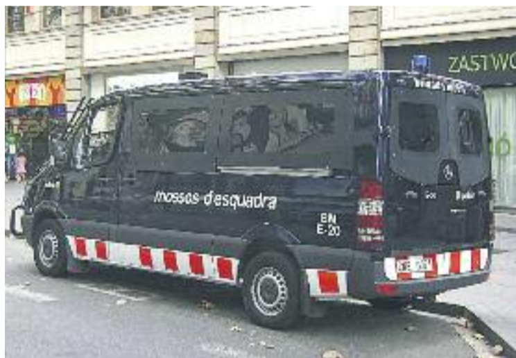
L'operatiu s'ha portat a terme en 19 municipis catalans.