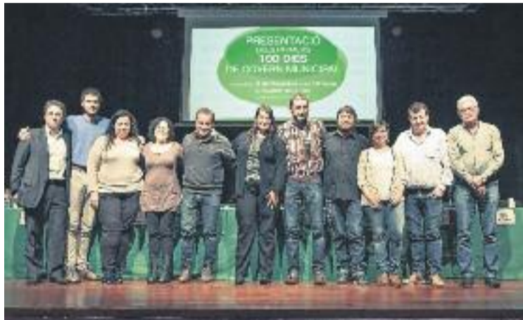
Fuster afirma que s'han començat a fer canvis a la ciutat.

L'alcaldeessa també va explicar que s'han començat a fer canvis a la ciutat i va remarcar la