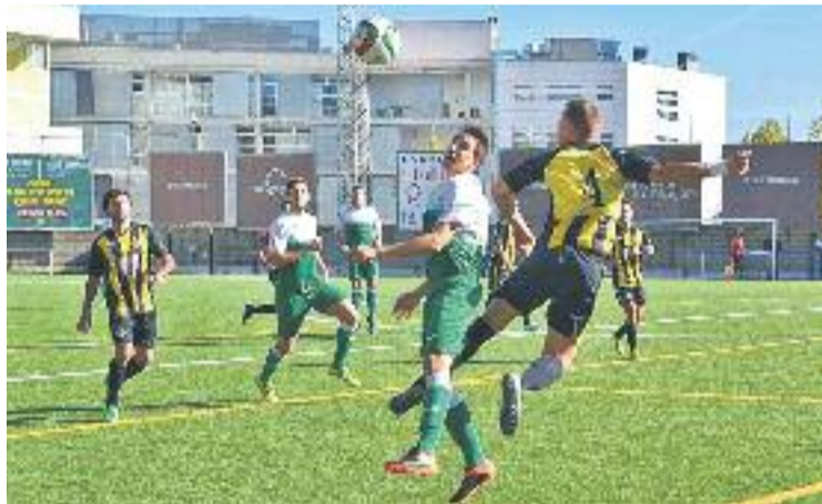
La Montañesa es va imposar en un partit tremendament igualat.

Precisament l'extrem va iniciar la jugada de l'únic gol del partit. Després d'una recuperació de pilota amb un pèl de fortuna, Velillas va fer la passada de