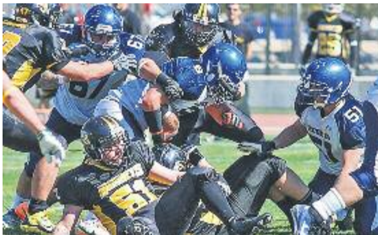
Els Rookies van caure contra l'Hospitalet Pioners.

BARBERÀ ▶ No va poder ser. El sènior masculí dels Barberà Rookies va caure a les semifinals de la Copa Catalunya de futbol americà contra l'Hospitalet Pioners (14-6) i per tant no disputarà la final de la competició a Badalona contra els Dracs el dia 20 d'aquest mes.