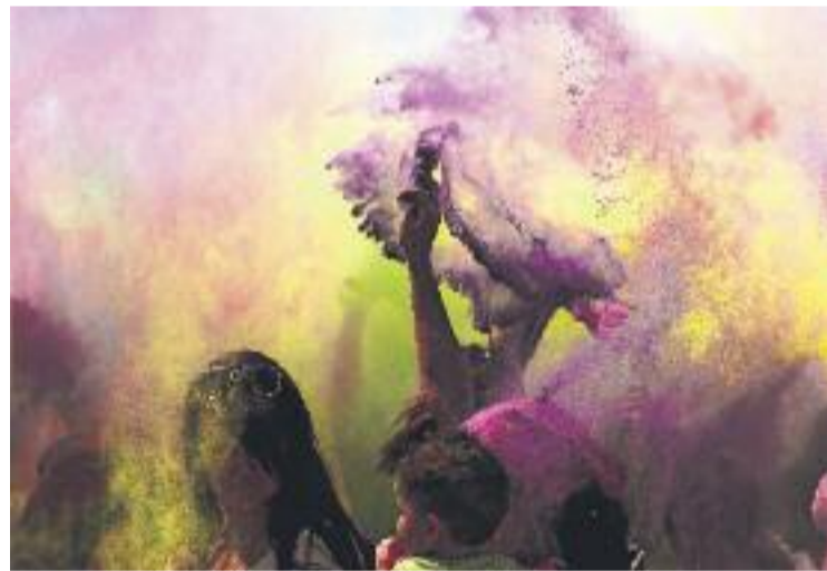
Moment del llançament de la pols de colors.