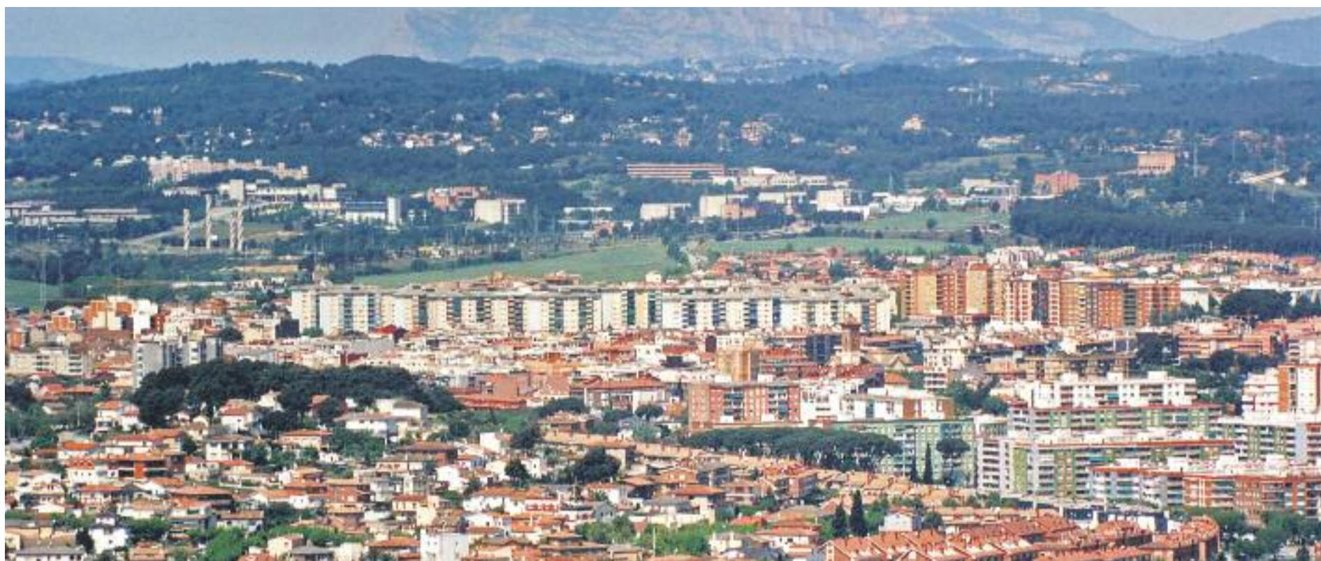
El PSC perd les alcaldies de Cerdanyola, Barberà i Ripollet en favor de partits polítics sorgits de plataformes ciutadanes.