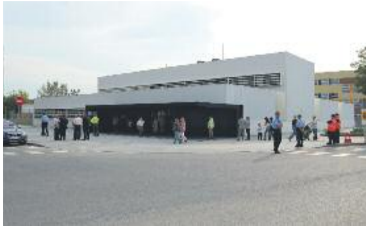
Denuncien deficiències als centres sanitaris de la ciutat.

Els professionals dels centres afirmen que no se senten defensats per la direcció, cosa que fa un any va provocar que signessin un escrit adreçat als seus responsables explicant la situació. Com que diuen que no han