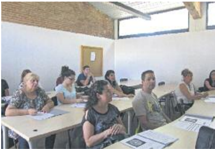
Una de les sessions del 'Comerç BdV 2.0'.