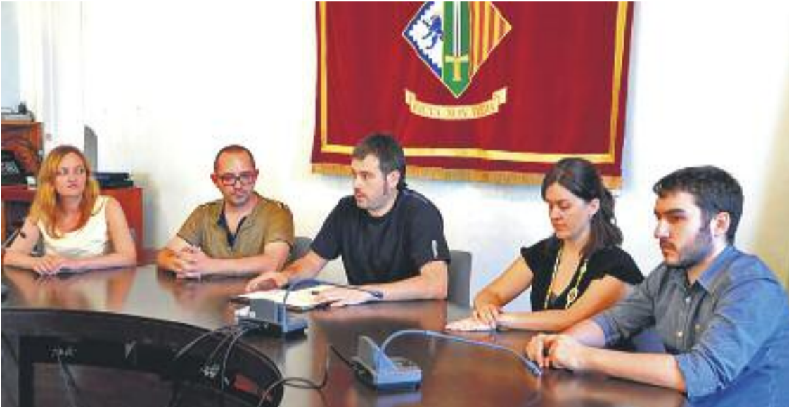
Roda de premsa de presentació del cartipàs municipal.

» L'executiu està format, de moment, pels cinc regidors de Compromís » ERC aposta per una majoria suficient per impulsar un pla de mandat