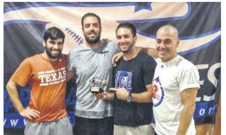
Una imatge de la festa dels Rookies.

BARBERÀ ▶ La temporada 2014-2015 ha arribat a la seva fi, i els Rookies van celebrar una gran festa per acomiadar-se fins al curs vinent.