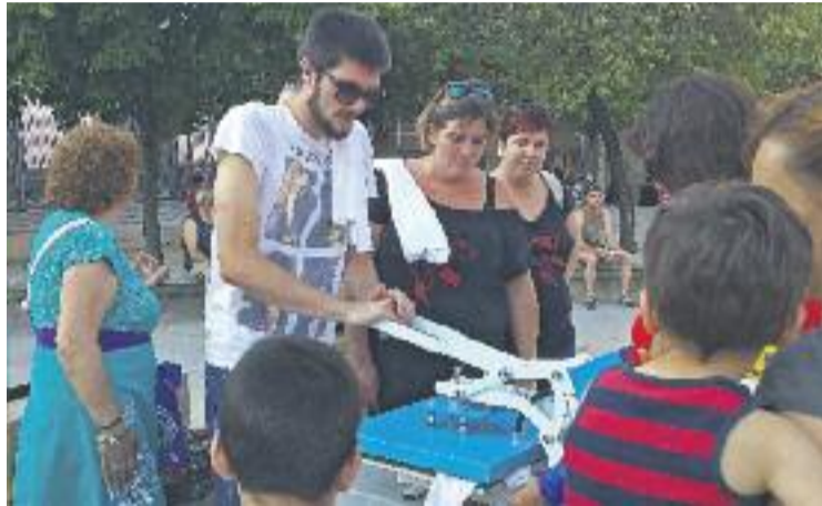
Un dels moments de la Festa Major.

manera, un any més, els diables i els gegants han estat uns dels protagonistes de la festa. Però la cita també ha comptat amb danses d'arreu del món, diferents tornejos, jocs d'aigua, concursos i molta música.