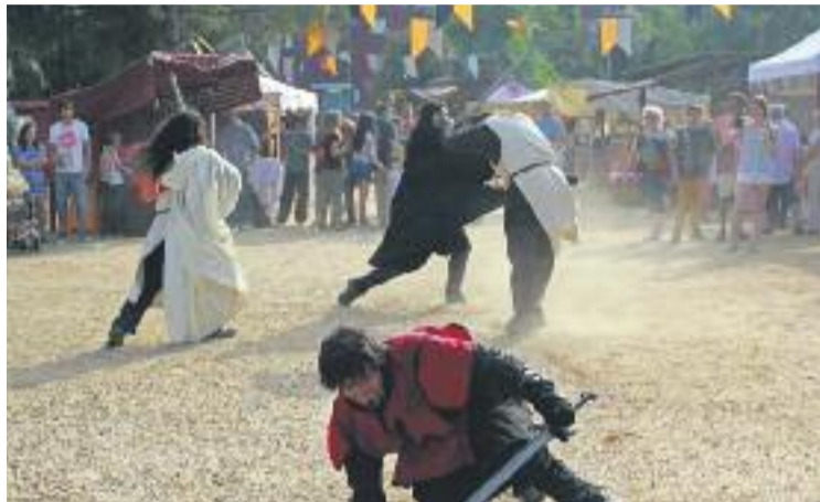
Les lluites de cavallers van ser un dels plats forts del Mercat.

A més, com a novetat en aquesta 17a edició del Mercat, va tornar a participar en la festa l'Associació de Veïns i Veïnes La Romànica. Aquesta entitat va