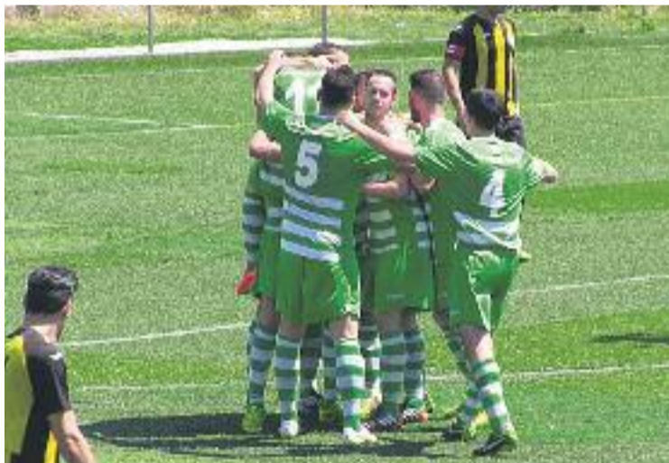
Els verd-i-blancs s'abracen després de la victòria a Barcelona.