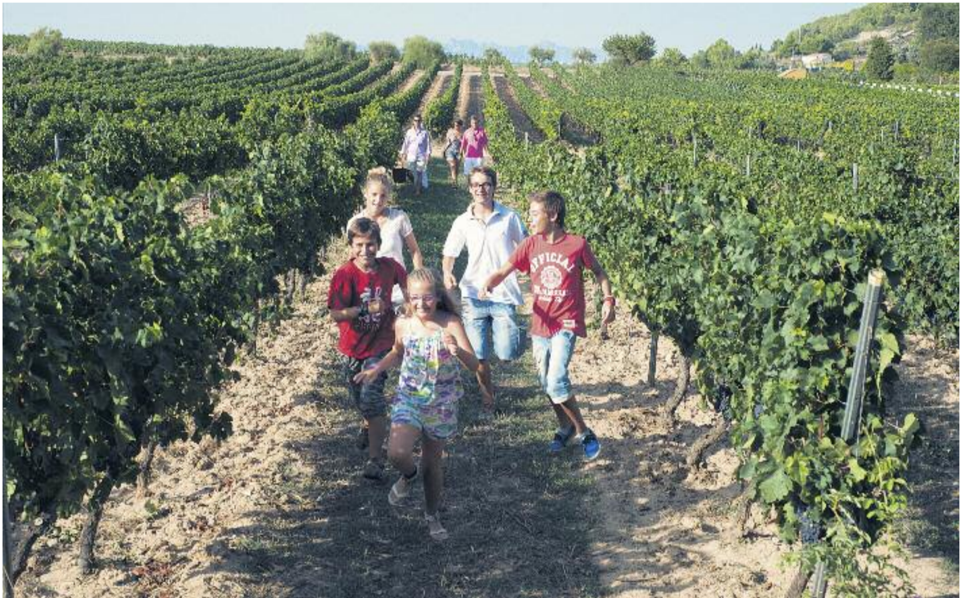
Petits i grans poden gaudir d'activitats i visites a les vinyes de la Denominació d'Origen Penedès.

» Quatre cellers de la Denominació d'Origen Penedès proposen rutes i activitats pensades per a explicar a tota la família els secrets dels seus vins i caves, capaços de sorprendre els més sibarites