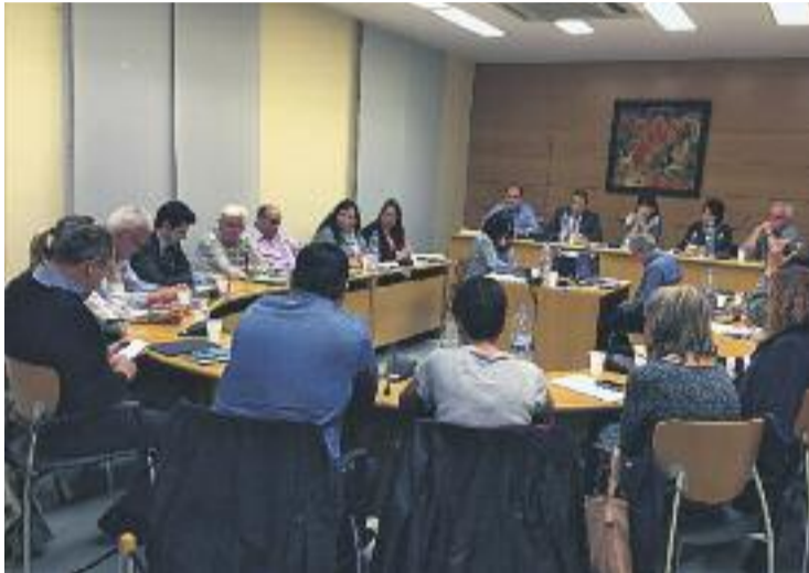
Ple municipal del mes d'abril.

Aquest nou Pla permet la planificació de la mobilitat urbana partint d'una anàlisi de la situació actual per establir posteriorment els principis, objectius i línies d'actuació que permetin millorar la mobilitat a llarg termini. L'elaboració del PMUS esdevé obligada per llei per a tots aquells municipis que són capital de comarca, per aquells que sobrepassen els 50.000 habitants i per als municipis, com