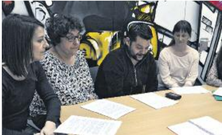
Presentació del Pacte Local per a l'Educació en el Lleure.

Per tant, els infants que assisteixin a casals d'estiu reflexionaran entorn del fenomen del consum a la nostra societat. Això farà que tant el centre d'interès com les activitats girin entorn de potenciar valors com la igualtat, la solidaritat i l'autoestima amb la finalitat d'ajudar l'infant com a persona. Pel que fa a la metodologia, es continuarà treballant la participació,