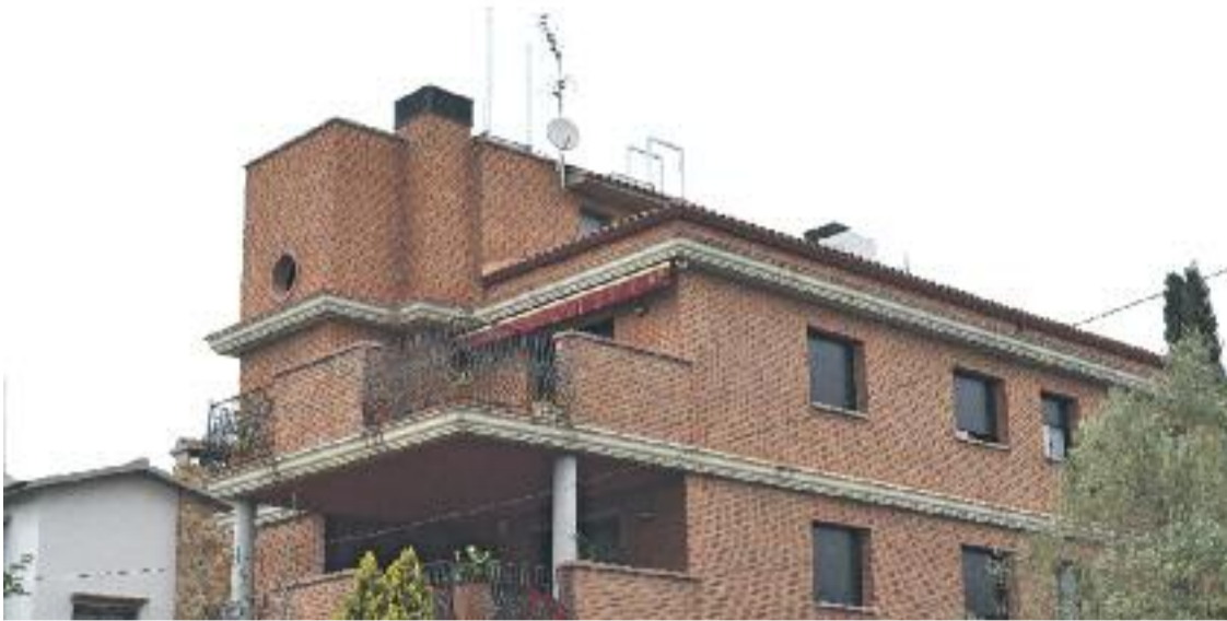
Una imatge de l'edifici on s'havia començat a instal·lar l'antena de telefonia mòbil.