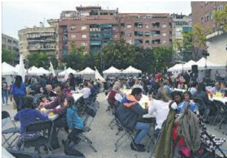
Prop de 6.000 persones van gaudir del Tastem Barberà.

Aquest primer Tastem Barberà va comptar amb la participació d'una dotzena de restaurants barberencs que van instal·lar punts de degustació, en els quals es podia gaudir del menjar mitjançant l'adquisició de tiquets que incloïen la beguda. La Mostra també va comptar