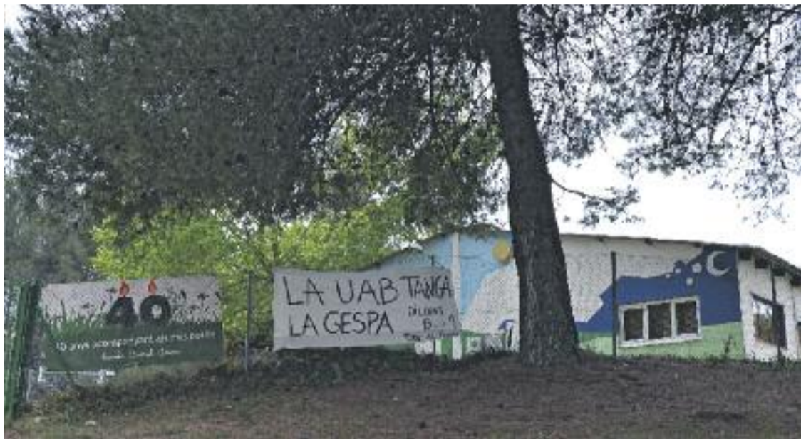
El Consell de govern de la UAB ha aprovat tancar l'escola bressol La Gespa a partir del pròxim curs.

» L'Ajuntament de Cerdanyola, el Claustre de la UAB i 1.600 persones s'havien posicionat en contra del tancament de la llar d'infants