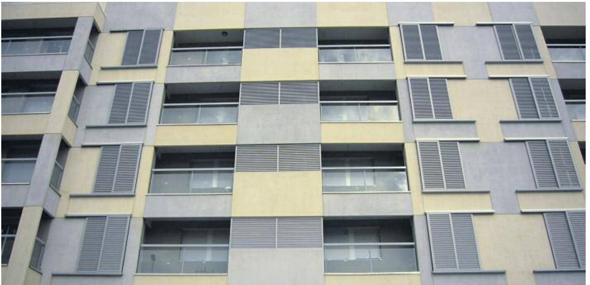
La PAH de Cerdanyola, l'Ajuntament i la cooperativa Sostre Cívic busquen solucions per donar sortida als pisos desocupats.