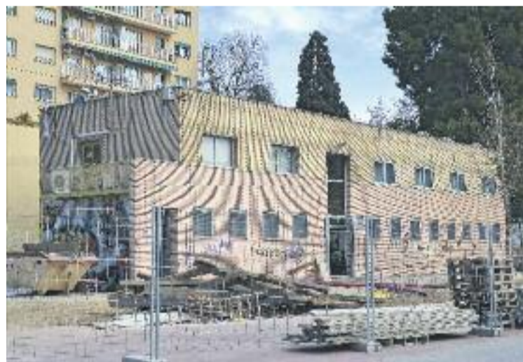
La reforma del Casal de Joves costarà 329.000 euros.