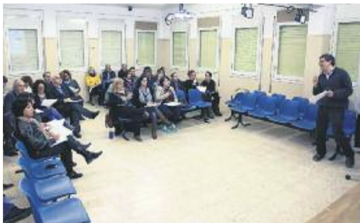
Una de les sessions de treball.

Fa unes setmanes, els actors implicats es van tornar a reunir per posar en comú les 12 alegacions presentades al reglament d'organització i funcionament de la Taula, per consensuar el text final que haurà de debatre's en pròximes sessions del Ple Municipal del consistori barberenc. A la sessió van participar