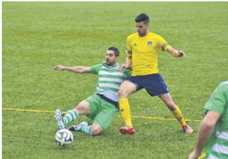
El partit va ser intens però va acabar amb empat a zero.

Tot i que no van aconseguir foradar la porteria dels del Baix Llobregat, els homes de Toni Carrillo van arrencar amb força, i van gaudir de les millors ocasions de la primera part, com un cop de cap que va resoldre el porter Planagumà amb una gran es-