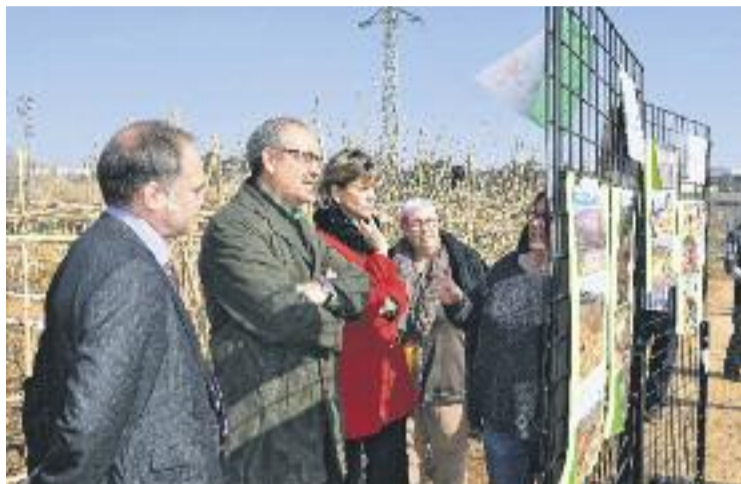
Visita al nou projecte social al Molí d'en Xec.

La iniciativa, que ha estat impulsada per la cooperativa El Jardinet, amb el suport econòmic de la Fundació "la Caixa" i l'aportació dels terrenys de mitja hectàrea, realitzada per l'Ajuntament, té per objectiu proporcionar la formació laboral i l'aprenentatge dins el sector de l'agricultura ecològica a persones en situació de vulnerabilitat social, al llarg d'un any. Actualment participen en el projecte 14 usuaris, tutelats pels Serveis Socials municipals. L'experiència ajudarà a cobrir les necessi-