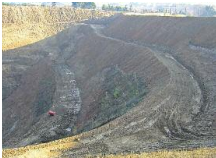
Compromís espera que s'anul·li el segon estudi de Can Planas.