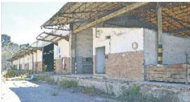
Naus de l'empresa Uralita a l'espera de ser enderrocada.

L'empresa ja ha anunciat que recorrerà la sentència perquè fins a l'any 1982 "no existia cap normativa sobre el rentat de roba". Fonts de la companyia reiteren que es va respectar la legislació específica i asseguren que "Uralita va ser pionera en l'a-