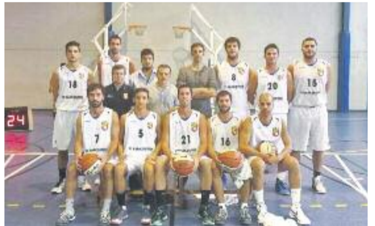
El Barberà segueix a poca distància del líder, el Masnou.

COMARCA ▶ El Baricentro Barberà va aconseguir diumenge 1 de març una victòria de prestigi (69-94) davant del Mataró, el quart classificat del grup 1 de la Copa de Catalunya de bàsquet.