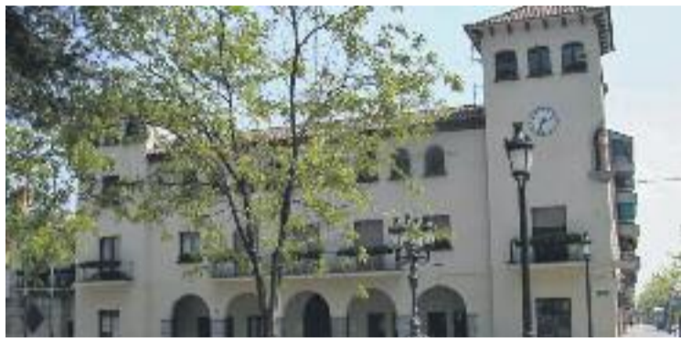
Façana de l'Ajuntament de Barberà.

L'Ajuntament explica que va rebre per part de PxC una petició per tal de realitzar la recollida d'aliments solidària "sense cap vinculació amb l'entrellat social del municipi". Des del consistori se'ls va denegar la sol·licitud perquè "ja hi ha establerta una organització, amb coordinació ciutadana, que s'ocupa