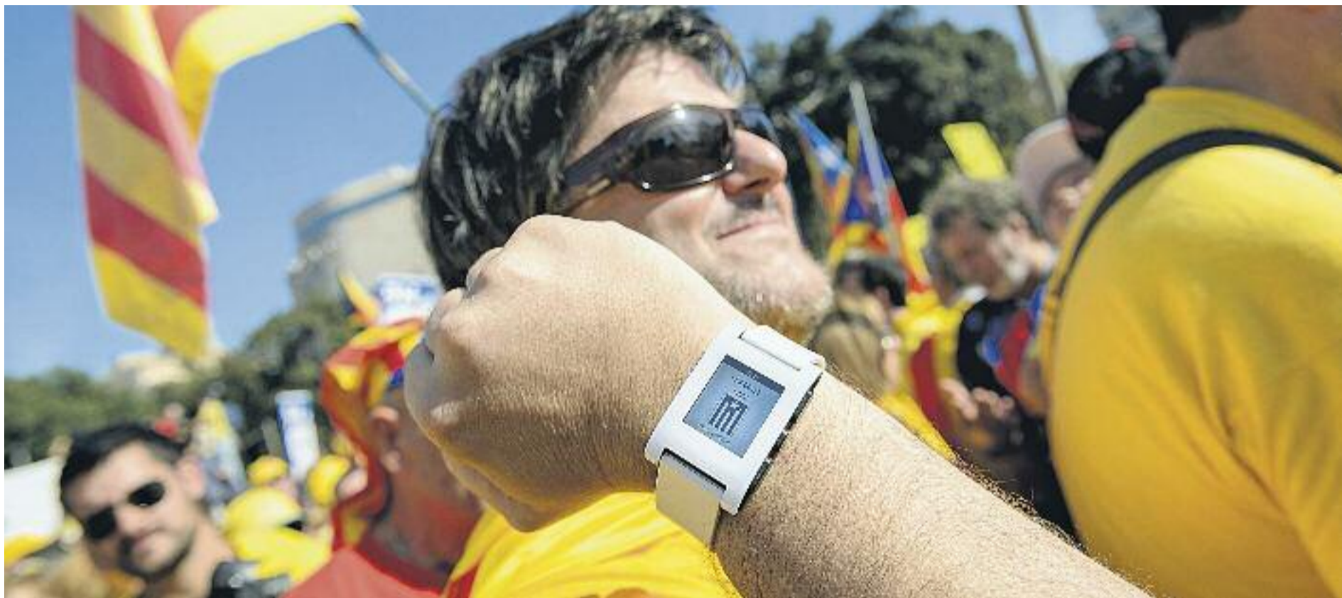
El nou 9N serà una nova oportunitat perquè els catalans expressin la seva voluntat política.

» Hi haurà una infraestructura de 6.695 meses repartides en 1.317 locals de participació de 942 municipis » Tothom que vulgui ja pot consultar, a través del web www.participa2014.cat , el lloc on ha d'anar a votar