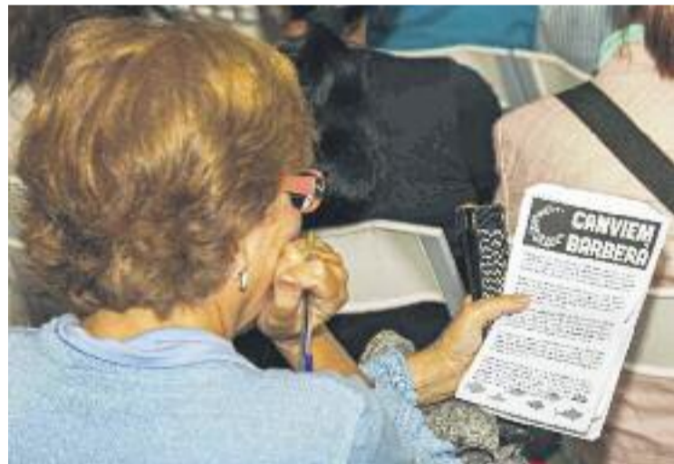
Presentació de Canviem Barberà.