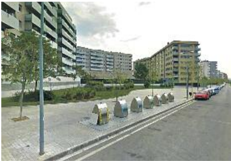
El barri de la Farigola demana més presència policial.