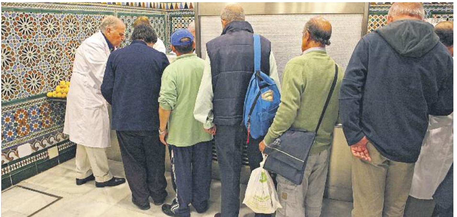
Des del 2009 el nombre d'atesos per Càritas al Vallès ascendeix a les 300.000 persones.