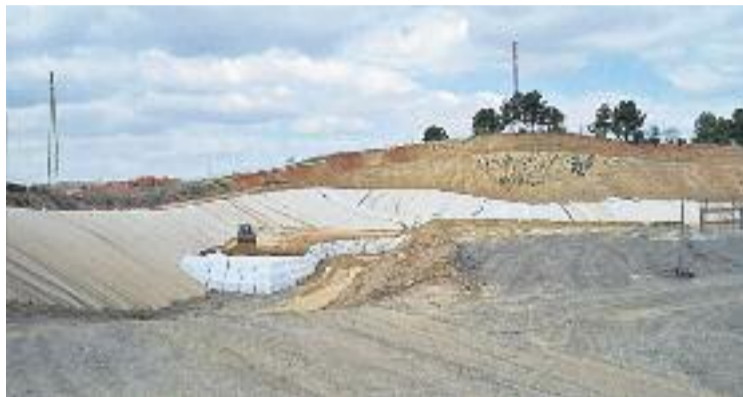
L'abocador Elena de Cerdanyola.

Des de Cerdanyola sense abocadors asseguren que aquesta documentació, que ells mateixos van reclamar, està incompleta i afirmen que s'ha donat una situació de descontrol al dipòsit, ja que s'estan emetent gasos i generant lixiviats amb els que no comptaven. Això ha provocat que des de 2011, quan va entrar l'última bala de residus al