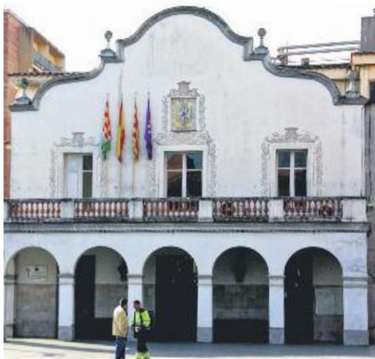
Façana del Ajuntament de Cerdanyola.