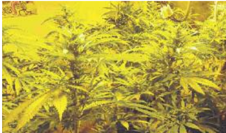
Plantes de marihuana decomissades.

aquesta plantació, batejada com Oscaphone , s'ha desenvolupat de manera simultània a Barcelona i Osca i també ha permès desarticlar una organització dedicada al robatori de botigues de telefonia mòbil.