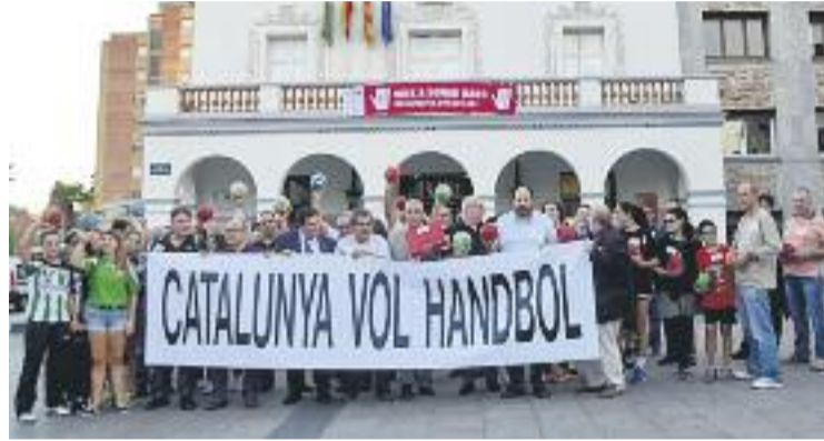
Manifestació del 20 d'octubre passat.

La FCH va agafar una mica d'aire el passat 15 d'octubre, quan el jutjat del mercantil número 6 de Barcelona va desestimar la impugnació que va demanar l'Ajuntament sobre el conveni de creditors i el pla de viabilitat presentat per la federació amb el vistiplau de l'administrador concursal –cal recordar que la federació fa un any que està en concurs de creditors–, un conveni que garantiria