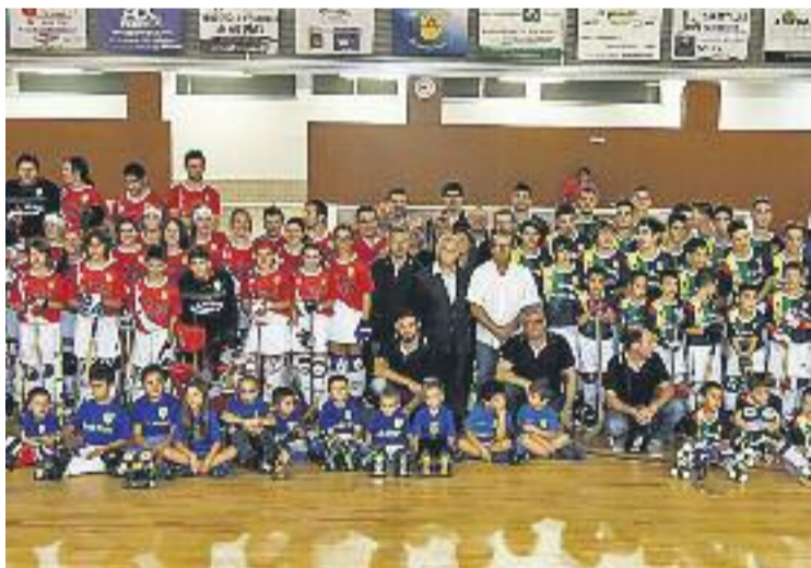
L'entitat barberenca compta amb prop de 200 jugadors.