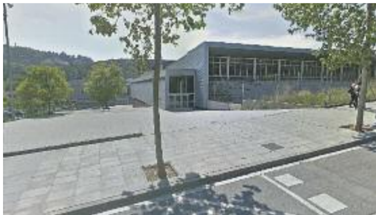
Visió exterior del PEM Guiera.

Segons informen fonts municipals a Línia Vallès , es desco-