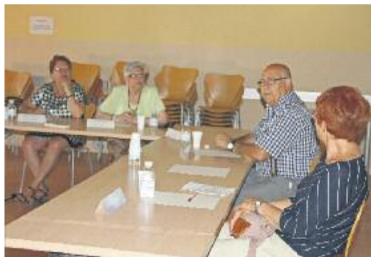
Un dels grups de debat sobre el voluntariat de la ciutat.

El pròxim 27 de setembre es portarà a terme una reunió per assolir una bona xarxa d'entitats amb projectes de voluntariat.