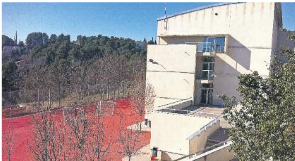
Edifici actual de l'escola Ramon Fuster.

» L'EMD de Bellaterra considera que l'aprovació inicial del Pla especial del centre per part de l'ajuntament de Cerdanyola és contrària a dret