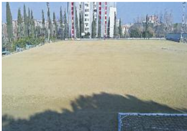
Vista general de la instal·lació esportiva.