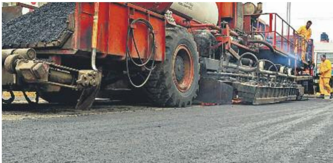
En els treballs d'asfaltat s'ha invertit un total de 423.197 euros.