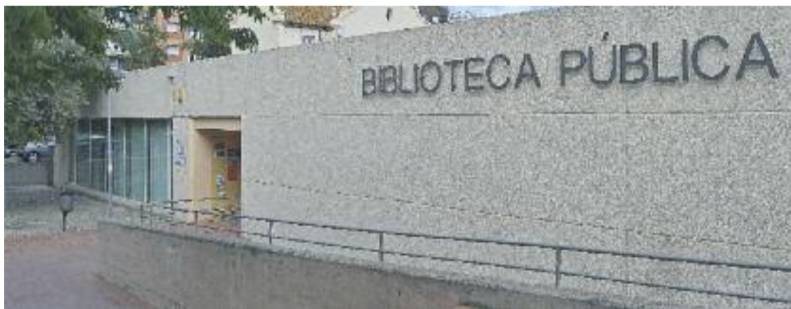
Façana de la biblioteca municipal de Ripollet.