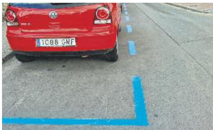
El PP denuncia que Cerdanyola Aparca té pèrdues d'1,3 milions.

Buenaño afirma que "Cerdanyola Aparca S.L. continuarà