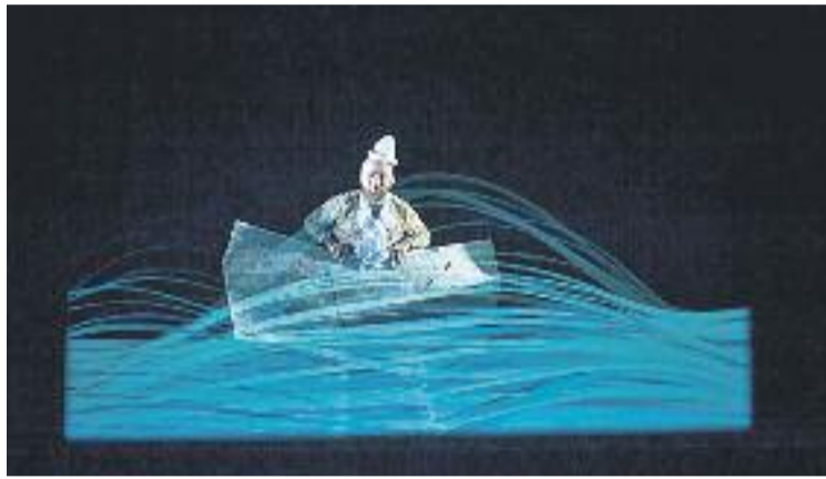
Una imatge de l'obra Augmented Pinocchio.

En aquesta novena edició, un dels principals atractius serà l'estrena a Catalunya i a l'estat de l'obra Augmented Pinocchio de l'italià Michele Cresmaschi. Es tracta d'un espectacle que com-