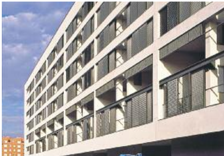
47 noves famílies han sol·licitat ajuts per pagar el lloguer.

tament també dona ajuts d'urgència especial a les persones que tinguin un deute puntual a causa d'una circumstància eventual de quotes hipotecàries fins a un màxim de 3.000 euros i que justifiquin que poden seguir fent front al pagament de les men-