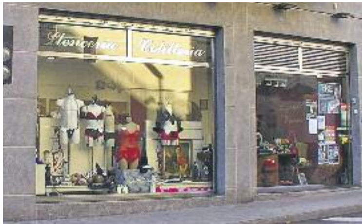
La presumpta estafa l'estaria fent una empresa de Màlaga.

Segons els Mossos, una empresa de Màlaga fa trucades informant els comerciants que per donar-se de baixa del servei de publicitat per internet, que suposadament haurien contractat prèviament, han de pagar 398 euros, i que si no fan efectiu el pagament, més endavant els cobriran 800 euros. Els comerciants que reben aquestes trucades en cap moment s'han donat d'alta a cap tipus de publicitat. Passat un o dos dies els comerciants reben un paquet postal dut per un transportista de