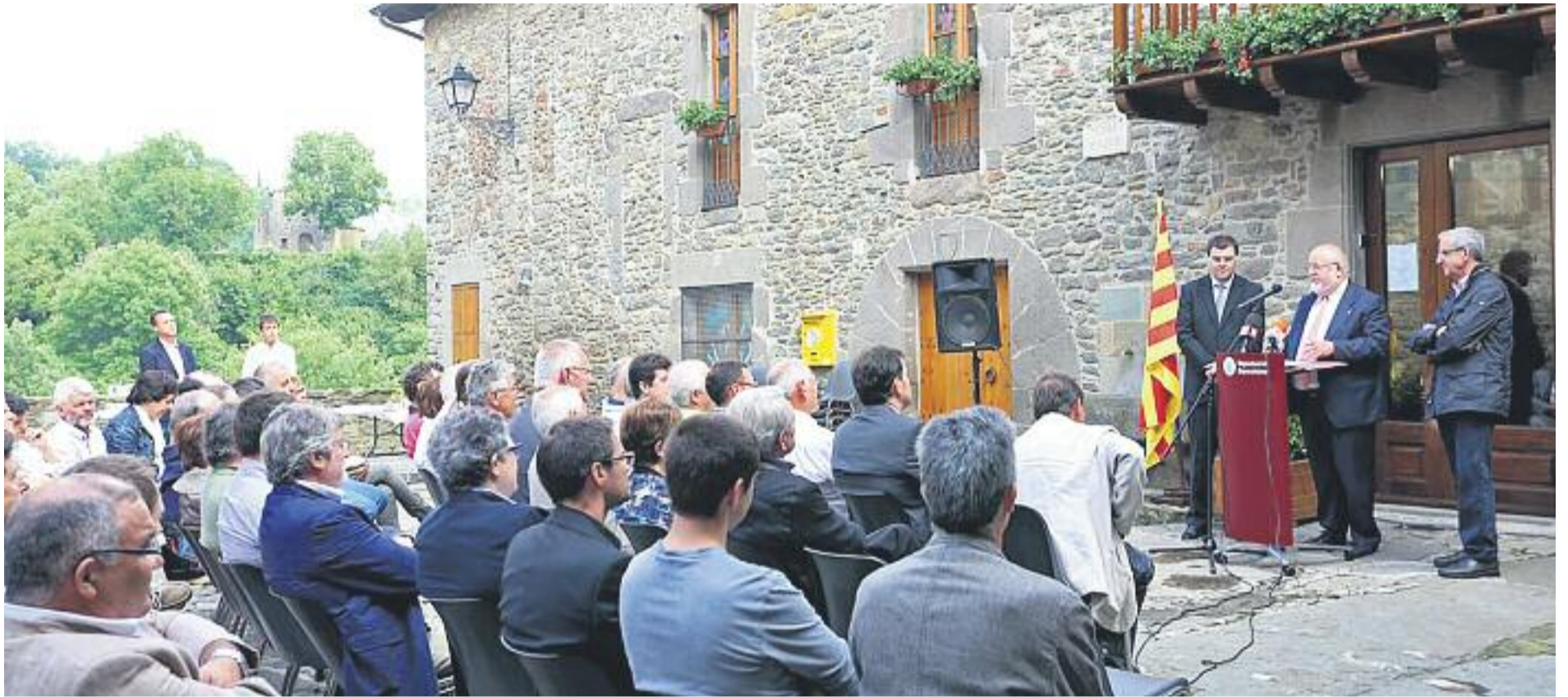
El nou programa de suport a les inversions locals, presentat a Rupit i Pruit, està dotat amb 50 milions d'euros.

Catalunya té un total de 946 municipis, distribuïts en 41 comarques. Una de les principals característiques dels pobles catalans és que una part important són d'unes dimensions reduïdes. 476 es troben entre els 100 i els 1.000 habitants, 254 entre els 1.001 i els 5.000, 131 entre els 5.001 i els 20.000, 36 entre els 20.001 i els 50.000 i 23 per damunt dels 50.000 habitants.