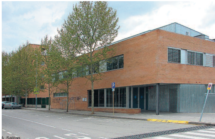
CAP Canaletes.

L'acord assolit preveu que el CAP de Les Fontetes romangui tancat exclusivament del 28 de juliol al 29 d'agost. Durant aquest període els pacients seran atesos al CAP Canaletes. Segons l'Ajuntament, aquest calendari suposa una important millora en relació amb l'any 2013, quan el consultori va tancar des de l'1 de juliol fins al 15 de setembre, més enllà del que