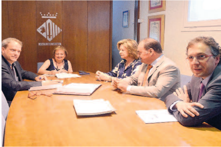
Signatura del contracte entre el consistori i Tuyols.

El nou tanatori, que estarà ubicat just davant de les instal·lacions de l'actual cementiri, disposarà de quatre sales de vetlla, sala de cerimònies multifuncional, sala d'espera i una zona de cafeteria. El tanatori es construirà i equiparà durant els dos primers anys del contracte juntament amb el crematori i en paral·lel al condicionament de les infraestructures, aparcament i accessos al cementiri. Aquesta primera fase també inclou l'ampliació inicial del cementiri. En una segona fase, prevista per al tercer any, es contempla la con-