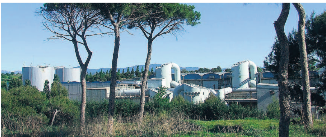
Els investigadors de la URV han detectat una substància potencialment cancerígena a la zona.

» L'AMB ha encarregat un estudi a la UPC per verificar si aquesta situació denunciada per investigadors de la URV és certa