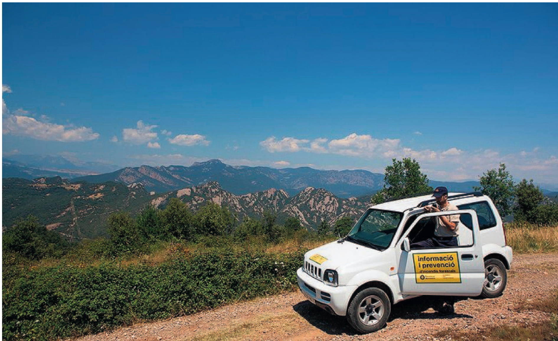
El Pla té com a finalitat principal evitar els incendis i limitar els seus efectes.