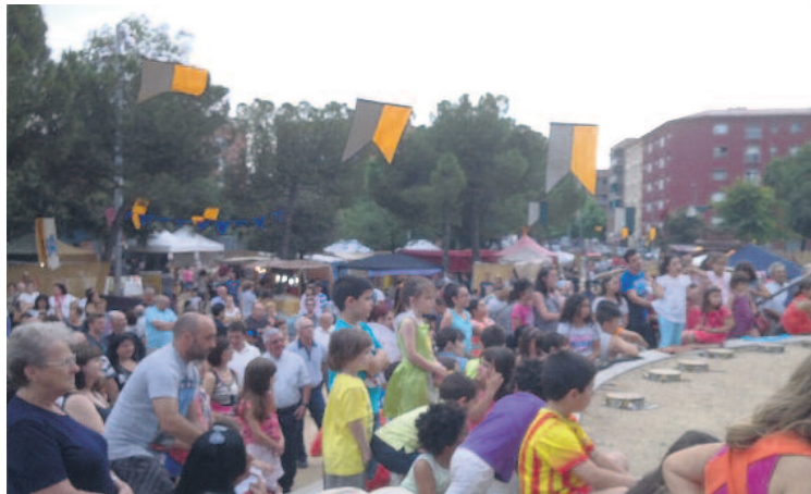
Un moment dels espectacles del Mercat.

diferents propostes lúdiques com un divertit carrusel, un taller de ceràmica, així com un espai dedicat als cavallers.