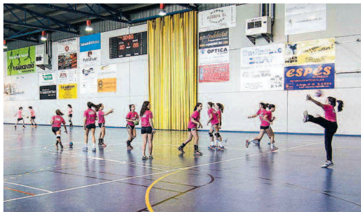
Uns 30 equips d'arreu del país van participar en la trobada.

Més d'un miler de persones van passar durant tot el cap de setmana pels dos pavellons barberencs. Pel que fa als participants en les competicions, prop de 30 equips de diversos punts de la geografia catalana van assistir a la cita esportiva.