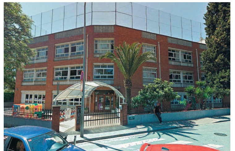
Façana del Col·legi Nostra Senyora de Montserrat.

ENSENYAMENT ▶ El col·legi Montserrat s'ha mostrat disconforme amb la sentència que el condemna al pagament d'una sanció de 50.770 euros per l'assetjament patit per un exalumne de l'escola.