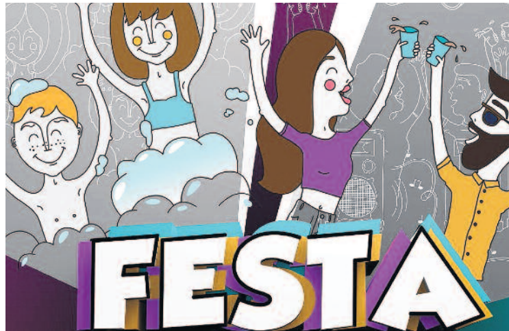
Detall del cartell de la Festa Major.

Dissabte i diumenge seran els dies forts de la festa, en els quals es concentraran el nombre més gran d'activitats. Entre les activitats més destacades es troben la Fira de la cervesa, la Fira foraestock, els campionats de