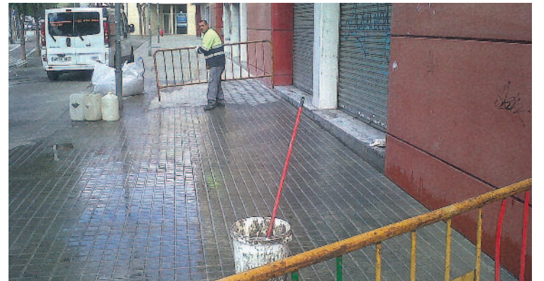
Un dels aturats contractats amb aquests programes.

La Fundació Barberà Promoció és l'encarregada de fer les contractacions en col·laboració amb altres àrees del consistori que determinen les feines necessàries en cada moment.