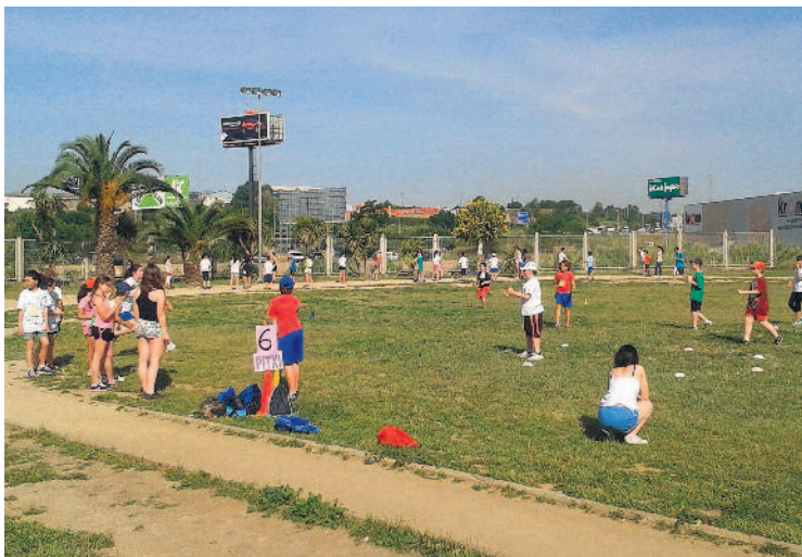
Els infants van gaudir de diverses activitats lúdiques i esportives.