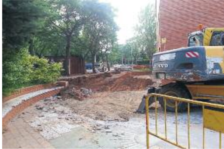
Obres de l'exterior de l'Ateneu.

Els treballs permetran obrir un nou accés a la cantonada entre els carrers Torras i Bages i el carrer de la Indústria ocupant l'actual mur i ampliant la vorera. Es construirà un pas a la