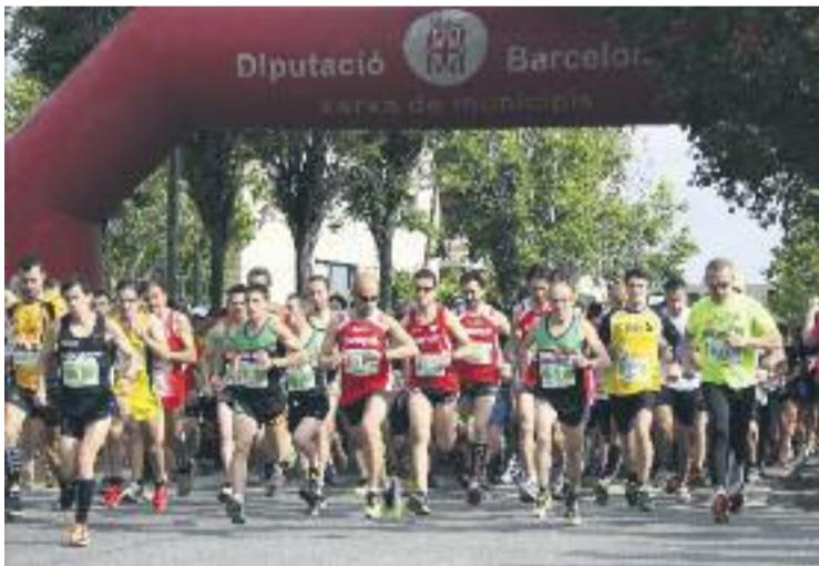
La Cursa per Collserola està ben valorada pels participants.