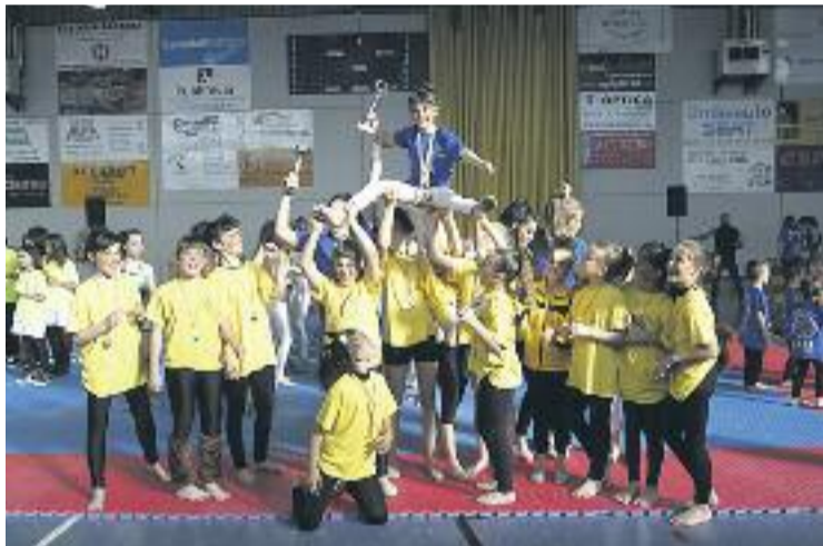
La diada esportiva va comptar amb una alta participació.

En l'àmbit de les modalitats de grup, va ser el Grup de pallassos, també del Bunkai, qui va endur-se la victòria en la categoria benjamí, mentre que en aleví el Grup Sirenes va aconseguir la victòria. La jornada es va cloure amb l'entrega de premis a aquests joves esportistes que ara mateix són el futur de la gimnàstica catalana.