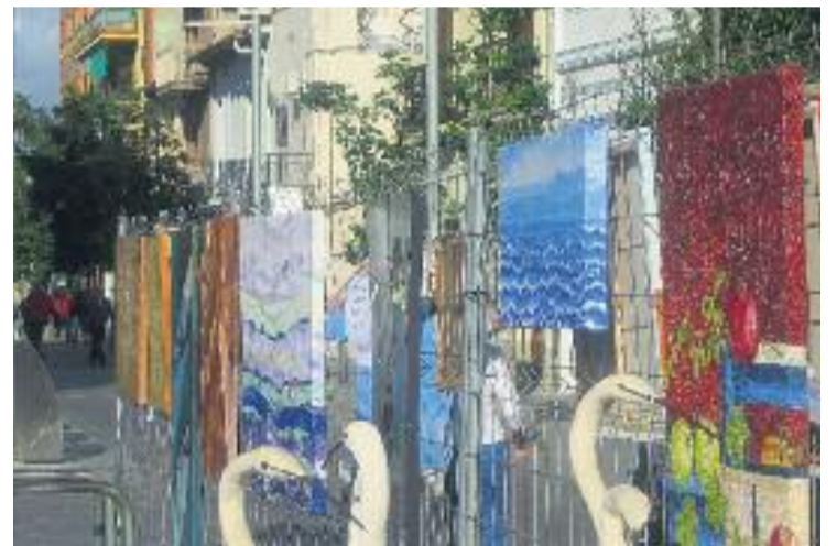
Obres d'alguns artistes de l'anterior edició.

CULTURA ▶ Més de 20 artistes de Cerdanyola i rodalia es van reunir dissabte davant del Museu d'Art per exposar les seves obres.