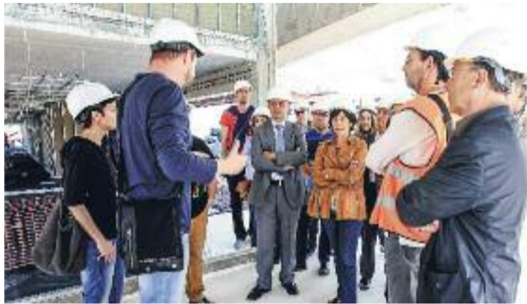
Visita de l'alcalde a les obres de l'escola.

La distribució de l'edifici es distingeix en diferents blocs. Per una banda, hi haurà l'ampli vestíbul de l'escola, que s'ha configurat com un connector