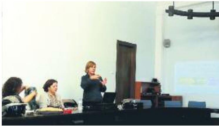
Consell Municipal de Polítiques de Dones.