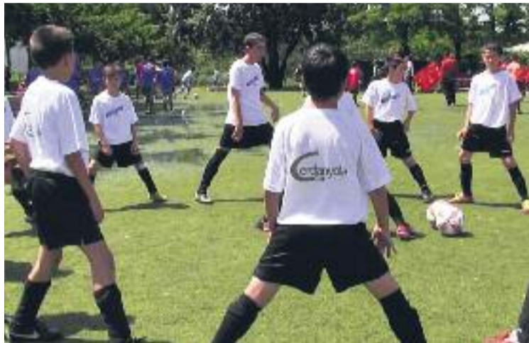
La competició s'ha consolidat en l'àmbit del futbol formatiu.

El torneig vallesà comprèn les categories infantil i benjamí, i és un espàrring perfecte per veure els inicis dels futurs cracks del futbol català i estatal. Una de les novetats amb què comptarà enguany la Cerdanyola Cup serà l'ampliació del nombre d'equips en categoria aleví, que passaran de 12 a 16. Els clubs que enviaran els seus equips alevins a Cerdanyola seran el València, el Granollers, l'Atlètic Segre, el