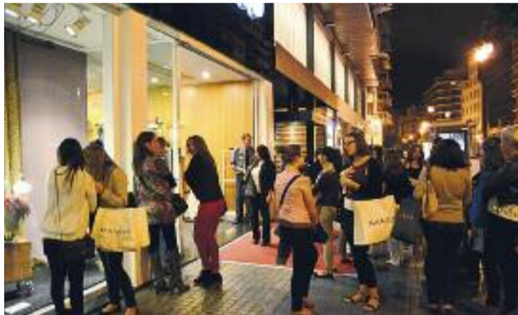
La Shopping Night se celebrarà el 7 de juny.

Enguany, a diferència de l'edició passada, els ciutadans i ciutadanes podran participar en un concurs que s'estendrà fins al 29 de juny. Durant la Nit, els veïns i veïnes de Barberà que comprin en un dels establiments oberts se'ls farà lliurament d'un