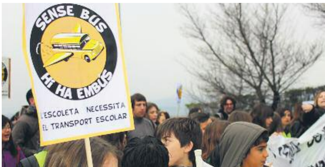
Manifestació dels alumnes de l'escola Bellaterra demanant el transport públic.

» L'Ajuntament havia donat per tancades les negociacions » L'Ampa assegura que la proposta dista molt de les seves necessitats