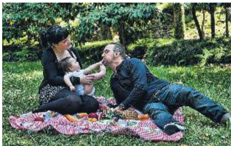
Barberà demana a Rajoy la igualtat entre pares i mares.

nit i de paternitat és desigual, fet que provoca una major dificultat en la integració de la dona en el món laboral i una major responsabilitat d'aquesta en l'àmbit familiar". Per aquest motiu, consideren que "és necessari avançar cap a la plena equiparació dels permisos de naixement, adopció i acolliment entre ambdós progenitors i, d'aquesta manera, en una cura dels fills basada en la corresponsabilitat, fet que segons molts estudis suposaria un gran benefici per al menor".