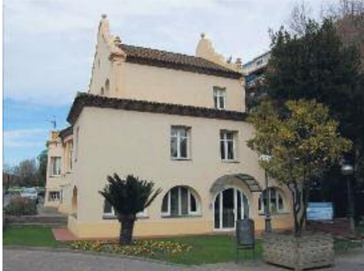
Ajuntament de Ripollet.

Amb aquesta dada, Ripollet es manté molt per sota de la mitjana de la província de Barcelona, que se situa en els 648,43 eu-