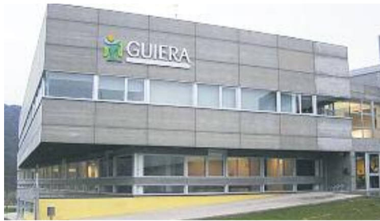
PEM Guiera de Cerdanyola, nucli del conflicte.

Aquest conflicte es remunta 13 anys enrere, quan la FCH va invertir set milions d'euros en la construcció del PEM Guiera. L'Ajuntament en va invertir 3, amb el compromís que Guiera fos la seu oficial de la FCH i amb el benefici de no haver de