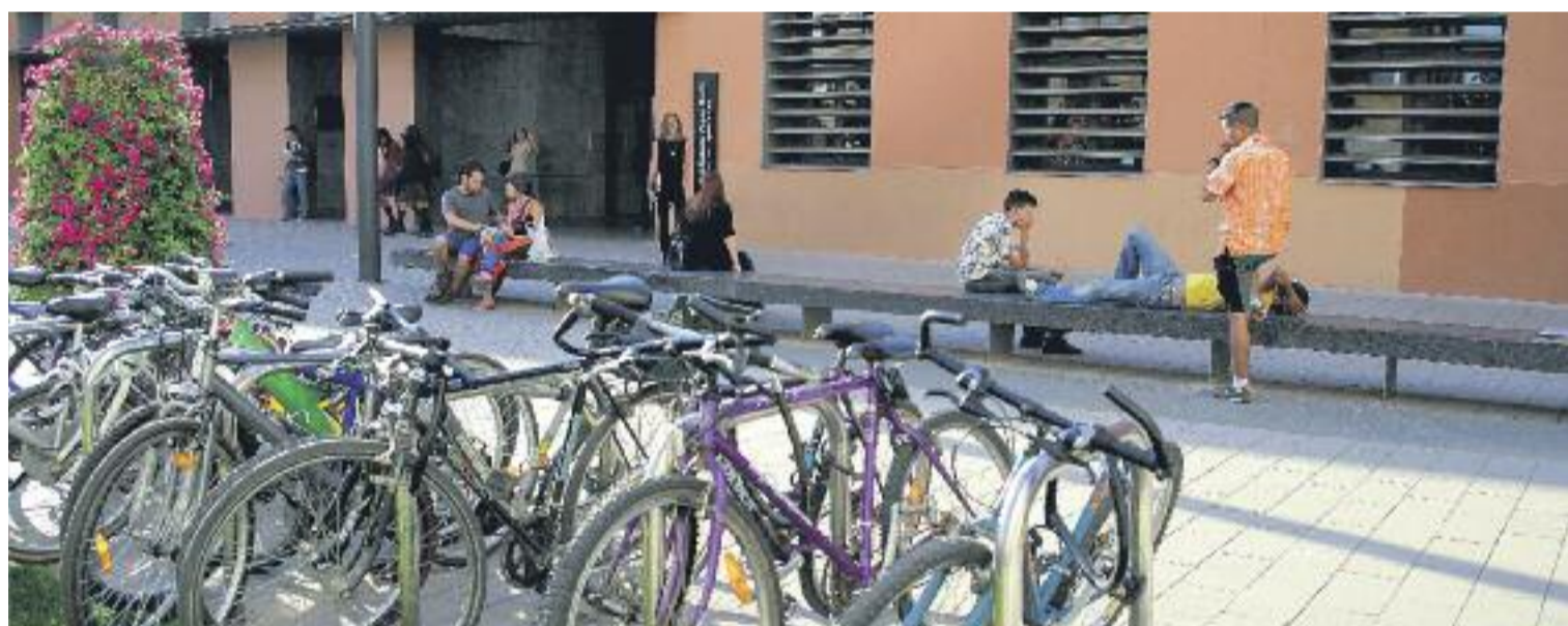
A dalt, servei de préstec d'una biblioteca del Vallès. A baix, entrada de la biblioteca.

província, des de la Diputació de Barcelona s'ofereix el servei de préstec interbibliotecari que permet accedir a la totalitat del fons de la XBM des de qualsevol de les biblioteques. Aquest servei ha crescut any rere any en el conjunt de la xarxa i l'any passat va suposar el moviment de 350.000 documents.