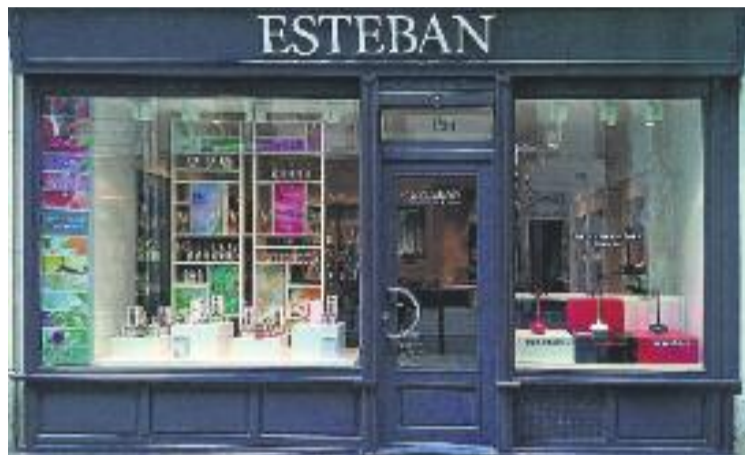
Un dels aparadors visitats.

Els participants en la sessió, per una banda, els guanyadors del Concurs d'Aparadors de Nadal de 2013, i per altra, persones vinculades al món del comerç de la ciutat que van voler conèixer la imatge i les noves tècniques comunicatives per vendre un