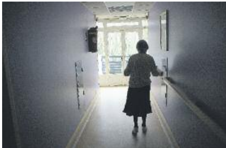
Una nova teràpia reverteix la pèrdua de memòria.

La teràpia plantejada pels investigadors de l'Autònoma consisteix en la injecció a l'hipocamp, una regió del cervell important pel processament de la memòria, d'un gen que provoca la producció d'una proteïna bloquejada en els pacients