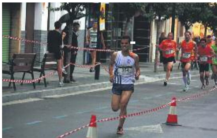
La Milla Urbana aplega molts atletes de Ripollet.

Com és també una tradició durant aquesta prova atlètica, els organitzadors sortejaran a l'acabament un pernil entre tots els participants.