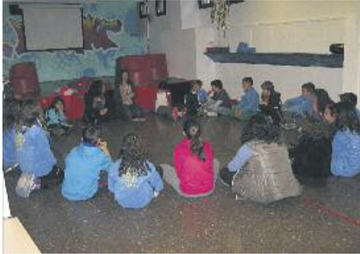
Primera reunió del Consell d'Infants.

Un Consell d'Infants és un òrgan de participació format per un grup de nens i nenes que representen tots els infants de Barberà del Vallès. La seva fun-