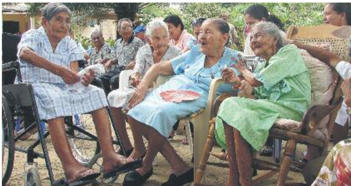
L'esperança de vida dels ciutadans de Cerdanyola és de 83 anys.

» Els homes viuen fins als 80 anys, mentre que les dones arriben als 86 » El nombre de naixements a la ciutat es redueix en un 12,2%