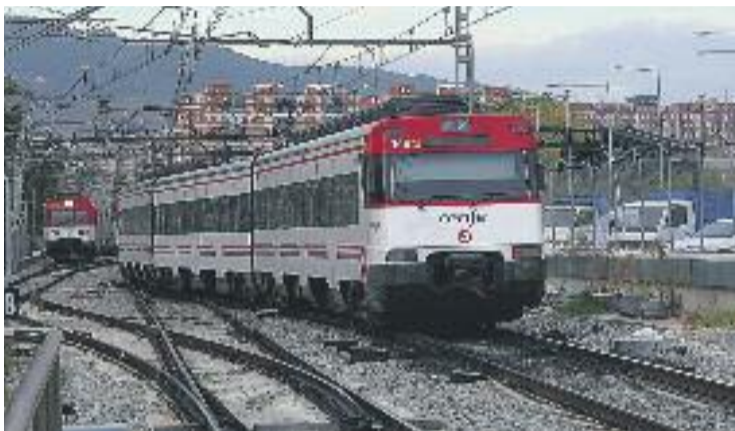
Tren de rodalies.

Per al portaveu del COP-Compromís, J.M. Osuna, "es tracta d'una mala notícia per Ripollet, ja que el municipi continua mal comunicat amb les ciutats del seu entorn i, en els casos que hi ha transport públic, és del tot deficient com és el cas dels autobusos direcció Sabadell o els caps de setmana amb Barcelo-