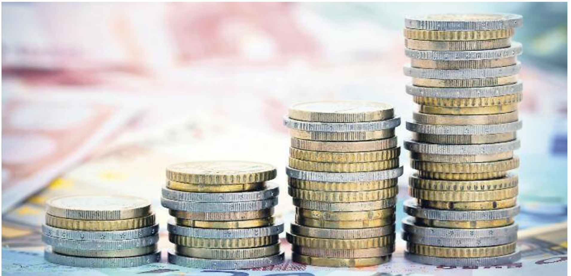
Les empreses del Vallès Occidental disposaran d'una alternativa al finançament de les entitats bancàries: el 'crowdlending'.