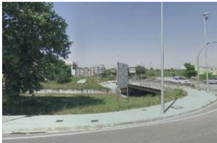
Marge del riu Sec.

Quan als accessos, es mantindran la rampa i les escales existents i se'n faran de nous des del carrer que dona al riu. Tam-