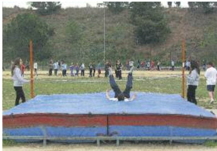
La jornada atlètica va aplegar més de 200 alumnes.

L'objectiu de la jornada era doble. Per una banda es van poder practicar diferents proves atlètiques en unes instal·lacions adients i, per l'altra, els nois van compartir amb la resta de l'alumnat d'altres escoles una jornada lúdica i esportiva.