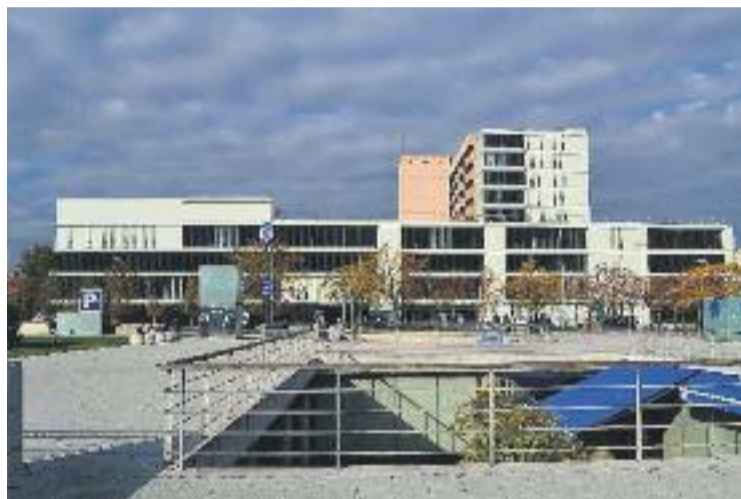
Hospital Parc Taulí de Sabadell.

La previsió és que aquesta moció s'aprovi i que els ajuntaments exigeixin a la Corporació Sanitària Parc Taulí que doni a conèixer tota la documentació i informació requerida. Així doncs, es vol consultar el pressupost, tant dels ingressos com de les despeses, des de l'any 2010, i les actes del Consell de