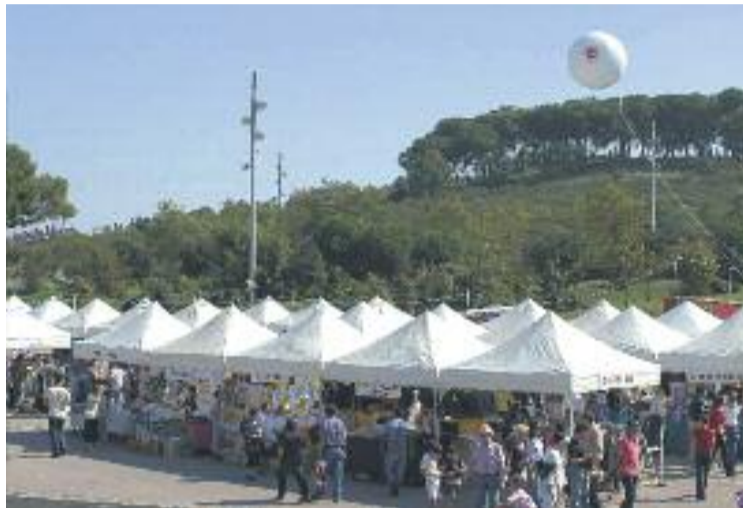
Firestoc de l'any anterior.

Una vegada més, els establiments de molts sectors van muntar la seva parada al parc del Turonet, aprofitant una estructura de tendals i van oferir els seus productes a uns preus