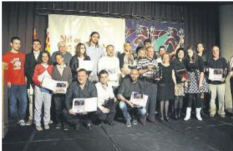
Instantània dels guardonats.

El Club Esportiu Lee Young de Cerdanyola va ser escollit com a millor club de l'any 2013.