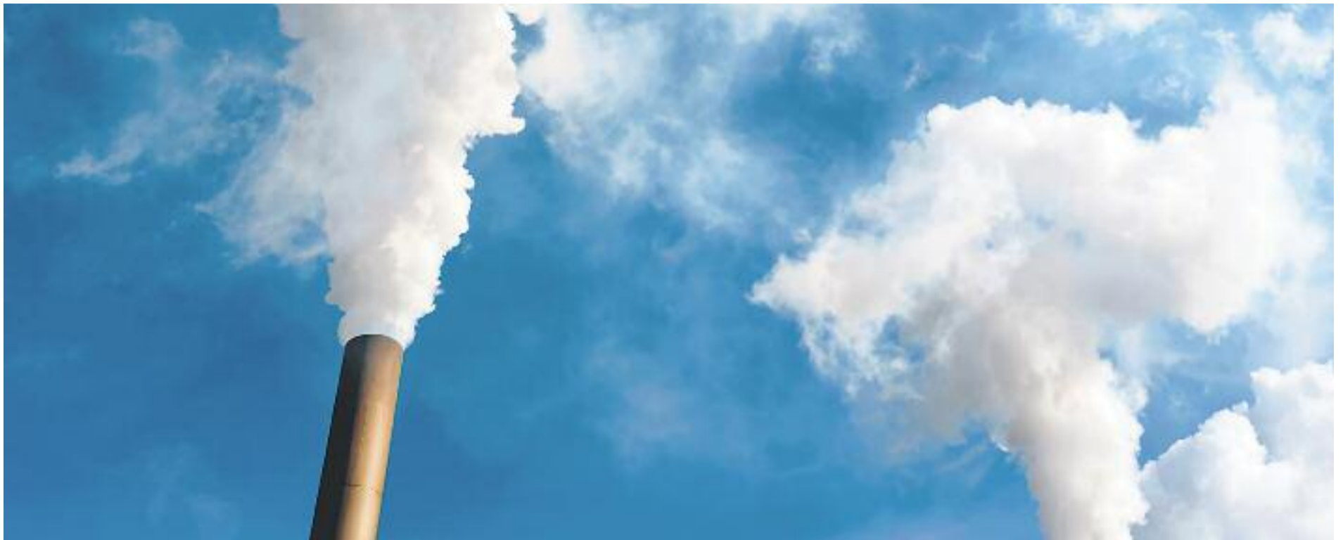
La concentració de cotxes i l'activitat industrial són les principals causes de contaminació atmosfèrica.