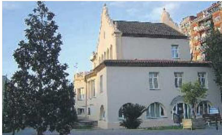
Ajuntament de Ripollet.

El Departament de Política Territorial i Obres Públiques va atorgar l'any 2007 al municipi