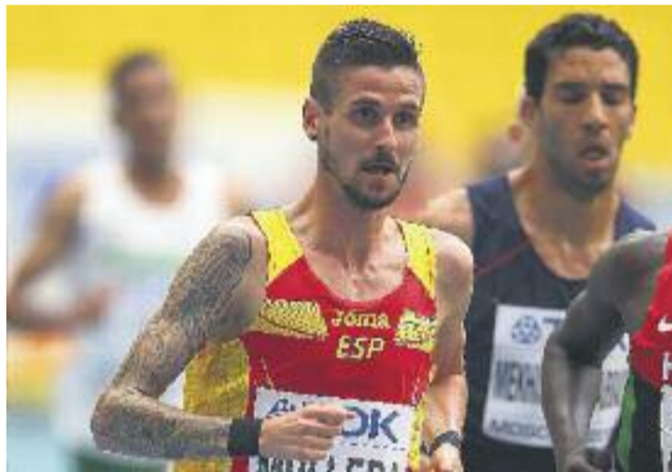
Mullera va disputar la final dels 3.000 obstacles a Londres 2012.

El català va estar implicat en un presumpte cas de dopatge que va estar a punt de costar-li la seva participació a Londres 2012. Allà va estar a punt d'aconseguir medalla, si no hagués ensopegat amb un altre corredor durant la cursa.