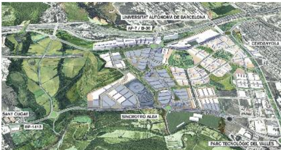
Terrenys del Centre Direccional del Cerdanyola.

» La Generalitat redueix a la meitat els usos comercials » Buenaño dimiteix com a vocal del Consorci del Centre Direccional