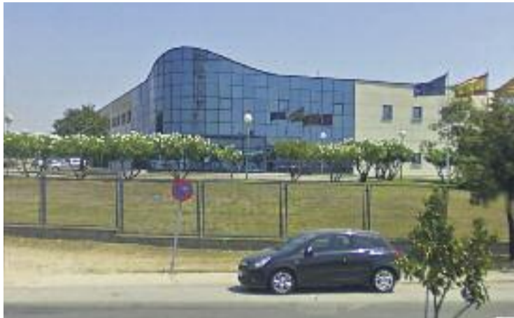
La planta de PPT a Barberà.

PPT és una empresa de la indústria química del sector de l'automòbil que segons els treballadors té viabilitat i projectes