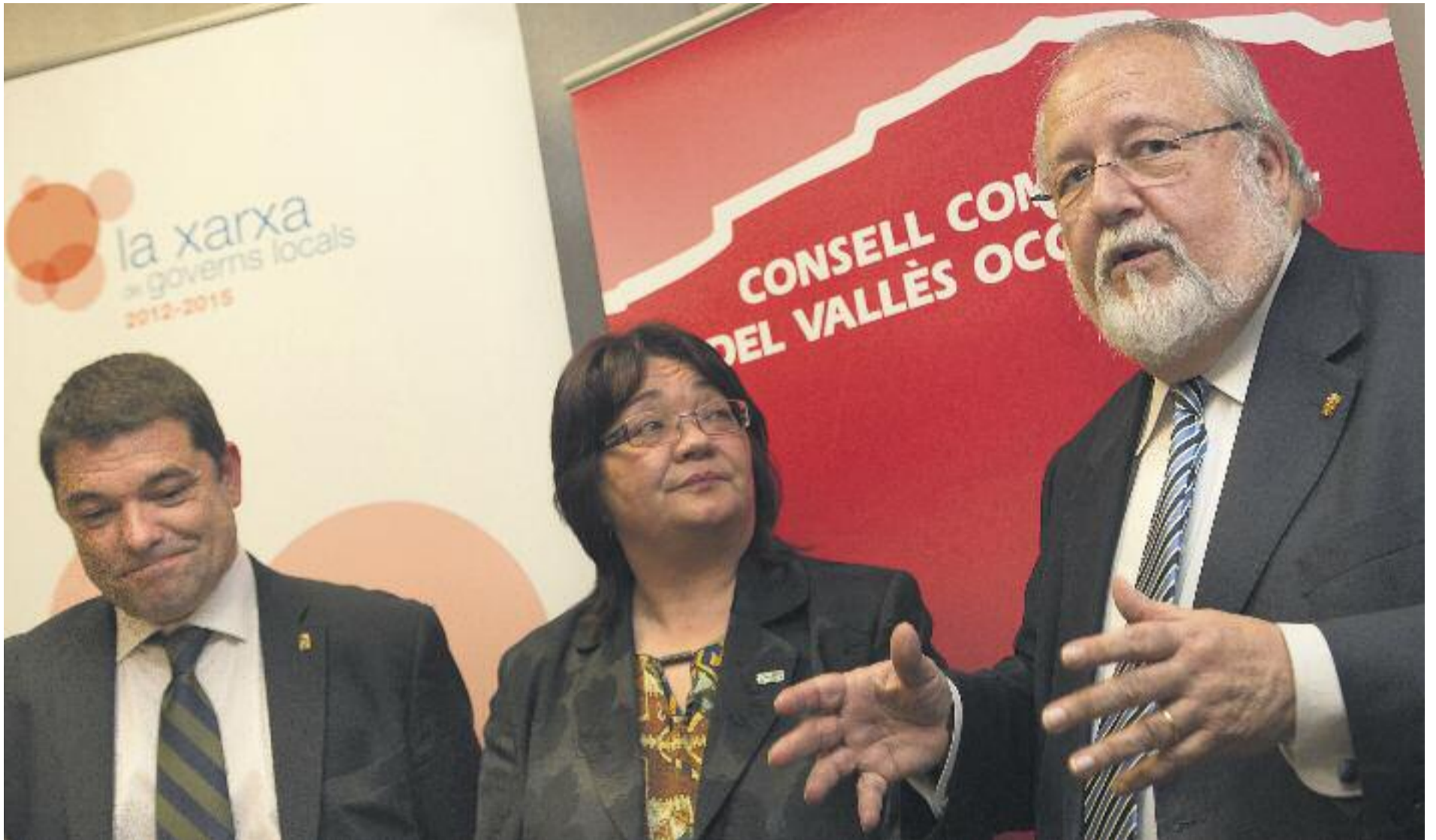
El president de la Diputació, Salvador Esteve, va visitar tota la província per presentar els serveis oferts als governs locals.

Les inversions al territori són fruit del treball en xarxa entre els governs locals i la Diputació per tal de dotar de la màxima autonomia els ens locals. Aquestes inversions van des de les previstes al Catàleg de Serveis, a ajudes d'urgència social, ajudes al transport escolar, programes de crèdit local, assistència financera i les meses de concertació.