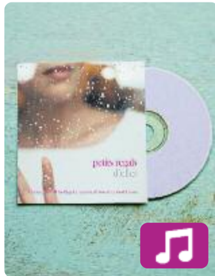
Petits regals d'elles Diverses artistes