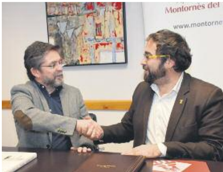
L'alcalde amb el delegat del Govern durant la reunió.

La trobada també va servir per intercanviar impressions sobre altres temes d'interès general com l'accés a l'habitatge o la seguretat a les zones d'oci nocturn. A més, l'alcalde va aprofitar per reclamar a la Generalitat el pagament d'alguns endarre-