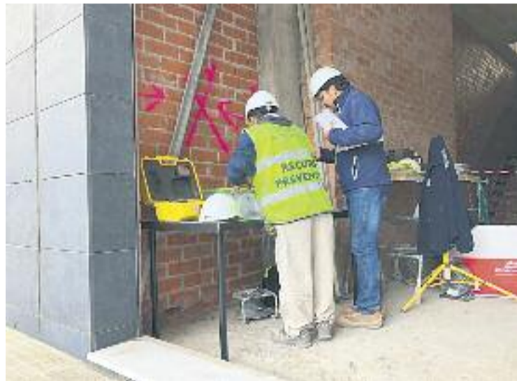
Les obres finalitzaran l'estiu de l'any que ve.

Aquest trasllat és una petició llargament reivindicada pels professionals de la ciutat, ja que els jutjats actuals del carrer Anselm Clavé no compleixen les