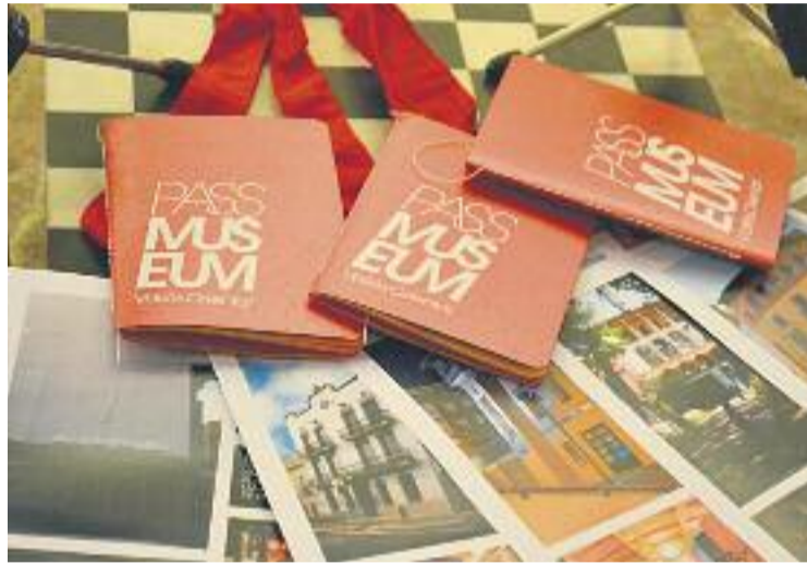
El PassMuseum es va presentar el passat dilluns 3.

Aquesta idea neix en el marc de l'Any del Turisme Cultural, declarat per l'Agència Catalana de Turisme. Així, diferents museus havien estat treballant en una