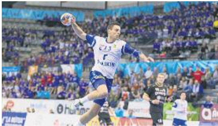
Serà el quart títol oficial que disputarà el BMG.

El BMG serà l'encarregat d'encetar la Copa contra el conjunt basc, demà a les quatre de la tarda, mentre que la segona semifinal es posarà en marxa a les sis. La gran final, que servirà per coronar el primer campió d'una