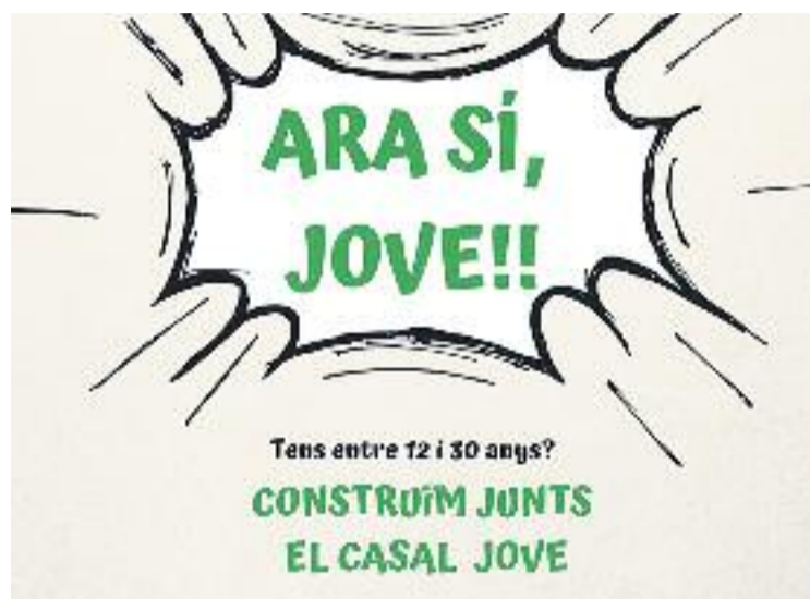
El consistori va organitzar una trobada amb els joves.

Els usuaris i usuàries compartiran l'espai de manera temporal amb el Casal d'Avis