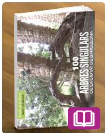
100 arbres singulars de Barcelona Ricard Llerins Bonet

Una petita enciclopèdia dels arbres més curiosos de Barcelona. Més de 700 imatges a color i plenes de detalls de la fauna vegetal que es pot trobar als cementiris, parcs i jardins de la ciutat i fins i tot a Collserola i al zoològic. El llibre inclou, a més, un diccionari de botànica, rutes, models de plaques, els 146 arbres d'interès local i molt més.