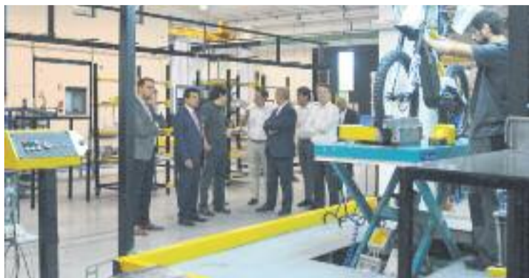
La fàbrica de la firma és a Montmeló.

La mesura afecta un total de 37 treballadors de la fàbrica de Montmeló