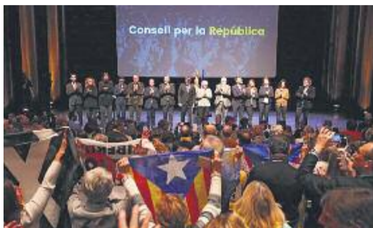
Un moment de l'acte que es va fer a Brussel·les.