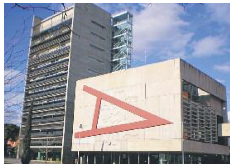
L'Ajuntament respon així a les declaracions del PDeCAT.

ment d'impostos, taxes i preus públics per part del veïnat i d'empreses locals. Amb aquestes dades, el partit volia posar en dubte "l'argument que utilitza el govern de Mollet per justificar l'endeutament municipal assenyalant altres administracions com la Generalitat". En aquest sentit, des de l'Ajuntament van aclarir que "no entrarem en les elucubracions que es facin per intentar que els números diguin el que es voldria".