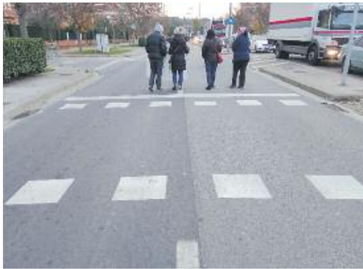
Un dels passos de vianants on s'ubiquen els semàfors.

“Fa temps que esperem aquest pas, ja que la Generalitat es va comprometre a activar-los a principis de setembre, però per fi ho hem aconseguit i estem molt contents”. Així valora la portaveu d'Integració Ronda Sud, Cati Manso, a Línia Vallès l'activació dels semàfors, tot i que assegura que les reivindicacions de la plataforma seguiran actives. “Continuarem sortint al carrer perquè el tràfic no s'ha reduït i