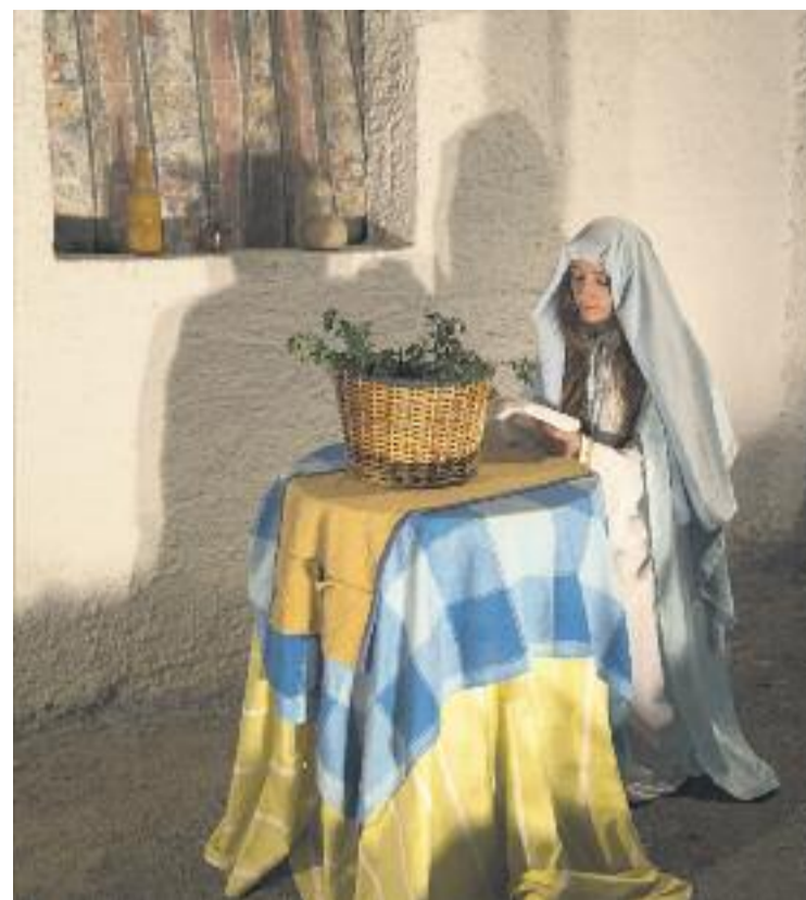
Dues escenes que formen part del pessebre vivent de Sant Fost.