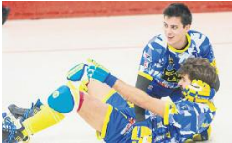
L'última victòria arlequinada va ser a finals de novembre.

I és que el conjunt d'Eduard Candami, que viu la pitjor ratxa de resultats del curs (una derrota i un empat, contra el Reus i el Vic, en les darreres dues jornades) voldrà treure's aquestes espines contra els madrilenys, que malgrat ser un dels conjunts nous a la lliga, han demostrat una bona adaptació a la màxima categoria de l'hoquei patins estatal i ja ha guanyat quatre partits (tot i que el seu rendiment com a visitant no és tan alt com en els partits que juga a casa).