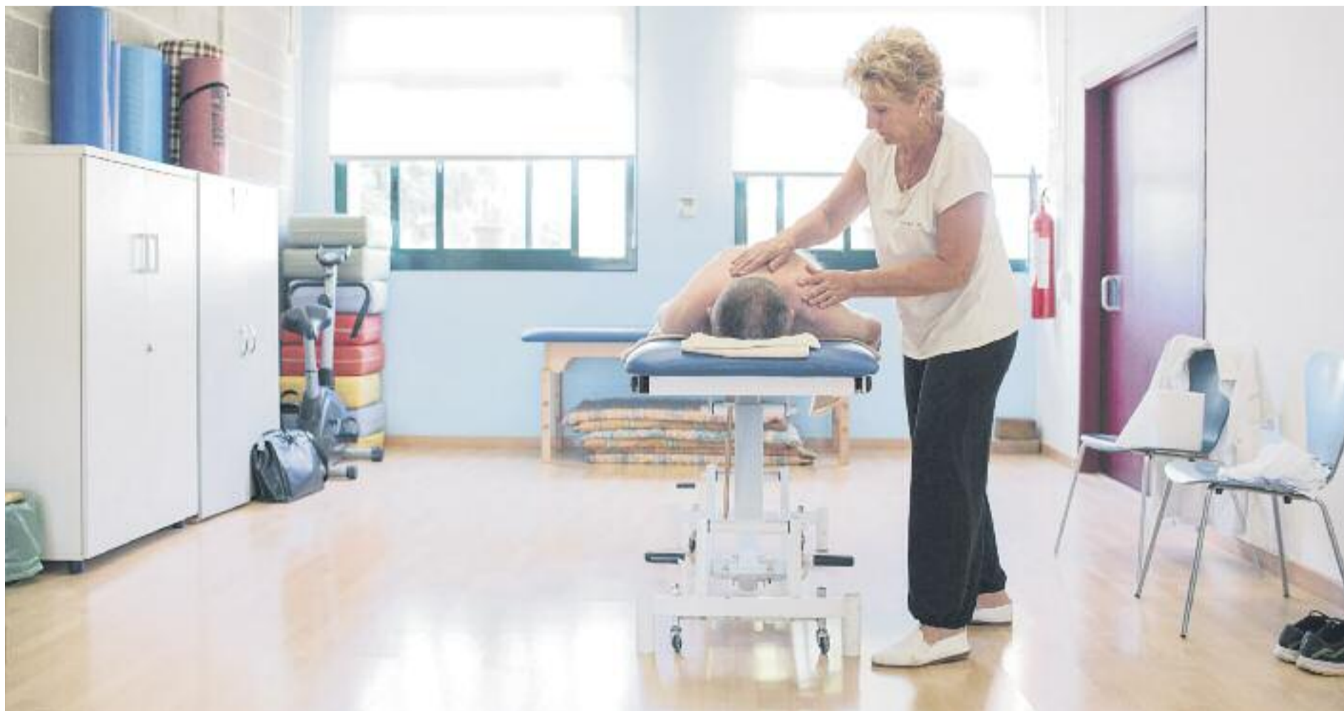
Dia rere dia, 500.000 persones ja fan voluntariat i transformen la vida de moltes altres persones.

► Catalunya està estretament lligada al voluntariat i cada cop són més les persones que s'hi dediquen, incorporant-se a un extens teixit associatiu en constant creixement: el 44% de les actuals entitats van ser creades el segle XXI, aspecte que demostra el dinamisme del sector. A més, segons un informe recent promogut per la Generalitat de Catalunya, el 51% de les entitats tenen programes de voluntariat, dada que planteja la necessitat de cercar vies de suport a les entitats per fer possible que cada vegada més gent faci el pas de connectar-se al voluntariat.