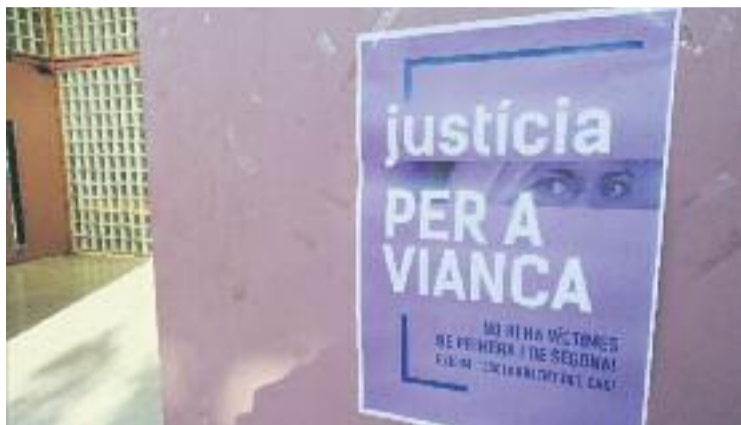
L'enterrament es va fer la setmana passada a la ciutat.