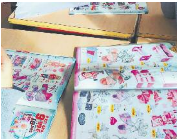
La campanya es durà a terme a les escoles.

Des de l'Ajuntament també han afegit que les joguines s'entenen com a eina facilitadora del procés de socialització afavorint el desenvolupament afectiu, motor i intel·lectual de l'infant i, per aquest motiu, recorden als pares i mares que, quan els in-