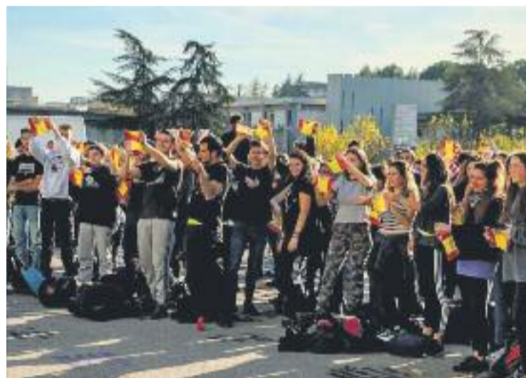
Una imatge de la concentració.

A més de donar veu a les seves insígnies, els assistents es van posar d'acord durant la concentració per estripar i cremar banderes espanyoles amb l'objectiu de mostrar la seva solidaritat amb els alumnes universitaris que afronten una condemna per fer aquest mateix gest.