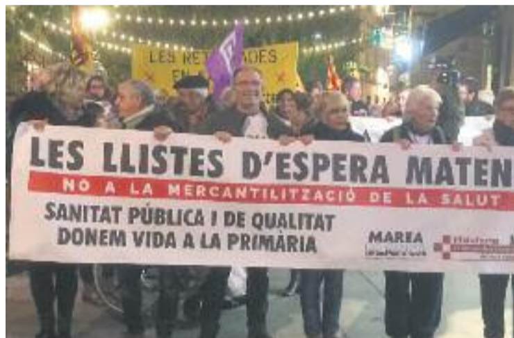
La protesta es va fer aquest dilluns.