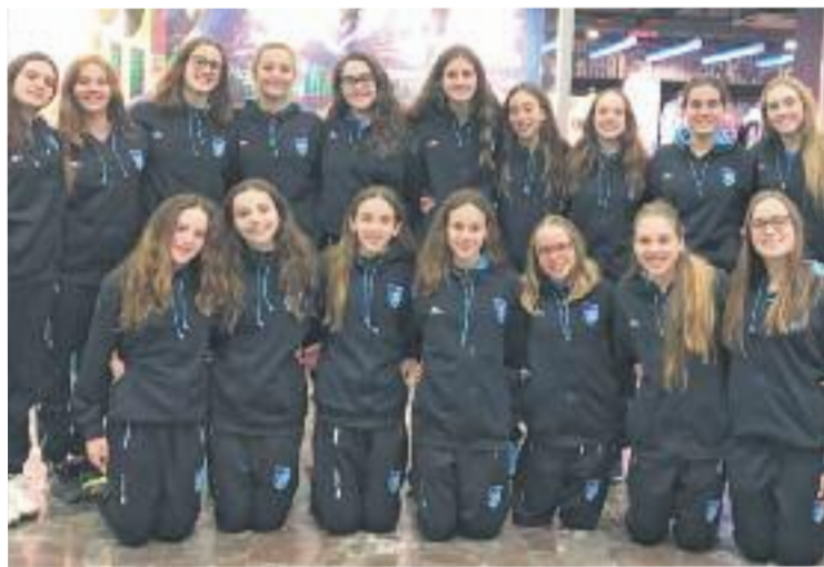
La delegació del Granollers que va triomfar a Madrid.