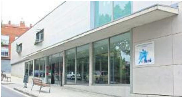
Les millores es faran efectives a principis de març.

De moment, l'Ajuntament va publicar dilluns un concurs públic per trobar l'empresa que s'encarregarà durant dos anys del manteniment d'aquestes màquines. La data prevista per a estrenar la sala de fitness amb la maquinària renovada és a principis del mes de març.