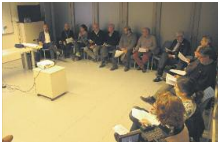
Els membres del Consell de Ciutat es van reunir dilluns.

Per aquest motiu, es va apuntar a Gallecs com a punt de referència per generar noves oportunitats laborals relacionades amb la identitat d'aquest espai