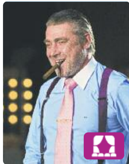
Àngels a Amèrica Tony Kushner