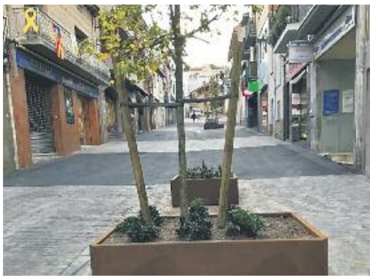
Una imatge recent del Carrer Major de Parets.

Les obres, que s'han fet als carrers Major, Travessera i Barcelona, han convertit en zona de vianants el Barri Antic i, també, han introduït un nou sistema de recollida de la brossa. De fet, durant l'acte d'inauguració de diumenge es podrà veure una de les plataformes mòbils de recollida de residus que s'instal·laran de manera definitiva als carrers del centre històric de la vila.