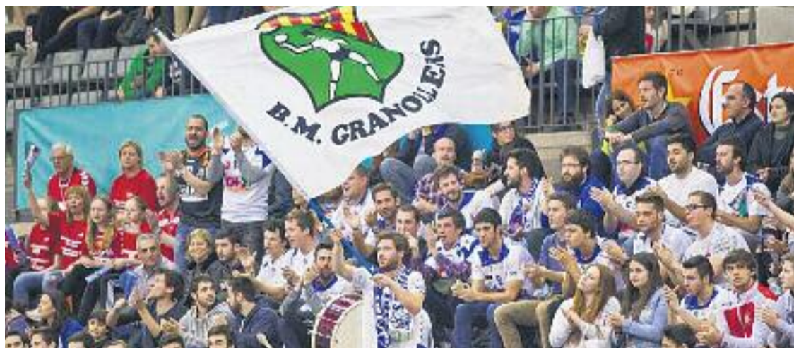
El Palau d'Esports tornarà a vestir-se de gala per a la competició continental.

» La setmana gran comença bé: els de Rama derroten el Cuenca » El primer equip femení rep el penúltim, l'Alcobendas, aquesta nit