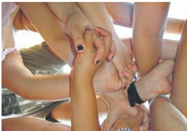
Els més joves tindran veu i vot en el procés de canvi.

LES FRANQUESES ▶ L'Ajuntament vol renovar el Pla Local d'Infància i Joventut. I és que l'actual, que data de fa sis anys, necessita evolucionar per "recollir els canvis que la societat, els joves i els infants han incorporat en els darrers anys". Per això, l'equip de govern local ha fet una crida als joves i infants del poble (és a