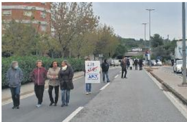
Imatge d'un dels últims talls de la Ronda Sud.