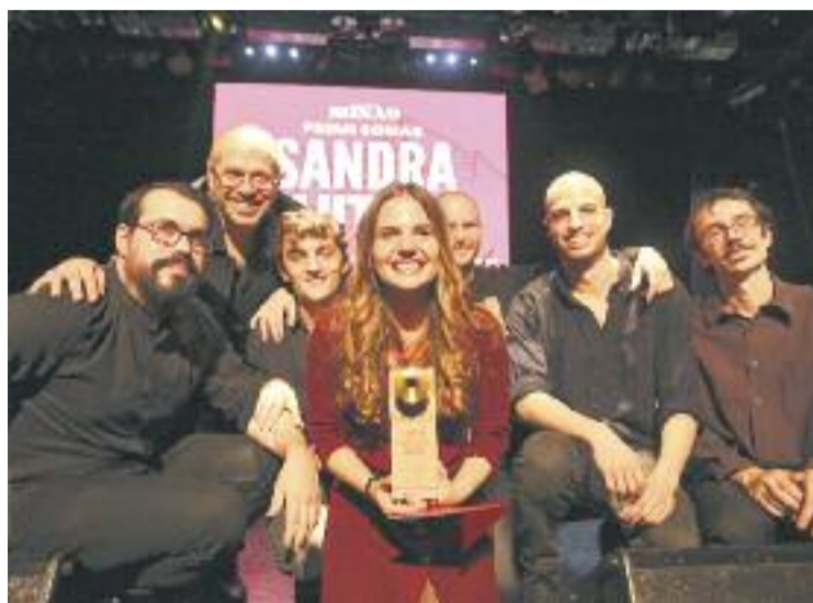
Un moment durant l'entrega de premis a la sala Luz de Gas.

El guardó suposa l'enregistrament i edició d'un disc amb un productor professional i una minigira de cinc concerts en