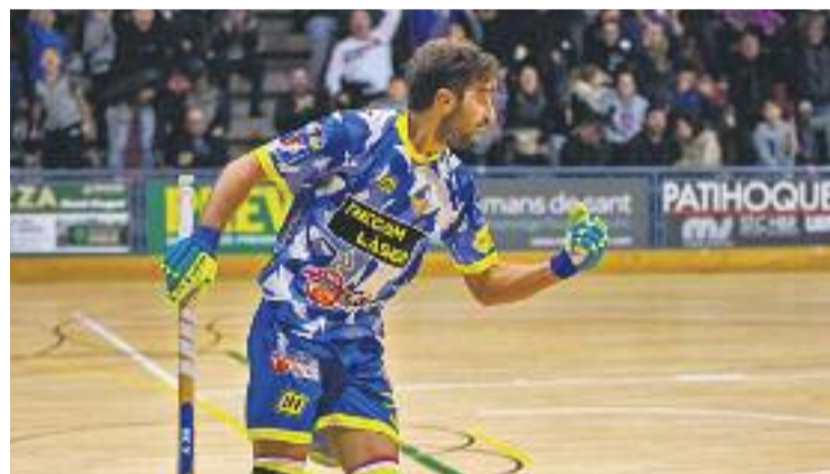
L'equip ha fet una crida perquè la Torre Roja s'ompli.

La recuperació, però, no podrà ser gaire llarga, ja que només 72 hores després d'aquest test duríssim, els arlequinats hauran d'enfrontar-se contra un dels equips més en forma de l'OK Lliga, el Lleida Llista Blava. Després de l'empat del Caldes a Sant Cugat (3-3) i del Barça a la pista del Noia (2-2) la setmana passada, la distància entre els dos equips segueix sent de tres punts, però ara el Liceo i els del Segrià també acumulen la xifra de 19 punts.