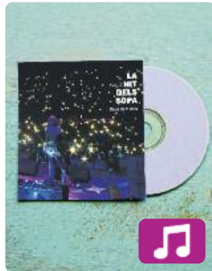
La nit dels Sopa Sopa de Cabra

La nit dels Sopa (RGB Suports, 2018), pensat per als seguidors més fidels del grup, conté les cançons que va tocar en directe ara fa un any al festival del mateix nom organitzat per la banda. Alguns dels seus temes més celebrats, com L'Empordà , no falten a l'àlbum, com tampoc algunes peces del darrer disc, com ara Cercles o Sense treva .