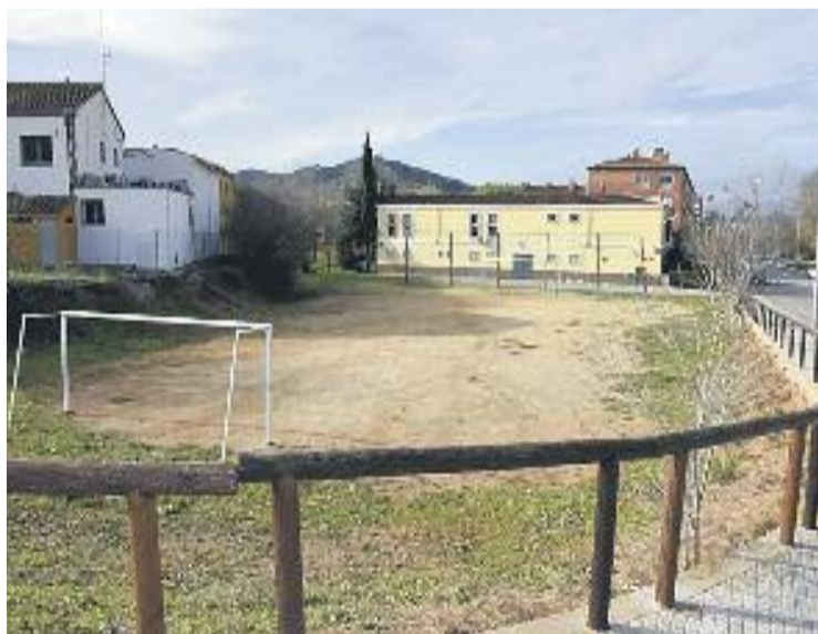
El nou equipament s'ubicarà al barri de la Bòbila.

En aquest sentit, cal destacar que el projecte vol satisfer les necessitats dels joves del poble de totes les edats. Amb aquest objectiu, es diferenciaran dos espais: un adreçat als adolescents