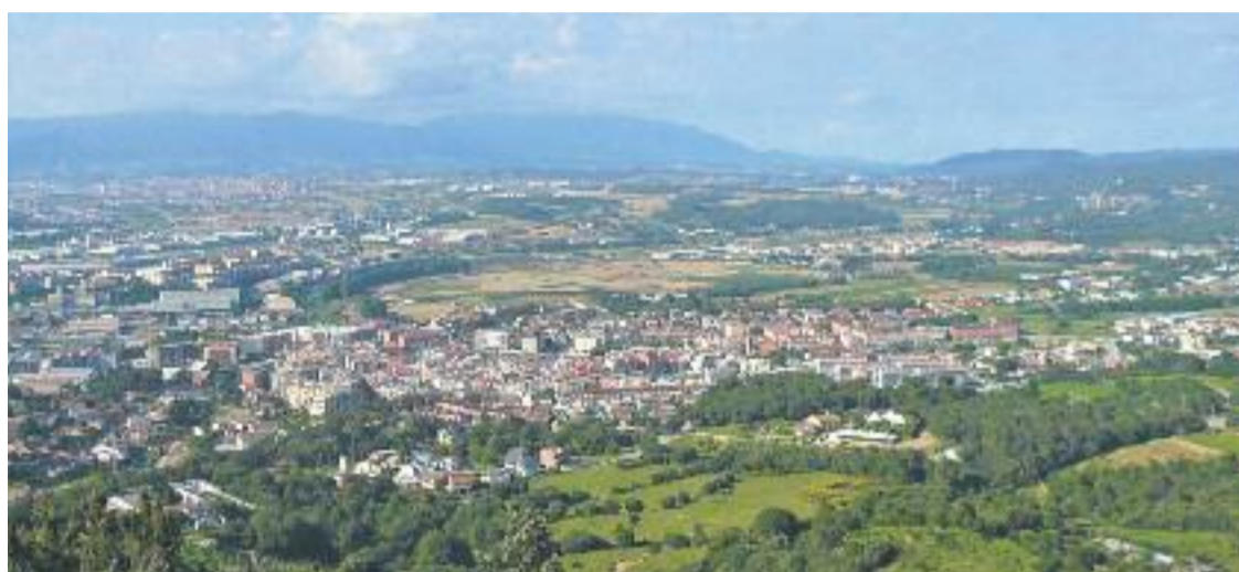
Sembla que la comarca deia enrere la crisi econòmica, però els sindicats ho qüestionen.

Algunes de les dades més rellevants que s'extreuen de l'informe són que la xifra mitjana de vendes per empresa a la comarca, amb valors que ronden els dos milions d'euros, és clarament superior a la del conjunt de Catalunya. D'altra banda, PIMEC puntualitza que les empreses vallesanes generen internament menys valor afegit en relació amb el conjunt català.