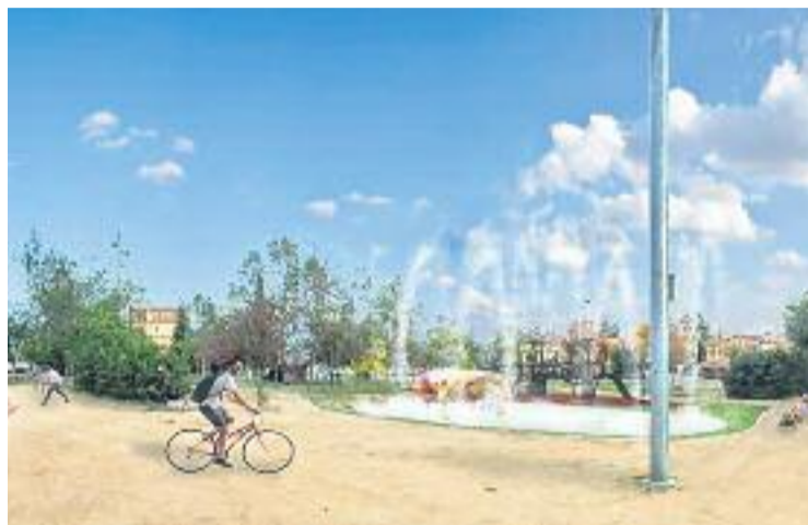
Una recreació virtual del futur aspecte de l'equipament.

L'AMETLLA ▶ La posada en marxa de les obres és imminent. A finals de la setmana passada, l'Ajuntament va anunciar que el mes que ve es faran remodelacions al parc de Maria Lluïsa. Després de fer un anàlisi, el consistori creu que cal incrementar la visibilitat i l'ús del parc per part dels veïns, millorar el seu estat de conservació i implementar millores eficients que redueixin el seu cost de manteniment i, per últim, donar resposta a les ne-