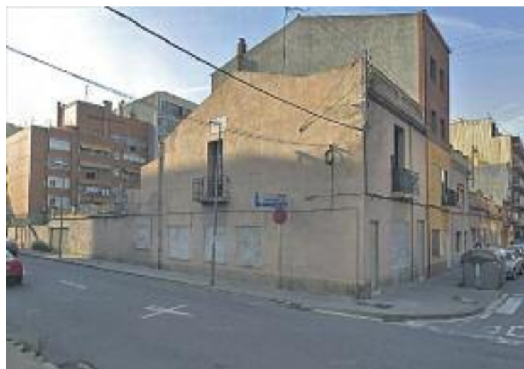
L'espai s'ubica al barri de Sant Miquel.

L'empresa Requena serà l'encarregada d'executar les obres que compten amb un pressupost que supera els 88.000 euros. El termini previst per veure acabada la nova plaça ronda les 12 setmanes d'intervenció. D'aquesta manera, el nou espai públic estarà enllestit al gener.