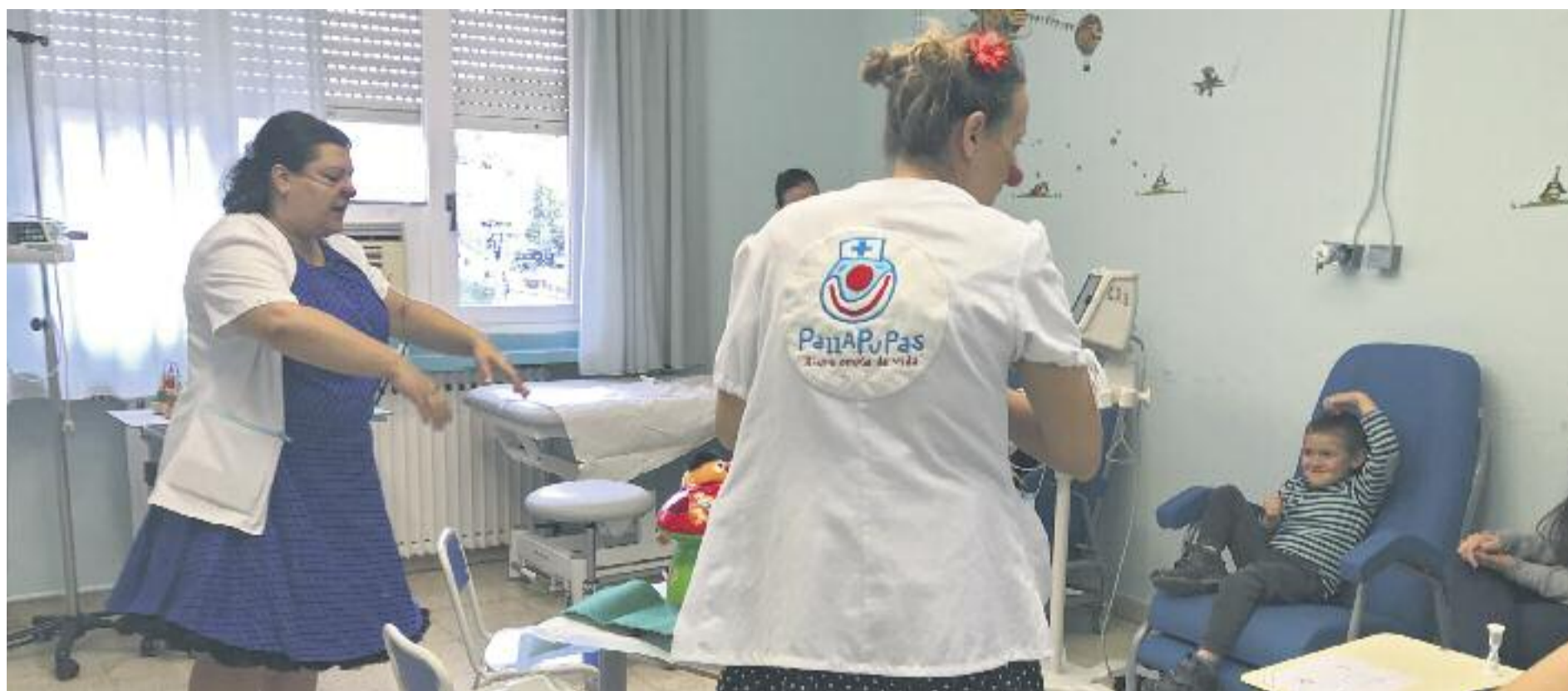
Les 'clowns' Oxigena i Botiquina durant una de les seves visites a l'Hospital de Granollers.