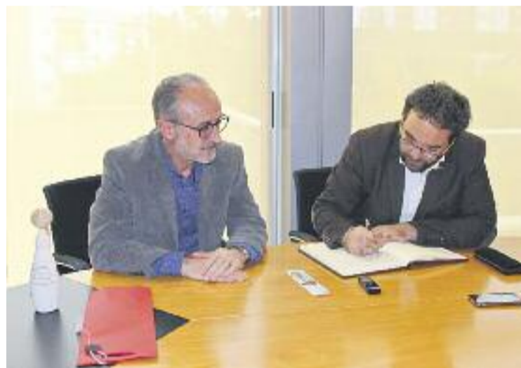
La reunió es va fer dimarts a l'Ajuntament.