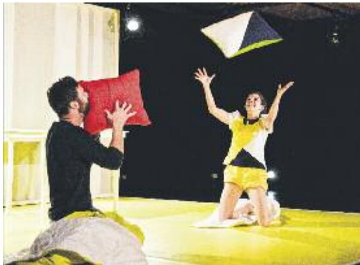
La companyia belga Théâtre de la Guimbarde actuarà diumenge.

El festival continuarà diumenge amb el taller Movent el cos... obrint el cos! que es farà al Roca