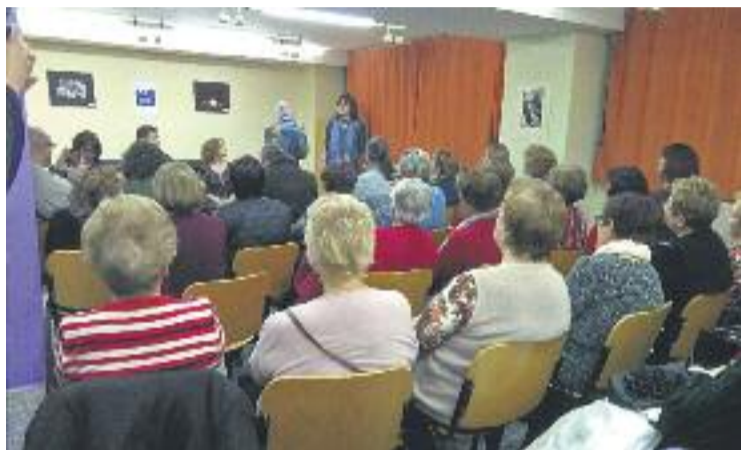
Una imatge d'arxiu d'una activitat celebrada al Centre de Dones.

A més d'aquest tipus de situacions, el Centre per a Dones també ajuda les usuàries a abordar altres temes com la salut, l'acompanyament en moments de