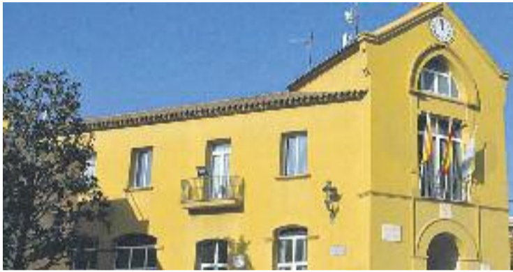
L'Ajuntament impulsarà dos processos participatius.

L'objectiu d'aquesta iniciativa és fer millores en aquestes dues zones de Montmeló per afavorir que els veïns i veïnes hi facin més vida més enllà de les dades especials com la Festa Major o la Festa de l'Aigua.