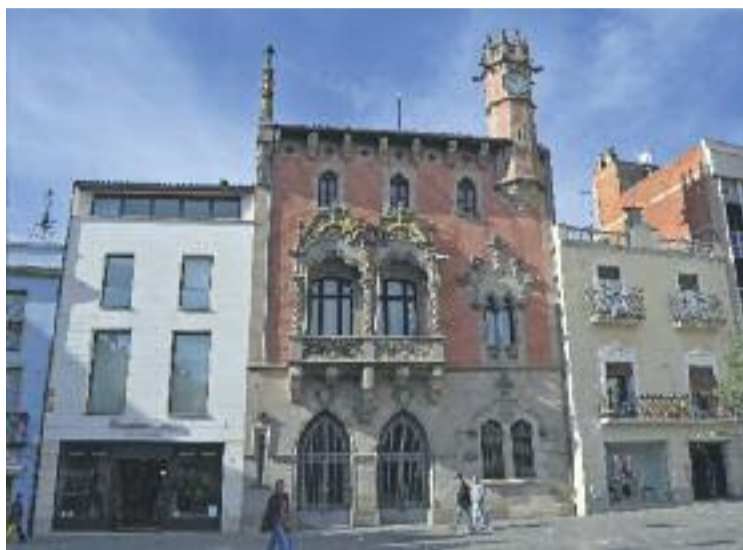
L'Ajuntament preveu reduir el deute en tres milions aquest any.

Segons les dades del Ministeri d'Hisenda, l'Ajuntament de Granollers va arribar al seu record d'endeutament l'any 2013, quan va acumular un deute viu