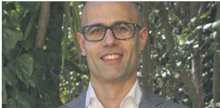
Seguer va ser acomiadat com a director de Vallès Visió l'any 2013.

any després que el Jutjat Social número 2 de Granollers donés la raó al Consorci i desestimés la demanda d'improcedència i nul·litat de l'acomiadament interposada pel periodista.