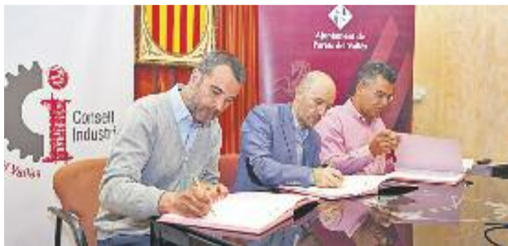
Signatura del conveni entre l'Ajuntament i el Circuit.

Així mateix, a part de la millora de l'ocupabilitat i el desenvolupament territorial, l'acord preveu potenciar l'apropament dels serveis i recursos que ofereix el Circuit a les empreses del municipi, i incorporar com a canal de