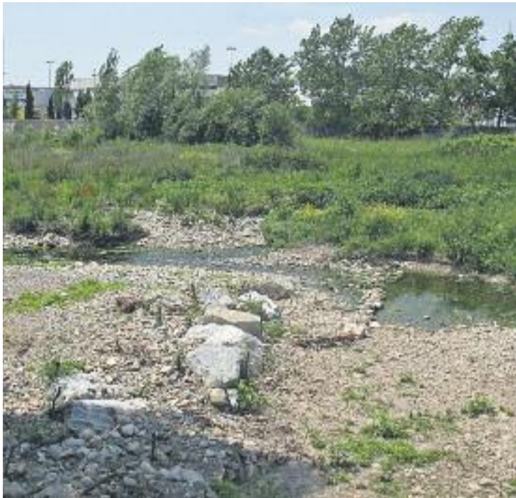
Mur de roques al riu Congost.