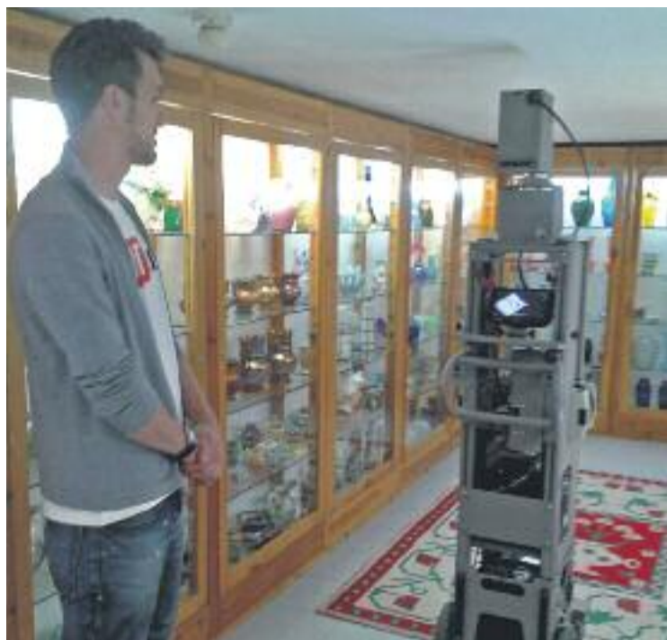
La càmera de Google enregistrant el Museu Abelló.