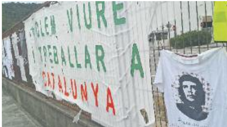
Els treballadors van fer una vaga de mes de tres mesos.

ciava que havia rebut una proposta de Síntex per invertir a la planta de Martorelles, que garantia la continuïtat de la factoria perquè suposava la implantació de la seva filial de fabricació de components d'automoció a Espanya, i permetia la contractació de 100 treballadors dels 250 actuals. La setmana passada, però, Síntex confirmava a la comissió de seguiment sobre la reindustrialització que ha-