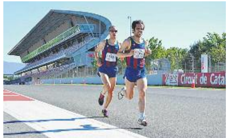
Els atletes substituiran els cotxes i les motos.

Les inscripcions es podran formalitzar fins demà al lloc web de l'AE Mitja Marató de Terrassa o al portal '1, 2, 3 a correr' del Banc de Santander.