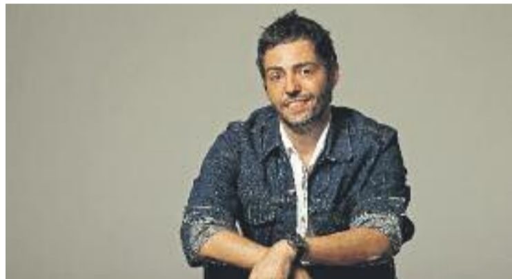
David Guapo actuarà demà al Teatre Auditori de Granollers.

David Guapo va saltar a la fama de la mà de Berto Romero per començar en el món dels monòlegs en programes d'abast nacional, com El Club de la Comedia . Fa tres anys que apareix a la televisió, però la veritat és que ja ha complert deu anys d'ofici i d'actuacions en directe.