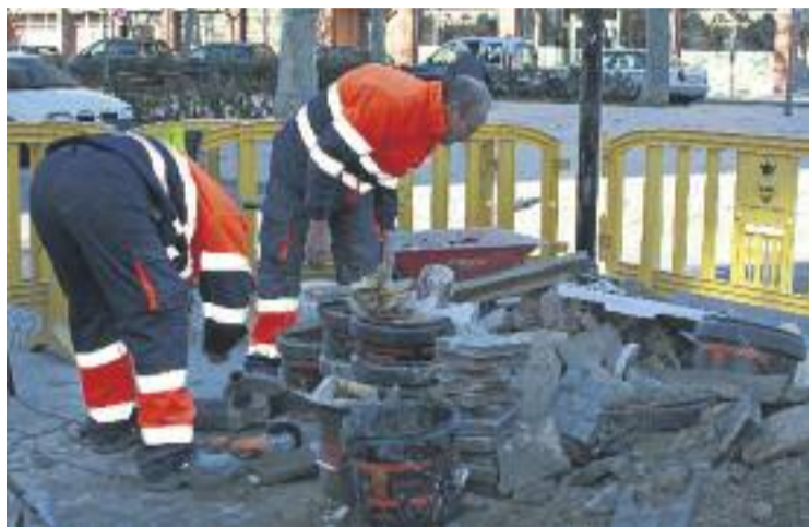
Operaris d'un dels Plans d'Ocupació de l'any passat.

Amb els plans d'ocupació es pretén pal·liar la situació de les persones que es troben en una situació socioeconòmica més desfavorida amb contractes tem-