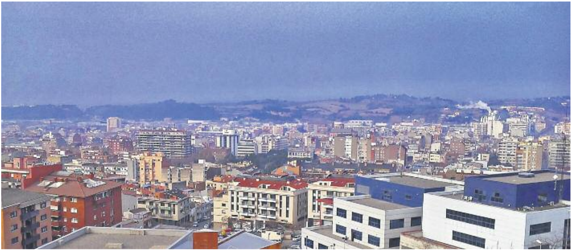
Una imatge de la contaminació atmosfèrica de Granollers.