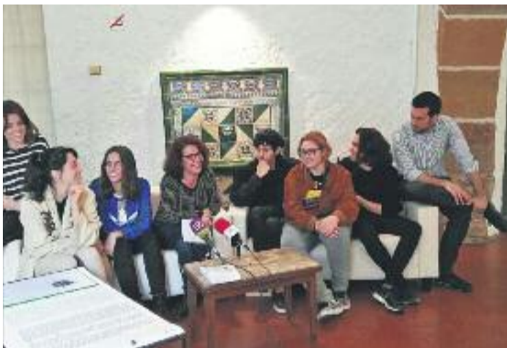
Alguns dels participants en la Mostra Audiovisual.