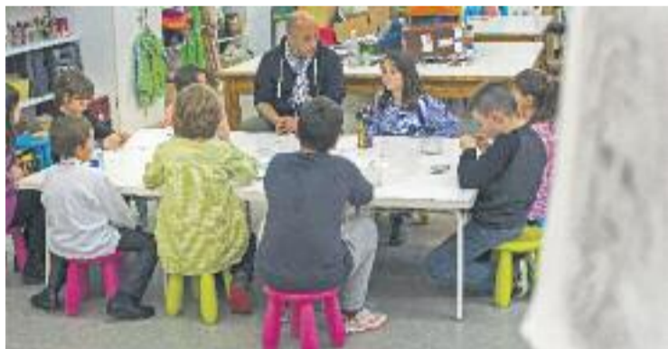
Un dels tallers de l'Espai de les Arts.

La Setmana Artística començarà dilluns 23 de maig amb el taller d'art infantil Prehistòria i pintura rupestre , a càrrec de Ciència Divertida. Dimarts 24 de maig es faran les activitats Pintura a l'oli i el modernisme i dimecres 25 es portarà a terme el taller l'Art Pop . Totes les activitats infantils començaran a dos quarts de cinc de la tarda. Segons els membres de Ciència Divertida, "aquests tallers estimulen la imaginació i l'esperit dels